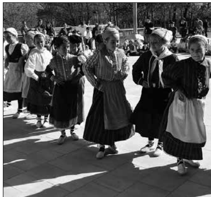
Herri bazkarirako txartelak Txiribogan eta Artzabalen eskura daitezke.

Bazkalosterako, tranpaldio irekia antolatu dute. "Aurrez etxean koreografia bat presatu eta gainerakoei emanaldia eskaini nahi diotenei horretarako aukera izango