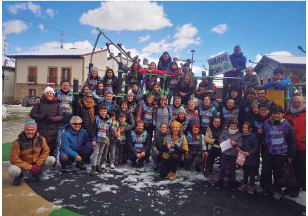
“Espartzatik Galarrera ere egin dugu Korrika”. Usurbildik joan ziren aurreko astebukaeran.