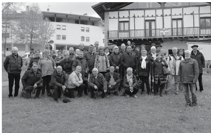
San Xosepe jubilatuta eta pentsiodunen elkarteko 150 bat lagun etorri ziren gure artera pasa den astean.

Egoera honen aurrean, “pertsona guztiek funtsezko ondasun bat, elektrizitatea, eskura izango dutela bermatzeko neurri zehatzak eta premiazoak eskatzen ditugu; gizarte-larrialdiko kontua da, eta erakunde publikoek muturreko neurriak hartu behar dituzte”. Erakundeek “egiten dutena baino askoz gehiago egin dezakete prezioen hazkunde neurrigabea bultzatzen duen espekulazio finantzarioa eteteko”. Besteak beste, funtsezko zerbitzua den heinean, “kontrol publikoaren pean egon behar du, eta ez oligopolio elektrikoaren zerbitzura”.