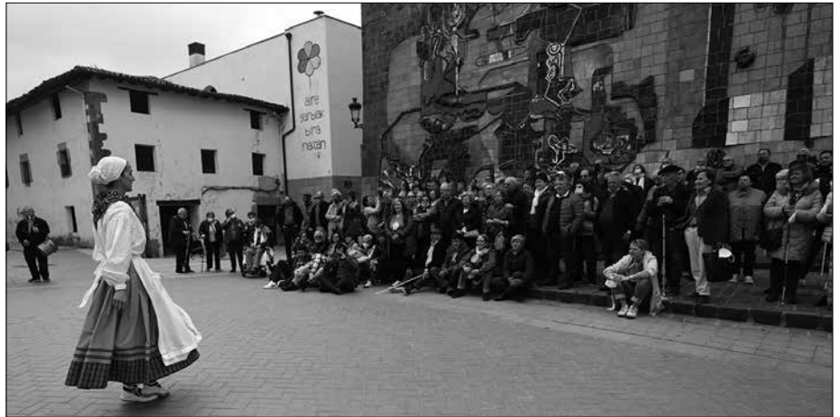
Langile eta boluntarioak Usurbilen izan ziren martxoaren 29an, “180 bat lagun guztira”.

Pozarren ziren, bi urteotako osasun krisialdiaren ostean helduak ere berriz biltzen hasi direla ikusita. “Urte honetan normaltasunari martxa hartu nahian gabiltza”. Pandemiak eta ezohiko garai hau kudeatzeko moduak esan beharrik ez da zer nolako eragina izan duen adinekoen kolektiboan eta tartean, ikusmen desgaitasuna zutenen artean. “Jendea beldurtu