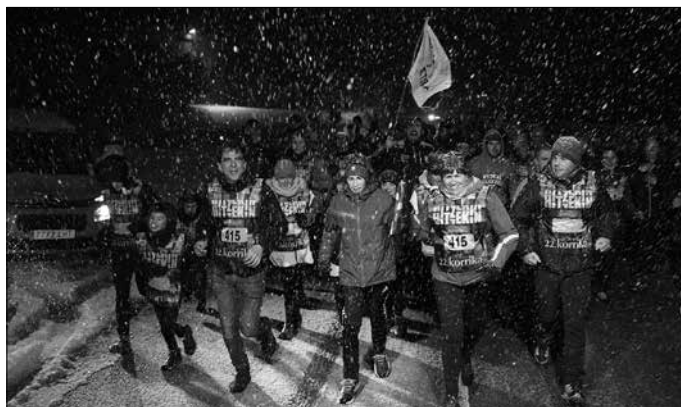
“Korrikaren euforiara batu dira tipi-tapa tarratapatanaren erritmora zeuden guztiak”.

Ainara ere ingurura begira hasi da lagunari barrea nork