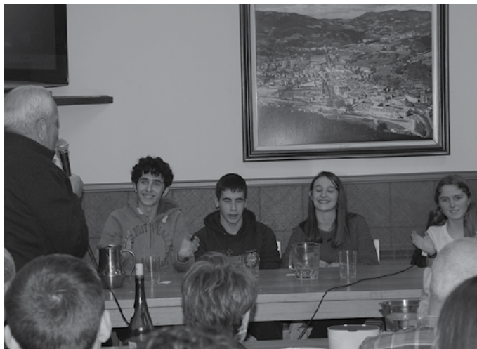
“Saio bizia eta polita burutu zuten baina urduritasuna presente egon zen”.

Saio bizia eta polita burutu zuten baina urduritasuna presente egon zen. Lepo zegoen