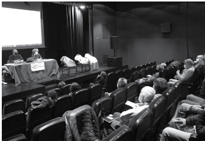
Erakundeek “egiten dutena baino askoz gehiago egin dezakete prezioen hazkunde neurrigabea bultzatzen duen espekulazio finantzarioa eteteko”.

San Xosepe izeneko jubilatuta eta pentsiodunen elkartetik, 150 bat lagun bisitan izan genituen martxoaren 30ean Usurbilen. Herrian barrena osteratxo egin zuten, Gure Pakea Usurbilgo jubilatuen elkarteko kideak gidari zituztela. Artzabal atarian atera genien ondoko talde argazkia. Gero Aginaga sagardotegira bazkaltzera joatekoak ziren.