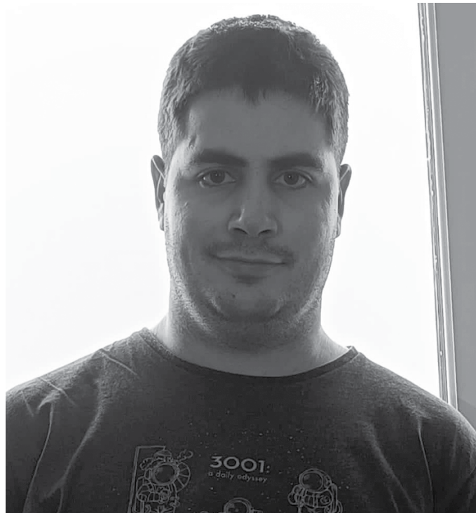
Suedian ari da ikasten, Skövde hirian. “Azken momentuan Erasmusean baiezkoa eman zidatenez, oso denbora gutxi izan nuen dena antolatzeko”.

Hasieratik erabakita neukan iparraldeko herrialderen batera joan nahi nuela, zela Finlandiara, zela Suediara edo zela Norvegiara. Elurra eta hotza nahiago ditut beroa baino. Lehen aukera horiek egin nituen, eta kasualitatez, libre geratu ziren plaza batzuk eta zortea