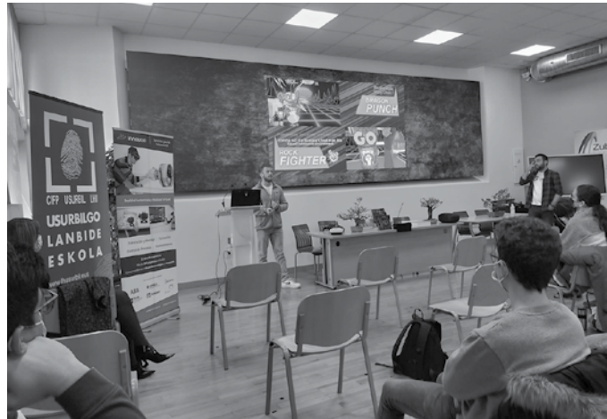
Lanbide Heziketa D ereduan egiteak ordu arte ikasitako euskara sendotzeko eta hobetzeko aukera eskaintzen du.

Horretaz gain, ikasketak D ereduan eginez gero, euska-