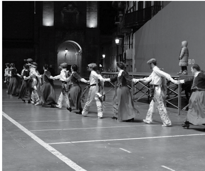
12:00etan hasiko da Orbeldik antolatu duen X. Dantza Eguna, Mikel Laboa plazatik abiatuko den kalejira batekin.