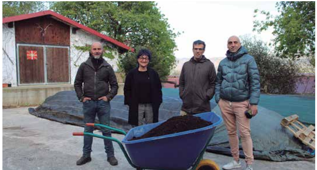
Parte hartzeko prest leudekeen baserri gehiagotara hedatu nahi lukete egitasmo hau.

Usurbilek urtero biltzen dituen 700-800 tona biohon-