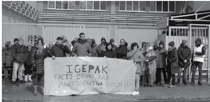
Apirilaren 1ean Zumartegi industriagunerako sarbidean izan ziren protestan.

Langileak bildu eta greba egitea erabaki zuten apirilaren lehenean. Goizeko 5:30az geroztik, egun osoz lantegi atarian mobilizatu ziren. Zumartegi industriagunerako sarbidean