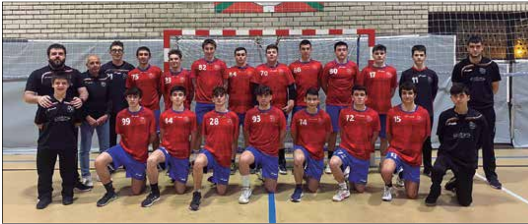
Usurbil KE taldeko jubenil mutilen taldea denboraldi ederra osatzen ari da.

NOAUA! Espainiako txapelketan lortutako emaitzak datorren denboraldian eragingo du ala maila berean jarraituko al dute?