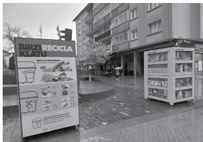
2020an %52ko gaikako bilketa zuen San Markotik ekarri dute erakusketa ibiltaria, iaz %87,27ko gaikako bilketa zuen udalerrri honetara.

Mikel Laboa plazan edota Oiar-do Kiroldegi atarian “totem informatzaileak” ikusiko zenituzten egunotan. Urte amaieratik, San Marko Mankomunitateak, Ecoembesek eta Ecovidriok abian duten kanpainari lotutakoak dira. Apirilaren 12ra arte mankomunitatea osatzen duten 10 udalerritan ikusgai jarriko dituzte. “Helburu nagusia, herritarrak plastikozko, metalezko eta brik motako ontziak bereiztearen garrantziaz kontzientziatzea da, baita papezko, kartoizko, beirazko ontziak eta hondakin organikoak bereiztearen garrantziaz ere, bakoitza bere banaketa-lerroetan utziz: horia, urdina, berdea