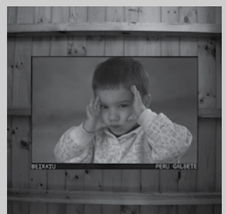
Abestiak perugalbete.bancamp.com atarian daude entzungai.

eman ohi diogu –hondatu ez dadin agian– diskoaren azaleko egurrek dutenaren antzekoa. Txikitan, lokartu aurretik sabaira begiratzen nuenean, begi pila bat ikusten nituen egur haietan niri begira. Eta gaur egun ere, ikusten jarraitzen ditut”. Abesti sorta berria, perugalbete.bancamp.com atarian duzue entzungai.