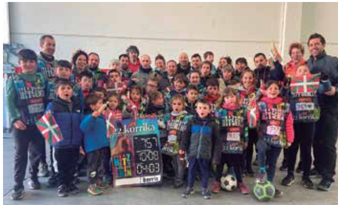
Txirristrako terrazan kafe bat hartzen bururatu zitzaizen ideia.

Bai. Kalean nongoak ginen galdezka etortzen zitzaizkigun. Asko ez ziren jabetzen Korrika pasatzekoa zenik. Azaldu genien. Ekimen hauei esker, euskararen aldeko konpromi-