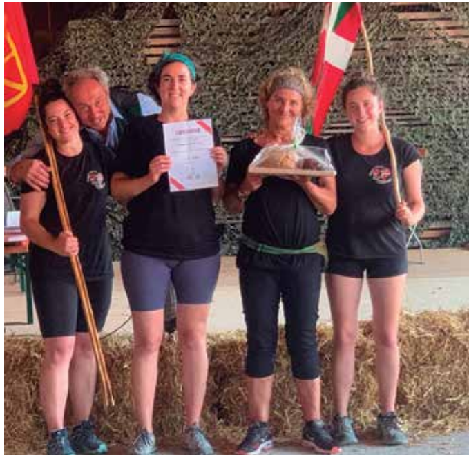
Almitza sega elkartearen helburua "segalaritza mantentzea da".

Sega elkarteak da eta bere helburua segalaritza mantentzea