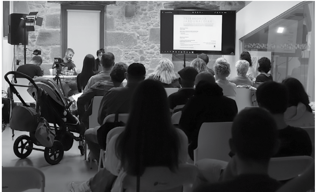
Matia Fundazioaren Matiazaleak esperientzia, Hernaniko udal egitasmoa eta Usurbilgo Txirikorda hizpide izan zituzten iraila amaieran Potxoenean.

Matia Fundazioak Matiazaleak esperientziak ekarri zituen mahai gainera. Geroz eta helduagoa den gizartean, familiak ere geroz eta txikiagoak dira, eta ondorioz, belaunaldi arteko arrakala geroz eta handiagoa da. “Duela 20 urte, ez dago atzerago joan beharrik, familiak handiagoak ziren orain baino. 80 urte atzera egiten badugu zer esanik ez. Gure aitona-amonei haien umetako familia argazkiak eskatu besterik ez dago horretaz jabetzeko”, esan zuen hizlariak. Ondorioz,