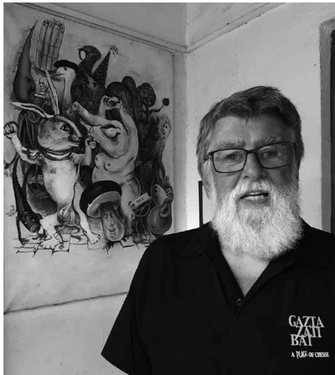
Edorta Agirrek Zumetaren koadro bat du etxeko jantokian. Koadro hori ipini du Amantala ta mantela (Pamiela, 2022) liburuko azalean.

4.000 orrialdeko lana zen hasiera batean. 60 ate jo nituen.