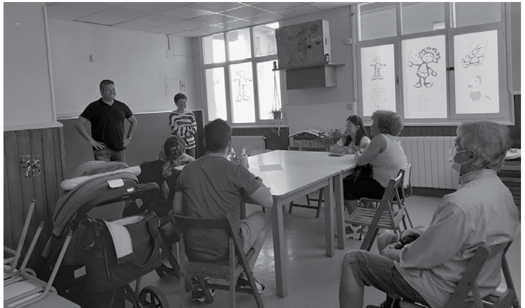
Jubilatuentzako euskara ikastaroa 2020ko udaberrian antolatu zuten lehen aldiz. Iaz, etorri-berriak direnzentzat. Harrera bikaina izan zuten biek. Laster hasiko dira bi ikastaroak.

■ Izen-ematea: urriaren 4tik 14ra, itzultzailea@usurbil.eus