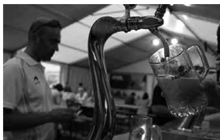
Usurbil Futbol Taldeak eta Usurbil Kirol Elkartek antolatu dute garagardo azoka.

Antolakuntzatik aurreratu dutenez, jantokiaz eta sukaldeaz gain oholta bat ipiniko dute frontoian. Beraz, musika-erentzako tartea ere izango da egun horietan. Garagardo eskaintza zabala izango da eta jatekoa bertan erosi edota etxera eramateko aukera egongo da.