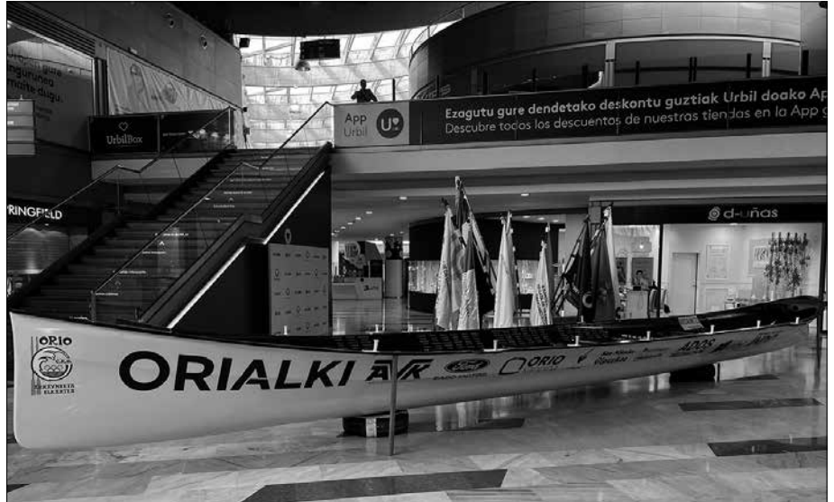
Urbilek Orio arraun taldearen 5 kamiseta zozkatu ditu Instagrameko bere profilean.

Urbilek, Origen-Jatorria proiektuaren baitan, urteak daramatza Orio Arraunketa Elkarteko emakumezkoen taldea eta honen Berdin Berdinak kirol inklusiboko proiektua babesten, eta horregatik, kanpaina berezia prestatu du udazken hasierarako. Egunotan horiz tindatuta egon da merkataritza-gunea. Eta pasa den larunbatean, arraunlari taldea Urbilen izan zen, zaletuen gozamenerako.