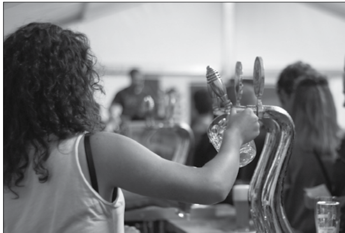
“Zerbitzatzeko, sukaldean lantzeko, muntaketarako... jendea beharko dugu”.

E.E.H.: Klubak herriarentzat dira, herriko jendeak kirola egiteko eta herritik elikatzen dira. Izena ematen duten haurren gurasoek klubeko parte izatera, laguntzeko deialdia egin nahi diegu. Bestalde, Haranen dabilen kirolari kopurua bikoiztu egin da eta futbol zelaia ez dago baldintza-