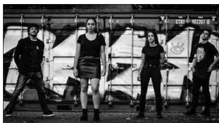
Ostiral honetan, Ameba eta Rodeo zuzenean Eliza Zaharrea.