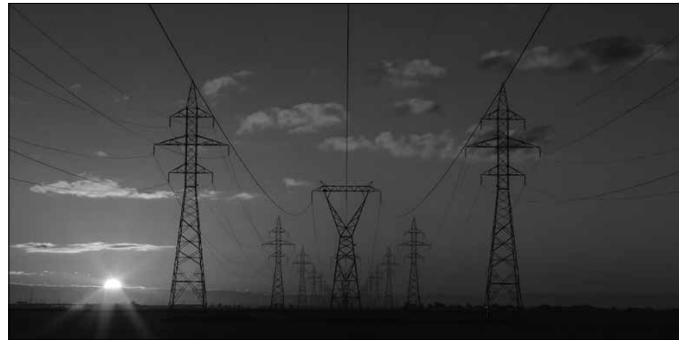
“Lurraren ahalmenera egokitu beharrean gaude. Eta horretarako aukera bakarra dago, deshazkundera”.

Beraz gaurkoan, merkatu elektriko osoa azaltzea gauza makala ez denez, Egune-ko Merkatuaren gorabeherak