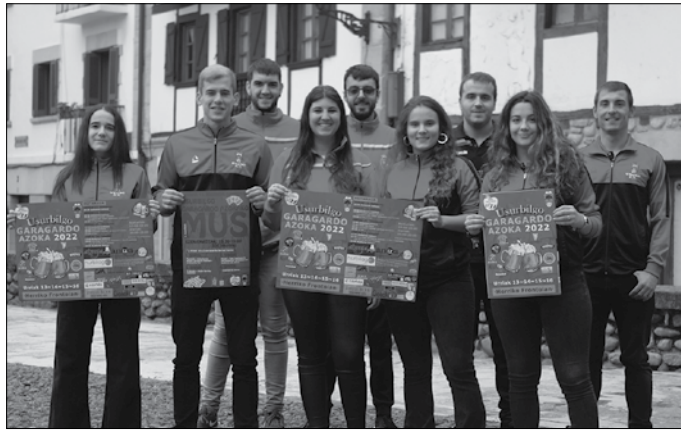
Usurbil FT eta Usurbil KE dira Garagardo Azokaren sustatzaileak.