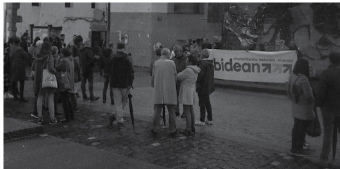
Larunbat honetako manifestazioa goizeko 11:00etan abiatuko da Donostiako Bulebarretik. Handik Illunbera joango dira manifestazioan.

Hitzordu bat ate joka; azken urteotan presoan auziari konponbidea emateko Sarek martxan izan duen “Izan Bidea” dinamika borobiltzeko