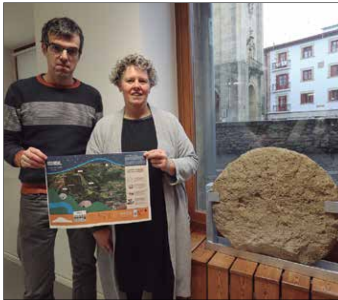
Aurreko astean aurkeztu zuten ‘Errotarren bidea’. Andatzan bertatik bertara dugun ondarea ezagutzeko aukera eskaintzen digu.

Gipuzkoako Mendi Federazioarekin eta Foru Aldundiarekin lankidetzan zabalduko ibilbide zirkularra da errotarriena, aipatu mendia inguratzen duen 8,7 kilometrokoa (549 metroko aldaparekin), hiru ordu eta erdi inguruan osatu daitekeena. Udal teknikariak berri eman zuenez, abiapuntu eta helmuga bera du; Urdaiaga goialdea hain zuzen. Puntu hau seinalezatua du Usurbilgo Udalak. Bidean zehar, hainbat errotarri eta harrobi ikusi ahal-ko ditugu. “Seinaleak hobetzen joango gara pixkanaka”, ohar-tarazi zuen udaleko ingurumen teknikariak. Gaurkoz, ibilbide zehatza ezagutu dezakegu 650usurbilbizi.eus turismo eredu berriari lotutako web-