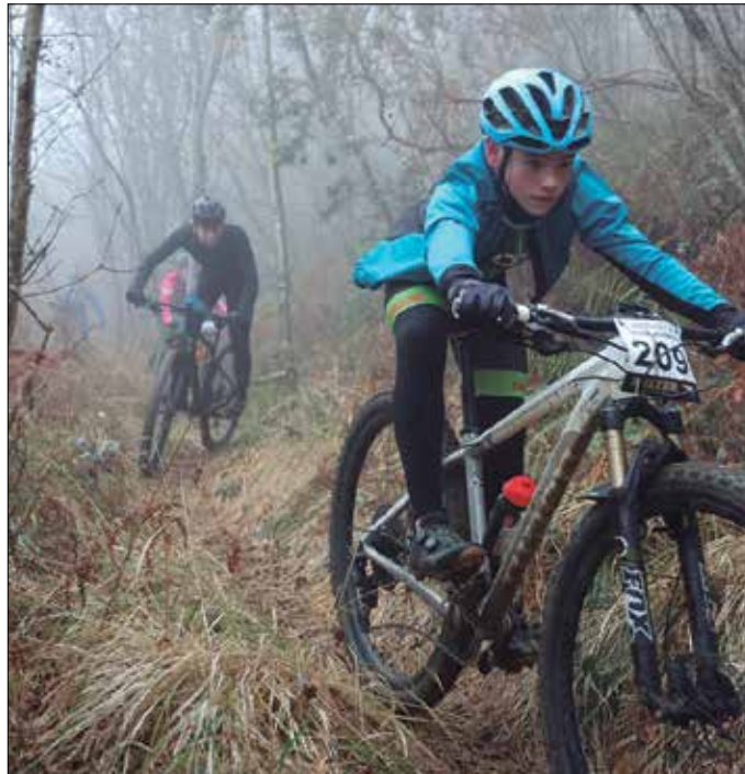
Igandeko lasterketako dortsalak bezperan eskuratu ahal izango dira Sutegin.