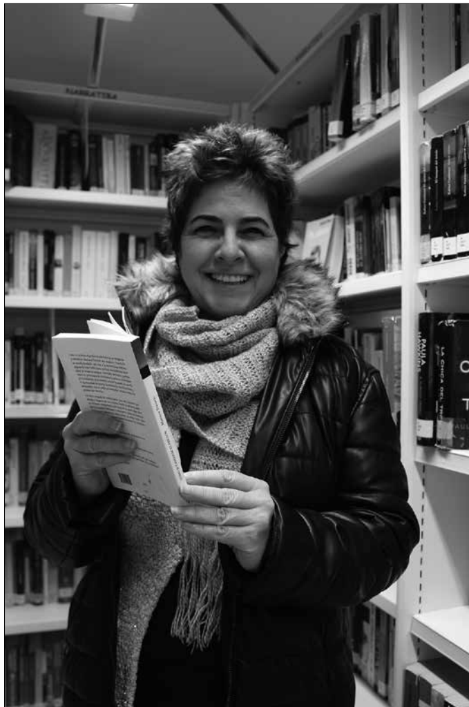
“Batxillergoa ikasi nuen garaian literatura irakasle on bat izan genuen. Eragin handia izan zuen nigan. Liburuekiko lilura garai horretan piztu zitzaidan”.

Aldea hor dago: helduak beren borondatez hurbiltzen dira idazketa tailerretara.