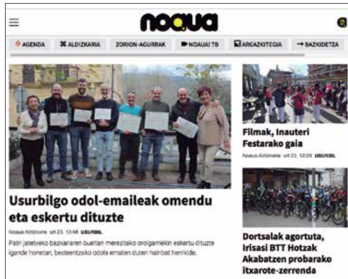
Web orrialdeak aurreko urteetako audientziari eutsi zion 2022. urtean. Halaber, jarraitzaileen kopurua igo egin zen NOAUAlren sare sozial guztietan.

2022: 156.372 bisita. 2021: 163.074 bisita. 2020: 146.250 bisita. 2019: 102.227 bisita.