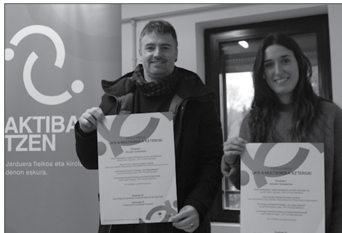
Hitzaldi-solasaldi ugari iragarri dituzte otsailaren 1erako.

Mahai tekniko horretan egi- ten dute besteak beste, Zirima- ra proiektuaren jarraipen eta eraldaketa lana. “Gaur egun, Usurbilen LH 5 eta 6 mail- tako multikirolen ibilbidean urte erdiz futboleko eta beste urte erdiz eskubaloian aritzen