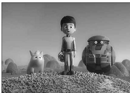
Willy, Buck eta Flashen abentura ikusteko aukera aparta igande honetan Aginagan.

gandik urrun, esploratu gabeko planeta basati batean lur hartuko du. Willyk gurasoak bilatzeko modua aurkitu beharko du orain. Ahalegin horretan, bidelagun izanango ditu Buck biziraupen robota eta Flash estralurtarra.