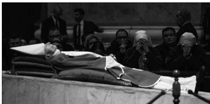
“Goraipatu nahi nuke emeritu bezala Frantziskoren lana ez oztopatzeko izan duen diskrezioa”.