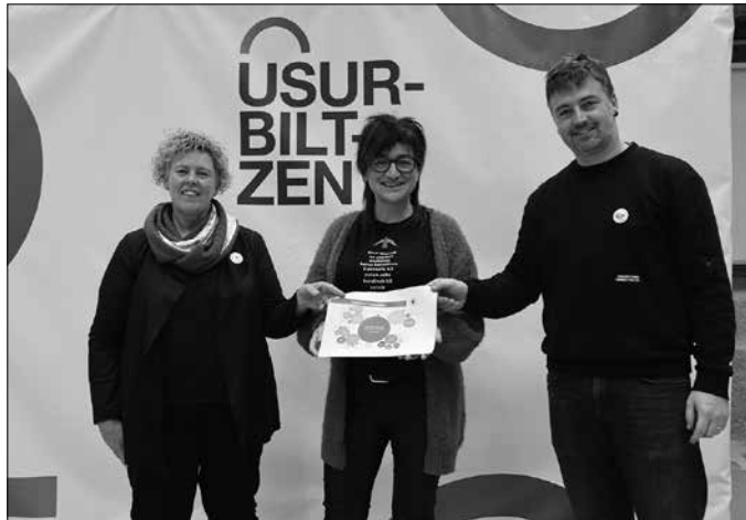
Udal aurrekontuetako gorakada foru funtsetik jasotako finantziazioaren eta enpresa elektrikoek ordaindu beharreko tasaren igoerak eragin du.

13,2 milioi euroko udal aurrekontuak beraz, baina udal gobernu taldetik ohartarazi dutenez halere, “urteak aurrera egin ahal ez dugu baztertzen Udalaren gerakina erabiltzeko aukera, beste inbertsio batzuk bideratu ahal izateko”. Neurri prebentibo gisa gainera, “100.000 euro gorde ditugu, aurrekusi gabeko gastu edo egitasmoei aurre egiteko. Berriz ere, aberastasunaren birbanaketa justuagoa eta zerbitzu publikoen unibertsalizazioa helburu, iaz martxan jarritako hobari sistemari eusten diogu. Era berean, bigarren urtez, gizarte laguntza propioek ere bere lekua izango dute aurrekontuetan, batez ere gure herrira iritsi berri direnei eta