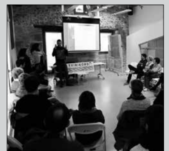
Bilera goizeko 11:00etan hasiko da.

Izen-ematea otsailean zabaltea aurrekusi du Udalak. Argibide gehiago eskainiko dituzte larunbat honetako hitzaldian.