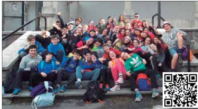
Apirilaren 11tik 13ra Zarauzko Igerain aterpetxera joango dira. Izen-ematea osatzeko, QRa eskaneatu eta galdetegi bat zabalduko zaizu. Bete eta kito.