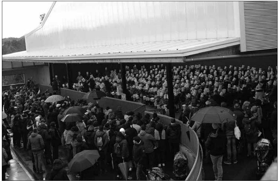
Danborrada emanaldiaren ondoren, ate joka ditugu otsaileko Santa Ageda bezpera eta Inauteri jaia.

Neguko ospakizunak abiatu baino ez dituzte egin ikastetxeetan. Urte amaierako gabonetako kantu saioen eta danborrada emanaldion ostean, ate joka ditugu otsaileko Santa Ageda bezpera eta Inauteriak!