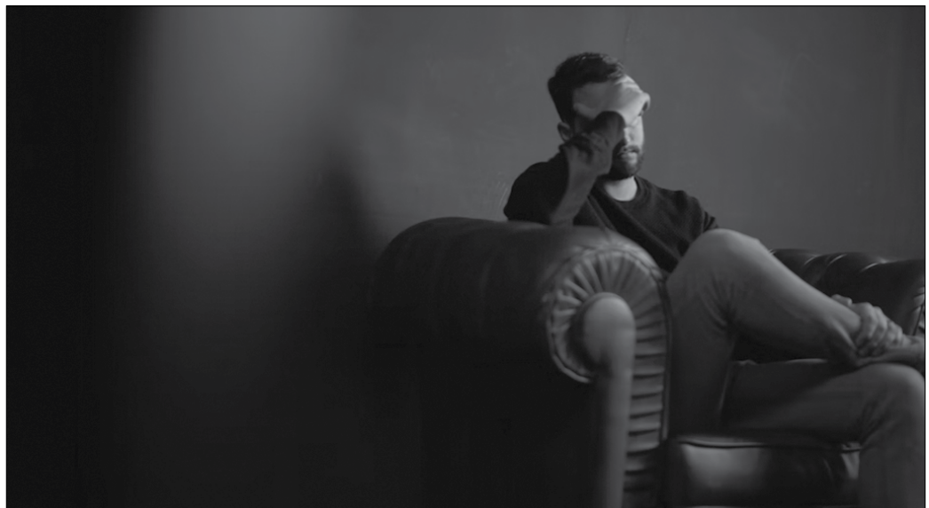
Zenbait gai jorrazteko nahia agertu dute galdetegian parte hartu duten gazteek: drogomenpekotasuna, antsietatea, sexualitatea edota harremanei buruzko lanketa.

Egunotan argitaratu dituzte emaitza nagusiak. Galdetegian parte hartu duten ia denek azken urteotan haien osasun mentala artatzeko beharra sentitu dutela diote; aldiz, erdiak, “%55ak soilik jarri dio arreta”.