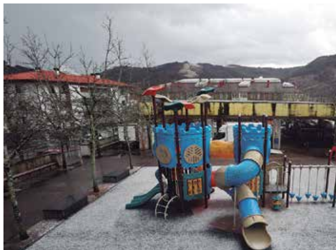
Kazkabarrak bazterrak zuritu zituen urtarrilaren 18an.

Urtarrilaren 17an haize bolar da bortitzek eragindako kalteei eta erria nola hazten zihoan begira ginen. Biharamunerako elurra oso behean iragarria zegoen. Herriko txokoak zuritu zituen bai, baina ez elurrak, kazkabarrak baizik.