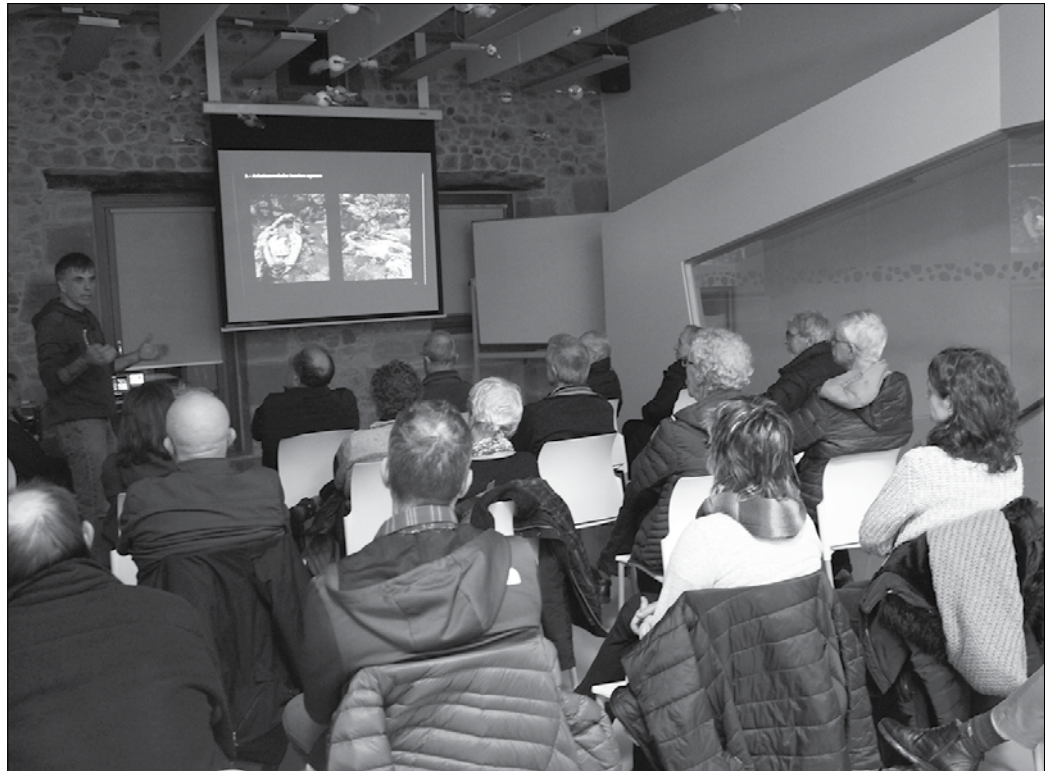
Erraustegiaren Aurkako Mugimendua Toxicowatch fundazio herbehereetarrarekin lankidetzan egiten duen urteroko kontrolaren berri eman zuen Potxoenean.