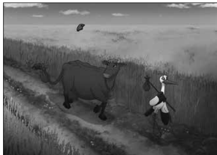
Animaziozko filma ikusteko sarrera alde zuretik eskura daiteke.

erakustea bizitzeko leku aproposena ez duela zertan kanpoan topatuko".