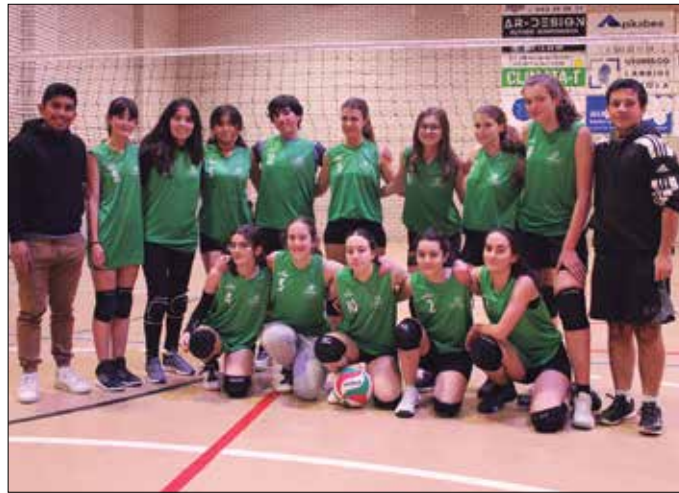
“Nahikoa borrokatu dugu Oiarde kiroldegian entrenatu ahal izateko”.