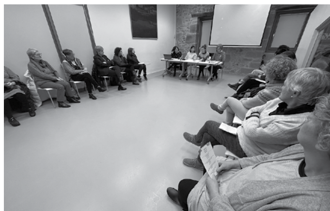
Adinkeriaren gaia pil-pilean dago gure gizartean eta hori genero rola nola uztartzen den aztertu zuten aurreko astean Potxoenean.