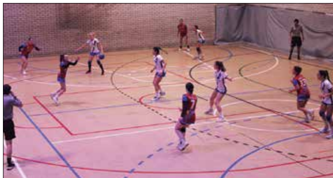
Urbil Usurbil KE nesken taldeak Euskal Ligarako promozio fasea jokatu zuen.

Usurbil KE-ko jubencil nesken taldeak Euskal Ligarako promozio fasea jokatu zuen asteburuan Oiardon. Mecalbe Eibarrek lortu du iguera txartela.