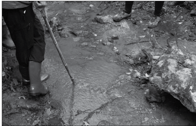
Zubietako arduradunak “eraginezaz” eta “kontrol gabeziak” jokatzen ari direla zioen fiskaltzak. Epaitegiak kontuan hartu ditu fiskalaren hitzok.

Fiskaltzaren ikerketa, aipatu elkarteak ohar bidez oroitarazi duenez, “59/22 Diligentzien testuinguruan hasi zen, GuraSOSeK egindako salaketaren harira. Fiskaltzak Guardia Zibileko UCOMari (Unidad Central Operativa de Medio Ambiente) agindu zion beha zitzala erreka eta zein erraustegiaren instalazioak, isuriaren jatorria aurkitzeko. UCOMak bete du jada diligentzien atal bat. Uztailaren amaiera aldera behatu zuen erreka eta hartu zituen bere hegiko arrastoak, zeintzuk Instituto Nacional de Toxicología y Ciencias Forenses deritzonaren eskuetan diren orain aztergai. Bestalde, UCOMak iragan urriaren erdi aldera egin zuen erraustegiaren “behaketa tekniko”. Datoren asteetan espero da UCOMak ikerketaren txosten bat