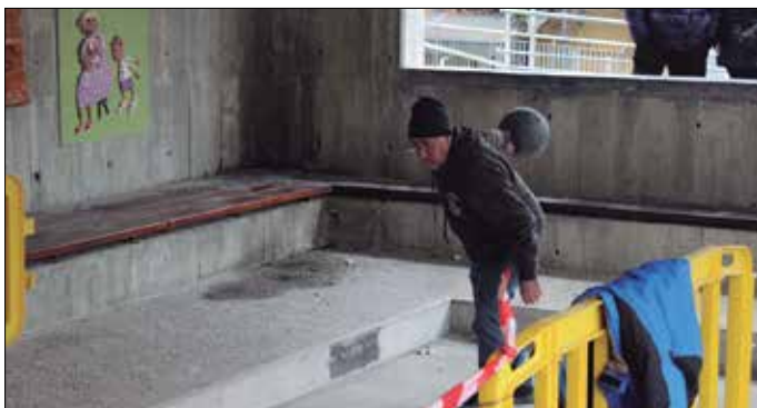
Igandean jokatu ziren bolo eta toka txapelketak Askatasuna plazan.

Hiru kirol ekimen ezberdinen plaza izan zen Usurbil urtarrilaren 29an: Jubencil nesken Euskal Ligarako eskubaloiko promozio fasea Oiardon, Iri-sasi BTT Hotzak Akabatzen proba Andatza aldean eta Gipuzkoako bolo eta toka txapelketa Askatasuna plazan.