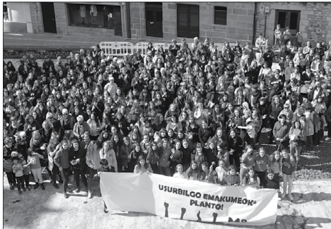
2019. urtean bideratu zuten belau-naldiarteko antolaketa eredu berreskuratu nahi dute.

Kalezarko Pelaoienean kokatuko den etxe honen egitasmoa sustatzen ari den taldetik ekimenok iragarri dituzte Mar-