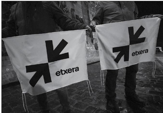
Bi gezi ageri dira oihal hauetan. “#Etxerabideagertu geziek markatzen duten bidea da”, Sarek aditzera eman duenez.

Bi gezi ageri dira oihal hauetan. “#Etxerabideagertu geziek markatzen duten bidea da, ibilbide juridikoa egiten aspaldi hasi ziren euskal presoek eskubideen bidea, legezotasun arrunta aplikatu arte”. Salbuespen legedia eten arte alegia. “Ez dira onurak”, Sareren esanetan. “Ez gara zigorgabetasunaz ari. Presoen eskubideak defendatzen ditugu. Lautik ia hiruk bete dute hirugarren gradura proposatzeko legediak eskatzen duen espetxealdia. 17 presoek gaixo-