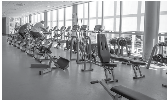
“8.000 euroekin zer erosiko zenuke giharketa gelarako?”. Herrikideek izango dute azken hitza.

Otsailaren 3ra arte, Kiroldegian nahiz erabiltzaileei online bidalitako formularioa osatuta parte hartu ahal da. “2023ko aurrekontuetan 8.000 euro bideratuko ditugu gimnasioiko makina berriak erostera. Hori dela eta, zure iritzia jaso