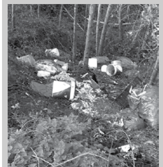
Hondakinak pilatuta ageri dira herritar batek bidalitako irudian.

Herritar batek bidali digu aldameneko argazkia. Txikierridiko Zaldierreka ondoan eginga da, “Artxubietatik Zelaiundigañara doan bidean”.