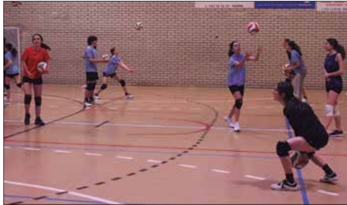
“13-15 urte arteko neskek probatzera etortzeko animatu nahi genituzke, boleibolaz goatzera”.

Kadete mailan 24 talde daude nesketan. Urtarrilera arte promozio liga jokatzeko da. Gero, sailkapenaren arabera, urtariletik maiatzera jokatzeko da benetako liga. Taldea laugarren