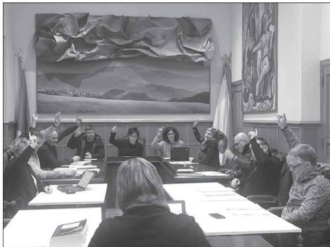
Udal gobernu taldearen esanetan, luzapen honek ez du HAPOren tramitazioan atzerapenik eragingo.

Hitzordua udal arkitektuarekin Ekarpenak biltzeko hain zuzen, 2014az geroztik parte hartze prozesu ezberdinen bidez, herritar eta eragileekin marrazturiko Usurbilgo etorki-