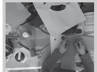
Kuota pagatzeko garaian, haurraren izen-abizenak ipini behar dira.

Bihurri ludotekako bazkide egiteko interesa duenik balez, “jarri gurekin harremanetan ondorengo helbide elektronikora idatziz: bihuririludoteka@gmail.com”. Gaur egungo kudeatzaileek aditza eman dutenez, “urteko edozein momentutan egin daiteke bazkide, eta sarreara kuota 30 eurokoa da”.