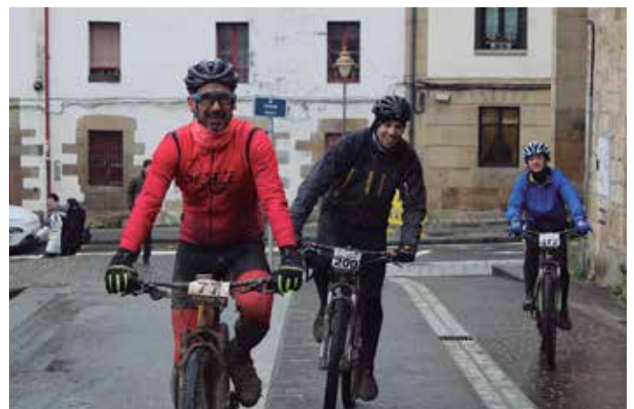
Ohi bezala, Euskal Herriko txoko ezberdinetatik etorritako txirrindularien artean ziren hainbat herrikide; irudiotako hauek, besteak beste.