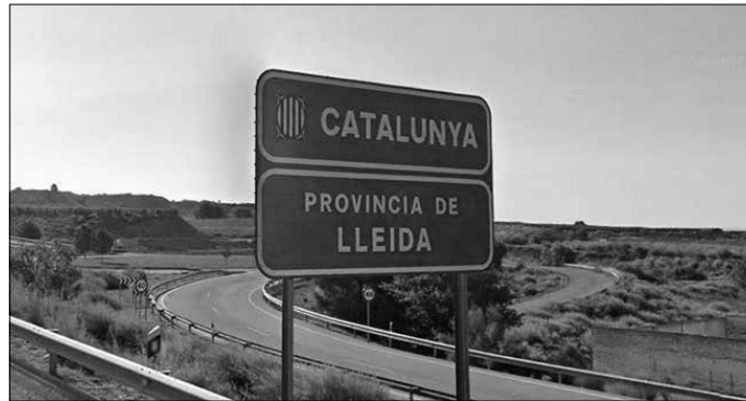
"Begiak zabaldu zenituenean, Lleidarako hogeit bat kilometro falta ziren".