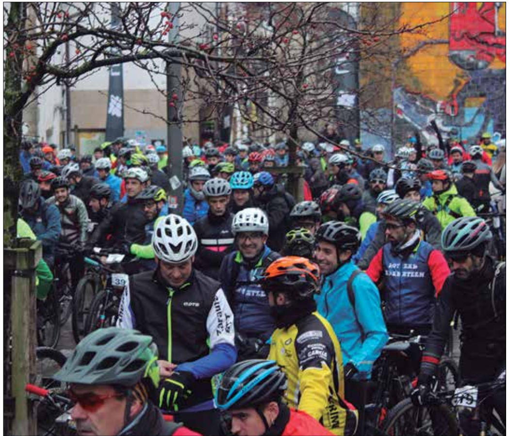
Irisasi BTT Hotzak Akabatzen probako partehartzaileek bide lokaztuan –eta tarteka elurtuan– aritu behar izan zuten.

Bide lokaztu, zenbait tokitan elurtu eta bustian gozatu ederra hartu zuten. Bidean aurkitu zutenaren isla argia izan zen parte hartzaileak nola iritsi diren Dema plazako helmugara, tartean hainbat usurbildar. Ohi bezala, Euskal Herriko txoko ezberdinetatik etorritako txirrindularien artean ziren hainbat herrikide; irudiotako hauek, besteak beste.