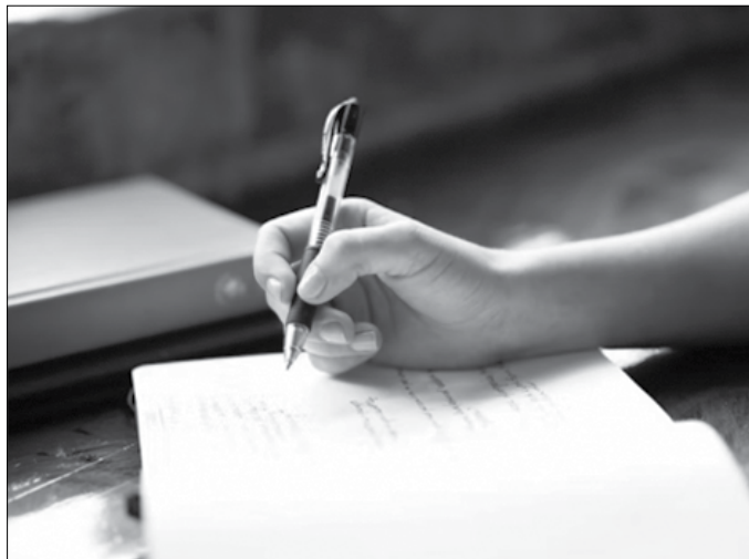
Beharrezkoa da 18 urte beteak izatea lana bidaltzeko unean, eta Usurbilen erroldatua egotea edota Etumeta AEK euskaltegian matrikulatua.