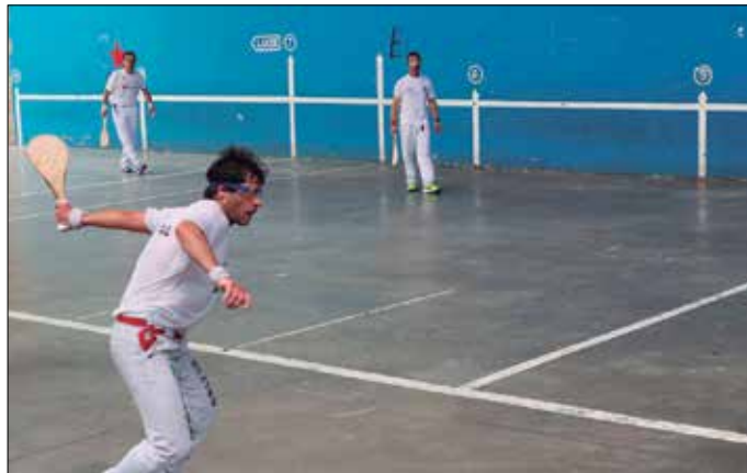
Martxoan jokatu da baina izen-ematea otsailaren 17an amaituko da.

Jatorriari dagokionez, aginagarra edo usurbildarra izan behar da eta bikote bakoitzeko