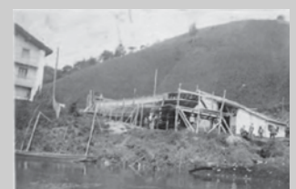
Uriberri ontziola Aginagan.

go ere izango lituzke horrelako proiektu batek. Naturarekin harremana sustatuz, adibidez. Gure ontziak oso ontzi xumeak dira, edozein bazterrean hurbildu daitezke arraunekin, inguruko hegaztiak ikusi.... Beti ere errespetuz. Horrelako gune batek balio erantsia emango lioke Usurbilgo herriari. Ibaia lotutako zerbitzu ezberdinak eskaintzeko aukera