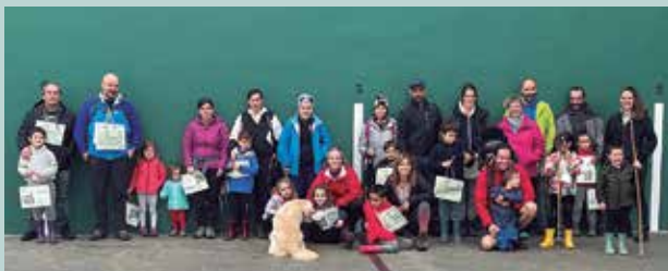
Argazkikoez 'Gure bazterrak ezagutzen' ibilaldian hartu zuten parte.

'Gure bazterrak ezagutzen' ekimenaren bigarren ibilaldia osatu zuten aurreko igandean. Argazkian ageri direnek ibilbide polit bat egin zuten Kalezarren barna.