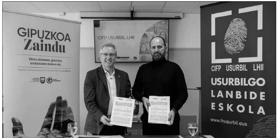
Foru Aldundiaren eta Usurbilgo Lanbide Eskolaren arteko hitzarmena aurreko astean sinatu zuten.

Gainera, jardunaldi teknikoak anto-latuko dituzte foru aldundiko eta uda-letako teknikarientzat, enpresa pribatuko eta merkataritzako profesionalentzat. Gai hauek hartuko dituzte ardatz: aeroter-miako sistemetan izandako ondorioak,