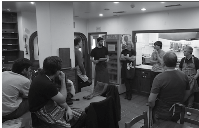
“Akelarre jatetxean praktikaldia amaitu eta berehala Elketatik deitu ninduten lanean hasteko”. Argazkian, Aitzagako ikastaroko partaideekin solasean.