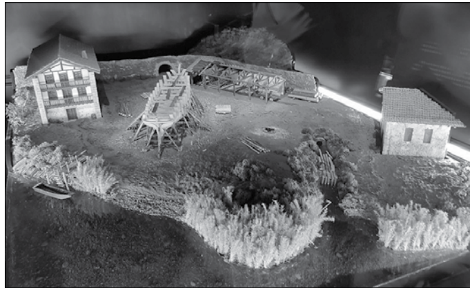
Uriberri eta Mapil artean kokatutako ontziola. Maketa hau Donostiako Aquiriumean aurkitzen da.

XVIII. mendearen erdialdean ordea, egoera aldatu egingo