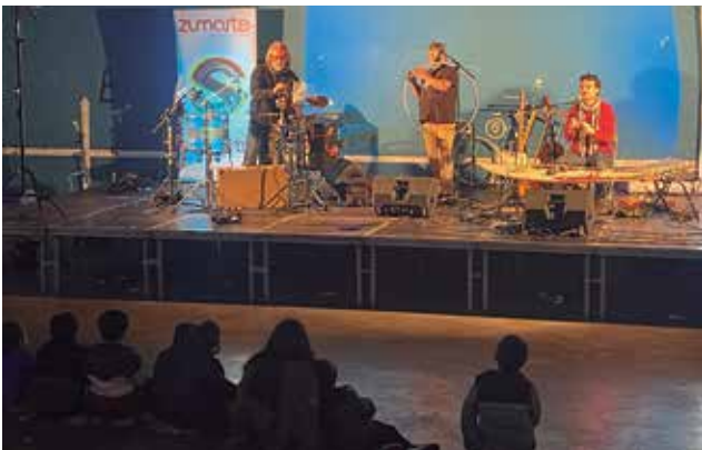
Orquesta Reusonicakoez goizean tailer bat gidatu zuten Zumarte Musika Eskolaren atarian eta arratsaldean kontzertua eskaini zuten frontoian.

19. Soinurbil zikloaren baitan, Orquesta Reusonica izan zen aurreko larunbateko protagonista.