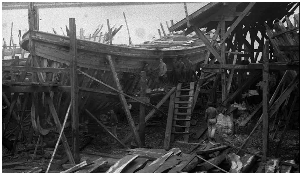
Usurbil eta Aginagako ontziolen inguruko argazkirik ez da apenas. Pasaiaiko San Roke ontziolaren oso antzekoak izango ziren. Argazki hau eta portadakoa 1920koak dira, Martin Ricardok eginak. Iturria: kutxateka.eus

Oriako ontziolen inguruko lehen agiriak XVI. mende erdialdekoak badira ere, aurretik