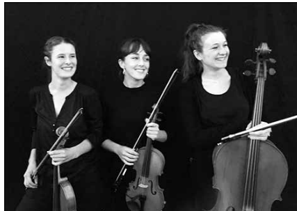
Ostiral honetan arituko dira Sutegin, Soinurbil zikloaren baitan.