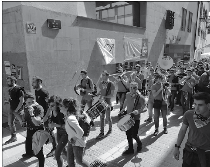
Iaz bezala, aurten ere Usurbilen izango da Iruñeko Peña Alegria, San Ferminetako txaranga eta bilgune ezaguna.

Ez dakit, ez dugu inoiz ikusi. Une hori inoiz ez heltzea espero dugu.