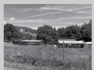
https://labur.eus/HP5E2 helbidean topatuko duzue formularioa.