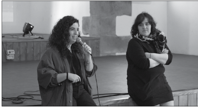
Martxoaren 12an egitasmoari buruzko xehetasunak eskaini zituzten.

Sortu nahi duten herri kooperatiba horren erdigunean kokatu nahi dituzte hain zuzen, aginagarrak; bai maila ezberdinetan sor daitezkeen ekimenetan lagundu edo parte har dezaketen norbanakoak, baita herri eragileak ere. Eta erakunde publikoak; kooperatiba hau ere beharrak plazaratzeko tresna gisa baliatu nahi dute. Osatua dagoen talde eragileak koordinatuko ditulan hauek guztiak.