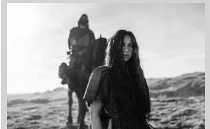
Sarrerak 6 eurotan eskura ditzakezue usurbilkultura.eus plataforman edo NOAUA!ren egoitzan.

Gogoan izan, apirilaren 2an 19:00etan Sutegin 'Irati' filma ikusteko aukera NOAUA! Kultur Elkartearen eskutik. Sarrerak 6 eurotan eskura ditzakezue usurbilkultura.eus plataforman edo NOAUA!ren egoitzan. Egoitzan bertan bazkideek merkeago, 4 eurotan.