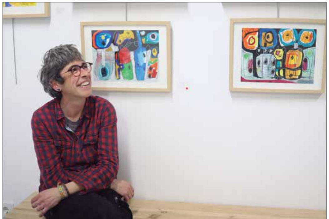
“Batzuetan hiru koadro batera hasten ditut kolore berarekin, baina gero kolore aukeraketa ezberdinak egiten ditut eta horrela osatzen ditut pixkanaka koadroak”.

Pintura erakusketa bat da. Margotzen hasi nintzen ekaina erdialdean psikologoak hala gomendatu zidalako eta pixkanaka gustua hartu nion lanari. Erakusketan jarri ditudanak urritik hona egindako lanak dira. Ez ditut lanak ordena jakin batekin egiten, posible da