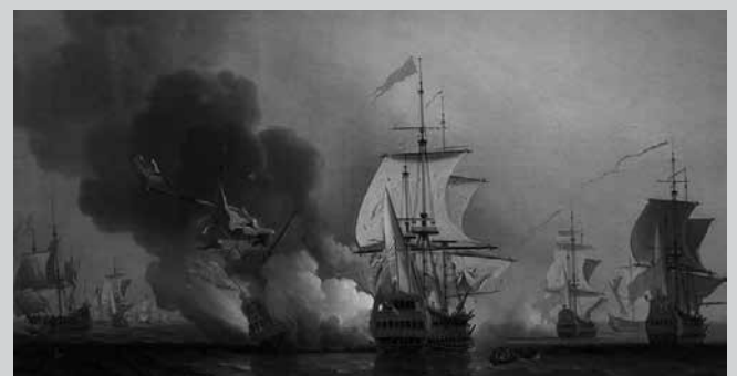
San Jose galeoia lehertu berritan. Samuel Scott margolariaren koadroa.

San Jose 64 kanoi eta 3 mastako galeoia zen, Espainiako itsas armadaren enkarguz eginga. Francisco Antonio Garrotek diseinatu eta Pedro Arostegik eraiki zuen Mapiloko ontzian. Eraikuntza 1698an amaitu zen.