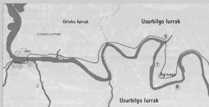
Oria ibaiko ontziolak XVI-XX. mendeetan, Jesus Mari Peronaren laguntzaz egindako kokapena. 6. ontziola: Uriberri-Mapil (XVI-XX m). 7. ontziola: Zakoeta (XVI-XIX). 8. ontziola: Urdaigako ontziola (XVI-XVII). Iturria: ‘Oria ibaiko ontziak’ liburua (askoren artean, 1994).

tzitsuenan izan zen. Orain urte gutxi arte Mapil baserriaren inguruan aurkitzen zen. Mapilek badu abantaila bat: Oriako ibaiak bertan duen meandroak eta zabalguak ontziak uretaratzeko leku aparta eskaintzen du.