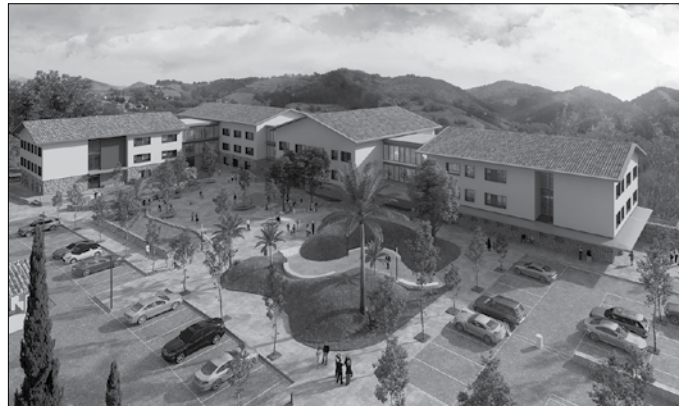
Zaintzadun etxebizitzaren auzunean jarriko duten ile-apaintzaile kudeatzeko jende bila ari da.

Matia Kalezarren eraikitzen ari den eraikina auzoan erabat integratuta egongo da. Zaintza eredu berria jartzearekin batera, auzunearen diseinu arkitektonikoa ere berritzailea izango da, diseinu instituzional zurruna albo batera utzita. Lorategia izango du eta herri-erorri irekitako auzoa izan-