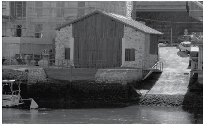
“Mutiozabaldarrek 131 urte egin zituzten ontzigintzan Oriai ibaiaren ertzetan: 1798tik 1929ra. Aurrena, Aginagako ontziolan; 1887tik aurrera, berriz, Orioko Arratolako ontziolan eta, 1910etik aurrera, Mutiozabal ontziolan, Arratolan bertan”. Argazkian, Mutiozabal ontziola eraberritua.