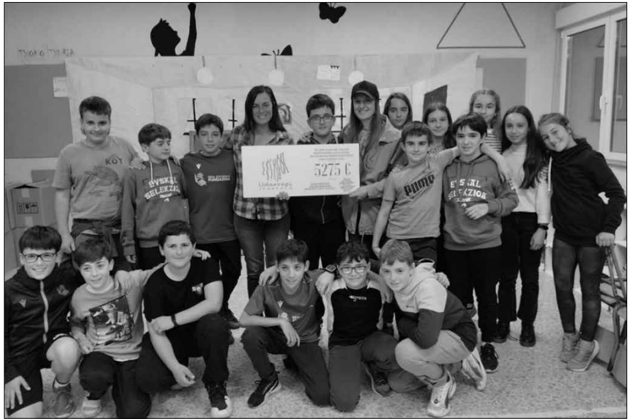
Udarregikoek bildutako laguntza Nepal-dala Gobernu Kanpoko Erakundeari helarazi diote.

“Iritsi da bihotzak hunkitu dizkigun proiektu honi amaiera emateko momentua. Lan handia, baina emankorra... Gustora aritu gara ideiak proposatzen, gauzatzen... Nepalgo errealitatea ezagutzeko interesgarria izan da, batez ere, hango neskek zein bizi baldintza dituzten gertuago sentitze-ko. Eta errealitate hura ezagutzeko gogorra izan den arren, pozik gaude! Proiektuarekin lortutako dirua baliatuz, zerbait aldatzeko aukera izango delako. 5.275