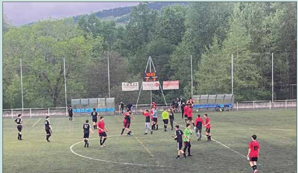
Usurbil FT taldeak 2-0 irabazi zuen Mundaizen aurkako partida eta emaitza honi esker Preferentera igo da.

Partida hasi eta 15 minutura lortu zuten usurbildarrek lehen gola. eta beranduago etorri zen bigarrena. Garaipen honekin Preferente mailarako igoera eskuratu du taldeak. Ospakizunez beteriko arratsaldea izan zuten jokalariek eta klubak. Zorionak!