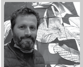
Javier Aramendia Santuenean izango da ostiral honetan.

■ Orduetgia: 17:30/19:30 ■ Non: Santuenea, 12. ■ Prezio: 10 euro. Bazkideek, 7 euro. ■ Izen-ematea: 670 027 731.