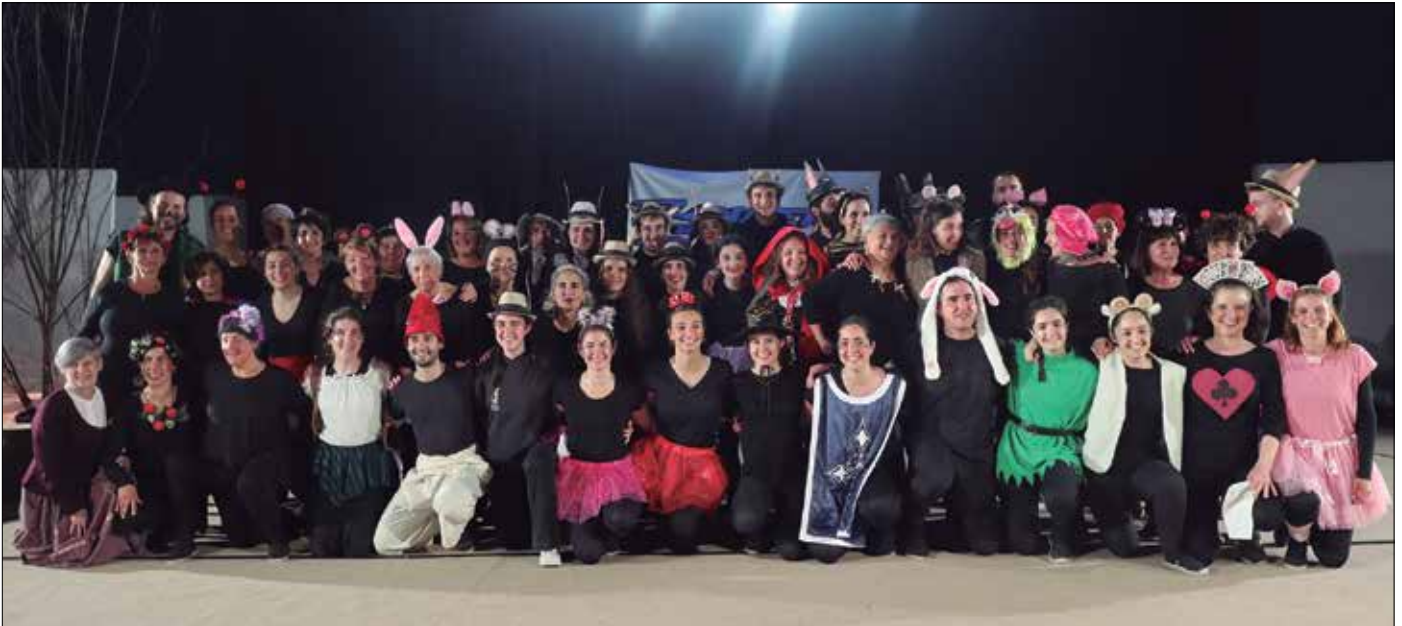
Dantza Egunaren baitan eskainitako "Hala bazan!" herri ikuskizunak jakinmin handia piztu zuen. Irudi gehiago noaua.eus atarian.