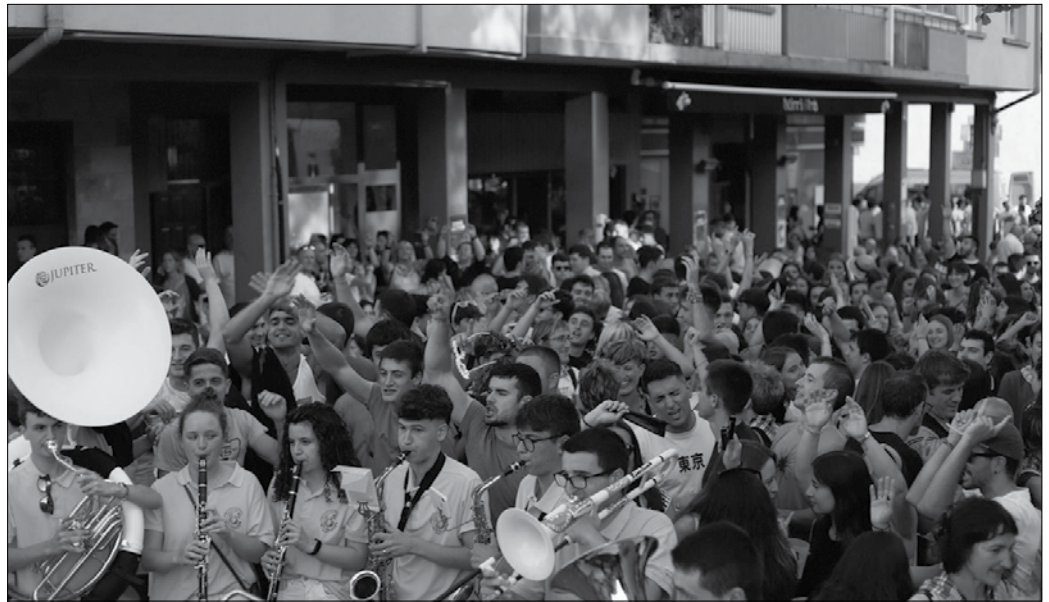
Herriko festei hasiera nork emango dien proposatzeko aukera duzue. Ekarpinak udaletxean, Potxoenean, Sutegin eta Oiardo kiroldegian egokituko dituzten kutxetan egin ahalko dira.

Datozen herriko festen berri emango digun egitaraua diseinatzeke lehiaketa ere iragarri du Jai Batzordeak. Maiatzaren 23ra arteko epea izango dute interesdunek txapelketa honetara lanak aurkezteko. Diseinu lanari dagokionez, ohi bezala, lehenbizi Potxoenean egitarauko testua eskuratu beharko da edo bestela kultura@usurbil.eus