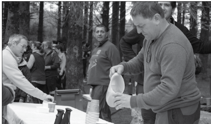
Goizean zehar pintxoak eta sagardoa dastatzeko aukera izango da.

■ 09:30 Txokoaldeko trenbide ondoko aparkalekutik hasita, Zirimararen familia-plana: “Fa-