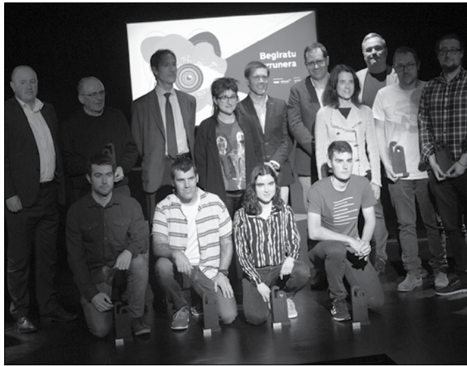
‘Begiratu urrunera’ aldarrinean egin dute aurtengo sari banaketa.

■ Egilearen doktore-tesian oinarritutako dibulgazio-arti-