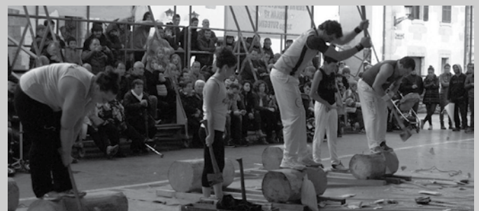
Datorren igandean, maiatzak 14, herri kirolak izango dira arratsalde partean.