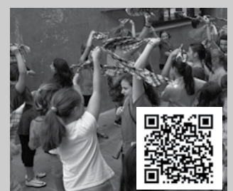
Irudian, izen-ematea egiteko lotura.

Gure web orrialdean topatuko dituzue xehetasun guztiak eta baita izen-ematea osatzeko formularioa ere: noaua.eus/berziak/udajolas-2023