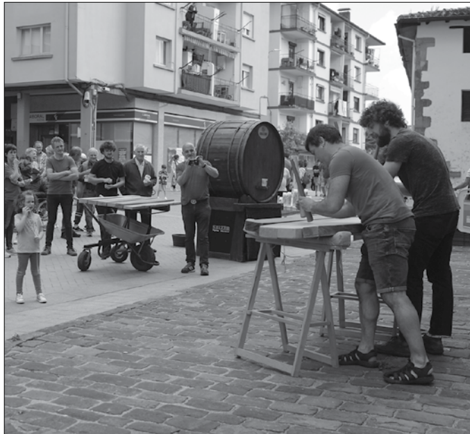
Herri erromeri oparoa iragarri dute maiatzaren 13rako.