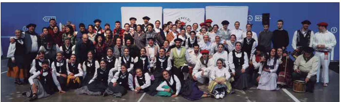
Dantzaren hamaika adierazpide ezagutzeko aukera egon da azken bi asteburuetan.