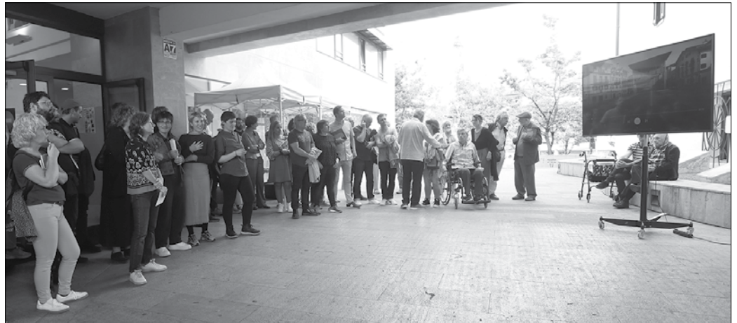
Zumetaren muralari buruzko erakusketa aurreko astean inauguratu zen. Maiatzaren 15era arte egongo da zabalik.