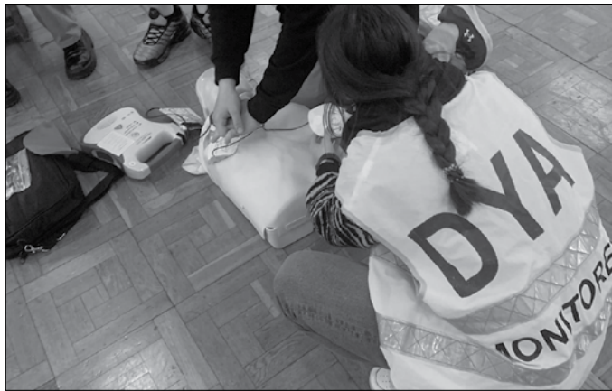
Izena emateko ez da beharrezkoa aurrez ezagutzarik izatea.

Izena-emateko ez da beharrezkoa aurrez ezagutzarik izatea. Egunerokoan izan daitezkeen arrisku egoerei nola erantzun irakatsiko dute DYako kideek: bihotz eta birika susperketa, zauriak, haus-