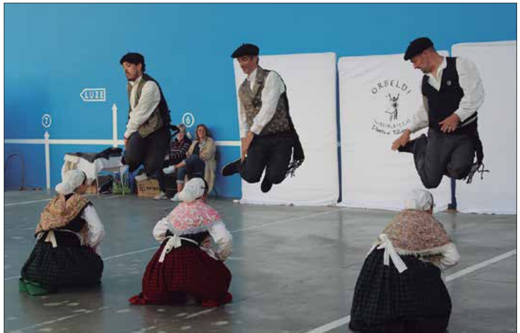
Dantza Egunko kalejira Kalezarretik abiatu zen. Usurbilgo Euskal Kantu Taldearekin batera osatu zuten kaxkorako bidea.

Jaia gauera arte luzatu zen. “Hala bazan!” herri ikuskizunak jakinmin handia piztu zuen. Dantzariak aktore lanetan ikusi genituen, izatez 2020ko udaberrian eskaini behar zuten emanaldian. Covid-19ak zapuztutako edizio haren ostean, aurtengorako berreskuratu dute ikuskizun hau