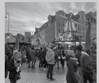
“Otsailaren 12an iritsi nintzenean, hotz handia egiten zuten Wrocławen”.

zoragarria da. Ikasle-egoitzan denetik dago: japoniarrak, alemanak, ingelesak... haiekin ez daukagu harremanik. Italiar batzuk bizi dira hemen eta haiekin harreman pixka bat egin dugu, baina gutxi gehiago. Unibertsitatean ere ez dut ia inor ezagutu. Seiko taldean ibiltzen gara finean.