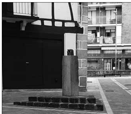
Bisita gidatuak ordubete iraungo du. Aurretik eman behar da izena.