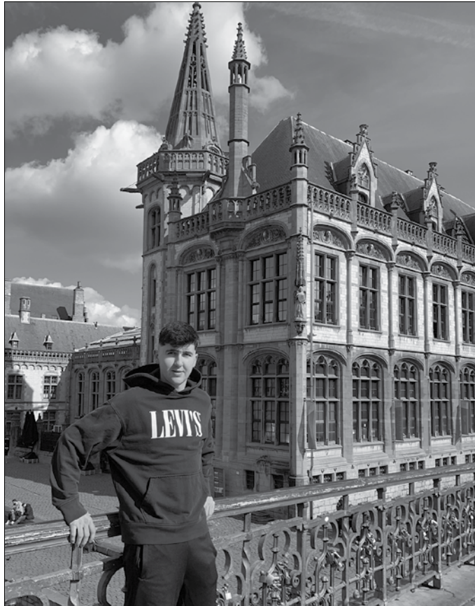
“ADE izeneko ikasketak ari naiz egiten, administrazioa eta ekonomiari lotutako ikasketak”.