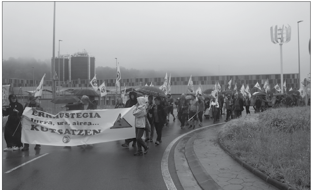
Errausketaren Aurkako Mugimenduaren esanetan, “Zubietako erraustegia hasieratik gaur arte kutsatzen ari da inguruko hainbat lurzoru, ur eta landareak”.

Horri guztiari buruzko datuak hilabeteotan azaleratzen joan direla gogorarazi zuten antolatzaileek, ToxicWatch fundazioak bildutako laginekin egindako azterlanetan, baita GHK-ren aginduz eginikoeetan ere. EHU-ko ikerketa talde Ekopolen lana ekarri zuten gogora. “Zubietako erraustegiak bi mila aldiz gaintitu zuten gehienezko kutsadura muga 2020an. Datu eta infor-