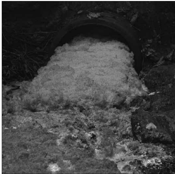
2020 eta 2022ko isurketak lotuta daudela ondorioztatu du Gipuzkoako Lurralde Auzitegiak. GuraSOSen esanetan, “Auzitegiaren autoa irmoa da, eta haren aurka ezin da errekurtsorik jarri”.

GuraSOSen ikuspegitik, honako hau albiste baikorra da, “erraustegia sortzen ari den kutsaduraren ikerketa zuzen bideratzen duena. Lehen urrats