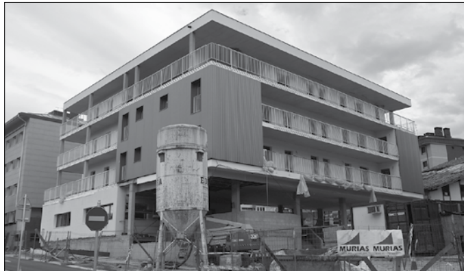
Txirikordan bizitzeko 30 eskabide iritsi dira udaletxera.

Gazteenean, 23 izan dira onarturiko eskabideak, bakarra baztertua. Lau eskaera aurkeztu dituzte bina lagunek bi logelako etxebizitzetarako, eta banakako beste 19 eskaera logela bakarreko etxebizitzetarako. 65 urtetik gorakoen artean,