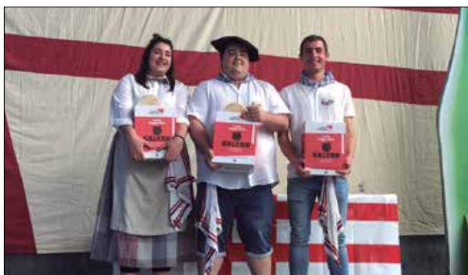
Hiru finalistak paretsu aritu ziren finaleko saioan.

Nobedaderik izan da aurtengo lehiaketan. Garai batean, bota-