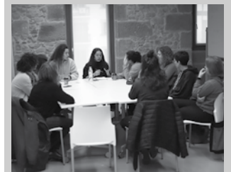
Bilera gehiago egingo dituzte datozen asteetan.

Lehen urratsa izan zen hilaren 13koa, baina asanblada eta bilera gehiago egingo dituzte datozen hilabeteetan.