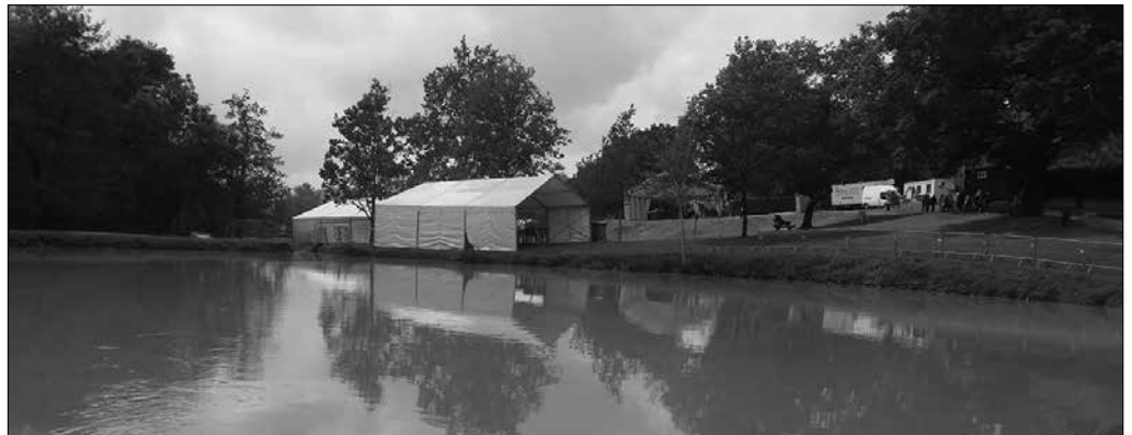
"Sinbolikoki bada ere, Herri Urrats ospatu zen, baina milaka euroko galera ekonomikoa ekarri dio Seaskari".