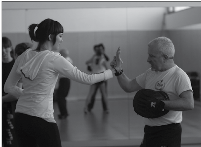
Herriko emakume guztiei zuzendua egongo da ikastaroa.

Herriko emakume guztiei zuzendua egongo da. “Ikastaroarekin hainbat helburu lortu nahi dituzte: emakumeek indarkeriarekiko dituzten bizi-penak konpartitu eta biltzea; elkar entzutea eta beldur eta emozio desberdinei buruz lasai hitz egiteko tartea izatea; erasoak identifikatzen ikastea eta indarkeriaren definizioa taldean lantzea; autodefentsaz hausnartu eta erasoei aurre egiteko estrategiak lantzea; eta erantzun, alternatiba eta estrategia indibidualetan zein kolektiboetan sakontzea”. Ikastarorako izena aurrez eman behar