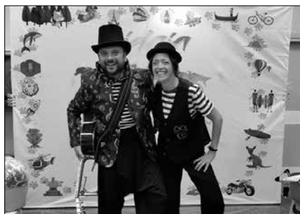
Aginagako Eliza Zaharrea arituko dira arratsaldeko 17:00etan.