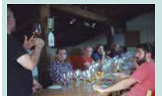
Artzabalek eta Euskal Sagardoak antolatutako dastaketa-saioa.