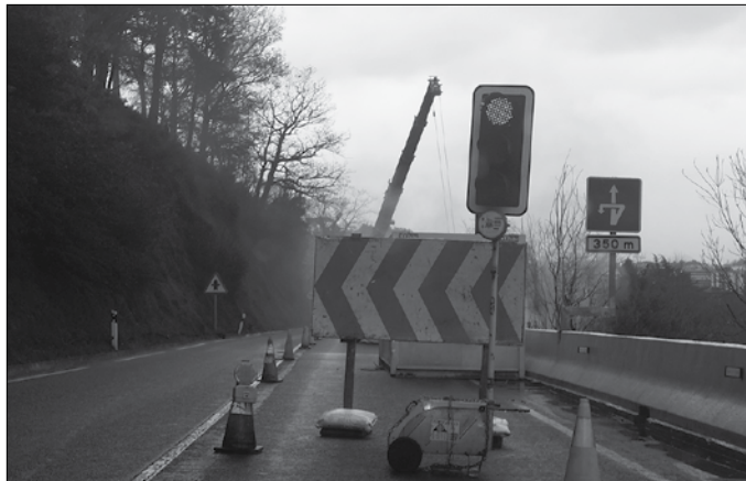
Troia eta Txikiardi arteko lanak etenda egon ziren hainbat astez. Berriz ere martxan dira. Aldundiak ez du argitu lanak noiz bukatuko dituzten.

Hilabetez etenda egon ostean, gizonetzkoen eta emakumezkoen txirringularen Itzuliak igaro direnean N-634 errepideko errei bat itxi dute berriz Troia eta Txikiardi artean. Semaforo bidez kudea-