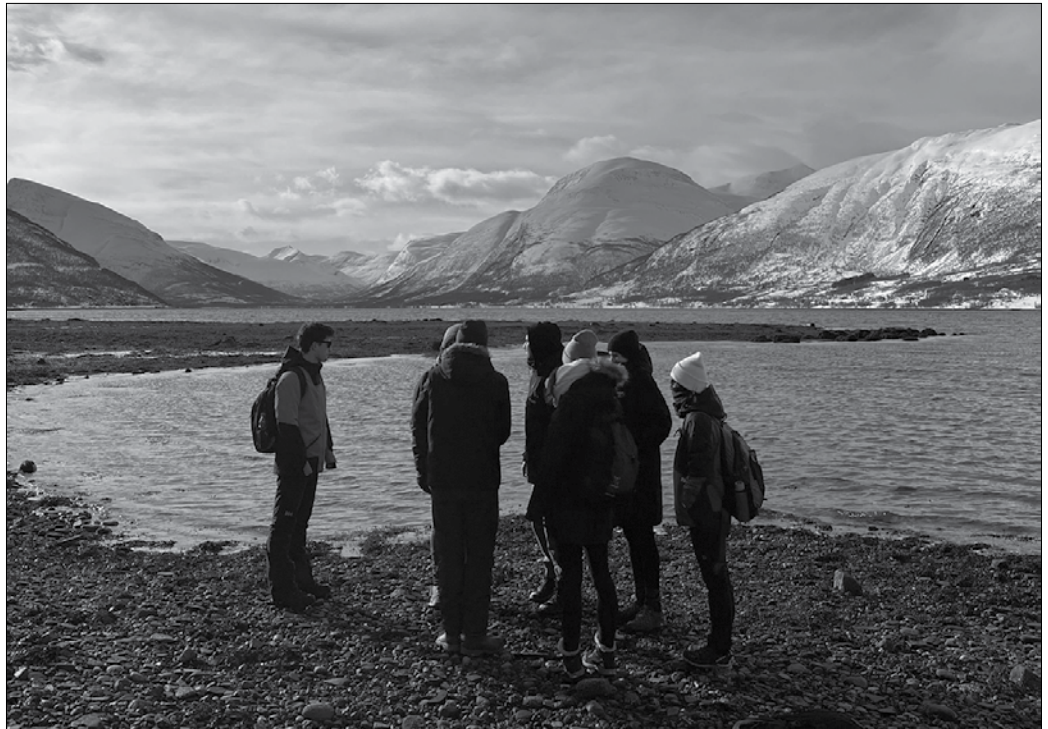
“Udaberrian eguraldi ona egiten duela esan digute, baina oraindik neguko eguraldiarekin gabiltza”.

Elorri Armendariz: Martxoan goizeko 6etan argitzen zuen eta ilundu ere arratsaldeko 6ak aldera. Hala ere, herrialdera iritsi ginenean, arratsaldeko 15:00ean ilundu egiten zuen. Goizak ere motzagoak izaten dira neguan eta hilabeterik ilunenetan lau bat orduz egoten da argi. Gu, zortez, udaberri aldean iritsi gara eta neguko hilabeterik gogorrenak ez ditugu bizi behar izango. Udan alderantzizkoa gertatuko zaigu, ekainean goizeko ordubiak aldera argituko du eta gaueko 10:00ak aldera ilundu. Beraz, egun argiarekin bizi beharko dugu uda aldean. Gai hau jende askorekin partekatu dugu eta esan digute lo egiteko oso zailak direla udako hilabete horiek. Nahiko galduta sentituko garela uste dugu oso ondo jakin gabe zein ordu den eta noiz joan behar dugun lotara. Elur pila bat ikusteko aukera ere izan dugu azken asteetan. Udaberria oso polita dela eta eguraldi ona egiten duela esan digute, baina oraindik neguko eguraldiarekin gabiltza.