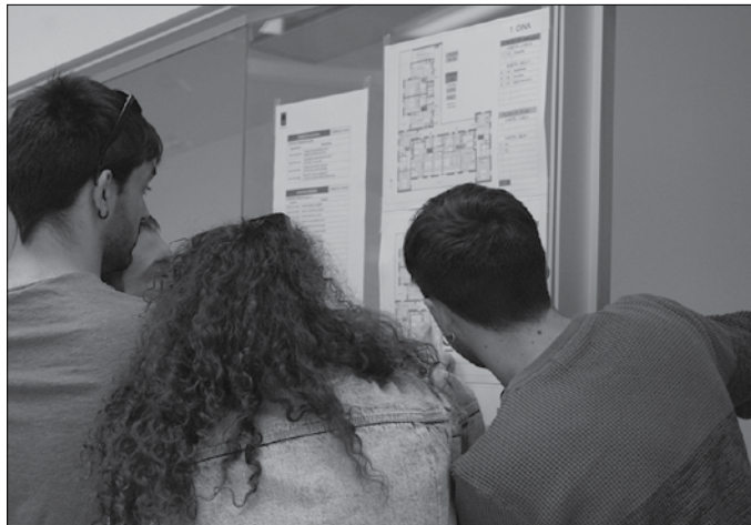
Hamasei dira eraikiak dauden pisuak; lau bi geletakoak dira, hamabi gela bakarrekoak.

18-30 urte arteko gazteen artean 9 etxebizitza esleitu dira Zenbakiok aintzakotzat hartuta, 65 urtetik gorakoentzako zortzi etxebizitzetatik lau bideratu dira. Udalak onarturiko araudiaren arabera, hiru utzi zitezkeen erreserban. Lauga-