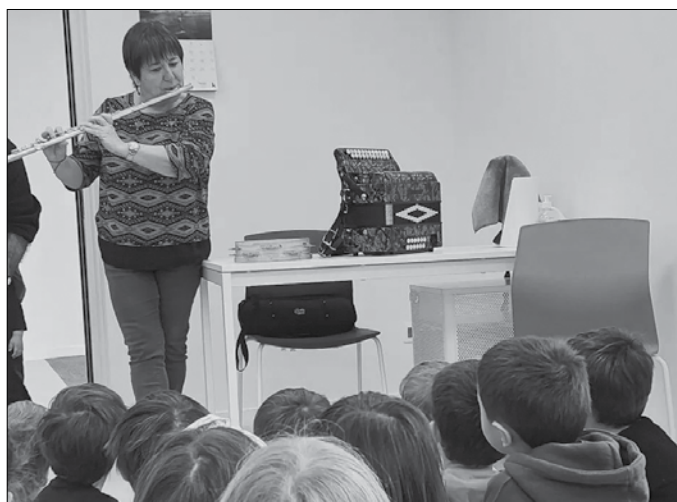
Maiatzaren 26an itxiko da matrikula osatzeko epea. Informazio gehiago zumarte.eus web orrialdean.

■ Presentzialki: astearte eta osteguna (10:00-12:30 / 17:30-19:00).