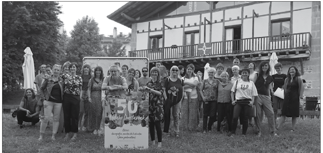
Ekainaren 22an eta 23an egingo dira jardunaldiak baina matrikulazio epea ekainaren 15ean amaituko da.

■ Aurkezpena: "Nola aldatu dira Euskal Herriko mugimendu sozialak azken hamarkadetan? Ze egoeratan daude gaur egun? Eta pandemiak, nola erasan die gizarte mugimenduei? Belaunaldi berrien segida, militantzia-ereduaren bilakaera, mobilizatorako eta ekintzarako praktikak eraberritzea... auzi asko aipatzen dira gizarte mugimenduen gaur egungo egoeraz