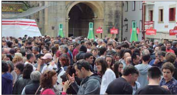
Goizean goiz, 125 boluntario baino gehiago azaldu ziren Dema plazan.

Sagardo Egunaren bihar-munean, antolatzaileek ohar bat plazaratu zuten sare sozialen bidez. Nekatuta baina pozik daudela ondorioztatu daiteke, lanerako boluntario ugari batu zirelako “eta herriko zein kanpoko jende mordo” elkartu zelako 40. Sagardo Egunean.