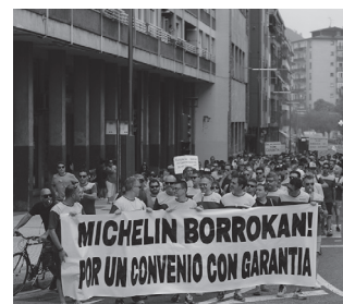
Manifestazioa jendetsua izan zen.