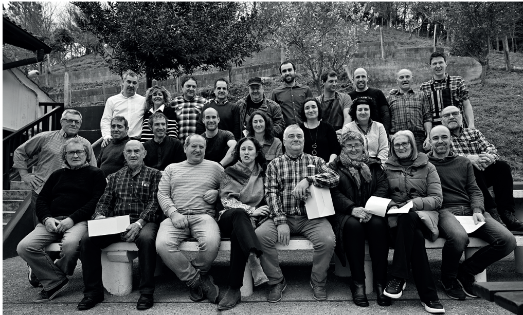
Mahaspildegiko elkartearen bazkideak, 40. urtemugako ospakizunetan.