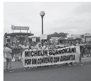
Bermeak eskatzen dituzte.