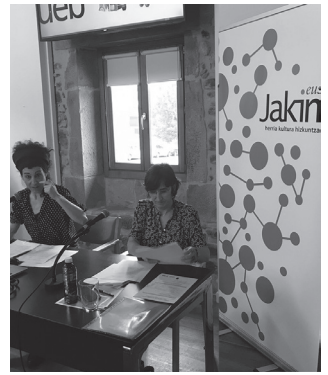
Ekainaren 15ean amaituko da epea.

Trumoi orroak dena isildu zuen. Hodei ilun ikaragarriak buru gainean. Ekaitza lehertu zen ustekabeen. Erauntsiaren melodia eroa. Zaparradak blaitu gintuen hezurretaraino, eta mendian behera, bi zoro ginen aterpe bila.