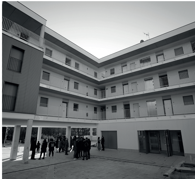
Txirikorda guztiz amaitzea ahalbidetuko du hitzarmenak.

"Hirugarren ordainketa egiteko unean pizten da alarma, zati osoa ordaintzen ez denean", gogorarazi zuen alkateak osoko bilkura hartan. Laugarren zatia ezta ez zion ordaindu Udalarari. Egoera hau tarteko, "Ugartondoko urbanizazio lanak eten" ziren, udal gobernu taldetik azaldu zutenenez, eraikuntza lanez arduratu behar zuen "hitzarmen-batzarrak enpresei ez zielako