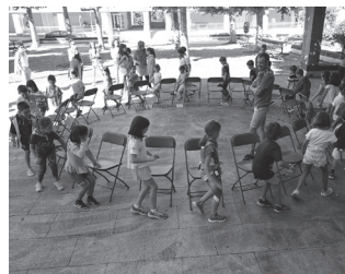
Ekainaren 16an itxiko da epea.

Ekainaren 30ean ospatuko da Santixabel jaien baitako Haurren Eguna eta guraso talde bat ekimen sorta bat prestatzen ari da. Izen-ematea ordea, ekainaren 16an itxiko da.