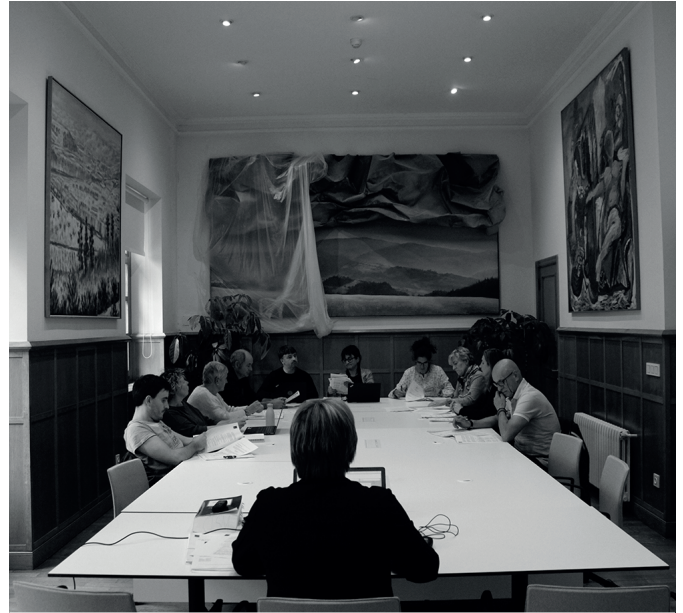
Legealdiko azken osoko bilkura egin zuten maiatzaren 25ean.

Usurbildarrak zorteduntzat jo zituen udal langileen "lana, dedikazioa, inplikazioa eta konpromisoa" ere azpimarratu zuen, "Usurbilekiko eta usurbildarreko. Zortekoak gara usurbildarrok halako