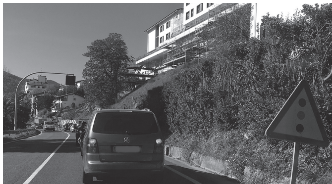
Mozketa ostiral gauean hasiko da. 22:00etatik goizaldeko 5:00ak arte. NOAUA