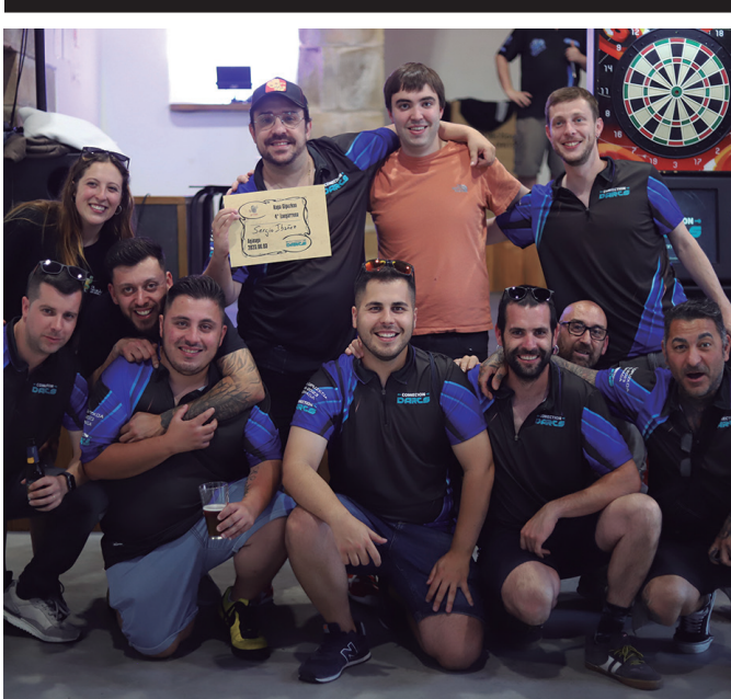
Aginagako Eliza Zaharrean jokatu zen.