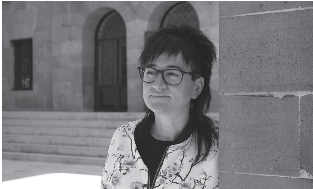
"Udal hauteskundeetan herritarren %40ak parte hartzeari uko egiteak politikarekiko urruntasuna adierazten du". NOAUA

Horretaz gain, herriko gazteek arlo ezberdinetan egiten duten lana nabarmentzekoa da. Izan gazte mugimenduaren baitan,