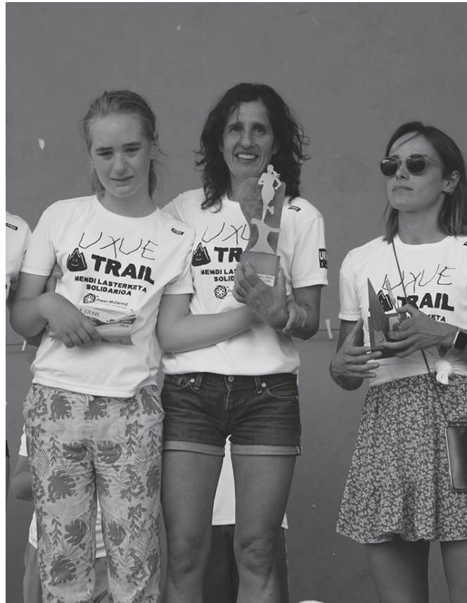
lazko Uxue Trail lasterketan, ibilbide luzeak nagusitu zen. ARGAZKIA: NOAUA.

Larraul-Ernio-Larraul txapelketa oso gustura egiten dut.