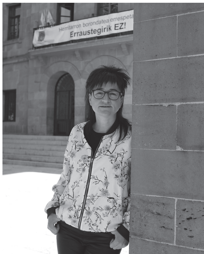
Elkarrizketaren bertsio osoa noaua.eus webgunean aurkituko duzue. NOAUA

Etxealdian asteak daramatzagu bertako herritarrekin batera