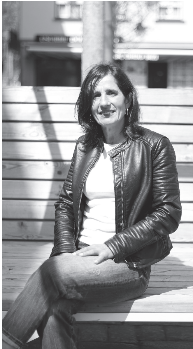
"12 urterekin hasi nintzen korrika. 51 ditut orain".

Orain erosoan 25km inguruko lasterketak egiten ditut. Orain mendi-lasterketetan bakarrik hartzen dut parte, eta beste-lakoan artean Behobia egiten dut urtero. Orain gutxi jakinarazi didate izen-ematea egin behar dela Behobiarako, eta izena eman dut, jakina. Horiez gain, Usurbilen antolatzen dituzten lasterketetan ere par-