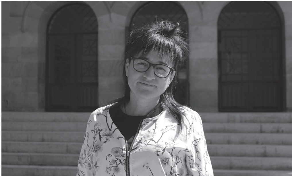
"Maiatzaren 28ko gaua hunkigarria izan zen. Arnaldo Otegi esan zuen moduan, gau magikoa izan zen".