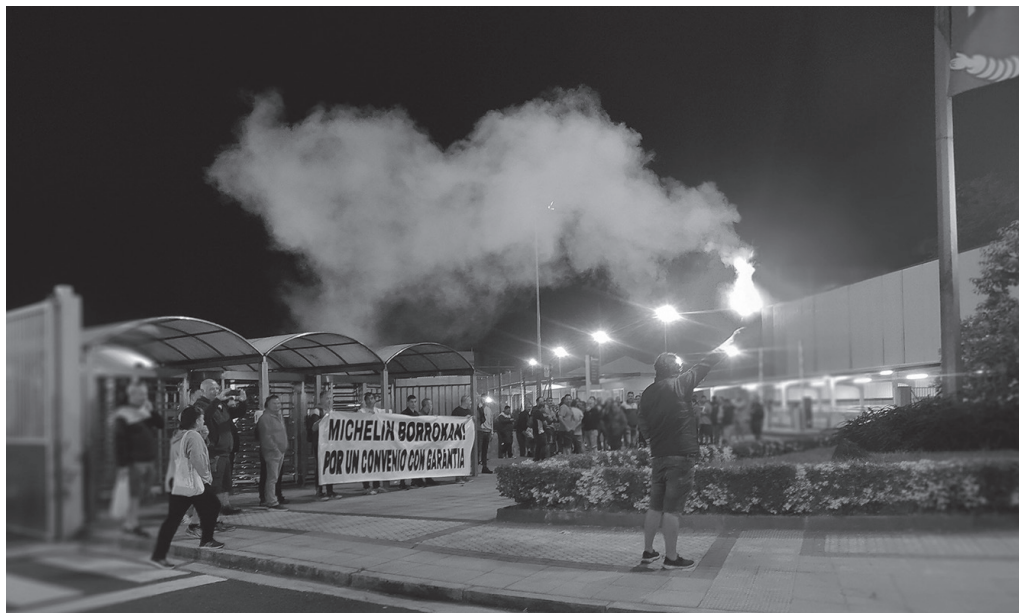
Lantegiaren atarian elkarretaratze ugari egin dituzte egunotan.