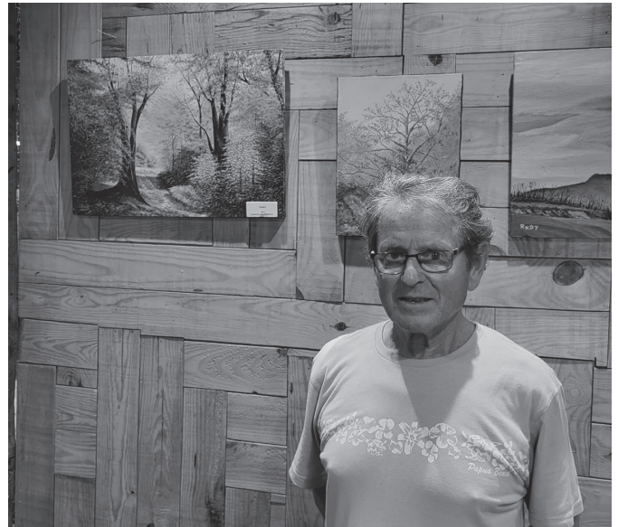
Berako margolariak 80 erakusketa baino gehiago egin ditu.

80 erakusketa baino gehiagok bermatzen dute margolariaren ibilbide artistikoa. Informazio gehiagorako: www.rudyarte.com