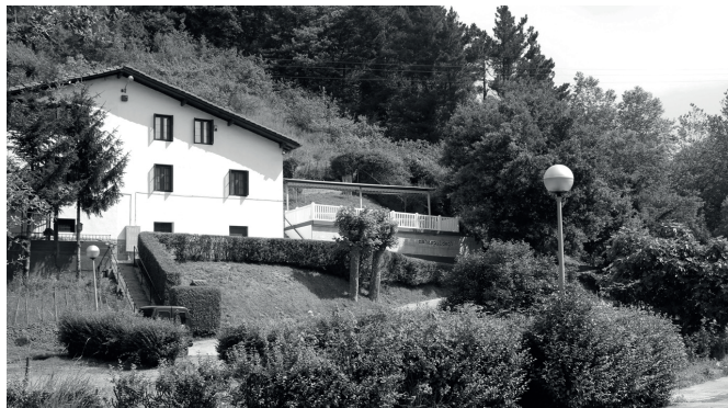
40 urte bete dituen Mahaspildegiko elkarte.

Lau hamarkada hauetako ibil- bidea bermatu dutenak bildu eta egindako 40. urtemugako ospakizun bazkariaren ondot- tik, aurrera begirako erronkez galdetuta argi erantzun digu- te; batetik, kirol eta kultur ekintzak sustatzeko elkarte ere badenez, dinamika ezber- dinak abiarazi nahi lituzkete. Aipatu digutenez, covid19ak eragindako bi urteko osasun krisialdiaren etenaldiaren ostean, "kosta zaio jendeari itzultzea, ea horri buelta ema- tea lortzen dugun".