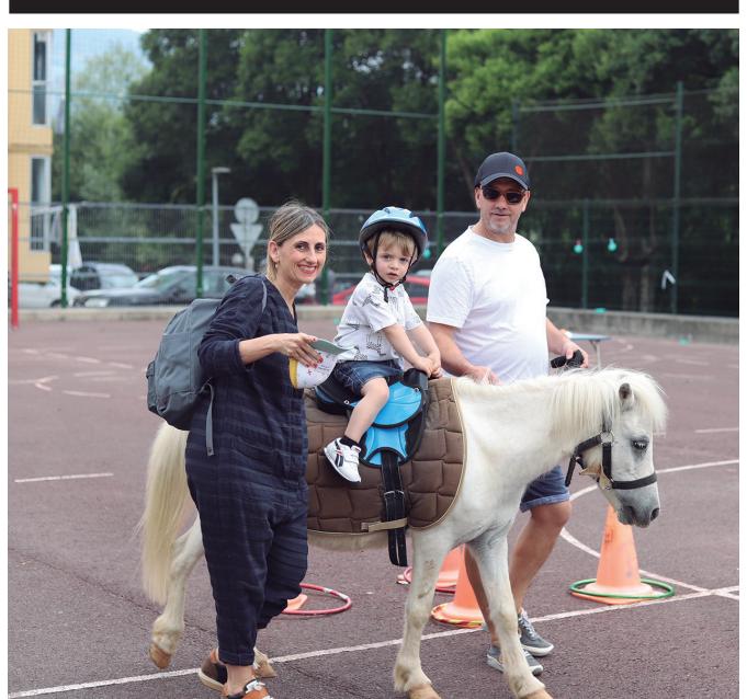
Santuenea Kultur Elkartearen ekimenak harrera ona izan zuen. ARGAZKIA: NOAUA

Gipuzkoako Dardo Kopa jokatu zuten larunbatean Aginagako Eliza Zaharrean. Bakarkako txapelketa jokatu zuten goizean eta arratsaldean binakakoa. Hainbat eta hainbat dardoazale hurbildu ziren ekitaldira. Txapelketaren argazki gehiago noaua.eus web orrialdean dituzue ikusgai.