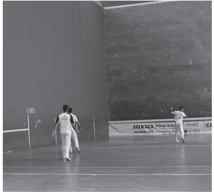
Usurbilgo senior mailako txapelketa finalaurdenetan da. NOAUA

Lizeaga-Elola (Tolosa) Orbegozo-Aranburu (Orio)