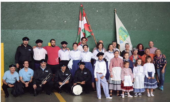
Soka-dantzan aritzeko ohitura berritu zuten Santio Egunean.