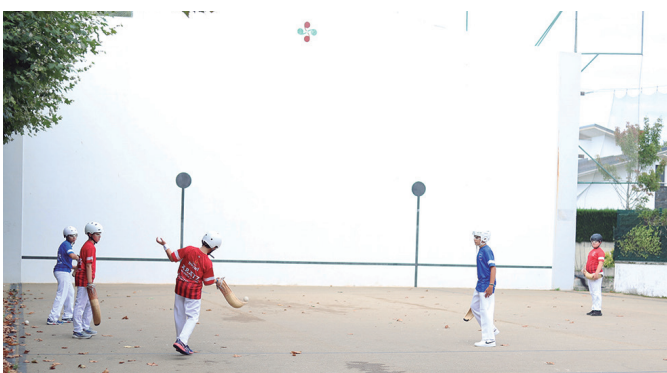
Joko Garbi erakustaldi bikaina egin zuten herriko gaztetxoek.