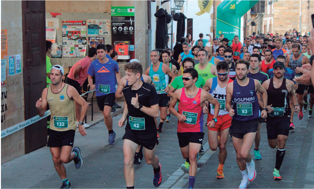
Helduen lasterketan 150 lagunentzako lekua egongo da.