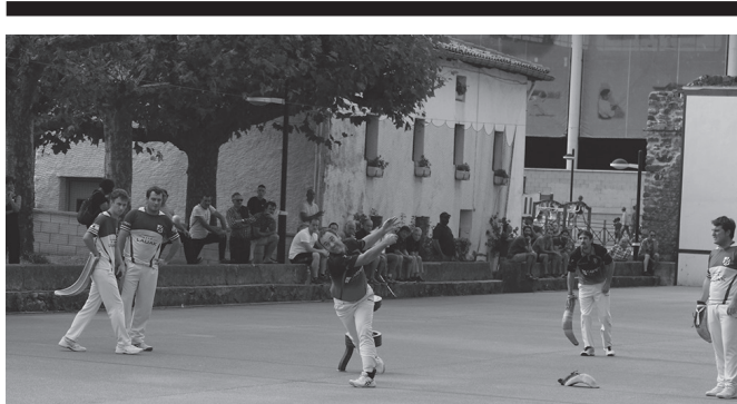
Lehen fasean, Behar-Zana eta Kanboarrak izango dira zubietarren aurkariak.

Izen-ematea: 3 eurotan (18 urtetik beherakoek doan). Informazio gehiago: 650usurbilbizi.eus 12:00-13:00 SuteGIN.