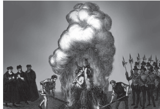
"Miguel Servetek aurre egin zion intolerantziari".

Garai honetan erlijio gerrak astindu zuen Europa osoa. Kalbinok tirania latza ezarri zuen, botere absolutua eskuratu eta bizimodu puritanoa eramatera behartu zituen denak: festa egunak kendu, musika eta artea debekatu eta noski, autoritatearen kontrako kritika guztiak gaitzetsi. Bere agintearen sekretua, historiagile baten esanetan, izua izan zen. Despota honek egiten eta agintzen zuen