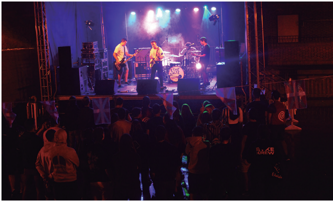
Etxekalte (argazkian) eta Mihise aritu ziren abuztuaren 25ean.