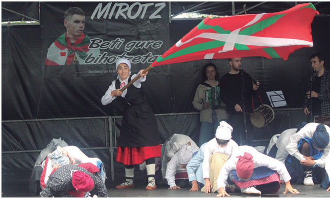
Orbeldiko dantzarien emanaldiak abiarazi zituen Xanistebanak.