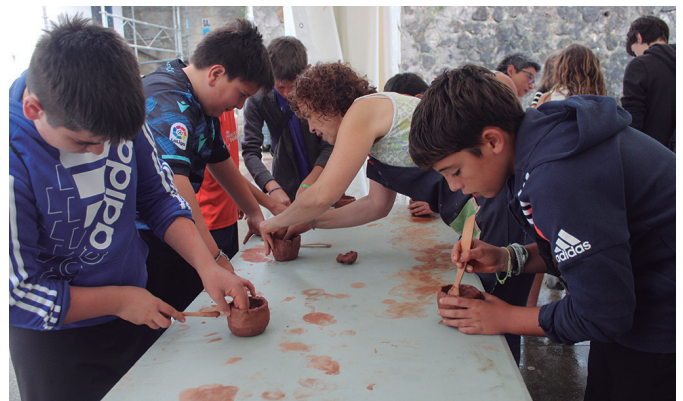
Buztinzulok gidatu zuen buztzingintza tailerra.