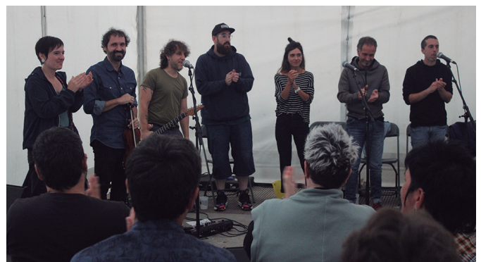
Bertso saio batekin amaitu ziren Atxegaldeko jaiak. Irudi gehiago: noaua.eus