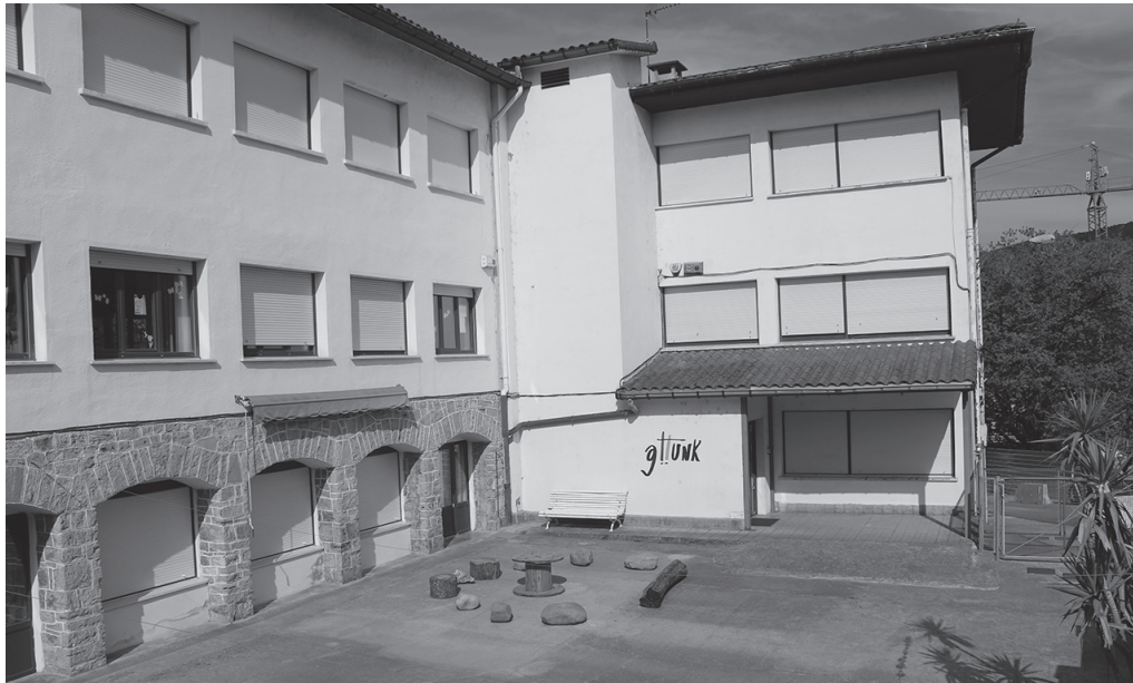
Haur Eskolaren doakotasunaren bidean hainbat neurri hartu ditu Udalak azken aldian.