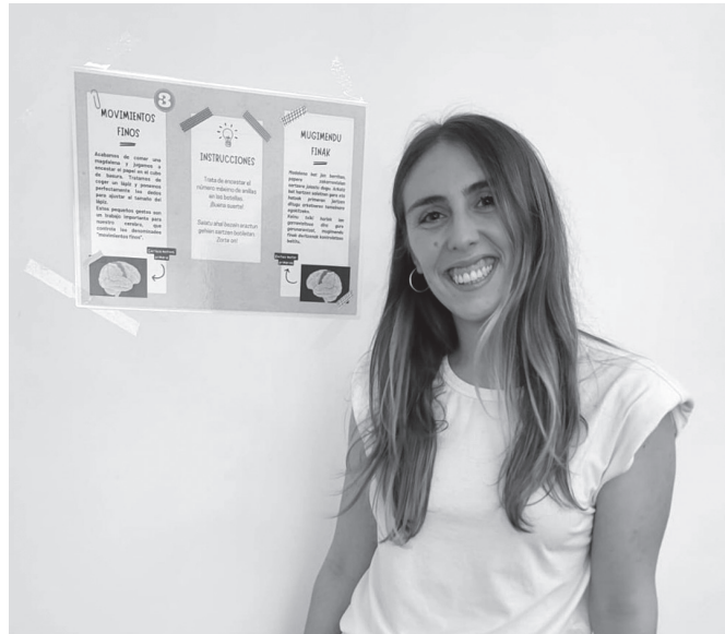
"Gizakian neurona galera nabarmena gertatzen da gaixotasuna diagnostikatzen denerako".

Parkinson gaixotasunaren animalia eredu batekin egiten dut lan. Saguek ez dute berez Parkinsona izaten, eta beraz, ikerketa esperimental-ala egiteko, modu batera edo bestera gaixotasuna eragiten zaie animaliei. Eredu ugari daude, baina ez da