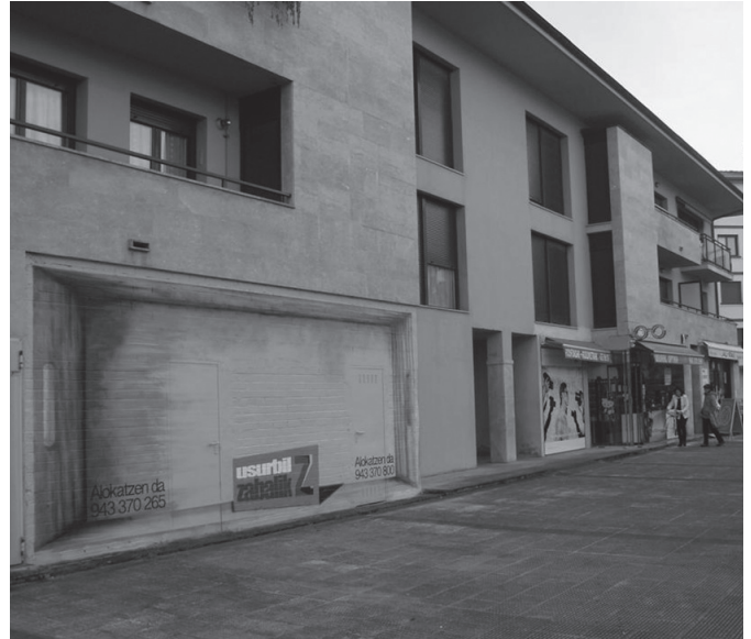
Hutsik dagoen merkataritza lokal batean jarduera ekonomiko berri bat jarri nahi duenak 5.500 euroko laguntza jaso dezake.

taldeetako prestakuntza teknikoak (1.000 euro), kirolariaren oinarriko osasun miaketak (5.000 euro), eskolaz kanpoko kirol jardueretan parte hartze-ko dirulaguntzak (5.000 euro). • Epea: abenduak 1.