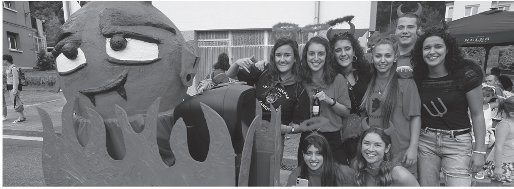
Irailaren 15ean arratsaldeko 17:00etan piztuko dute txupinazoa.