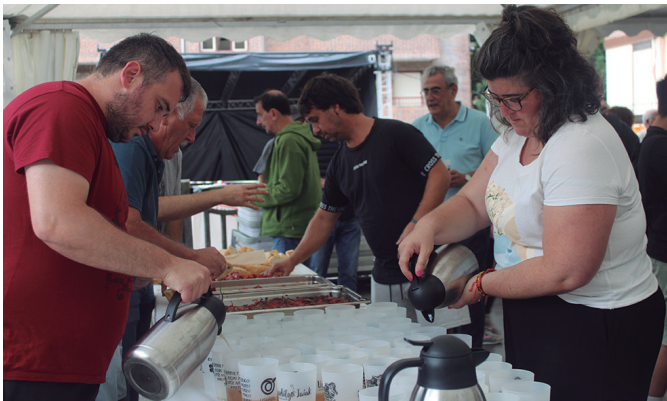
Bapo jan eta edateko aukera bikaina izan da beste urte batez Atxegalden.