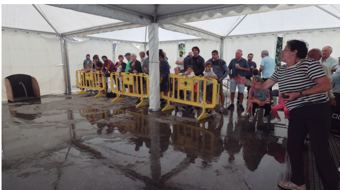
Gaztetxoek eta helduen arteko toka txapelketak jokatu ziren Atxegalden.