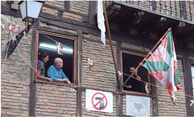
Santio bezperan, arratsaldeko 18:00etan piztu zuten jaien hasierako suziria.