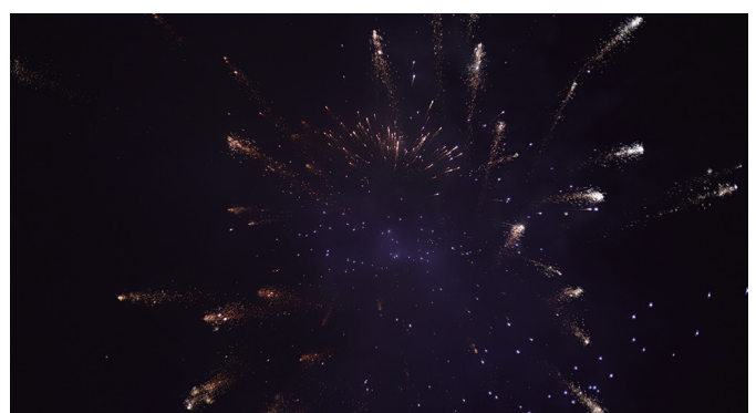
Jaiei agur esan zieten suziri eta trakarekin. Irudi gehiago: noaua.eus .