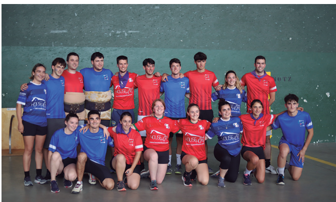
'Desafiyuan', Jai Batzordeko kideak eta herritarrak bi taldetan banatu ziren.