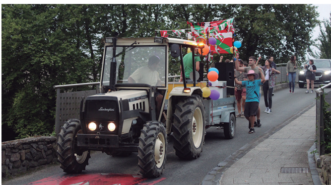
Traktopoteoak Urdaigako festa giroa herri erdiguneraino ekarri zuen.