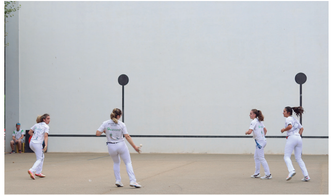
Mendizabal-Arrillaga eta Larrarte-Erasun arteko partida ikusgarria izan zen.