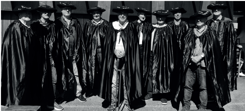
Baba beltz txikiaren kofradiako hainbat kide, Saizar sagardotegi atarian ateratako talde argazkian.

Gustura asko atera dituzte aurten ere babak eltzetik ondoko irudiko lagunek. Duela lau hamarkadatik gora egin duten moduan, abuztuko azken ostegunean elkartu zen Saizar sagardotegian Usurbilgo baba beltz txikiari gorazarre egiten dion kofradia. Jaki hau zuen bazkaria dastatu ostean, iaz iragarritako kofradekide berriari harrera egin