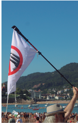
Igande honetan, Kontxan.

Ohi bezala, 11:00etan abiatuko da Alderdi Ederretik eta