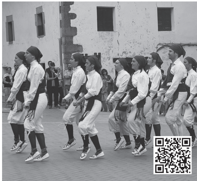
Orbeldi dantza taldekoen ikastaroetan matrikulatzeko garaia duzue. NOAUA!

Euskara ikasteko maila guztiak, Mintzalagun, autoikas-kuntza... Eskaintza zabala da. Izen-ematea astelehentik ostiralera ordutegi honetan: 11:00-13:00 / 17:00-19:30 (arratsaldeko ordutegia, astelehentik ostegunera).