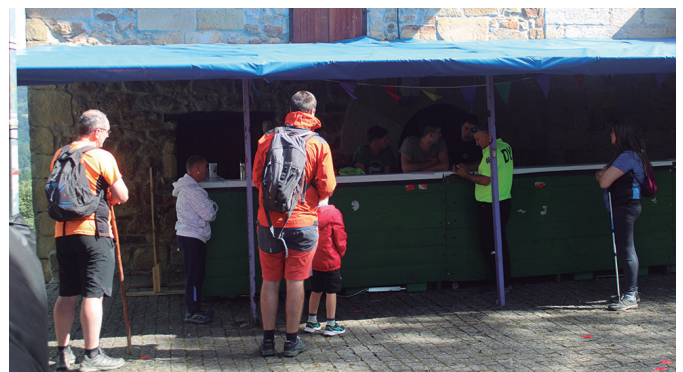
Festak ibilaldi neurtu batekin borobildu zituzten. Irudi gehiago: noaua.eus .