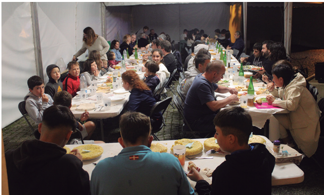
Belaunaldi ezberdinetako sukaldariak aritu ziren patata tortilla lehiaketan.