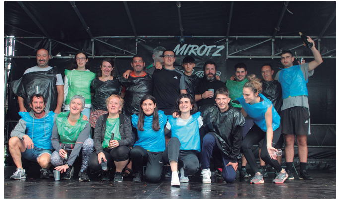
Auzokideek jolas ezberdinetan neurtu zituzten indarrak.