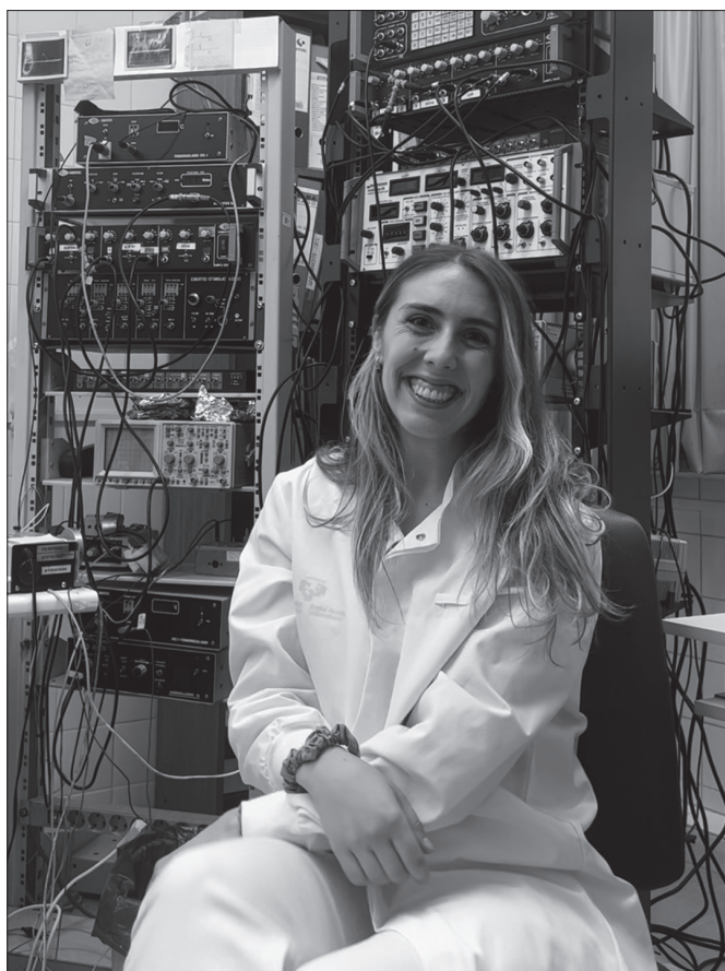
"Parkinsonarekiko interesa masterretik datorkit".