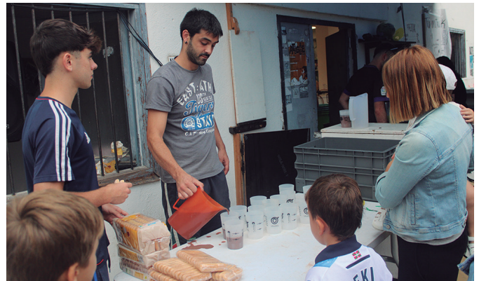
Haurren egunean txokolate-jana eskaini zieten bertaratu ziren guztiei.