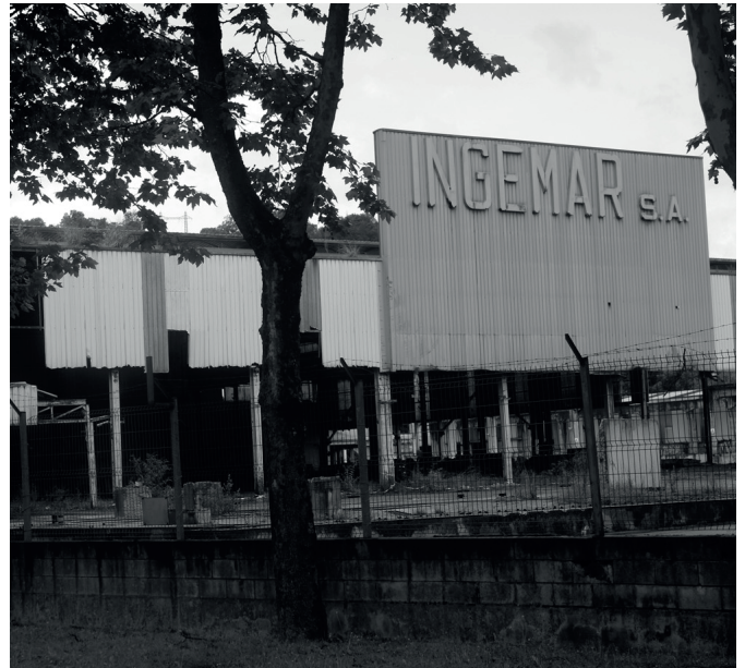
Ingemar lantegiaren ataria.

Maiatza hasieran jaso zuen Lugoko epaitegiko epaia eta hitzarmen aldatu horretara batzeko bi hilabeteko epea ireki zen. Bi aukera zituen Udalak; aldatuta hau onartu edo ezezkoa ematea. "Hitzarmenaren aldatuta ez onartzeak enpresa likidatzea ekar zezakeen, eta eskenatoki hori inorentzat ez zen egokia, izan ere, zorrak inoiz ez kobratzea ekar zezakeelako, eta Ingemarrek zor handia du askorekin, tartean Usurbilgo Udalarekin".