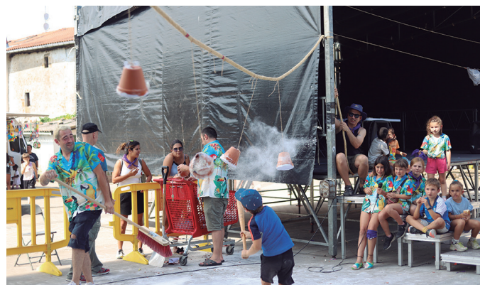
Globo gerrarekin bukatu zen Umeen Eguneako egitaraua.