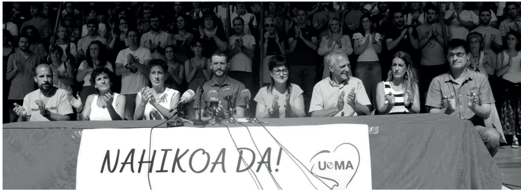
Udalerrri euskaldunetako alkate eta hautetsiek uztailearen 7an frontoian egin zuten agerraldia. NOAUA!