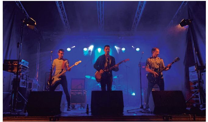
Zaparra eta Neskatasuna taldeak aritu ziren abuztuaren 26an.