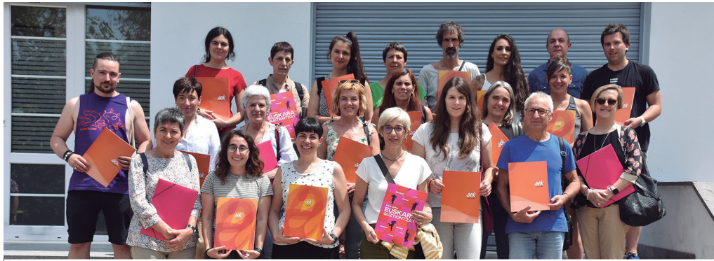
Buruntzaldeko euskaltegiatiko kideak, Astigarragan ateratako familia-argazkian.