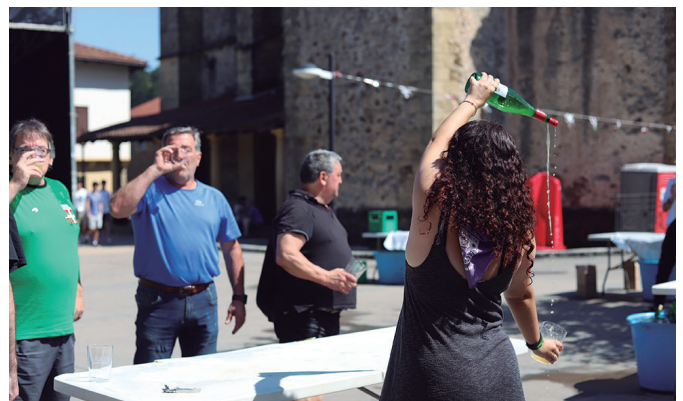
Sagardo dastaketa egunean bero handia egin zuen.