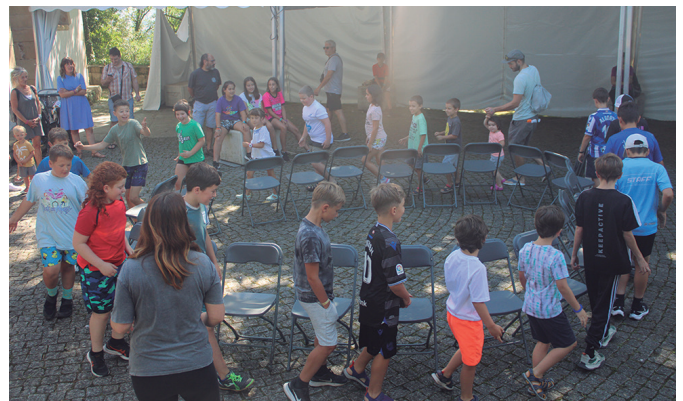
Aulki nahiz globo jokoetan aritu ziren Umeen Egunean.