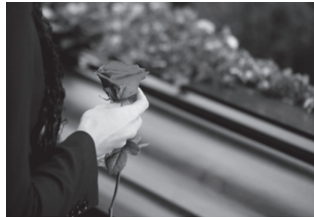
"Guztiok esperantzaz jantziko gaituen agurra behar dugu".

Agurra zeremonia hori prestatzerakoan San Agustinen testu bat proposatu nion. Honela hasten da: "Heriotza ez da ezer. Ni aldameneko gelara joan naiz. Ni neu naiz eta zu zeu zara. Bata bestearentzat ginena, halaxe izaten jarraitzen dugu. Zain naukazu. Ez nago urruti, bidearen beste aldean bakarrik. Haria ez da eten. Berriz ere aurkituko duzu nire bihotza". San Agustinen testu honekin guztiz bat zetorrela esan zidan. Beste