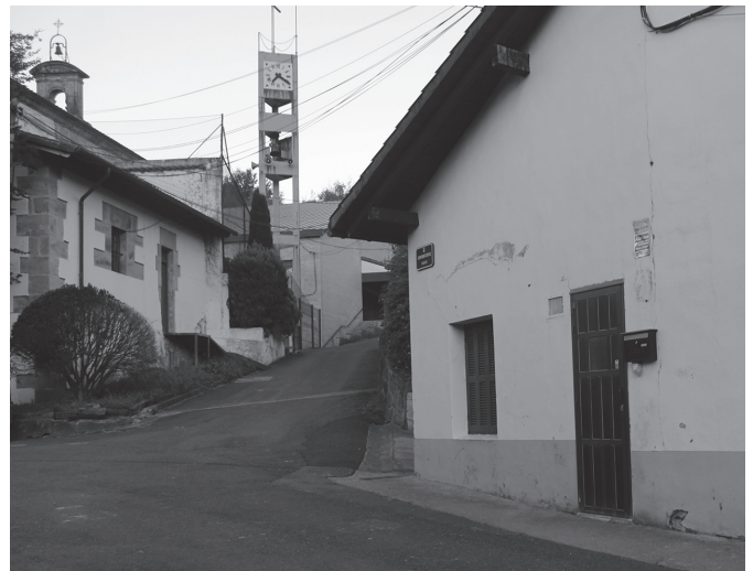
"Añarbek eta URA agentziak saneamendu lanak egin behar dituzte egunotan".

10 egun beharko dituzte saneamendu-lanak burutzeko Denbora tarte horretan, "Aginagako Eliza Zahar aldeko sarrera trafikoarentzat itxiko dute". Ez egunero, ordea. San Praixkuetan murgildu berri den Aginagan, jai egunotan bertatik igarotzeko aukera izango da. "San Praixku egunean zein festetako bi asteburuetan bidea irekita egongo da", Usurbilgo Udalak iragarri duenez.