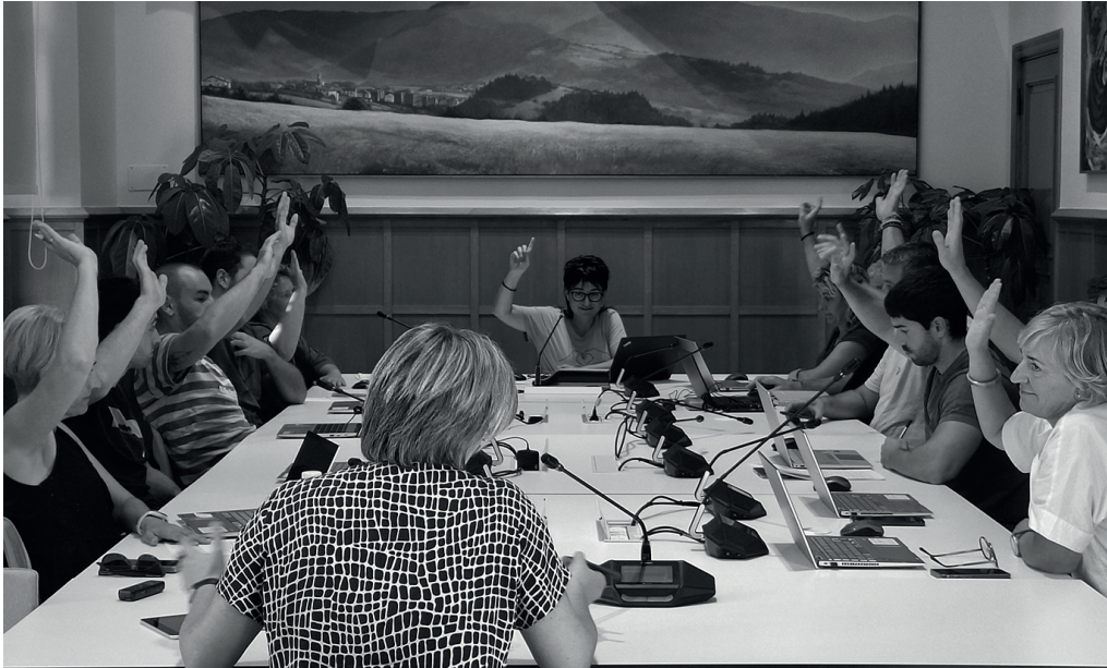
Udako etenaldiaren ondorengo lehen osoko bilkura egin zuten joan den irailaren 28an. NOAUA!