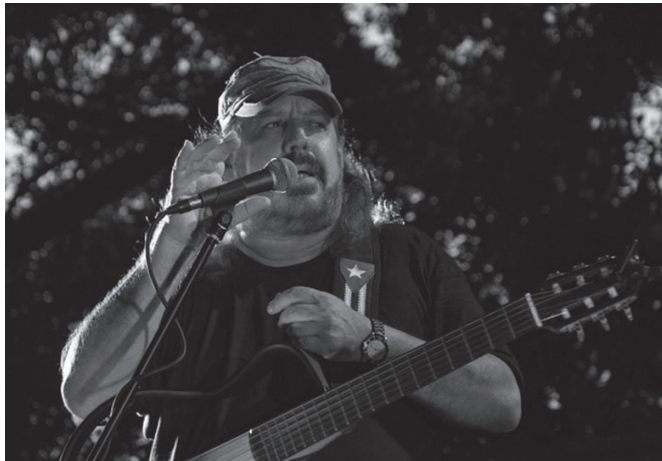
Igande honetan, Kubako doinuak nagusi izango dira Sutegin.

Izen-ematea: 650usurbilbizi.eus. 12:00etan Sutegin.