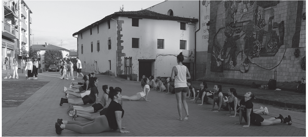
Ostiral arratsaldean, lagun kuadrilla hau elkartu zen Egoa Alvaradoren entrenamenduan.

Gipuzkoako Foru Aldundiak emakumeen aktibotasuna sustatu nahi du. Jarduera fisikoaren garrantzia azpimarratzeko helburuarekin, kanpaina bat abiarazi berri du. Aplikazio bat sortu dute eta herriz herri ari dira egitasmoa plazaratzen. Aurreko ostiralean Usurbilen izan ziren, aplikazioaren berri ematen.