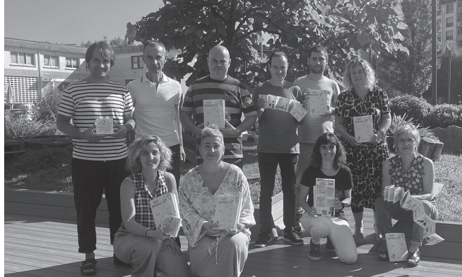
Jaioberriei luzatu ohi zaien materiala eguneratzearekin batera, euskara.buruntzaldea.eus webgunea ere berri dute jakinarazi dute.

Gainera, jolas, abesti eta esae guzti-guztiak euskarri digitalean ere jaso dira; euskarri fisikotik, QR kodeen bidez, atari digitalera salto