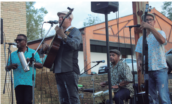
"Son de hoy" taldearen erritmo kubatarrekin abiarazi zituzten jaiak. NOAUA!