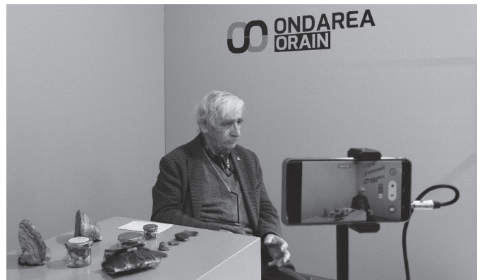
"Ferminen bizitza osoa pasa du hango eta hemengo lanabesak jasotzen". ARANZADI