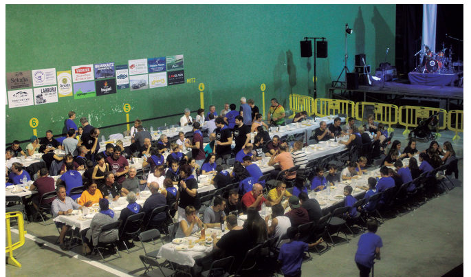
Herri afaria izaten da jaietako aginagarren bilgune nagusia. NOAUA!