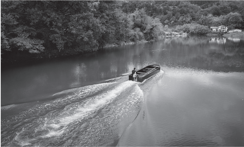
Larunbat honetan Errioren Eguna ospatuko dute Aginagan.