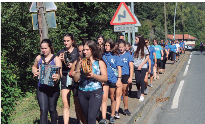
Oilasko biltzaileen talde jendetsua Mapiletik Kaxkorantz. NOAUA!