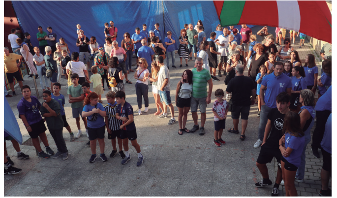
Jaien hasiera ekitaldira joandakoak, txupinazoko balkoira begira. NOAUA!