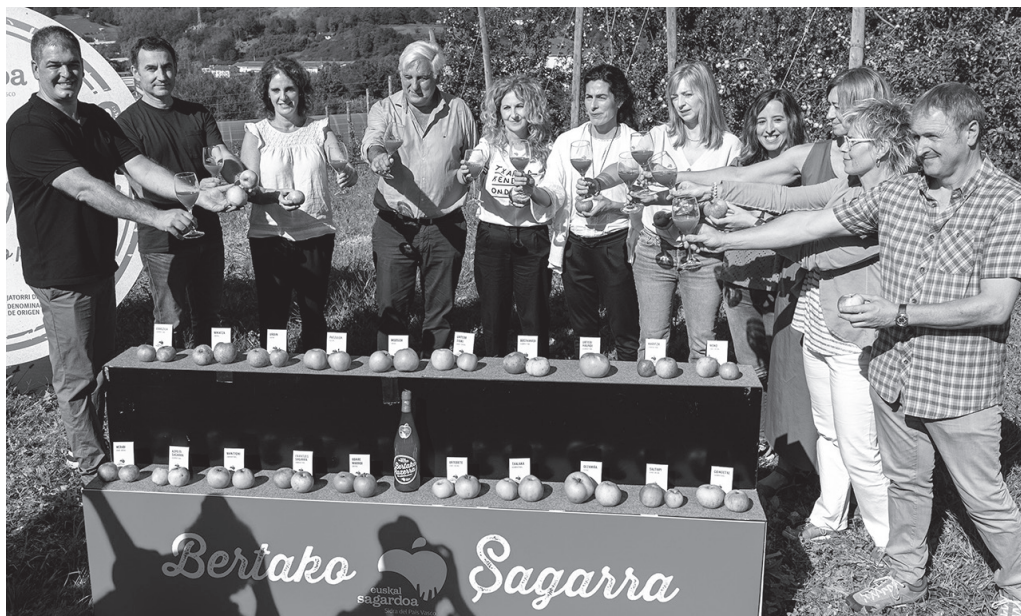
"Uzta handia espero da". Euskal Sagardoaren sustatzaileek prentsaurrekoa eskaini zuten Villabonako Otarrea sagastian.