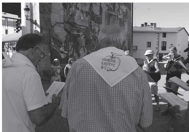
Aurrerantzean, hilabetezko azken larunbatean arituko dira kalejiran.

Entseguekin ere hasita daude. Astelehenero biltzen dira, arratsaldeko 18:00etan hasita, Agerialdeko musika gelan.