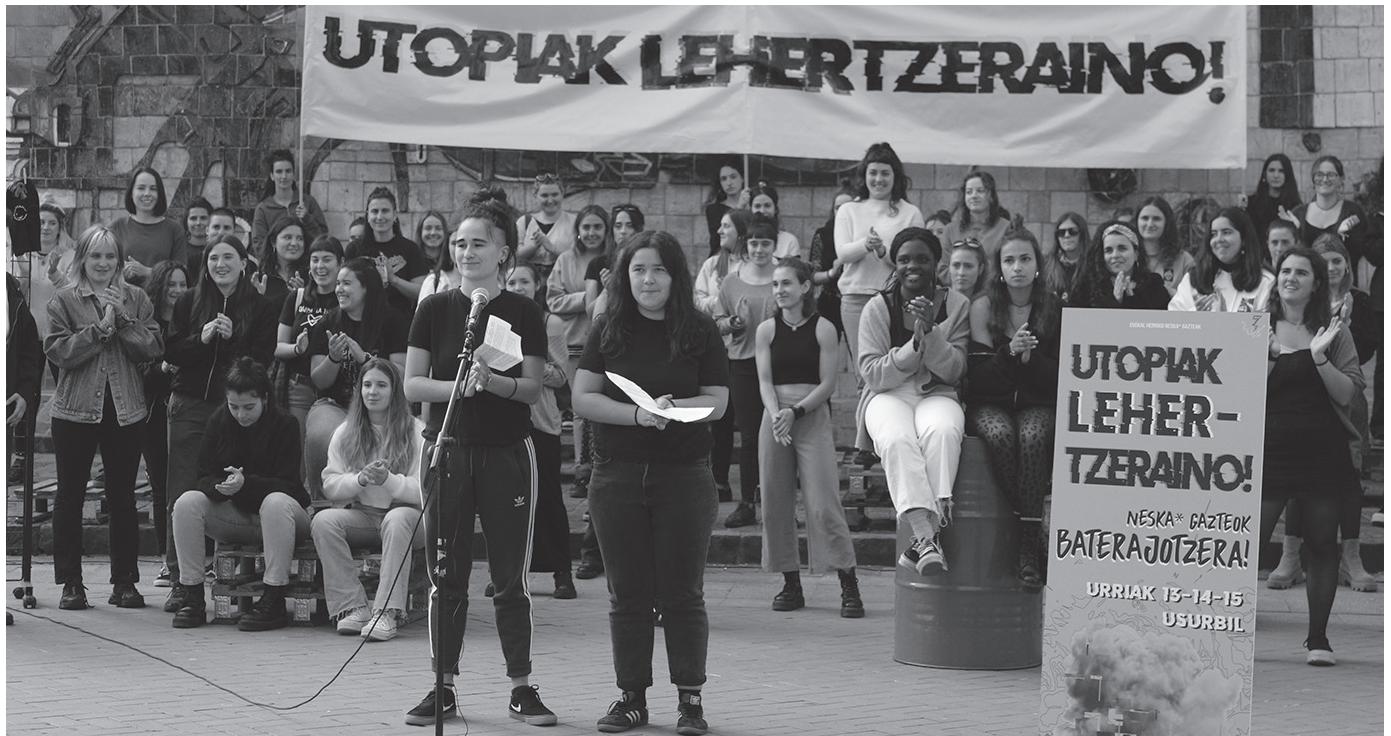
Baterajotzea, Euskal Herri mailako topaketa feminista, urriaren 13tik 15era ospatuko da Usurbilen. NOAUA