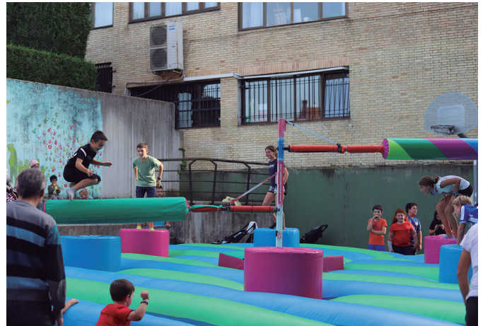
Ostiral arratsaldean puzgarriak ipiniko dituzte frontoian.