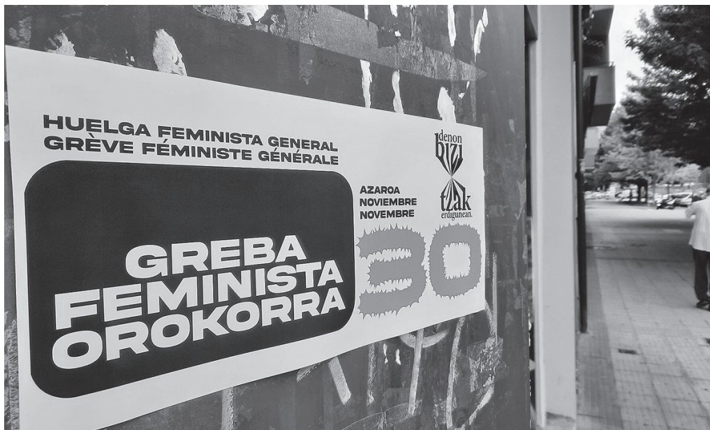
Euskal Herriko Mugimendu Feministak egin du azaroaren 30erako greba deialdia.