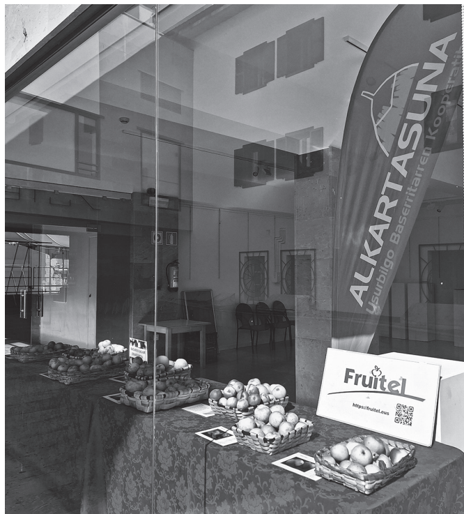
Sutegin erakusketa urriaren 9ra arte izango duzue ikusgai.

Gutxienez, 21 sagar mota batu dituzte: Goikoetxe, pelestriña, errezilla, haritza... Baina mota gehiago batu nahi erakusketarako eta horretarako laguntza eskatua dute. "Gonbita egiten diogu etxean sagarra duen orori, kooperatibara ekar dezan, bilduma osatzeko".