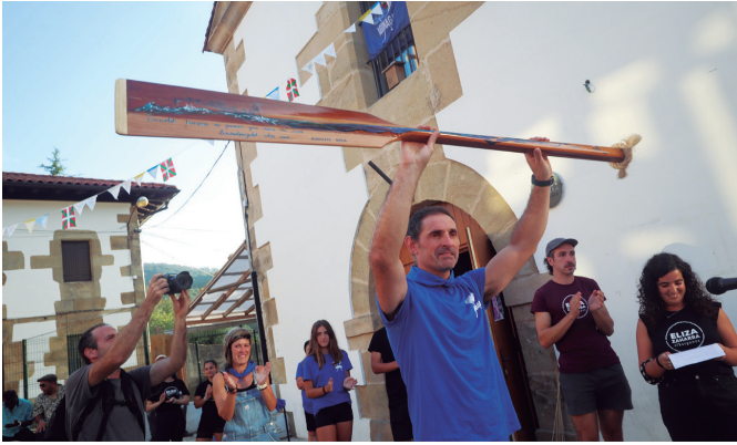
Iñaki Errastik jaien hasieran oparitu zioten arrauna goratu zuen ueña. NOAUA!