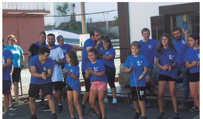
Uda giro beteko goiza izan zuten oilasko biltzaileek. NOAUA!