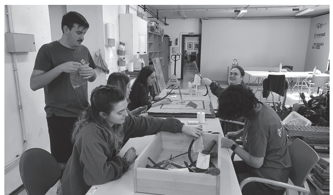
"Materiala jaso bezala dago. Pieza batzuk zikinak daude, besteak apurtuta..."