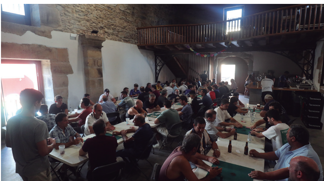
Mus jokalariek Eliza Zaharra goraino bete zuten jaietako txapelketan. NOAUA!