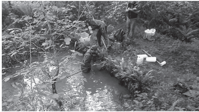
"Putzuek agerian egon behar dute, eta horrek asko zailtzen du kudeaketa".

Badugu Hego Euskal Herrian oso antzekoa den beste espezie bat ere, baina hura ez genuke Gipuzkoako inguru hauetan aurkituko. Zuhaitz Igel Iberiarra da hori, baina juxtu inguru hauetan ez da bizi. Igel hauen berezitasuna da igokariak direla, hau da, zuhaitzetara edo altuera batzuetara igotzeko gai direla. Zuhaitzetan gora igo daitezke eta arrak emea kantuen bidez erakartzen dute. Beraz, bereizgarri nagusiak bi dira: kantu ozenak (ia kilometro batera entzun daitezke euren kantuak) eta zuhaitzetara igotzeko gaitasuna. Gainontzeko beste espezie arruntek ez dute horrelako berezitasunik. Orokorrean, oso espezie liraina da eta oso txikia. Normalean, 4-5 zentimetrokoak dira.