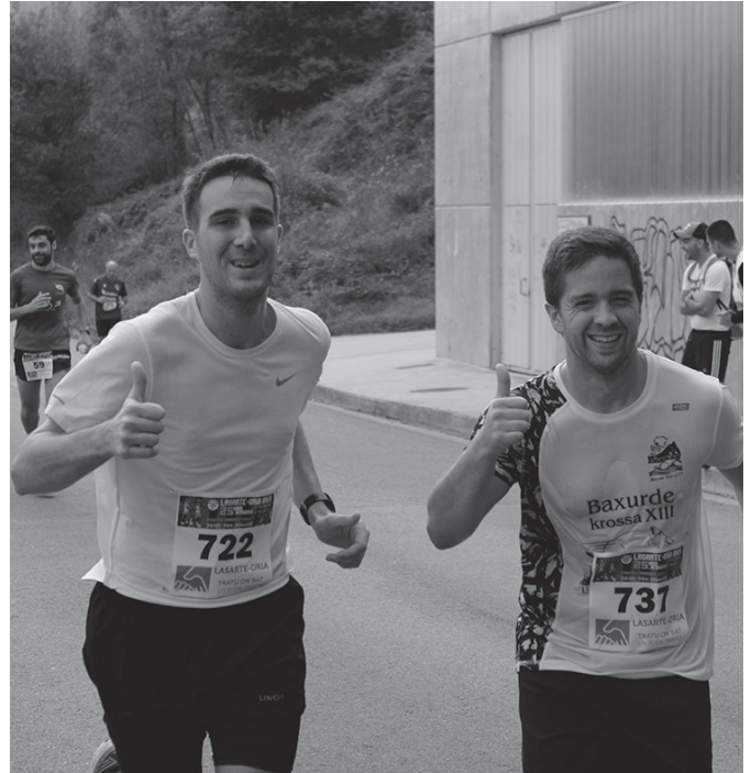
Probarako izen-ematea, ostadarskt.eus web orrialdean.

zubirantz joko dute gero. Txikiertit barrena, Michelin paretik Okendo plazara joko dute amaitzeko. Bertan kokatuko dute, hamar kilometroko ibilbidearen helmuga. Gelto-ki kaletik abiatuko da ekimena. Lasterkariak, patinatzaileak eta ipar martxalariak parte hartu ahalko dute. Probarako izena ostadarskt.eus atarian eman ahalko da.