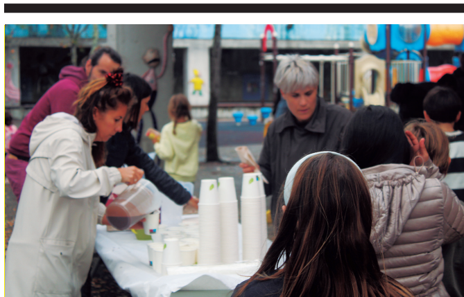
Txokolate jana egin zuten urriaren 20an Askatasuna plazan. NOAUA!