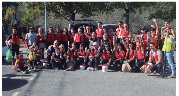
Behoria Garbia Egunean parte hartu zuen taldeetako bat. NOAUA!