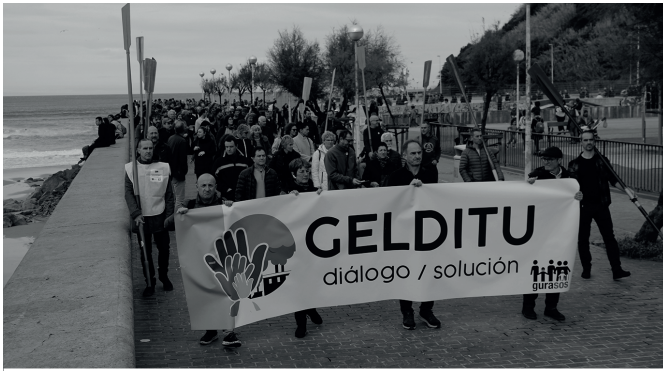
"Nire gain" bonoak eskuragarri dituzue NOAUA!n eta Aitzaga tabernan.