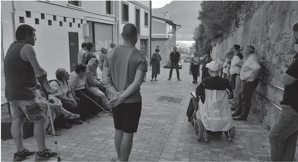
Duela bi aste Etxealdiako bizilagunekin bildu zen Usurbilgo Udala.