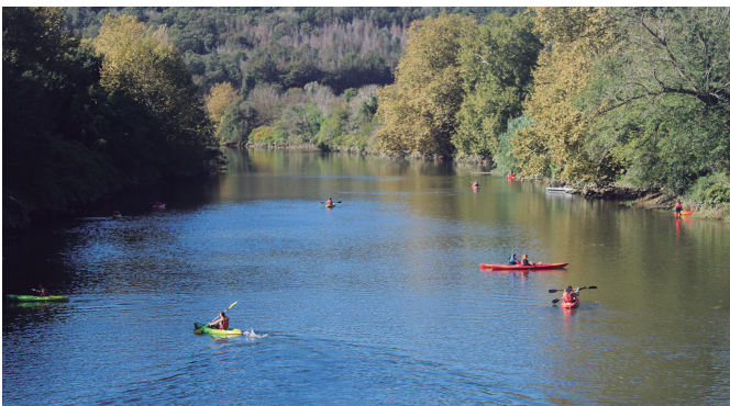
Behoria Garbi Eguneako Oriako jaitsiera. Hondakinak biltzen aritu ziren. NOAUA!