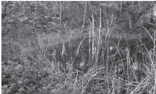
Artikulaundiko putzua, 2021ean eginiko argazkian.