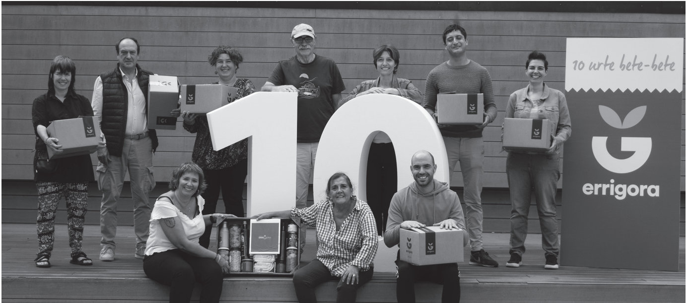
Hastapenetan bezala, 50 eurotako saski bakarria egongo da eskuragarri. Barruan, "23 ekoizleren 9 produktu ekologiko eta konbentzionalak nahasian".