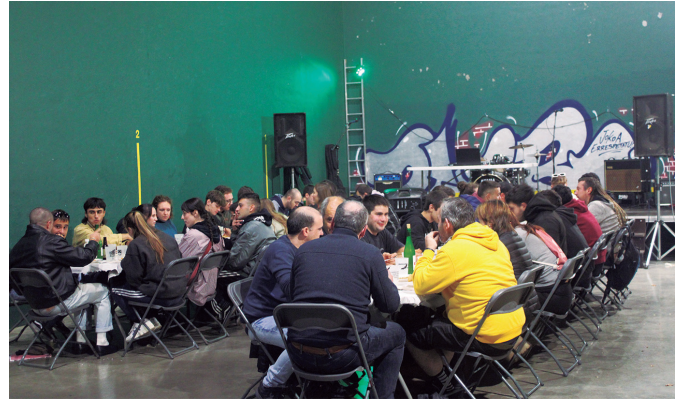
2. Akerra Egunez Txokoaldeko frontoian egin zuten afaria. NOAUA!