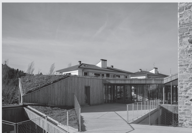
Zumarte Musika Eskolak hainbat ikastaro iragarri ditu. Izen-ematea urriaren 29an amaituko da; online egin behar da, zumarte.eus webgunean.