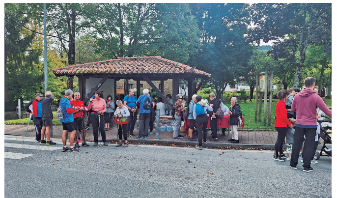
Tipi-tapa ibili ziren Buruntzaldeko 15. Ibilbideen Egunean. NOAUA!