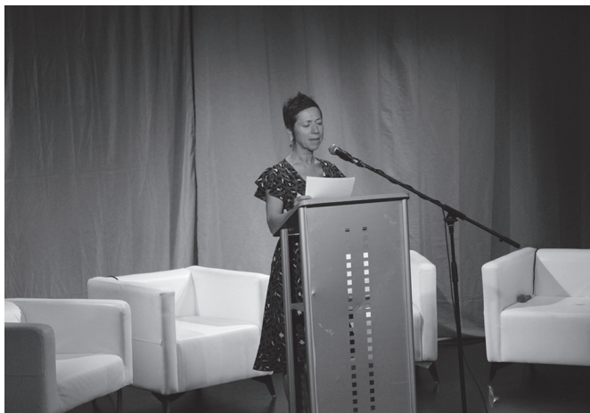
Poesia irakurraldia Sutegin egingo da, eguerdiko 11:00etan.

Izen-ematea: 650usurbilbizi.eus. 12:00etan, Sutegin.