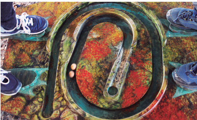
Jokairen jolas mitologikoein primeran pasa zuten urriaren 20an. NOAUA!