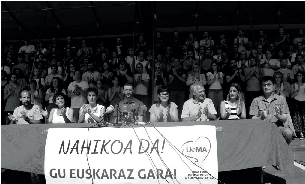
Euskararen aurkako epaietako bat salatzeako alkate eta hautetsiek uztailean frontoian eginiko agerraldi jendetsua. NOAUA!