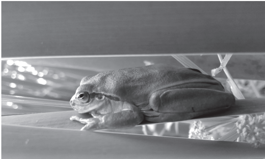
"Duela gutxiko EAEko espezie mehatxatuen zerrendan espezie bakarra geneukan, Hegoaldeko zuhaitz igela".