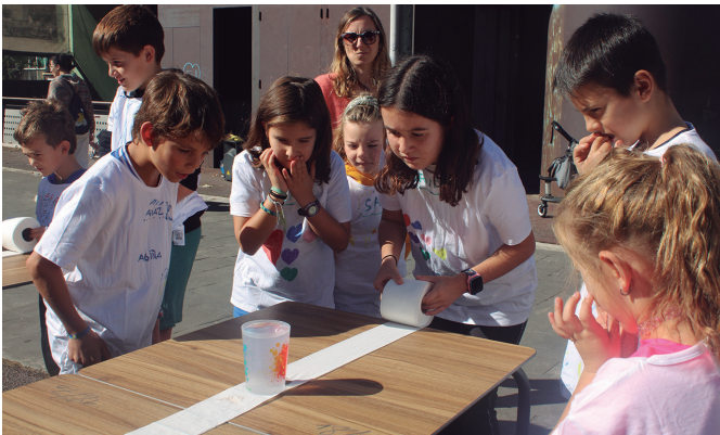
Taldeakako jolasekin ekin zioten Aginagako Eskola Egunari. NOAUA!