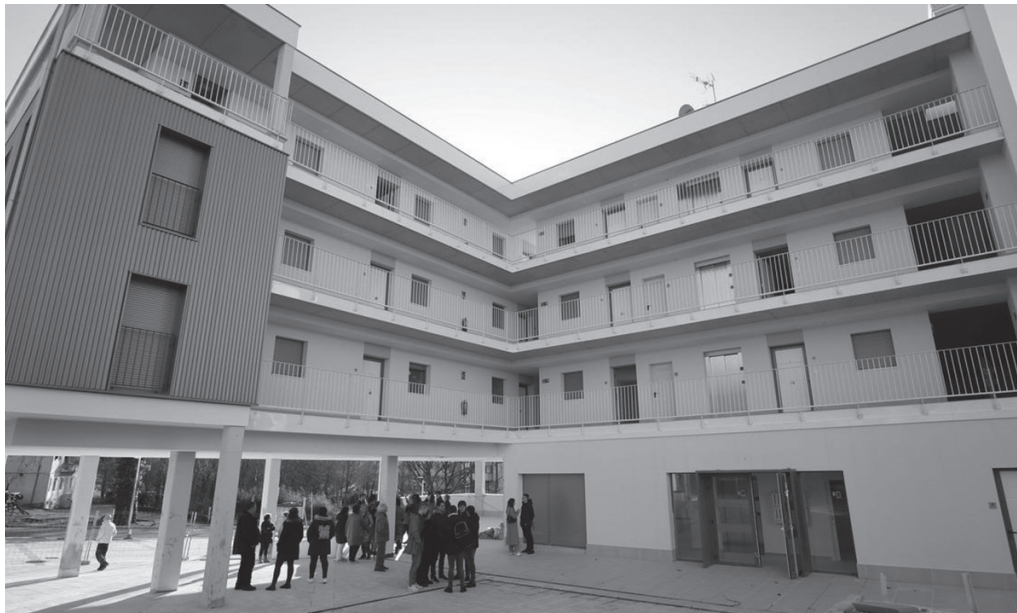
Txirikordako eraikitze lanak amaitzeko, obren exekuzio kontratua suntsitzea erabaki du udalbatzak. NOAUA