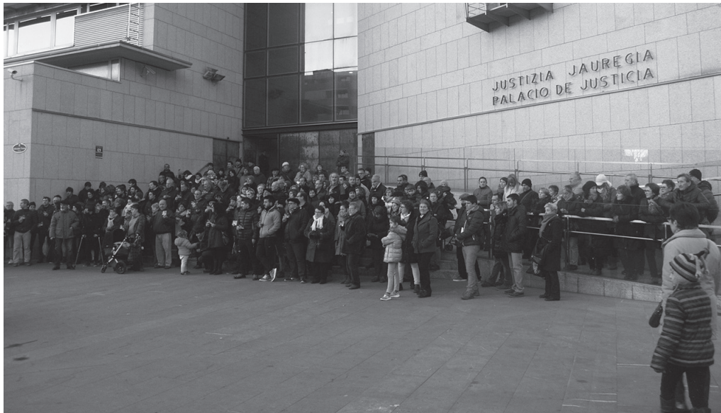
GuraSOsek oroitarazi zuenez, "funtzionarioak ustez ezikusiarena egin zuen ingurumen arau-hauste larrien aurrean".