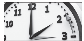
Goizeko 3:00etan 2:00ak izango dira.

Neguko ordutegira egokitu beharko ditugu erlojuak aste-buru honetan. Urriaren 28tik 29rako goizaldeko 3:00etan 2:00ak izango dira. Beraz, ordubete "gehiago" izango du larunbat gauak. Biharamunetik aurrera, goizago ilunduko du.