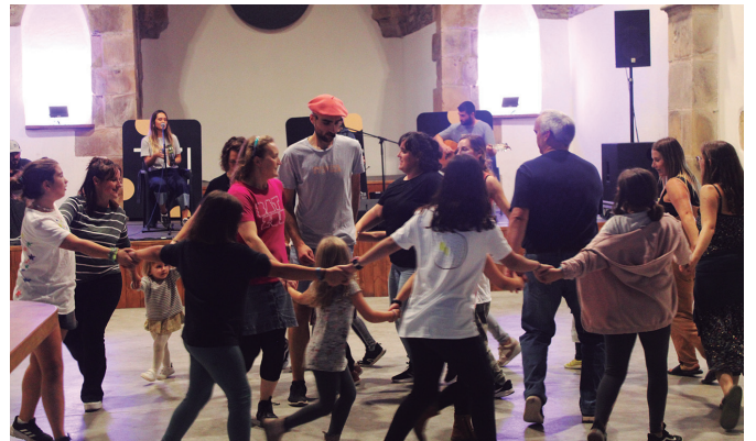
Ttipikakoein dantza giro bizian agurtu zuten Aginagako Eskola Eguna. NOAUA!