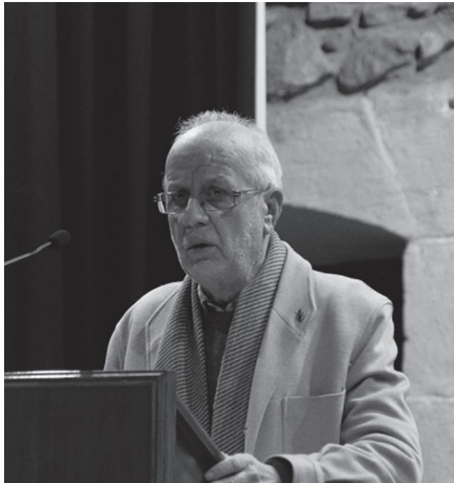
"Historialariak profeta haiek bezala sentitzen gara batzuetan, desertuan alperrik deklamatzeko".

Galiziarra jaiotzez, aspaldi bizi zara Euskal Herrian. Galiziera eta euskara menderatzen dituzu. Nola moldatzen zara katalanarekin? Galiziera menderatzen dut, eskolan gazteleraz alfabetatua