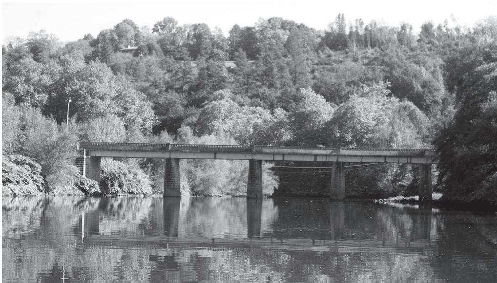
Saneamendu lanak tarteko, zubia bost orduz itxiko dute ostegun honetan, hilak 26.

Saneamendu lanak tarteko, itxi egingo dute zubia bost orduz; ostegun goizeko 9:30ean hasi eta eguerdiko 12:30ak arte lehenik; baita gerora ere, 14:00-16:00 artean, Udaletik ohartarazi dutenez.