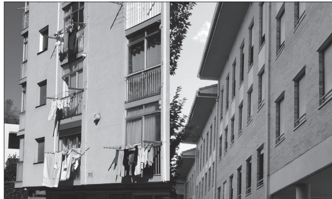
"Harrigarria egin zait bereizketa: auzo zaharragoetan arropak zintzilik ikusten dira lehor daitezen eta auzo berriagoetan ez".

Harrigarria egin zait bereizketa: auzo zaharragoetako etxeetan arropak zintzilik ikus-