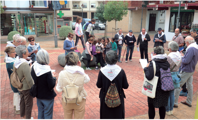
Urriko kantu-jirara belaunaldi berria batu zen abestera. NOAUA!