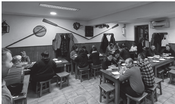
Bertso-afari eta txapelketen Kultur Asteburua izan dute Txokoalden.