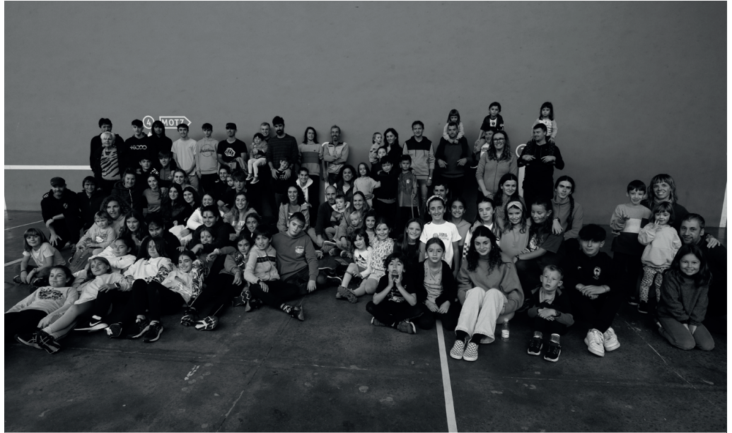
Munduko jolasekin ekin zioten Mundualdiari. Irudian, parte hartzaileek atera zuten talde argazkia.

Hartuemanetarako aukera ezinhobearen izan zen hain zuzen, Mundualdi egunean, sorterri ezberdinetako herrikideek prestaturiko jakien dastaketa arrakastatsuan. Pakistan, Galiza, Mauritania, Nigeria, Nikaragua, Sahara, Venezuela, Kuba... Herrialde hauetan guztietan barneratzeak aukera izan genuen tokian tokiko zapo ederren bidetik, frontoitik mugitu ere egin gabe. Sorterri ezberdinetako herrikideek mimo handiz prestaturiko haien jakiak dastagai jarri zizkiguten. Ohi bezala, gastronomiaren bidez, hartueman ederra sortu zen herrikideen artean, jaioterria edozein dela ere bateko zein besteko herrikideak ezagutu eta harremanak sendotzea sustatzen duen jaialdian. "Gaur plaza honek Usurbilen bizi dugun jatorri eta kultura aniztasuna islatzen du. Elkar ezagutzen eta elkar topatzen jarraitzeko aukera paregabea eskaintzen digu gaurko jaialdia. Izan ere, Mundualdiak azken batean, guztion aterpe izan nahi baitu, guztion topagune", alkatearen esanetan. Ekimen honek bere esanetan,