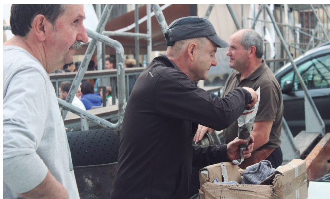
Herriko talogile eta gaztaingileak jo eta su lanean Artisau Azokan. NOAUA!