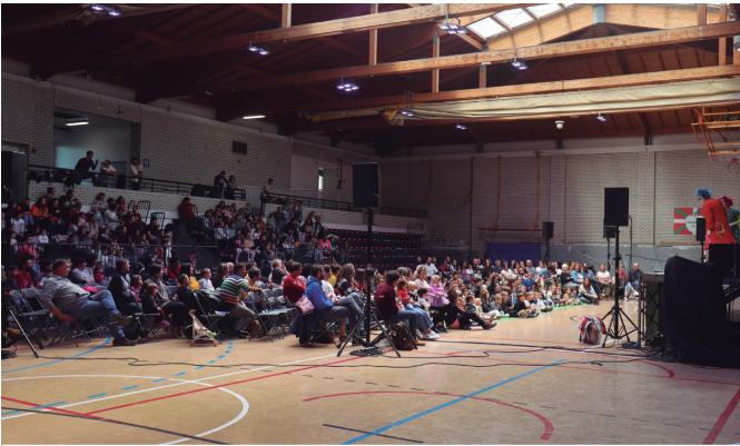
Milesker Ziortzakoei, 400 laguneko saioa antolatzen laguntzeagatik. NOAUA!