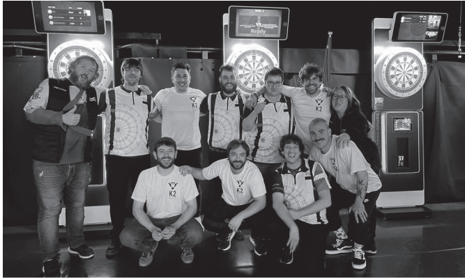
Usurbildarrek bosgarren postuan amaitu zuten.

Asteburuan Andorran jokatu den dardo Europako Txapelketan parte hartu du amateur mailan Usurbilgo ordezkariak; Aitzaga eta Xarma tabernetako taldeek.