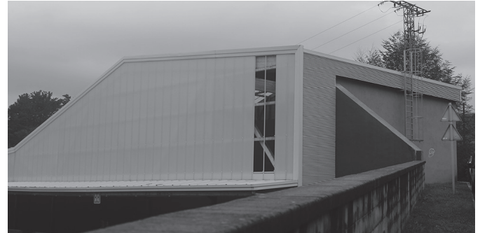
Agerialdeko frontoi eraberrituko bi xafla bota zituen haizeak iragan astean.

Udazkeneko lehen denboralea izan dugu egunotan. Haize bolada bortitzek ageriko kalteak eragin dituzte. Le-