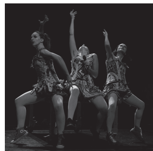
Azaroaren 19an, Sutegin.

Azaroaren 28rako iragarri duen '80 Amandre' helduentzako ipuin kontaketa aurretik, Kamikaz Kolektiboaren 'Hiru kortse, azukre asko eta Brandy gehiegi' antzezlan ekarriko du Parekidetasun Sailak Sute-gira. Azaroaren 19an, 19:00etan. Gonbidapenak aurrez eskuratu ahalko dira usurbilkultura. eus plataforman.