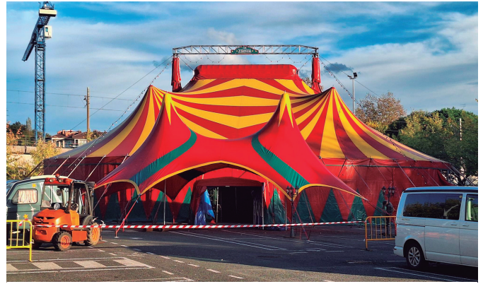
Gure Zirkua seigarren bira agurtzen ari da asteotan Urbilen. NOAUA!