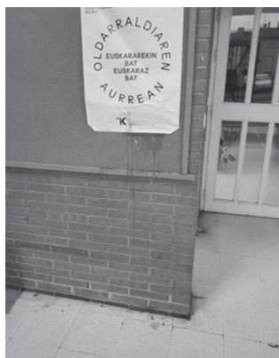
"Arrautza botaka ibiltzeko balentria izan duzun horrek garbitzera etortzeko balentria izan dezazula".

Usurbilen ere, Gau Beltza ospatu zen urriaren 31n. Biharamunean, azaroaren lehenan, jai eguna zuten Udarregi ikastolan. Azaroaren 2an, lanera itzuli zirenean, ikasleek zein irakasleek ekin-tza desatsegin batekin egin zuten topo. Ezezagunek arrautzak bota zituzten Euskalgintzaren Kontseiluak Bilbon deitu zuen manifestazioa iragartzeko karteletara. Irakasle talde batek salaketa-ohar bat bidali du NOAUA aldizkariko erredakziora.