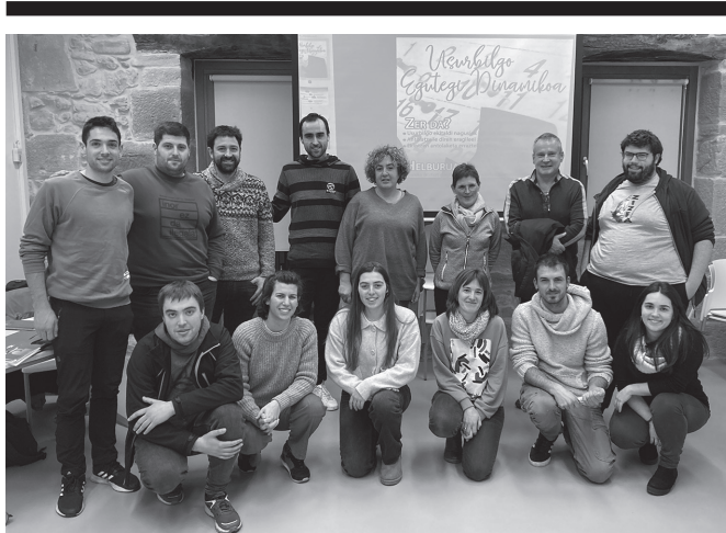
Ikasturte berriko lehen hitzordua izango da larunbat honetakoa.

NOAUA! Kulturaldia. Ixabel Agirresarobe ipuin kontalariak 2023ko sormen diru laguntzetan aurkeztu eta babestutako proiektua. Sarrera doan. Antolatzailea: NOAUA!. 18:00etan Sutejin.