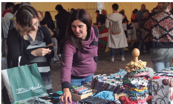
Azaroaren 1eko 27. Artisau Azokan askotariko ekoizleak batu ziren. NOAUA!