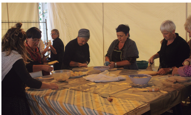
Herriko artisauak txoko propioa izan zuten azokan. NOAUA!