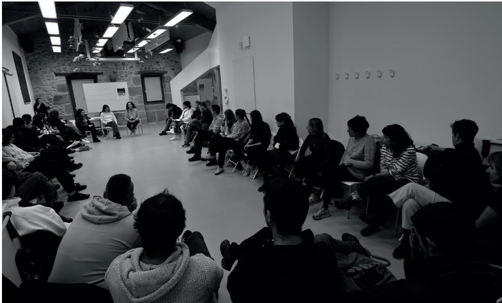
Azaroaren 30eko greba feminista orokorra prestatzeko, azaroaren 3an bilera egin zuten Potxoenean. NOAUA!