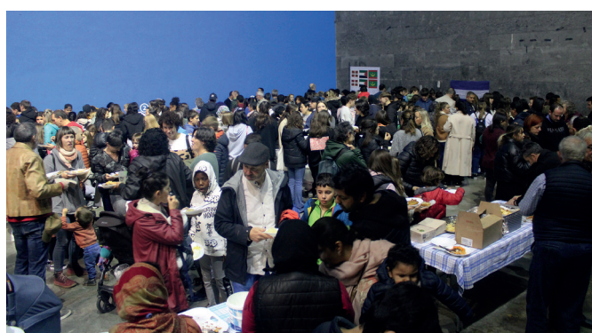
Hartuemanak sendotzeko balio izan zuen Mundualdiak. NOAUA!