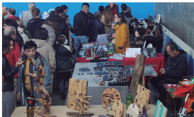
Artisau berriak erakarri zituen Aitzaga elkartearen ekimenak. NOAUA!