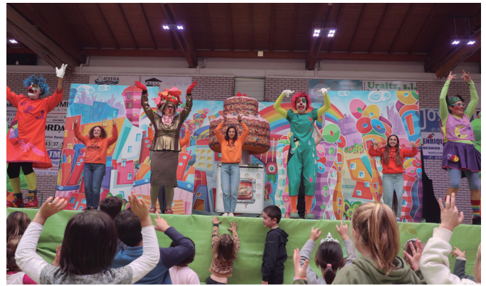
Ziortzak girotu zuen "Urteak bete, abenturak bizi!" emanaldi amaiera. NOAUA!