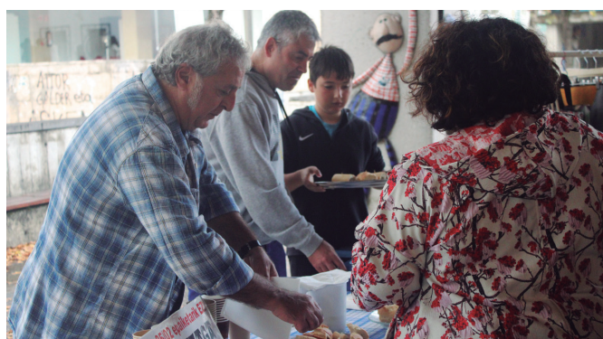
Antolakuntzak (Aitzagak) ere postua izan zuen Artisau Azokan. NOAUA!