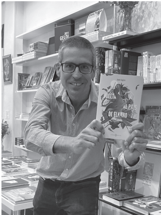
"Bizitza oso konplikatu da eta ezin dira oso azalpen eskematikoak eman errealitatea ulertarazteko garaian". ELKANO FUNDAZIOA.

Atzera begira jartzen garenean gainera, topikoak eta mitoak sartzen dira jokoan.