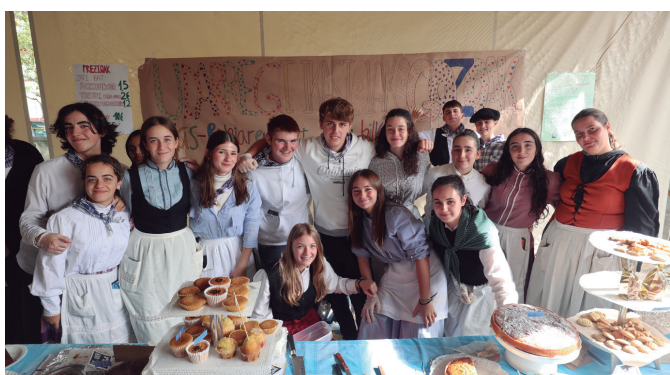
Udarregiko ikasleek gozogintzako postu ederra atondu zuten. NOAUA!