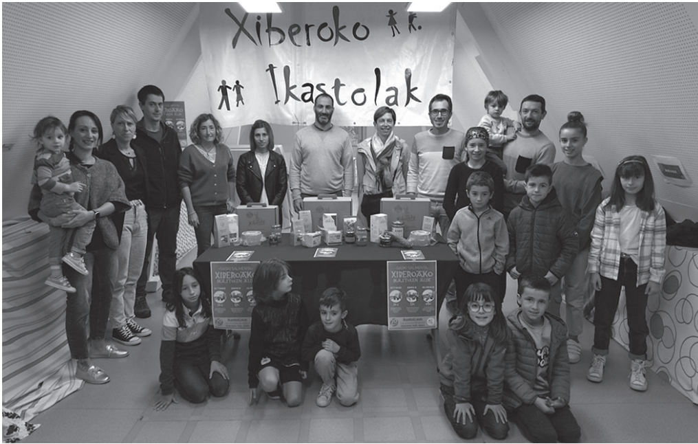
"20 urtez Xiberoko Ikastolan alde elkartasuna hedatzen!" lemapean iragarri dute aurtengo kanpaina. Honakoan ere, hiru saski ezberdin prestatu dituzte. Eskaerak egiteko epea zabaldu berri da.