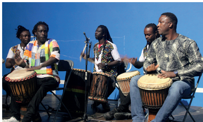
Senegalgo Ndank-Ndank taldekoen emanaldia Mundualdian. NOAUA!