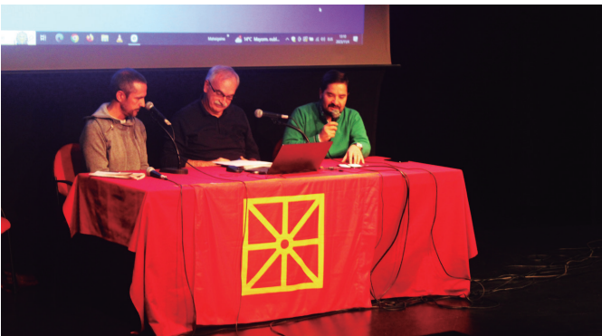
Nafartarrak taldekoek Sutegin antolaturiko jardunaldi eguna. NOAUA!