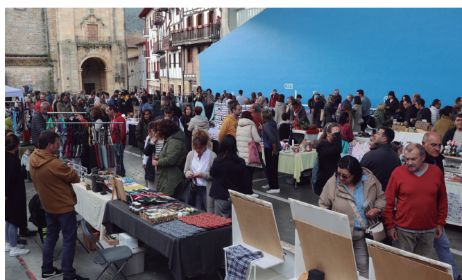
Osteratxoa egin eta erosketak egiteko baliatu zuten hitzordua bisitariek. NOAUA!