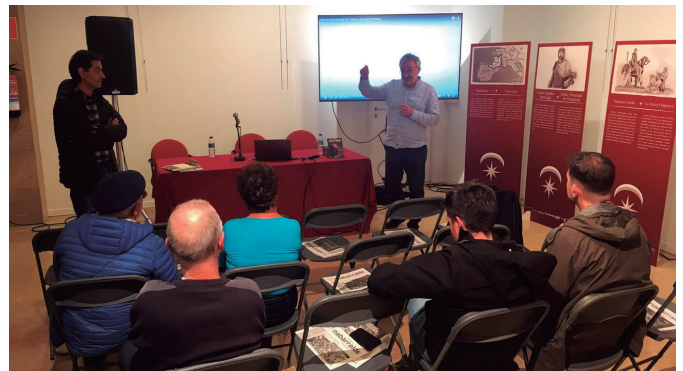
"Krutwig. Bere mendeurrenean berrirakurtzen" liburuen aurkezpena. NOAUA!