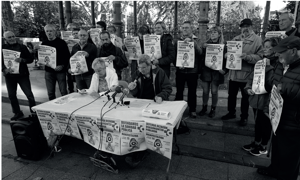
Osasun Publikoaren Aldeko Herri Plataformek aste hasieran Donostian eginiko agerraldia. NOAUA!