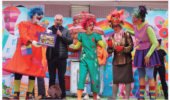
Haien 50. urtemugagatik Zuberoako ikastolak zoriondu zituzten. NOAUA!