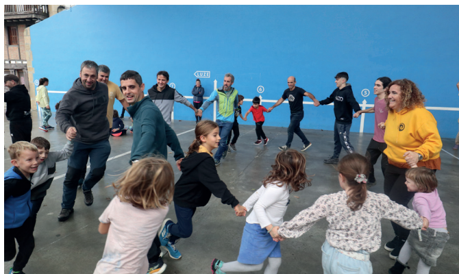
Munduko jolasekin ekin zioten azaroaren 4ko Mundualdiari. NOAUA!