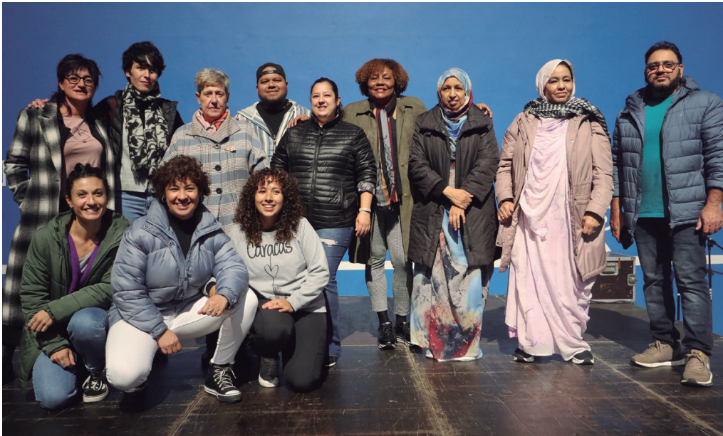
Aniztasun Kontseiluko kideek Mundualdian egin zuten agerraldia. NOAUA