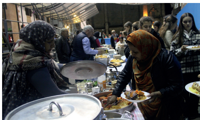
Mimo handiz prestatu zituzten Mundualdirako jakiak. NOAUA!