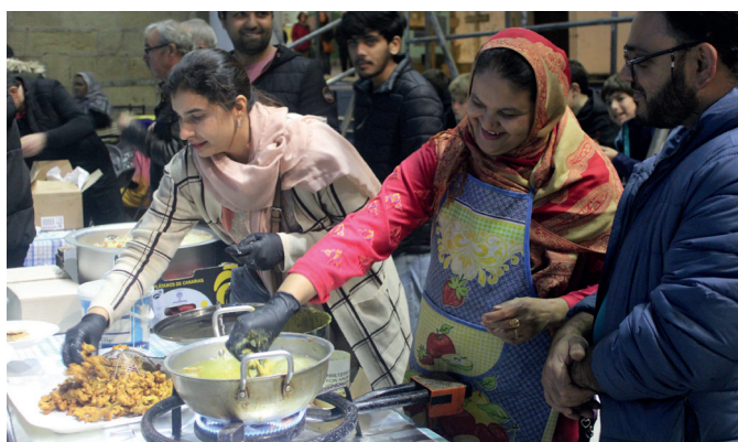
Pakistandarrak izan ziren postu propioa izan zuten herrikide batzuk. NOAUA!