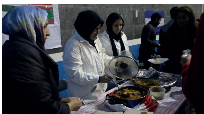
Tokian tokiko elikagaiak dastagai, azaroaren 4ko Mundualdian. NOAUA!