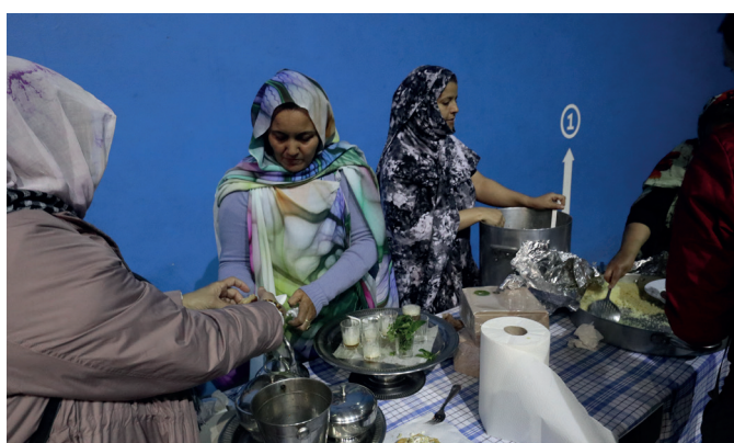
Sorterri ezberdinetako herrikideek jaki goxo askoak sukaldatu zituzten. NOAUA!