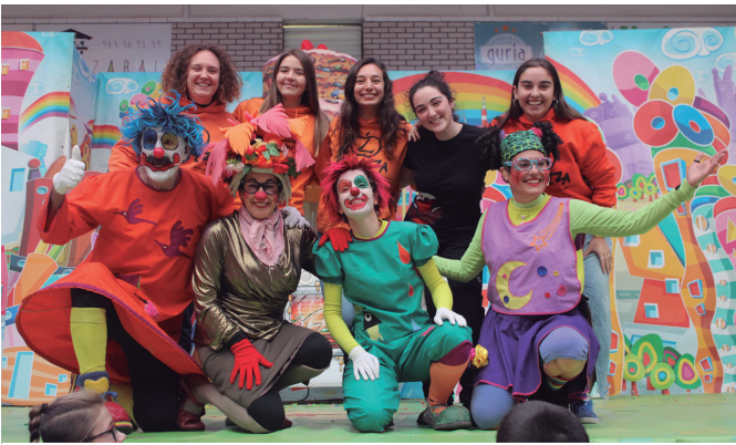
Ziortzaren jardunari aitortza, Pirritx, Porrotx eta Marimototsen saioan. NOAUA!