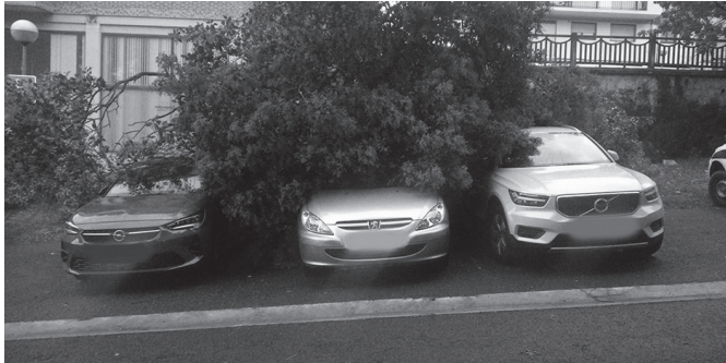
Atxegalden, haizeak zuhaitz bat bota eta hiru auto harrapatu zituen azpian.