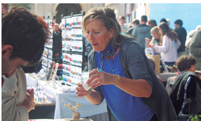
Euskal Herriko nahiz gertuko artisauak batu zituen azokak. NOAUA!