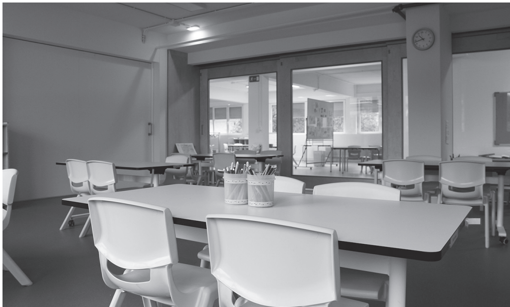
Pareten orde, atek daude orain Agerialdeko ikasgeletan. Behar denean ireki eta bi gela elkartzeko, edota pasilloa bera gelaren osagarri egiteko. Espazioak balioanitzak dira eta txoko denak dira eskola emateko baliogarri.

→ hain zuzen, solairu horretako txoko desberdinak bisitatzeko aukera izango dugu. Bisita gainera, gidatua izango da; espazioen antolaketa eta diseinua Udarregi ikastolaren pedagogia beharretara egokitu da. Espazio irekiak, gardenak, balioanitzak, integratzaileak, erosoak eta goxoak sortu nahi izan ditugu. Eta balio horietara egokitu dugu Agerialdeko bigarren solairuko espazioa. Bisita gidatua zehar, behar adina azalpen emango dira.