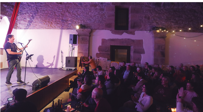
Goraino beteta zen aretoa. Argazkian, EH Sukarrako Norton kantaria.