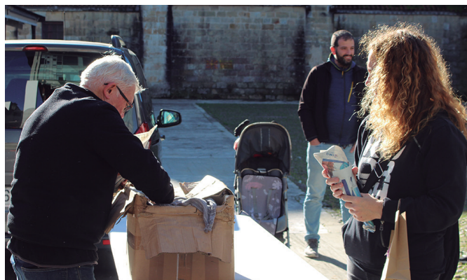
Dema plazan gaztainak banatu zituzten.