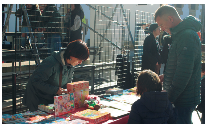
Lizardi liburu-dendakoak izan ziren lan gehien egin zutenak.