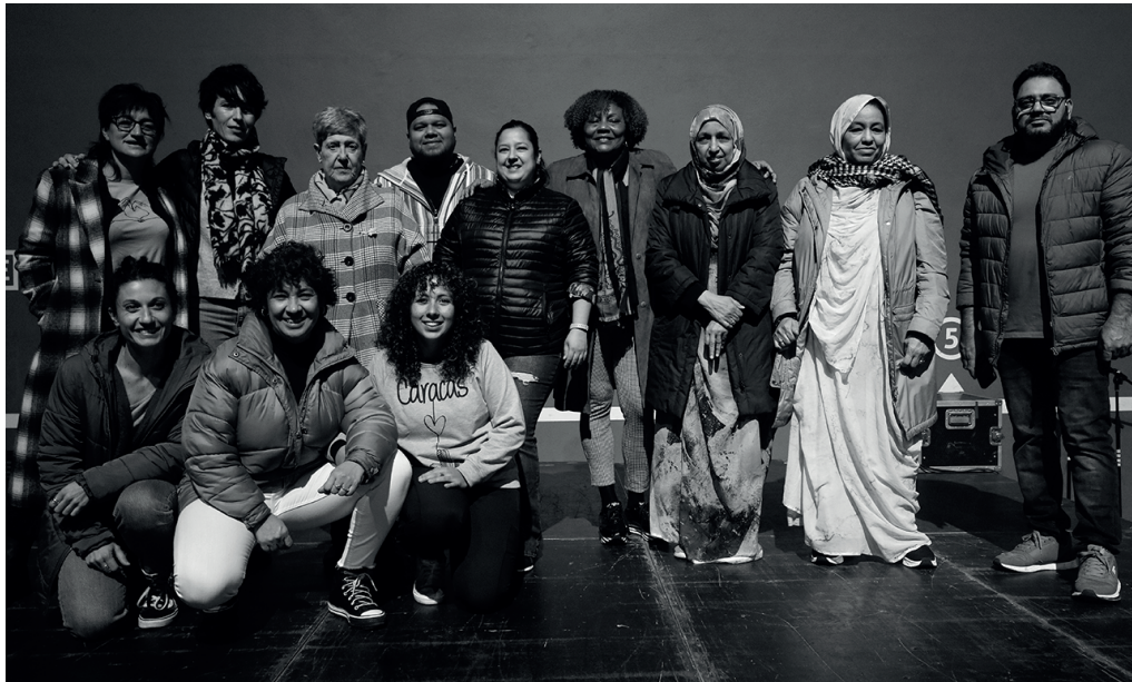
Iragan azaroaren 4ko Mundualdian aurkeztu zuen Aniztasun Kontseiluak "Hareman" egitasmoa. NOAUA!