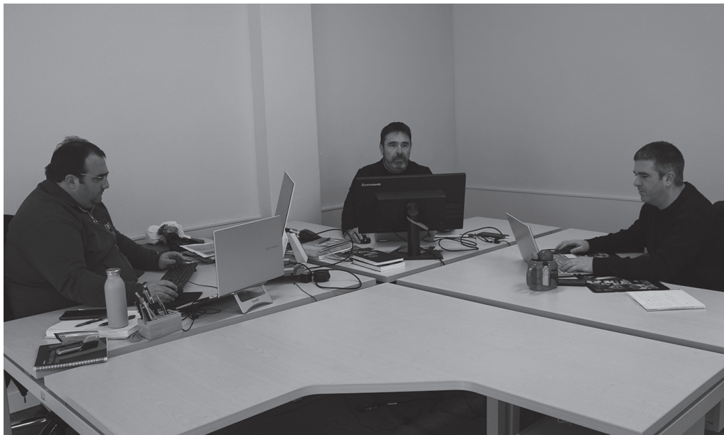
Kirolean Euskaraz kooperatibaren egoitza Zubiaurrenea kalean da. Irailean hasi ziren bertan lanean.