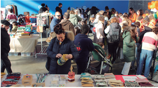
Usurbilgo eta inguruetak saltzaileak batu ziren Udazkeneko Azokan.