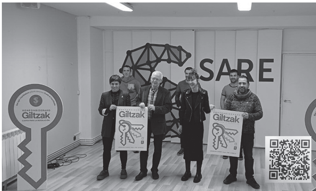
'Konponbiderako giltzak' manifestuarekin bat egin daiteke, QR kodea eskaneatuz.