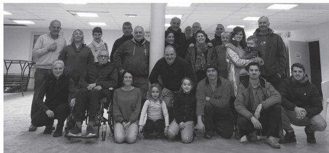
Hango lagunekin batera, 200 pertsonentzako afaria prestatu zuten Urdiñarben.

bidez: "Usurbildarren eta xiberotarren arteko harremanak aurrera darrai eta aurreko asteburuan xiberotarrak Usurbilera etorri ziren moduan, oraingoan gipuzkoarrak gerturatu dira Xibero aldera. Afarian ez zen musikarik falta izan eta Urdiñarben duela