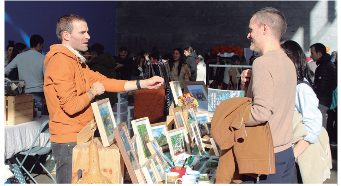
Produktu ugari aurki zitezkeen salmenta postuetan.