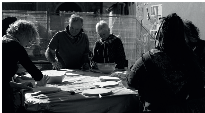
Usurbilgo talogileak iragan San Tomas azokan lanean. NOAUA!