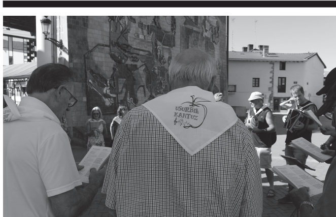
Abenduaren 15ean ospatuko dute kantu-afaria, Patri jatetxean.