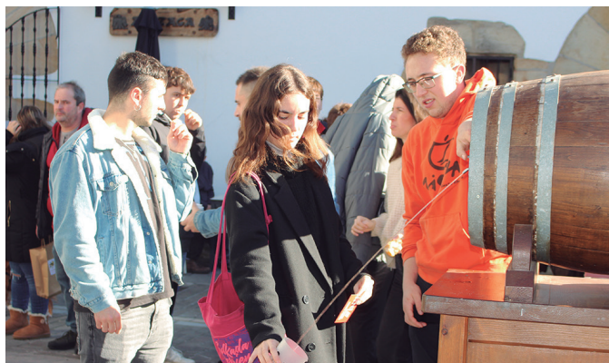
Azokan erosketa egiten zutenek sagardoa dastatzeko aukera zuten.