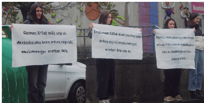
Zaintza publiko eta kolektiboaren aldeko greba deitu zuen Mugimendu Feministak.