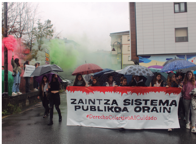
Azaroaren 30ean manifestazio bat egin zen eguerdi partean Usurbilen.

Euskalgintzak eta kultur- gintzak ere bat egin zuen azaroaren 30eko greba egunarekin; herrian ekitaldirik ez azaroko azken egunean. Etumeta AEK euskaltegia itxita baita. Bertatik ikasleei jakinarazia zientez, "Euskal Herriko Mugimendu Feministak greba orokorrera- ko deia egin du zaintza publi- ko eta kolektiboaren alde, eta Etumetako irakasleok greba egingo dugu". Euskaltegiokoen berri blogak.eus/etumeta-eus- kaltegia- aek atarian jaso deza- kezue.