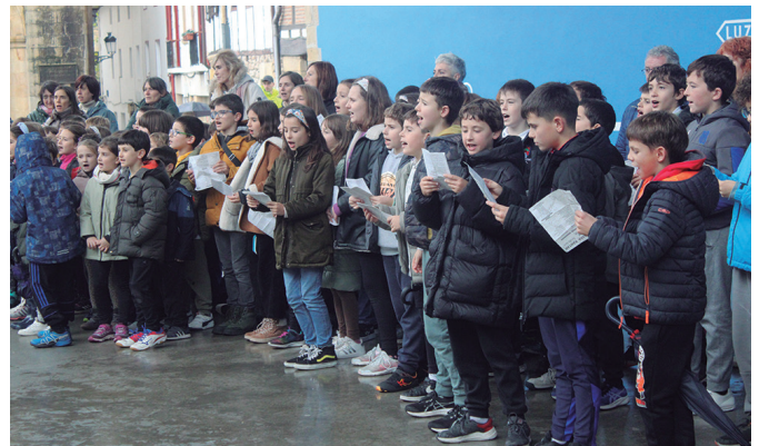
Euria tarteko, Mikel Laboa plazan beharrean Usurbilgo frontoian aritu ziren.