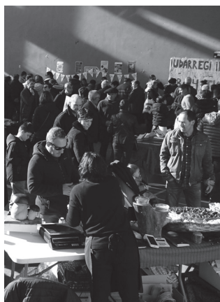
Denetarikoz postuez ederki hornituriko San Tomas azoka izango dugu igandean.

Edari preziatu horrekin batera, herrian ekoizitako babarruna ikusgai baita. Aipatu jaki eta edarion sariketa eguerdian izango da. Goizean zehar, adituen epaimahaia ikusiko du-