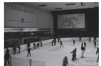
Gurasoen baimena behar da.

Donostiako Txuri Urdinera irteerak antolatu dituzte Gaztelekutik abenduaren 28an eta urtarillaren 4an, 16:00-21:00 artean. Hitzorduotan parte hartzeko ezinbestekoa izango da guraso baimenak Gaztelekuan bertan jasotzea. Informaziorako: 688 813 853 gaztelekuausurbil@gmail.com