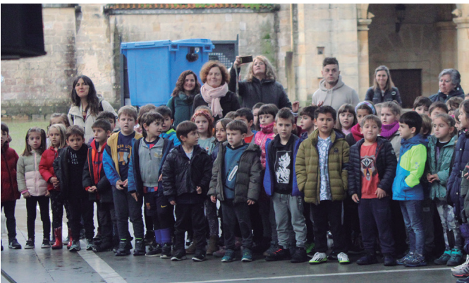
Euskara kantuan plazaratu zuten, ezagunak zaizkigun hainbat abestien bidez.