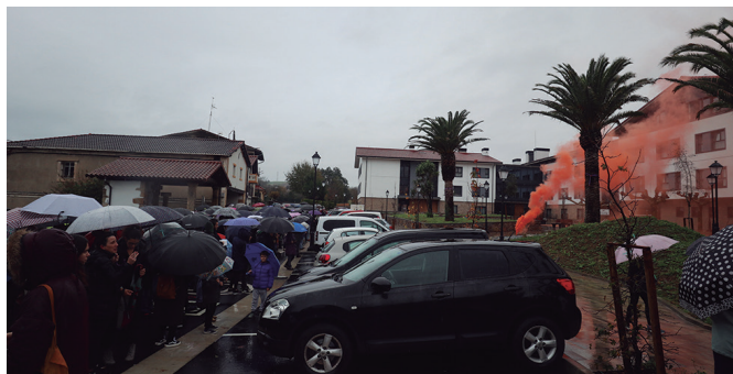
Greba egin ezin izan zuten zaintzaileei elkartasuna adierazi zieten.