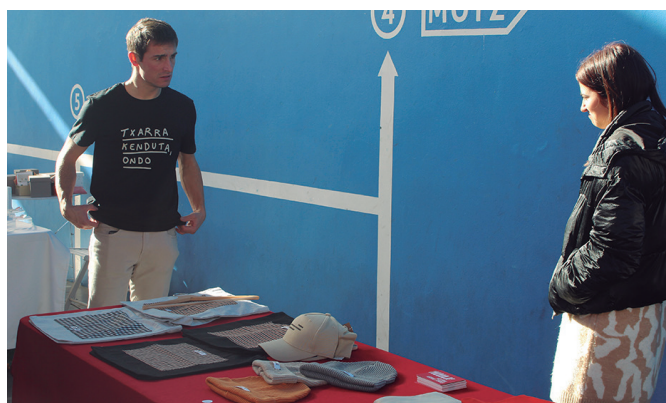
Bisitari batzuk arropa erosteko aukera baliatu zuten.