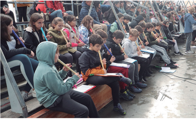
Abenduaren 3a jai zenez, abenduaren 1ean ospatu zuten Euskararen Eguna.