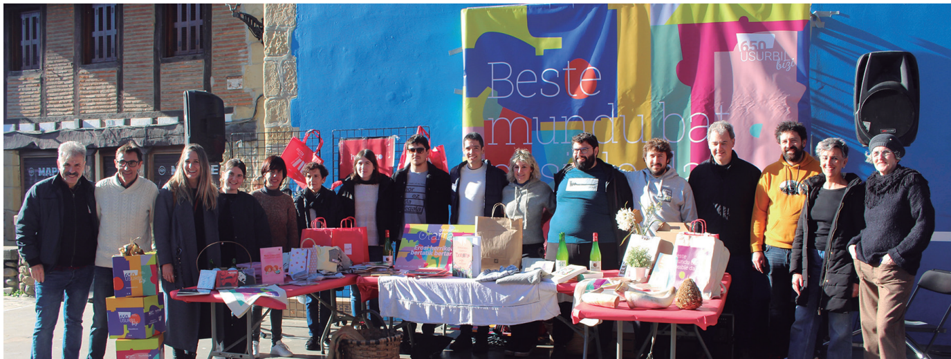
Usurbilgo sortzaileen eta ekoizleen produktuekin osatutako otarra abenduaren 3an aurkeztu zuten, Hurbilago Udazkeneko Azokaren baitan. NOAUA