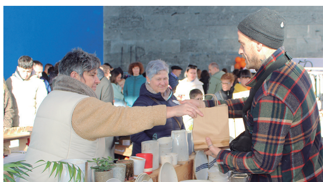
Eguerdiko 13:00ak aldera batu zen jende gehien.