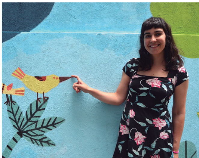
Aste honetako NOAUA!rekin batera Axpik idatzitako 'Azkonar' ipuina banatu dugu.

Axarkoren ipuina plazaratu genuenean, bertako fauna eta bertako landaretza aldarrikatu zenuen. Azkonartxoren bitartez, baratze lana nabarmendu nahi izan duzula esan daiteke, ezta?