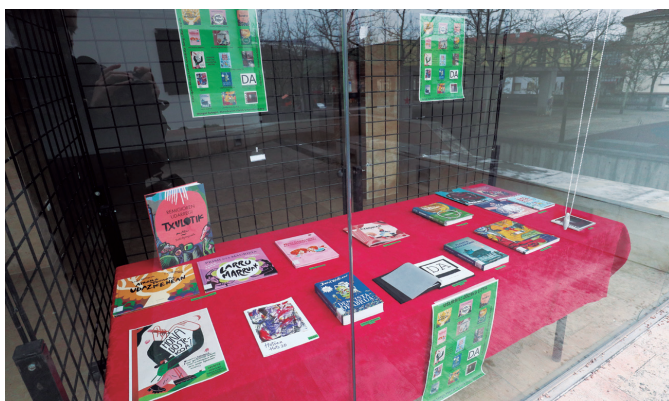
lazko herri sorkuntzaren uzta ikusgai jarri du asteotan Sutegi udal liburutegiak.