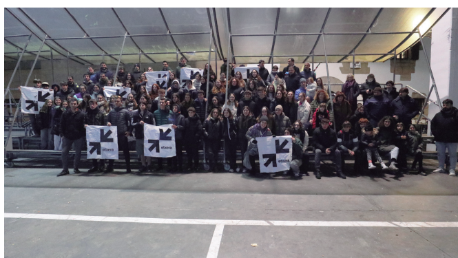
Gazte mugimenduak bat egin zuten Sareren Bilboko manifestazioarekin.