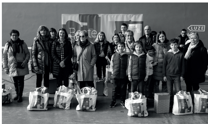
Otar-Goxoko eta Usurbil Optikako sarituak. NOAUA!