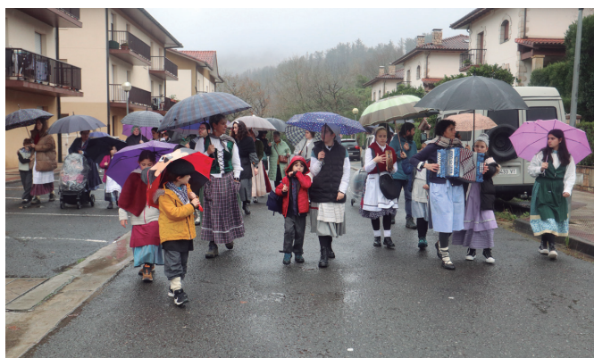
Aginagako eskolakoek euripean egin behar izan zuten gabonetako kalejira.