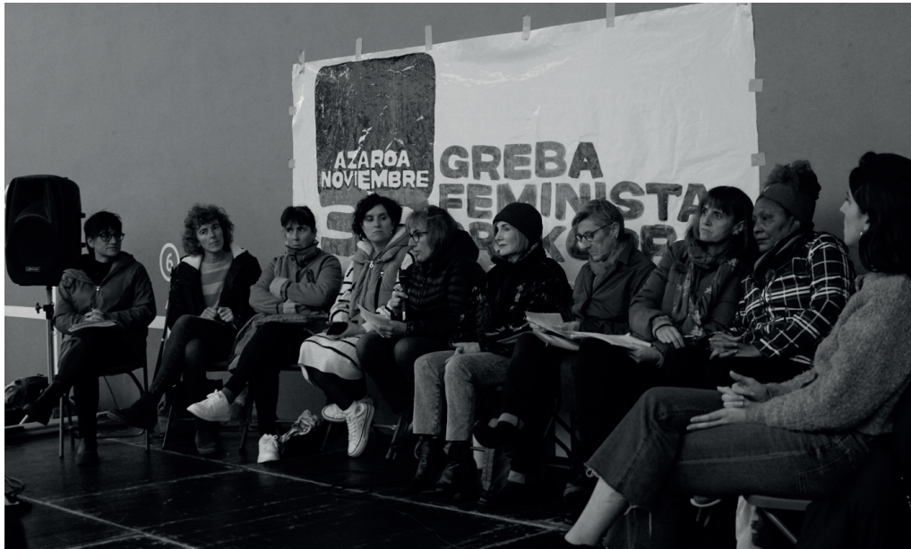
Azaroaren 30eko greba feminista orokorrean egindako solasaldian parte hartu zuten hizlariak.