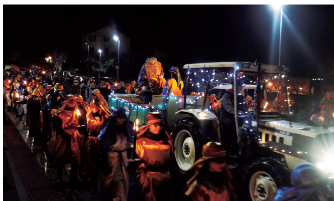
Estreinakoz, traktore gainean heldu ziren hiru erregeak.