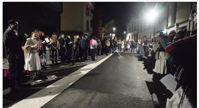
AztarriKant, euskal kantuen bira egin zuten abenduaren 24an.