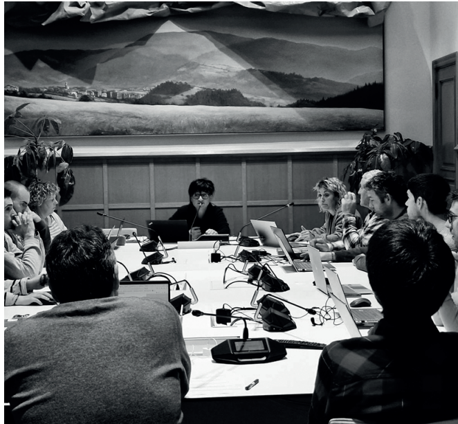
Udal langileei lotutako zenbait erabaki hartu zituzten azkeneko osoko bilkuran.

Aipatu moduan, beraz, lehenbiziko aldiz, kontrako botorik gabe baina era berean, erabateko adostasunik gabe, gehien-go osoz onartu zituzten hasieraz 2024rako udal aurrekontuak. Urtarrilaren 4az geroztik, hamabost laneguneko erreklamazio epea zabalik du Udalak. Tarte horretan,