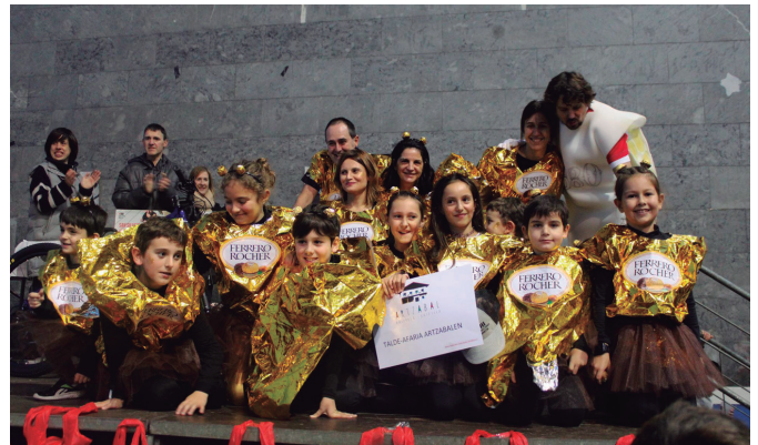
Irudiko koadrila mozorrotua saritu zuten, Hurbilago San Silbestre lasterketan.