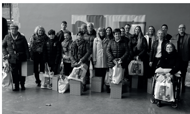
Artzabal jatetxeko eta Enar estetikako sarituak. NOAUA!