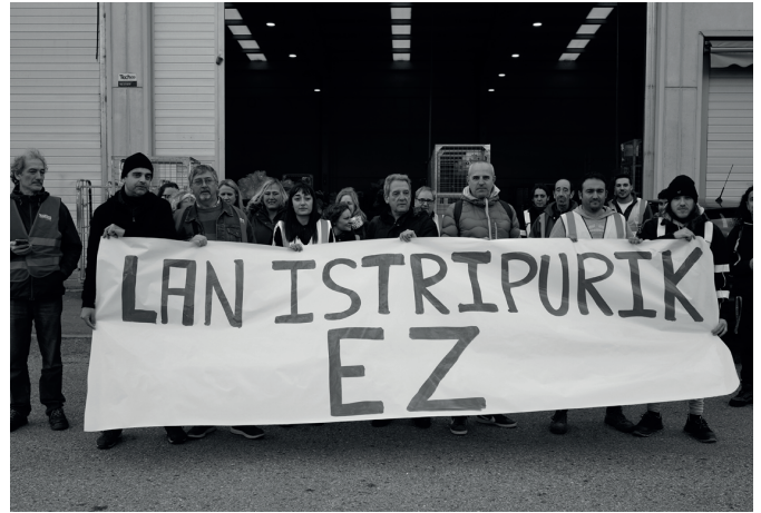
Correos Express-eko langileek iragan astean egindako protesta.

Izan ere, larriena izan den istripu horren aurretik ezbehar gehiago izan dituztela salatu zuten. "Pabilioiak martxan daraman urtebete pasatxoan ere esku harrapaketa kopuru