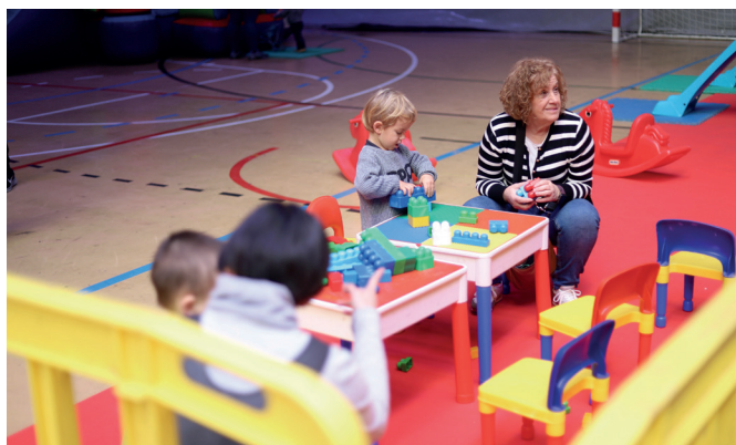
Abenduaren 26tik 28ra Gabonetako Haur Parkeaz gozatzen hamaika gaztetxo.