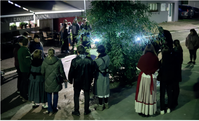
Santuenean kantuan hartu zuten auzotarrek Olentzero.