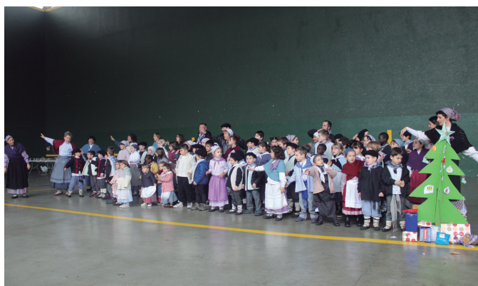
Zubietako eskolakoek senide eta lagunei eskainitako gabonetako kantu saioa.