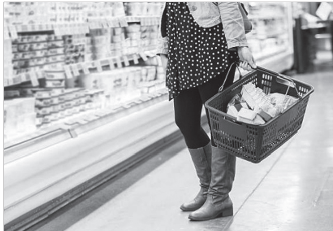
Hamar metro luzeko apalategia, dena jogurtez betea. Master bat egin behar da erabaki egokia hartzeko.

Supermerkatura jogurtak erostera joan eta zer da hau? Hamar metro luzeko apalategia, dena jogurtez betea: naturalak, zaporedunak, gaingabetuak, grekoa, zerealdunak eta bifidus aktiboak dutenak; txikiak, ertainak eta handiak; mamiak, flanak eta natilak. Eta hori dena bider bost edo sei marka, marka bakoitzak bereak dituelako.