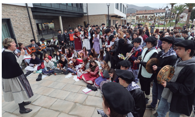
Udarregi ikastolako ikasleek Egurtzegin eskainitako gabonetako emanaldia.