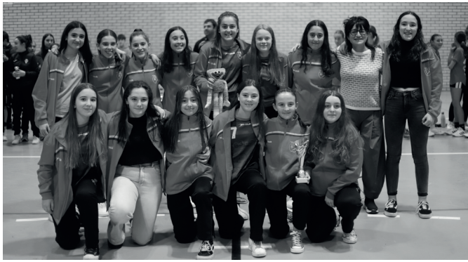
Usurbil K.E. infantil nesken taldea.