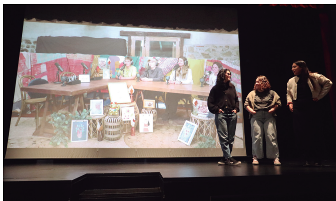
"Gazte, arraro, errebelde" izeneko podcast-a aurkeztu zuen Iñurri elkarteak.