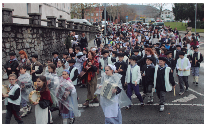
Udarregi ikastolakoek herrian barrena eginiko gabonetako kalejira.