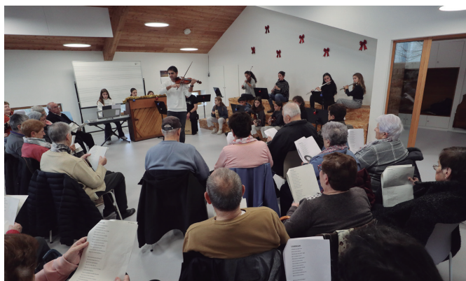
Belaunaldiarteko topaketa antolatu zuten Zumarten, gabon kanten bueltan.