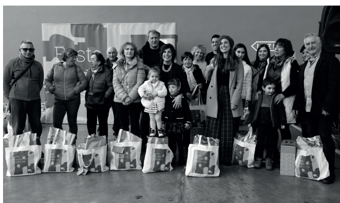
Esnaola janari dendako eta Intza ileapaindegiko sarituak. NOAUA!