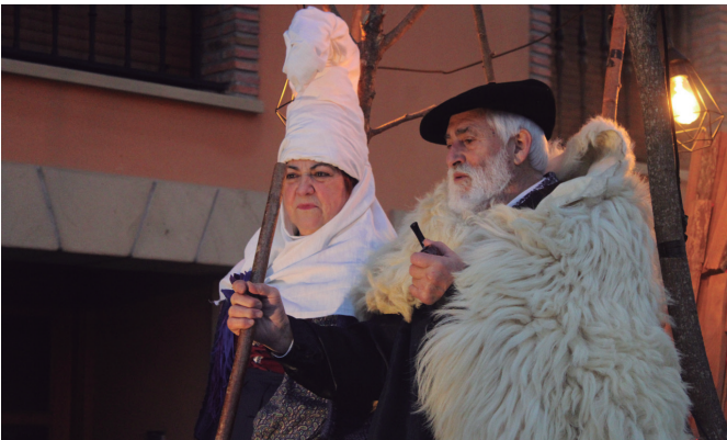
Mari Domingi eta Olentzero Kalezarko kaleetan barrena.