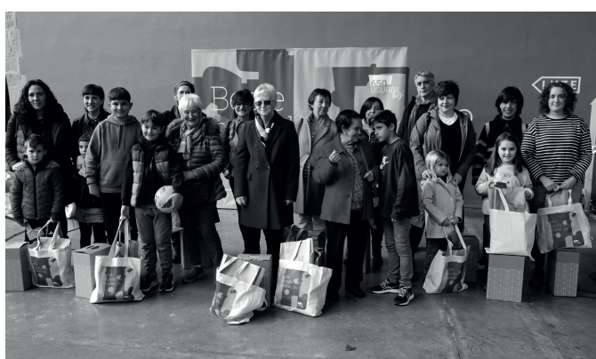
Lizardi liburudendako eta Lurda mertzeriko sarituak. NOAUA!