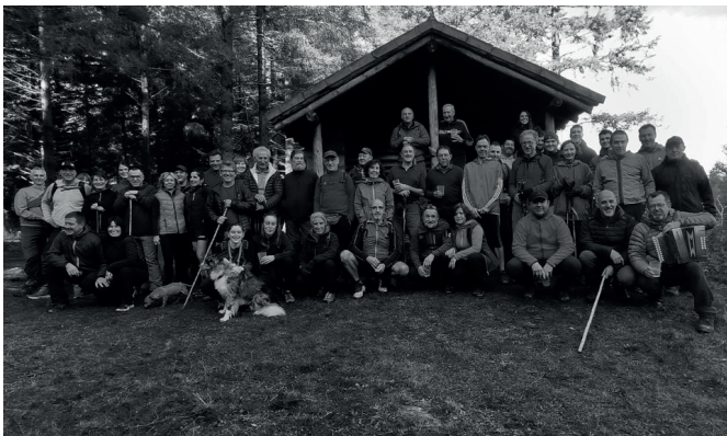
Urte berria Andatzen hasi zuten herritarrak. Haiek helarazitako argazkia duzue.

Bizi asko, nahieran jantzita eta festa giro betean agurtu zuten urte zaharra ehunka herrikideek abenduaren 31n egin zen Hurbilago San Silbestre herri lasterketaren bidez; banaka, bikoteka, koadrilan, familian... Eta mozorrotuta. Berrogeitik gora parte hartzaile saritu zituen amaieran antolakuntzak. Irudi gehiago noaua.eus atarian dituzue.