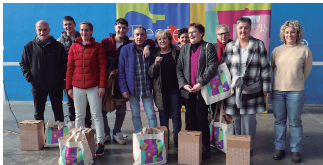
Parte hartzaile guztien artean saritutakoak.