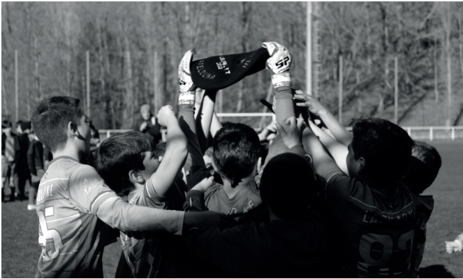
Lazkao nagusitu zen Usurbil F.T.-ren Harane Txapelketa 2023 ekimenean.