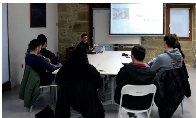
Gazte mugimenduen topaketetan mahai ingurua eta hitzaldia egin zituzten.