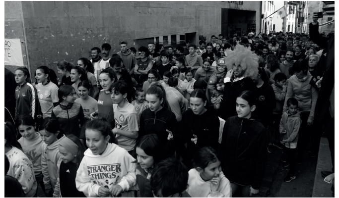
Ehunka lagunek agurtu zuten urtea Hurbilago San Silbestre herri lasterketan.

Alebin mailako lehen urtekoen arteko topaketa egin zuten Haranen abenduaren 26an. Zortzi taldeok parte hartu zuten bi multzoetan banatuta: Usurbil FT A, Orioko FT, Billabona FKE, Mundarro KE, Usurbil FT B, Lazkao KE, Añorga KKE eta CD Vasconia. Lazkao izendatu zuten txapeladun, Mundarro, Billabona eta Añorga lehiakide izan zituen azken fasean.