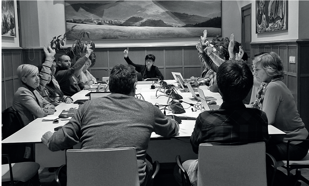
2024ko udal aurrekontuak hasieraz bozkatu zituzten unea, joan den abenduaren 20ko osoko bilkuran.