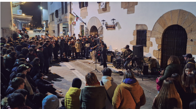
Gaske topaketan amaieran, Txiskeroak herriko taldearen estreinako kontzertua.