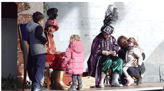
Jolasak egin eta gutunak eman zizkieten haurrek erregeen postariei.