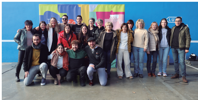
650 Usurbil Bizi otarren egitasmoa sustatzaileak.