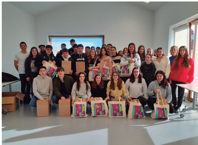
Udarregiko ikasleen laguntzaz prestatu zituzten 650 Usurbil Bizi otarrak.

Bezperan saltokietan zozketatu eta abenduaren 31n banatutako 102 otarrak produktuez hornitzeko lanetan jardun zuten iaz bezala, Udarregi ikastolako DBH4ko ikasleek.