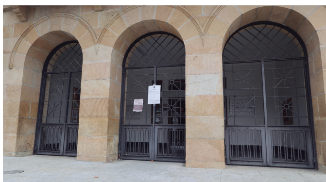
Sektore publikoan deitutako greba egunarekin bat egin zuten udal langileek.