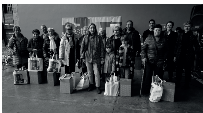
Ane ileapaindegiko eta Arruti harategiko sarituak. NOAUA!