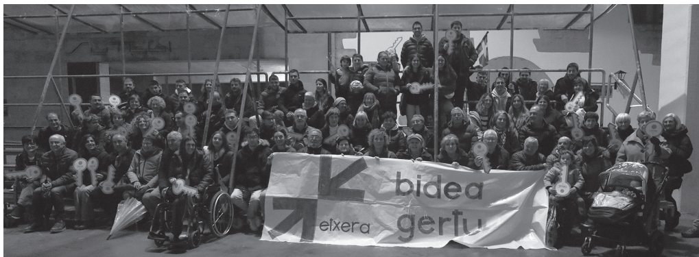
Bilboko manifestazioa 16:00etan hasiko da. Usurbilgo autobusa 14:00etan irtengo da Oiaro kiroldegitik.