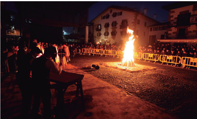
Mari Domingiri eta Olentzerori eginiko harrera ekitaldi jendetsua plazan.