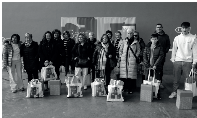
NI ileapaindegiko eta Opil-Goxoko sarituak. NOAUA!