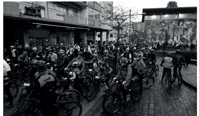
Urtarrilaren 28an egingo da hurrengo Irisasi BTT Hotzak Akabatzen ekimena.

Gautxori bat baino gehiago etxerako bidean izango zen unean, urte berriari goizean goizetik ekitea erabaki zutenik izan zen, eta ez gutxi. Urteroko ohitura berritzeko aukera izan zuten urtarrilaren lehenean, giro eguzkitsua bidelagun zutela Andatzara igo zirenek. Borda parean bildu zirenak dituzue haiek helarazitako goiko argazkian.