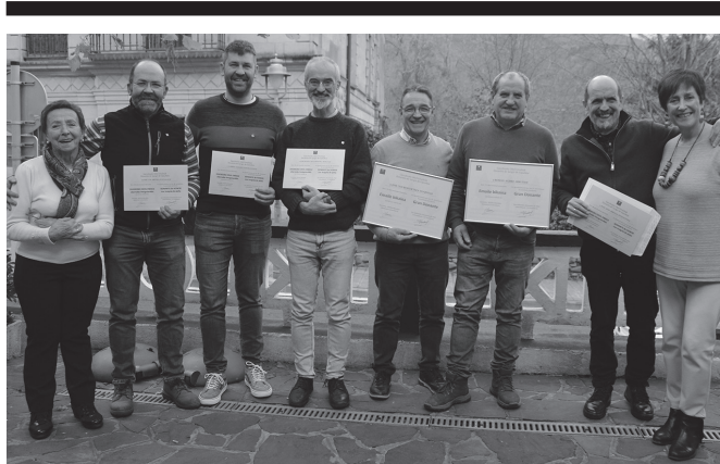
Argazkian, iaz omendu zituzten odol-emaileak.

Joan Mari Torrealdei beka. Hori izan da Metrokoadroka kolektiboaren ikerketa eszenikoa abiatzeko pizgailua. Sarrerak: gonbidapena eskuratu behar da alde zuzenean, usurbilkultura.eus plataforman. 18:00 Sutegin.