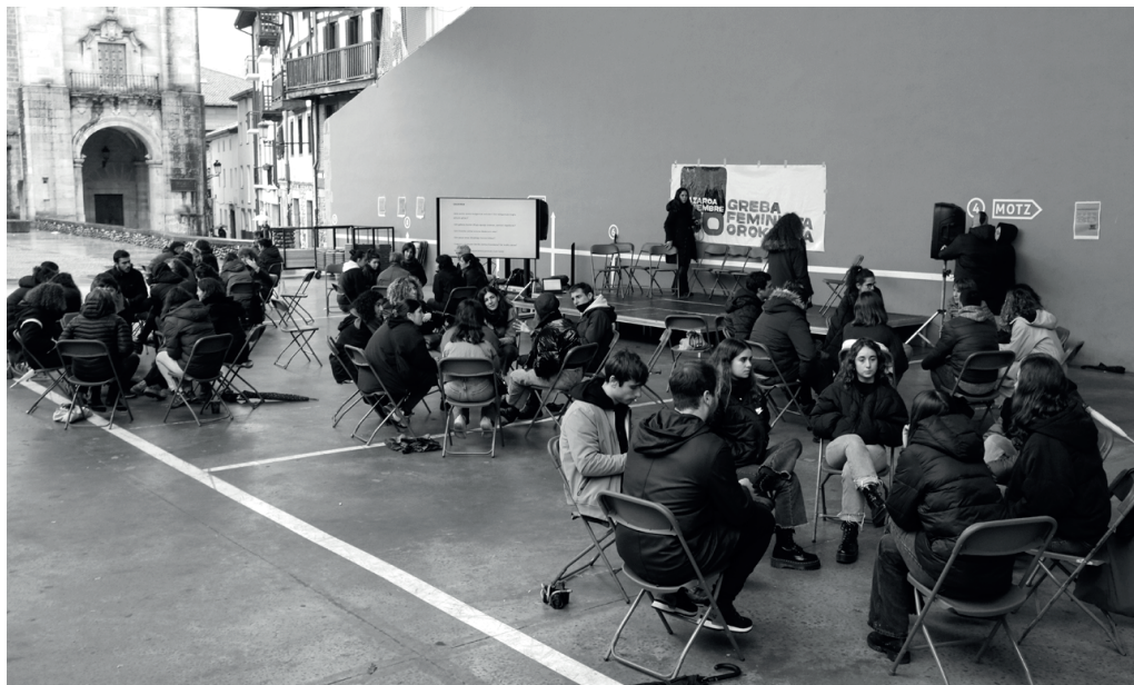
Zaintzaz hausnartzen aritu ziren taldeka, azaroaren 30eko greba feminista orokorrean.