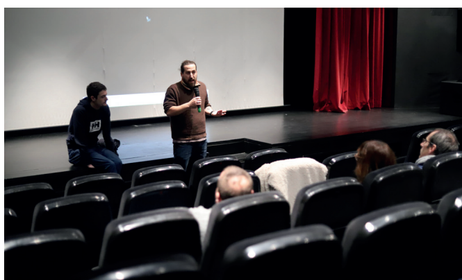
"Karpeta urdinak" torturei buruzko dokumentala eskaini zuten Sutegin.