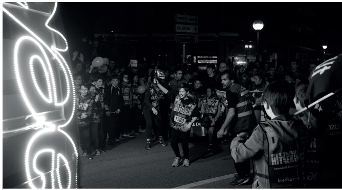
Korrika da Udalak lagunduko duen euskararen aldeko ekimenetako bat.