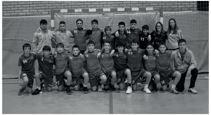
Usurbil K.E. infantil mutilen mailako A eta B taldeak.