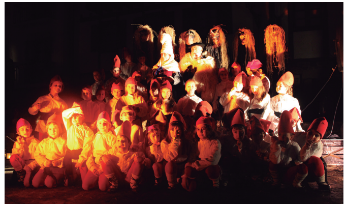
Mari Domingi eta Olentzero bidea argitu zieten galtzagorriekin.