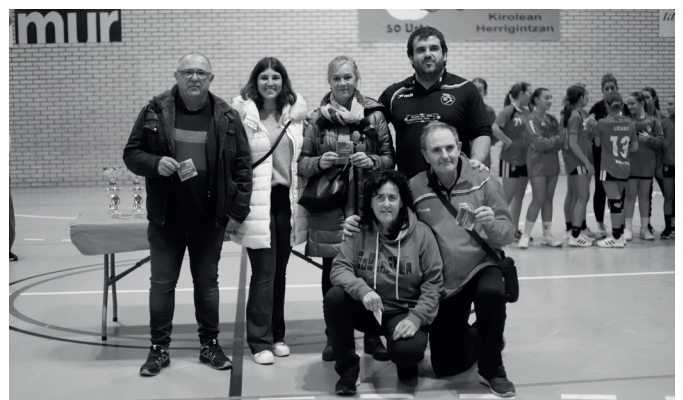
Usurbil K.E. klubaren alde egindako lanagatik omendutako herritarrak.