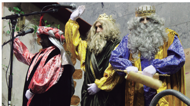
Erregeak frontoira iritsi berritan herrikideak agurtzen.