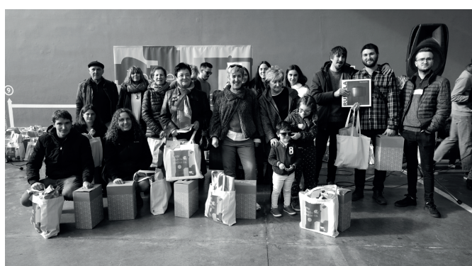
Aizpurua okindegiko eta Alkartasuna Kooperatibako sarituak. NOAUA!