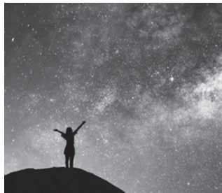
Liburuaren egileen esanetan, "nahikoa arrazoi zientifiko badago kreatzaile baten existentzia frogatzeko".

Teologo batzuek aurpegira bota diete zientifikoki Jainkoa ez dela frogatu. Horren gainean, beraiek argi utzi nahi dute beren asmoa ez dela Jainkoaren froga zientifikoak eta matematikoak ematea. Baizik, susmoak, pistak aurreratzea, irakurleak gai honi buruz iritzi informatua