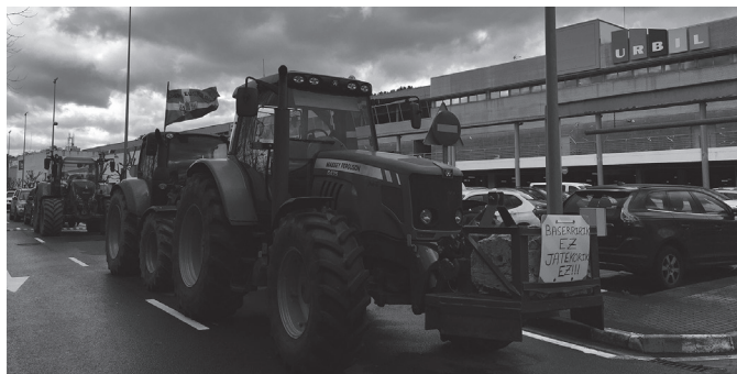
"Baserririk ez, jatekorik ez" irakurri zitekeen traktore honen muturrean.