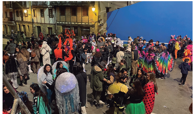
'Fauna' gaiak joko asko eman zuen. Mozorro festa oparoa izan zen.