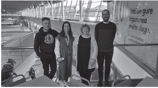
Udaleko eta Urbilgo ordezkariak, akordioaren berri ematen.