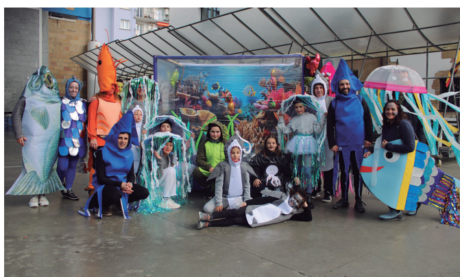
Arrainak ere arrainontzitik kanpo aterarazi zituen larunbateko mozorro festak.