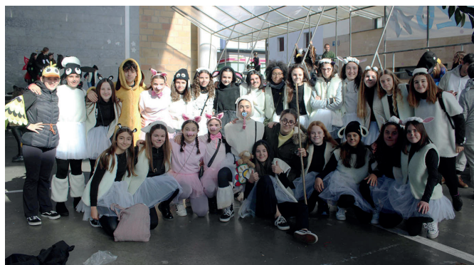
Belaunaldi gazteenak dantzan egin zuen bat Orbeldiren kalejirarekin.