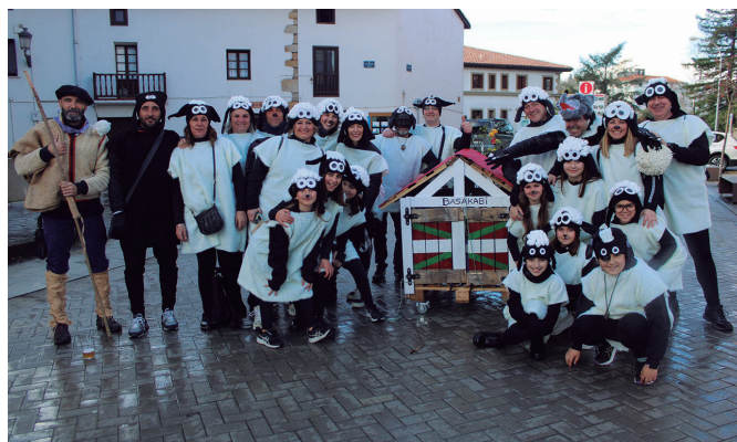
Basakabiko artaldea Mikel Laboa plazaraino jaitsi zen.