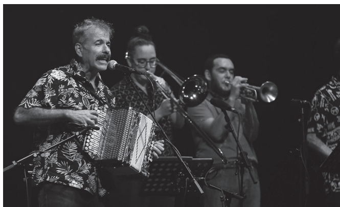
"Sonoritatez eta tamainaz toki egokia da Aginagako Eliza Zaharra". @TAPIAJOSEBA