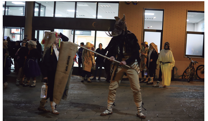
Urde protagonista, kiroldegira iritsi berritan.