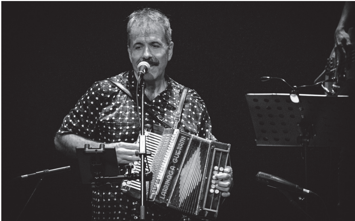
Tapia eta Leturia taldea Aginagako Eliza Zaharrean arituko da larunbat honetan. Gaueko 22:30ean hasiko da emanaldia.