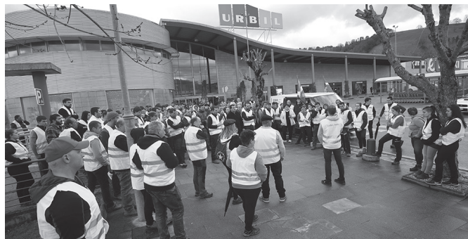
Burokraziak eta prezioek itota bizi direla salatu zuten asteleheneko elkarretaratzean.

WhatsApp bidez egindako deialdi batek piztu omen zuen asteleheneko mobilizazioa. Andoainean goizeko 7:00etan batu ziren hainbat baserritar