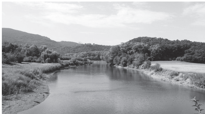
Aingiraren arrantzatzeak debekatua egoten segiko du.

diote; aingiraren arrantzatzeak debekatua egoten segiko du. Horrez gain, "aurreikusten da Sepronak egingadako dekomisoetatik datozen angulekin birpopulatzeko lan bat egitea. Azken jarduerari Foru Aldundiak arrakastaz egin zuen 2018-2021 urteetan". 755.000 euro bi-