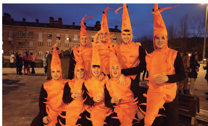
Itsaskiak ere lehorretik otsailaren 10eko Inauteri Festan.