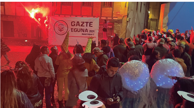
Aztarrikakoek martxoko Gazte Eguna iragarri zuten Dema plazan.