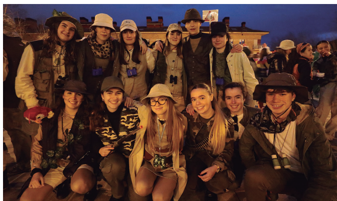
Fauna gertutik behatzen duenik ez zen falta izan Inauteri Festan.