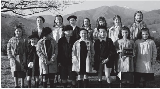
'Bizkarsoro' filmeko pasarte bat.