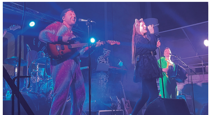
Itzal erromeria taldeak girotu zuen Inauteri Jaiko gaua.