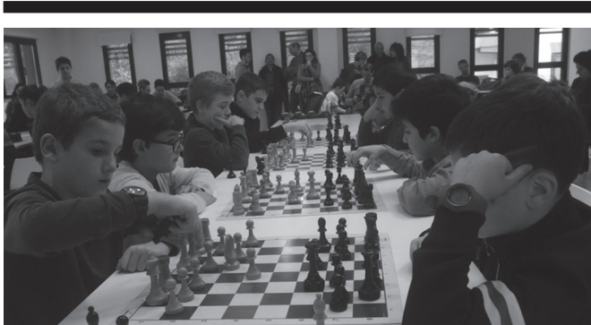
Ostiral honetako topaketa LH 1, 2 eta 3 mailakoentzat da.