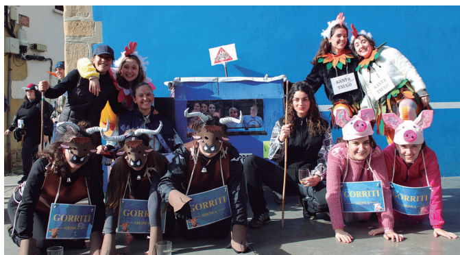
Gorritiren "showa" berritu zuen irudiko lagun taldeak.