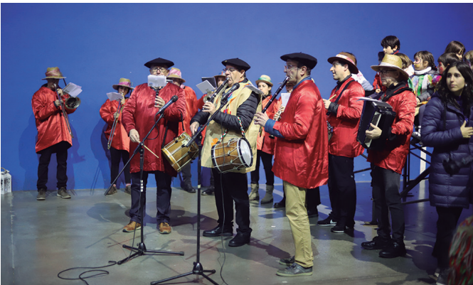
Zumarte Musika Eskolako kideak. Inauteriei doinua jartzen.