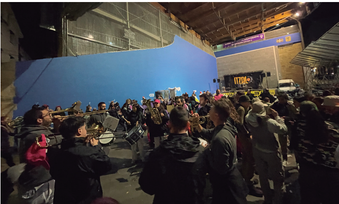
Burrumbazale txarangak Inauterietako kantak berritu zituen.