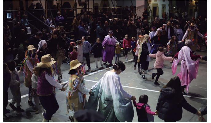
Orbeldik ostiralean eskaini zuen ikuskizunak jende asko erakarri zuen.