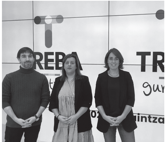
Foru Aldundiko Gazteria sailaren esanetan, Treba Gurasoak "gurasotasun positiboan oinarritutako eskaintza pedagogikoa da".

Ikasturte honetan martxan dagoena proiektu honen hirugarren edizioa da. Iaz, 103 hitzaldi eta tailer antolatuta zituzten Gipuzkoako 48 udalerritan, tokian tokiko udal, guraso elkarte eta eragile gehiagorekin lankidetzan. "Guztira, 2.493 gurasok hartu zuten parte, eta beren batez