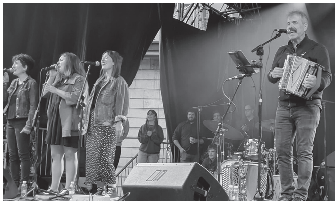
Fandangoak eta arin-arinak dantzatzeko aukerarik ez da faltako. @TAPIAJOSEBA