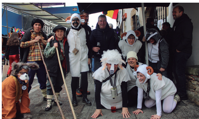
Ardi eta artzainen koadrila ederra. Irudi gehiago noaua.eus atarian.