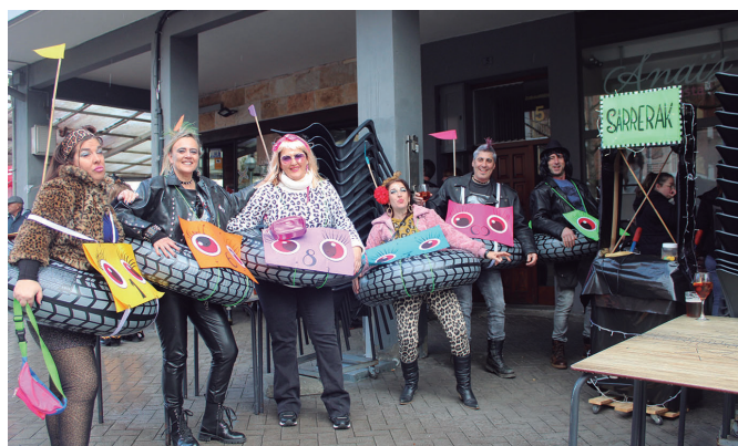
Festa girorako sarreren salmenta gune original askoa Inauteri Festan.