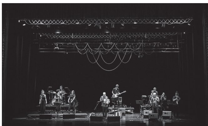
Sarrerak usurbilkultura.eus webgunean eskura daitezke. @TAPIAJOSEBA