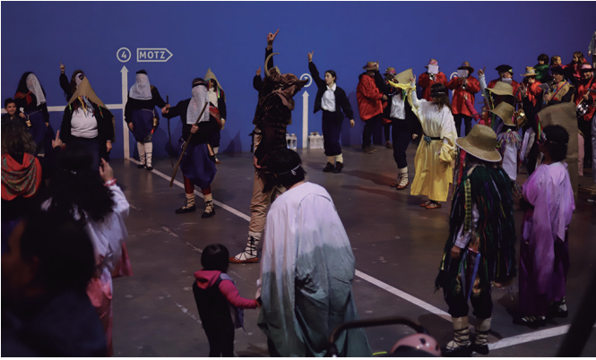
Herritarrak Urderekin batera frontoian dantzan.