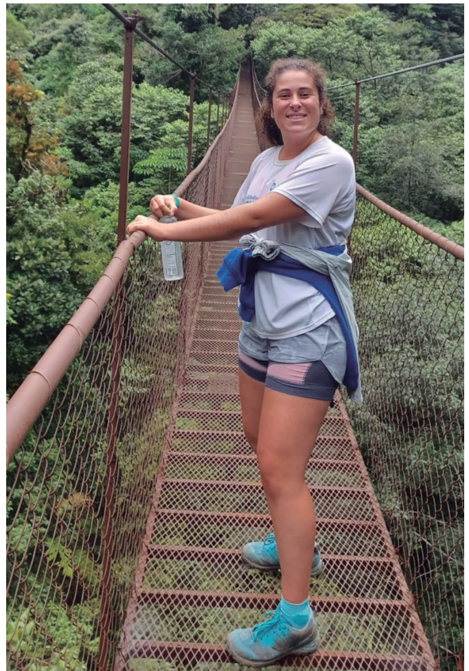
"Mondragon Unibertsitatea aukeratu nuen ingeniaritzetan duen prestigioagatik eta erabiltzen duen metodologia berritzaileagatik".

"IKASGELAN TALDE TRINKOA ERATU DUGU, ETA HORREK ESPERIENTZIA GUZTIA HOBETZEA EKARRI DU"