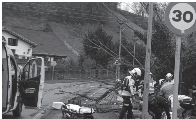
Zuhaitz baten erorketak pertsona bat zauritu zuen Zubietan. DONOSTIAKO SUHILTZAILEAK

Astelehen goizean, alerta larra indarrean jarri zuten goizeko 9:00etan hasi eta eguerdiko 15:00ak arte. Zoritarrez, haizeteak ezbeharrik eragin zuen, Zubietan hain zuzen. Hipodromoko zubia zeharkatu eta Zubietako kaxko aldera doan bideko lehen bihurtzean zuhaitz bat erori eta pertsona bat harrapatu zuen azpian. Donostiako suhiltzaileak, DYA eta Ertzaintza bertaratu ziren.