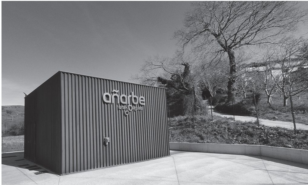
Hondakin-urak ponpatzeko bi estazio eraiki dira, bat Aginagan eta bestea Txokoalden.