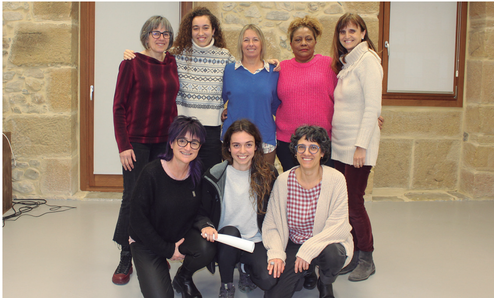
Udalak, Kafe Tertulia taldeak eta Emakumeen Etxeko talde sustatzaileak elkarlanean osatu dute Martxoaren 8ko egitaraua.