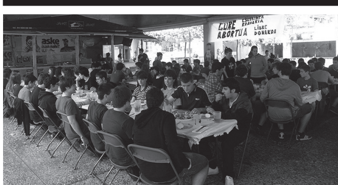
Afarirako txartelak otsailaren 27ra arte eskura zitezkeen.