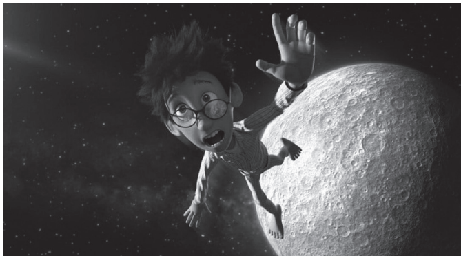
'Ilargirantz' filma eskainiko dute arratsaldeko 17:00etan Sutegin.