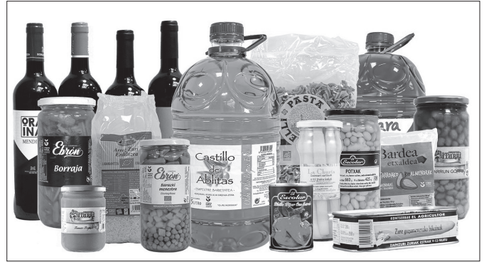
Eskaerak martxoaren 13ra arte egin ahalko dira.