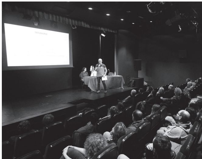
"Gaur egun, nire esfortzuak gizartearen eraldaketarako baliatu ditzakedala ikasi dut".

Aitortu beharra dut, nire kasuan, presio edo bideratze saiakera hori, hasieran nabarmendu nuela batez ere. Zertarako egin Ingurumen Zientzien Gradua, Ingeniaritza batek ate gehiago zabalduko badizkizu? Hobe zientzia ikasketak