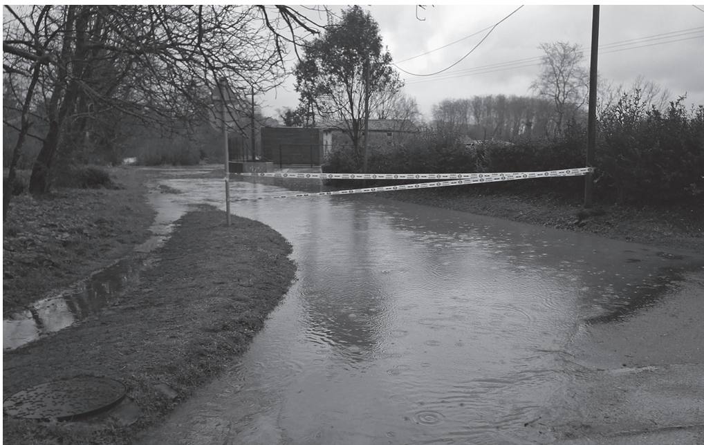
Zubietan, Aliriko zubiko sarbidea itxi egin zuten astearte goizean.

Astearte goizean, Zubietan, Santuenean, Txokoalden zein Aginaga aldean, urak gainezka egin zuen ohiko tokietan: Zubietako Aliri zubiaren bueltan, bidearen zati bat urpean utzi zuen ibaiak. Santuenean, Aialde Berri sagardotegian atarian zuten ura. Txokoalden, Altzonazko zubi-irantz indarrez eta nabarmen hazita zihoan erria.