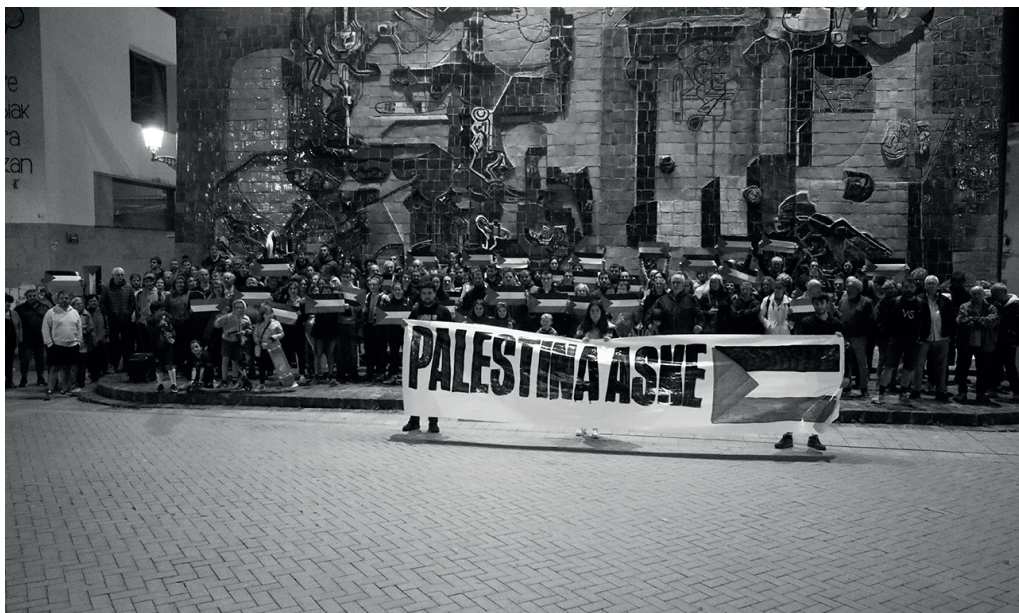
Palestinaren aldeko elkartasun aktiborako deia egin du herritar talde batek.