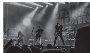
Delirium Tremens izango da zuzenean arituko den taldeetako bat.

Sarrerak dagoeneko salgai jarri dituzte usurbilkultura.eus plataforman.