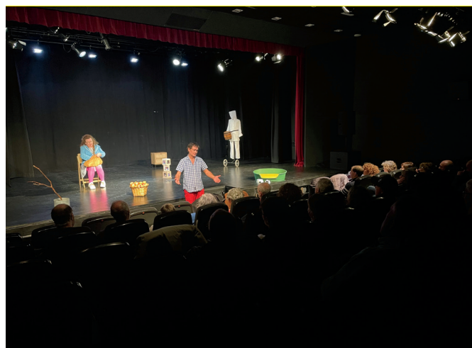
'Toto' antzezlan, larunbat iluntzean Sutegiko auditorioan.

Udalbiltzaren Geuretik Sortuak egitasmoan sortutako "Hona bostekoa" komiki bildumaren erakusketa zabaldu dute Sutegin. Irekiera ekitaldian, Mattin komikigileak parte hartu zuen "Handantza" komikiari buruzko azalpenak emateko. Bost komikien erakusketa ikusgai izango da martxoaren 1a bitarte Sutegiko Erakusketa Aretoan.