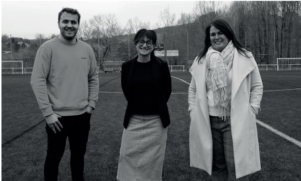
Usurbilgo Udaleko eta Gipuzkoako Foru Aldundiko ordezkariak, iragan astean Haranen egindako bisitan.