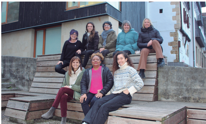
Potxoenean eman zuten aurtengo egitarauaren berri.

Izan ere, ohartarazi dutenez, "sexu edo generoagatiko desberdintasunak gizarte desorekaren arrazoi handienetako bat izaten du, gaur egun ere;