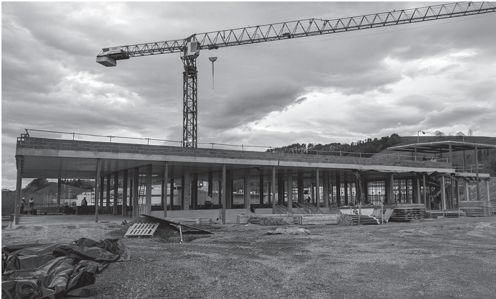
Lasarte-Oriako Udala kirol gune berri bat eraikitzen ari da Atsobakarren.