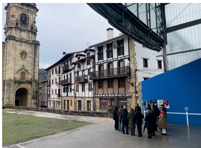
Usurbilgo ohiko bisita egin eta gero, Chillida Lekura jo zuten.