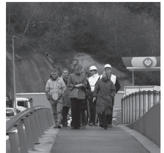
45 metroko luzera duten bi zubi berri eraiki dituzte Allerrun.

Eider Mendozak N-1 errepideko lotune berriaren garrantzia nabarmendu zuen, "Lasarte-Oriako industrialdeetara, Zubietako ingurumen-zentroa edota Eskusaitzetako industria-parkera sartzeko bidea erraztuko duelako". Bertan, "Naturklima erreferentzia-zentroa eta Mubil mugikortasun berriaren poloa daude, gaur egun eraikitzen ari direnak".