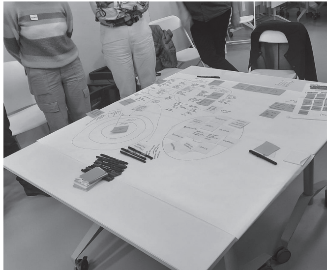
Usurbilgo EAJ-PNVk positibotzat jo du 'Usurbil Bizi' trantsizio ekosozialerantz prozesu parte-hartzailea.

Usurbilgo alderdi jeltzaleak "herritar guztiak gonbidatzen ditu 'Usurbil Bizi'-ren hurrengo saioetan parte hartzera, bere babesa berretsiz eta Usurbil jasangarriago eta bidezkoago baten erai-