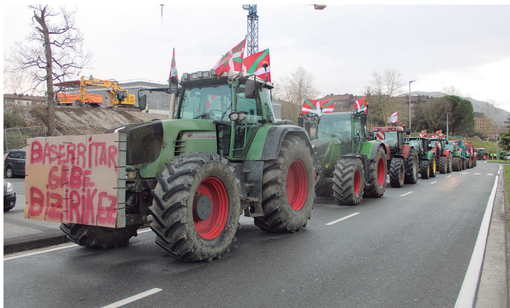
Sindikatuak martxoaren 1erako deitu duten mobilizazioko traktore zutabeetako baten geltokia izango da Urbil.