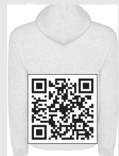
Eskaerak QR kodearen bidez egin daitezke.

DBH4ko ikasleek aditzaera eman dutenez, "eskaria eskaera kopuruaren arabera egingo da, beraz martxoaren 4aren aurretik abisatzea eskertuko genuke, inor kamiseta edo jertserik gabe gera ez dadin".