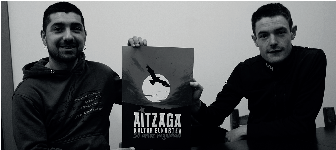
Aitzaga Kultur Elkarteko kideak, bilgunearen 30. urtemugako kartela eskuartean dutela.