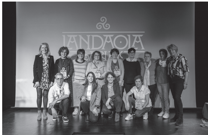
Sari banaketa ekitaldia aurreko ostegunean egin zen Usurbilen.

Erakunde Publikoaren saria Bergarako Udalarentzat, Oxirondo azokan Elika Enea sortzeagatik.