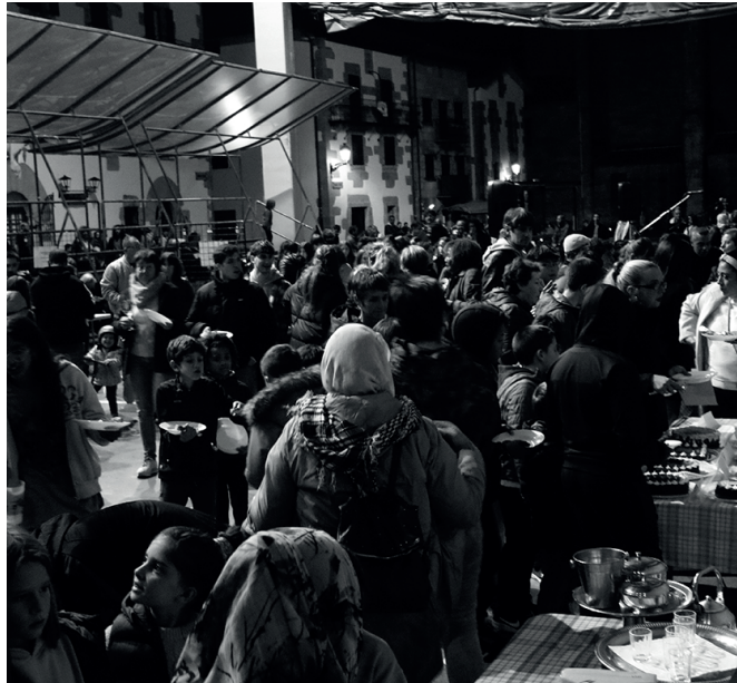
Frontoia herrikideen topaleku bilakatzen duen urteroko Mundualdia.