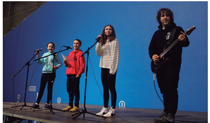
Euskarari koplaka bikain aritu ziren Udarregi ikastolako bertso eskolakoak.