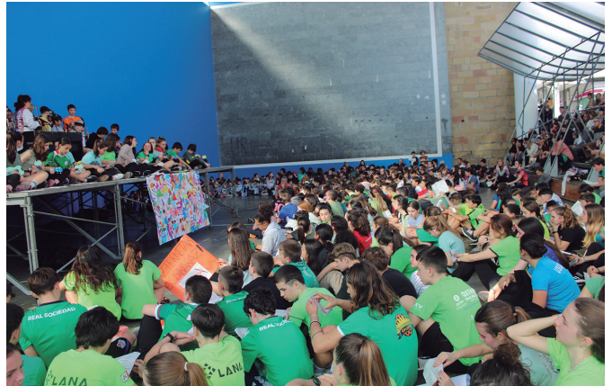
Euskarari kantuan amaitu zuten Udarregikoek Korrika Eguna. NOAUA

23. Korrika gauez iritsi aurretik, bazkalostean hasi ziren beroketa ariketak ikastetxeetako Korrika Txikiekin; iruditant, Udarregi ikastolak ospa-