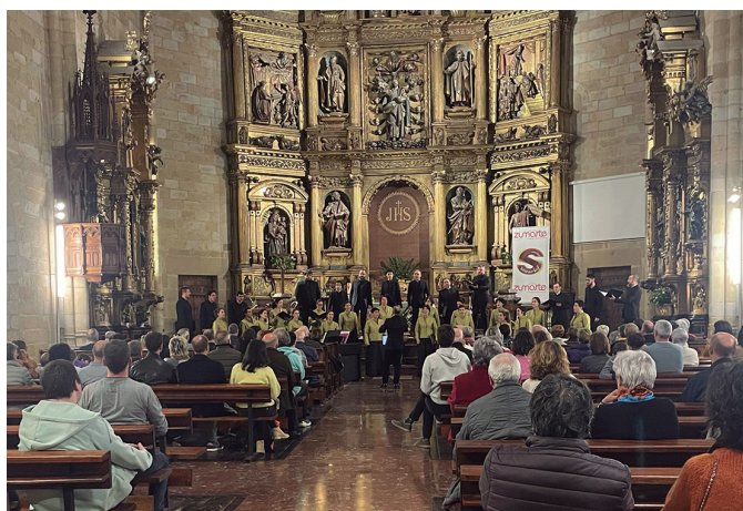
Herritar ugari bertaratu ziren Salbatore elizara. NOAUA

'Ene Kantak' gaztetxoentzako ikuskizunak izugarritzko arrakasta izan zuen Zubietako frontoian. Soinurbilek umeentzat antolatutako ekitaldira ehundaka ume hurbildu ziren eta harmailak goraino bete zituzten. Abestia eta dantza ez ziren falta izan eguerdi arte.