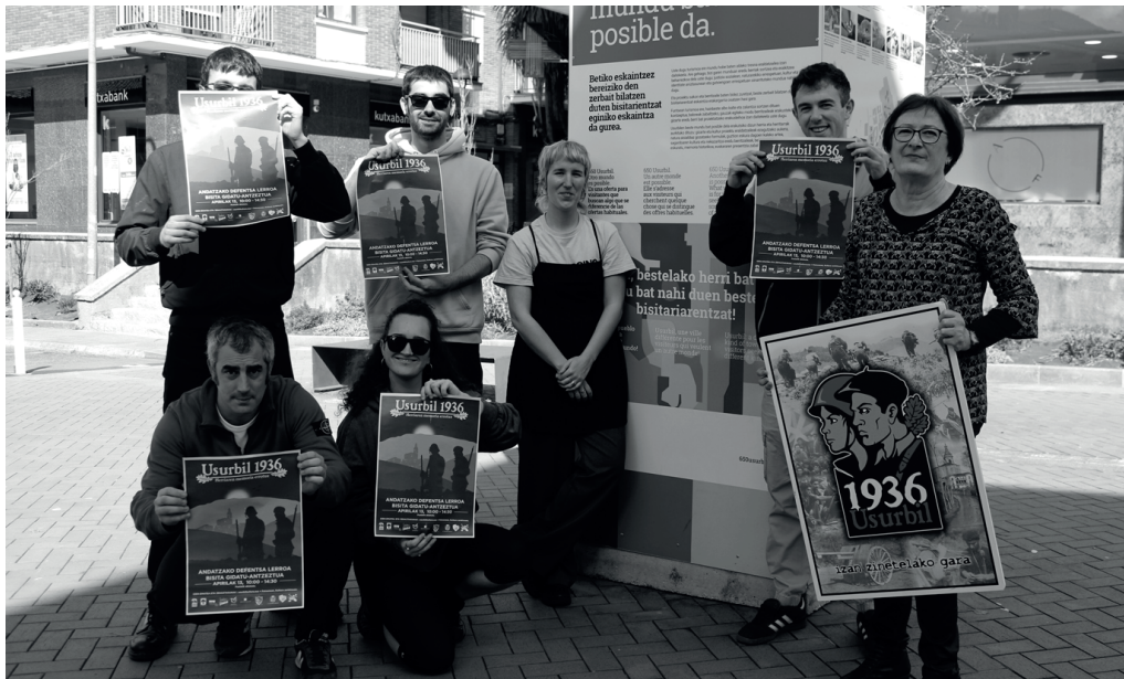
Apirilaren 13ko ibilaldia gidatua eta antzeztua izango da. Argazkian, Usurbil 1936 elkarteak kideak.