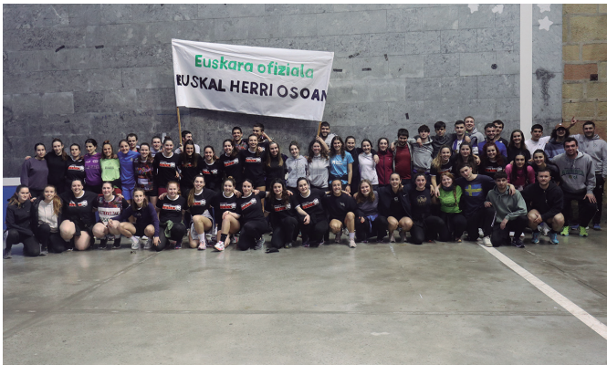
Korrika herrira iritsi aurretik, Aztarrikako gazteek familia argazkia atera zuten.