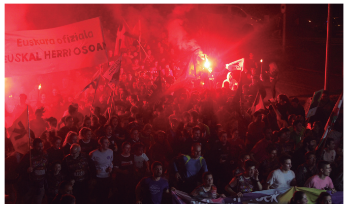
Jendetza zeterren Zubietatik eta Usurbilen are handiagoa egin zen "tropela".