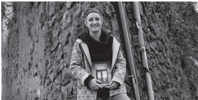
Miren Azkarate Sutegin izango da ostegun honetan.