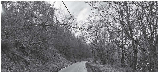
"Zer bait gertatu behar ote du egoera konpontzeko?", herritar baten galdera.

Orbeldiko bidez kexu agertu da NOAUA!ra idatzi duen herrikide bat: "Azkeneko urtean hainbat zuhaitz erdi erorita daude argindar kableek heltzen dutela. Udaletxea eta udaltzaingoa jakinaren gainean egon arren, ez dute kasurik egiten eta ez dute arazoa konpontzen. Ez dituzte zuhaitzak mozten,