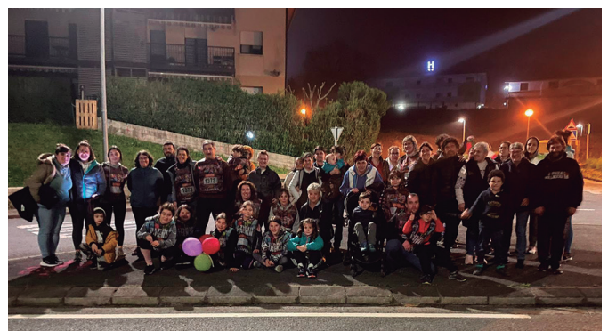
Aginagako beste kuadrilla handi bat, bide bazterrean zain.