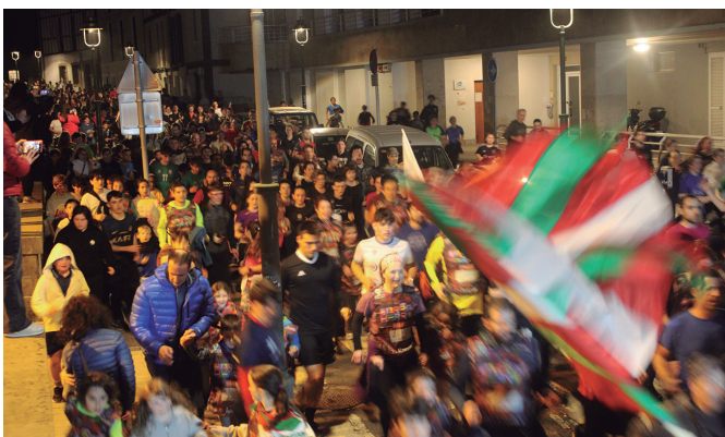
Gauerdia izateko gutxi falta zen arren, gazte zein heldu ugari atera zen kalera.