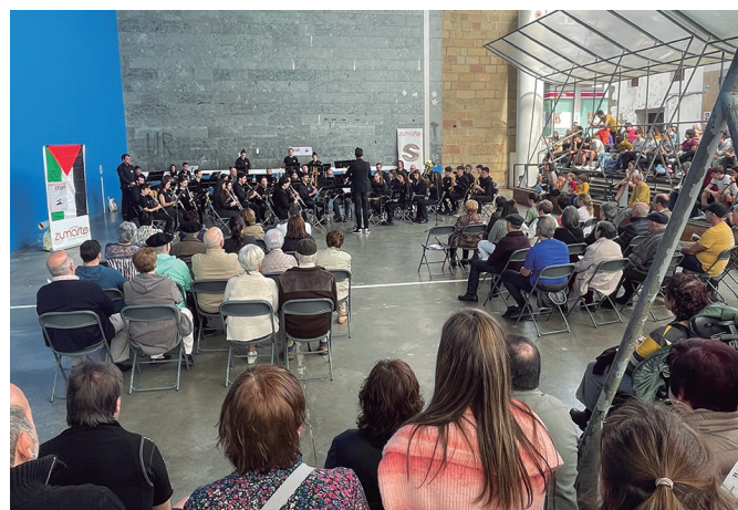
Argazkian ikusten denez, ikusle ugari batu ziren frontoian.