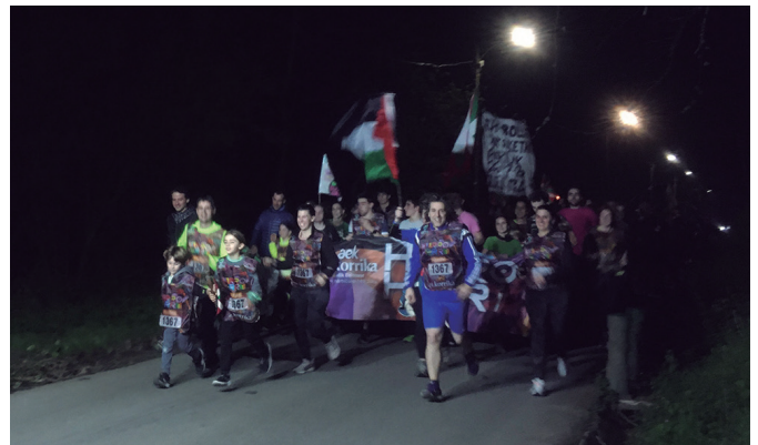
Orbeldikoen argazkia oso txarra zenez, Zumartekoarekin konformatu behar.