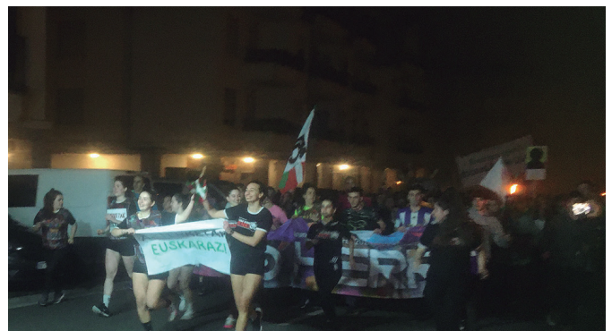
Aztarrrikako gazteek Kalezarreraino gidatu zuten Korrikaren karabana.