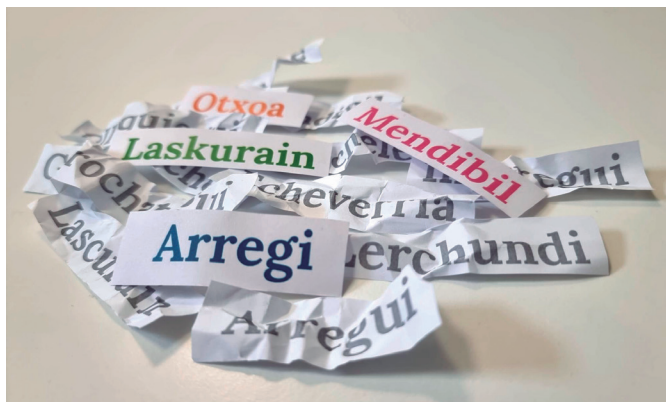
Geroz eta jende gehiagok euskalduntzen du bere abizena Buruntzaldean. AIURRI

Zaharkituta gelditu dira, honetzero, Gorrochategui edo Echeverria bezalako abizenak; jada, ez dira horrenbeste aguirretar, churrucatar edota aramburutar gelditzen eskualdean. Aitzitik, geroz eta gehiagok idazten dituzte beren abizenak “b”, “z” edo “tx” hizkiz. Mende berria ekitearekin batera ipini zuten martxan “Apelliduak abizendu” egitasmoa Buruntzaldeko udalek, tokian tokiko bake epaitegiekin elkarlanean. Hala, ia mende laurdeneko ibilbidean, mila bizilagun inguruk euskaldundu dute deitura, Andoainen, Astigarragan, Hernanin, Lasarte-Orian, Urnietan eta Usurbilen.