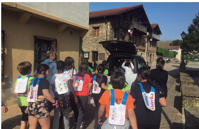
Zubietako eskolakoek giro ederrean osatu zuten Korrika Txikia. NOAUA

baliatu zuten lekuko barruan zeramaten mezua bistaratu eta plazaratzeko harturiko tartea. Kantuan eta dantzan amaitu zuten saioa.