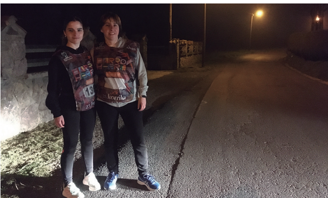
Ikaslan Lanbide Heziketako Ikastetxe Publikoen Elkartekoak, lekukoaren zain.