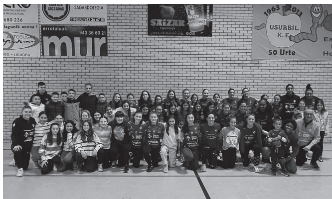
Bera Bera emakumezkoen eskubaloia taldearen entrenamendu saioa ikusteko aukera izan zuten martxoaren 12an Oiarde kirolegiko pista joandakoek.