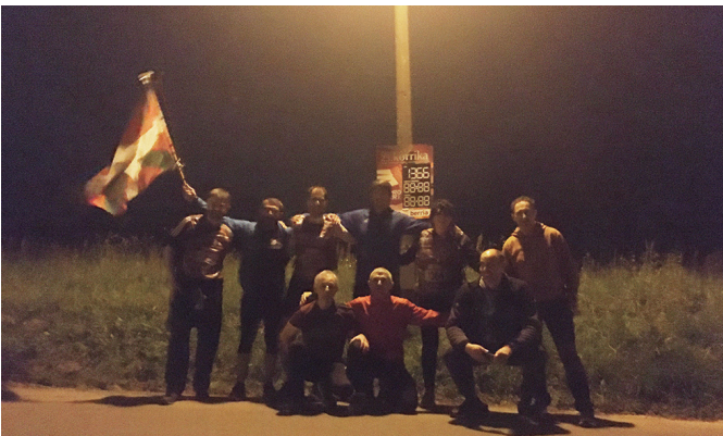
Fagor Automation Berriolakoek argazki argitsuago bat merezi zuten.