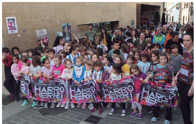
Zirimarakoek ere korrika amaitu zuten familia plana. NOAUA