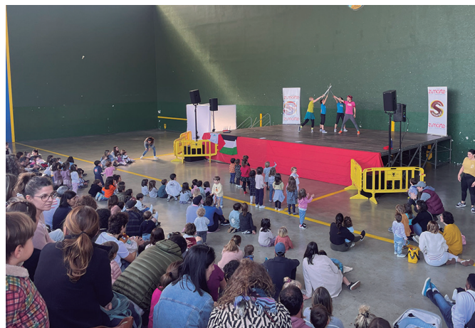
Zubietako frontoia txiki geratu zen aurreko larunbatean. NOAUA