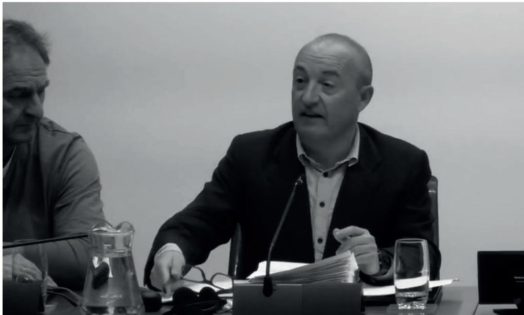
GurasOSek Nafarroako parlamentuko alderdien esker ona jaso zuen, aurreko astean eskaini zituen argibideengatik.