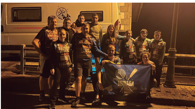
Galardiko gasolindegian Aginagako kuadrilla honek hartu zuen lekukoa.