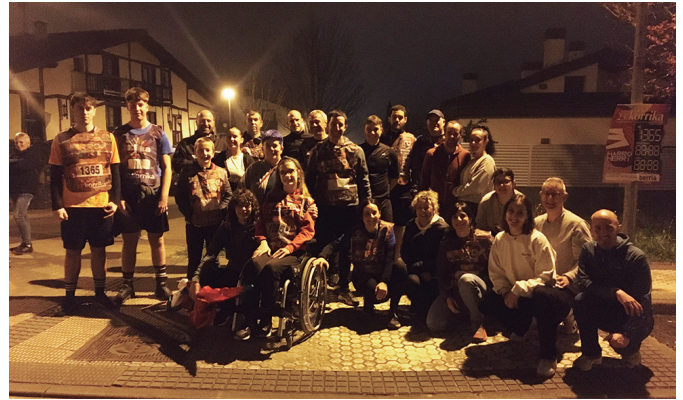
Usurbilgo Lanbide Eskolaren izenean kuadrilla ederra batu zen.