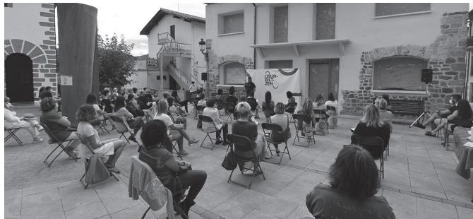
Irekiera ekitaldia eguerdiko 12:30ean izango da.

Usurbilgo Emakumeen Etxea eta kalezartarrak biltzeko udal ekipamendua bateratuko dituen Pelaioenea irekitzera doaz. Kalezar erdigunean kokaturiko eraikinaren inagurazioa, larunbaterako, martxoaren 23rako iragarri dute, ekitaldion bueltan: