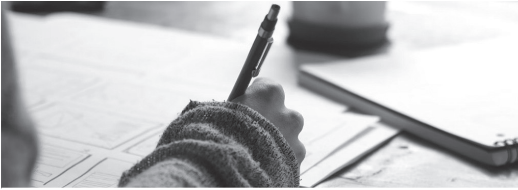
Gai librean idatziko dira ipuinak. Irabazleak 150 euroko balioa duen saskia jasoko du Hurbilagoren eskutik.