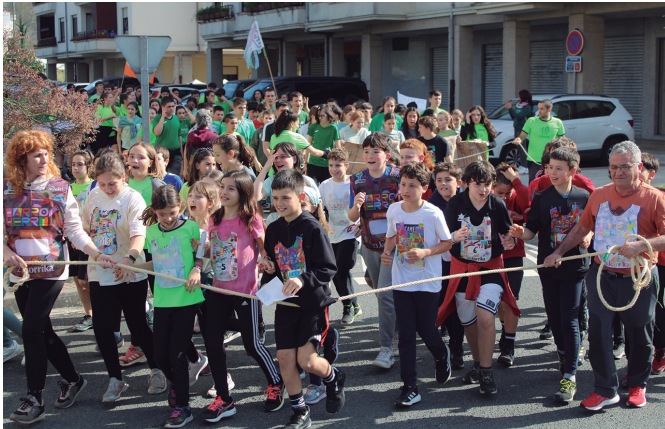
Udarregi ikastolako ziklo guztiek parte hartu zuten Korrika Txikian. NOAUA