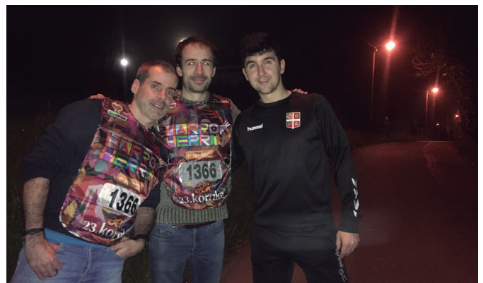
Enpresa Bidean-eko kideei Artzabaleta ondoan egokitu zitzaien.