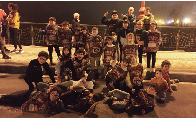
Zubietako Eskola Txikikoek Hipodromoko zubian hartu zuten lekukoa.