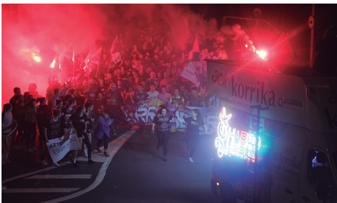
Oxtapeko sarreran, Aztarrikakoek hartu zuten lekukoa.