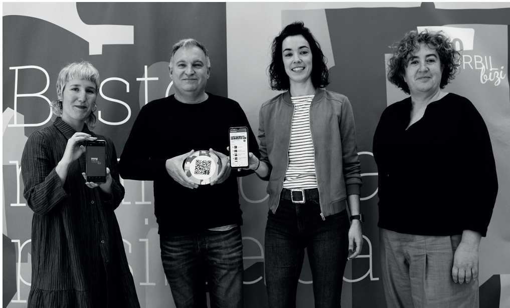
650 Usurbil Bizi telefono mugikorretarako aplikazioaren sustatzaileak.