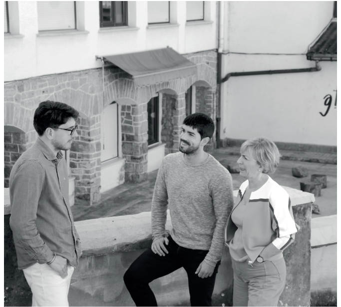
EAJ-PNVko udal ordezkariak, Haur Eskolaren aurrean.