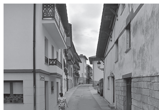
Lanok amaitu artean itxi egingo dute Belmonte kalea ibilgailuentzat.

Lanok amaitu ostean gauzatu dute Kalezarko auzokideek eremu honi lotutako bigarren