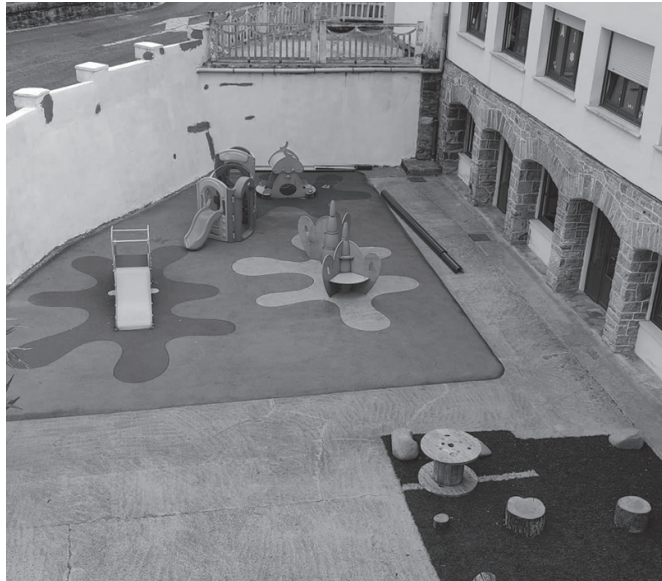
2024-25 ikasturterako begirako matrikulazio epearen datak ere aurreratu ditu udal gobernu taldeak; apirilaren 22tik maiatzaren 3ra izango da.

Araudi honen hainbat xehe- tasun eskaini zituen udal go- bernu taldeak. Batetik, haur eskolako plaza kopurua mug- atzea erabaki dute. Gehienez, 92 haurrentzako lekua egongo da. Hala, 12 haurrentzako le- kua egongo da 0-1 etapan; 26 umeentzako 1-2 etapan; eta, azkenik, 54 haurrentzako lekua 2-3 etapan. Banaketa honek, alkate Agurtzane Solaberrietak azaldu zuenez, "Usurbilen