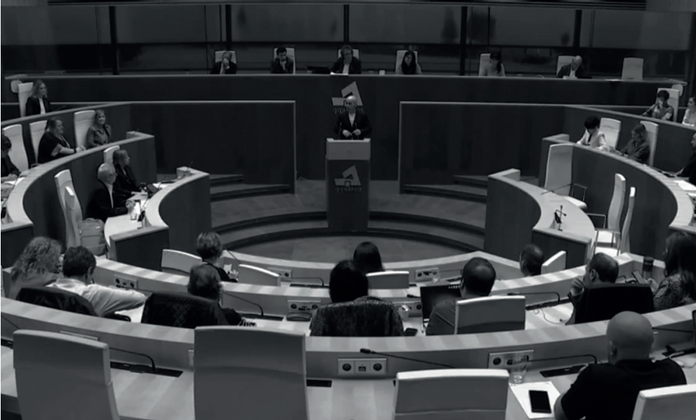
Gipuzkoako Batzar Nagusietan martxoaren 20an eginiko osoko bilkura.