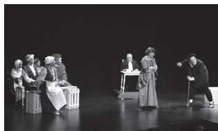
Ostiral honetan, arratsaldeko 18:30etik aurrera, Sutegin.

Lau antzezlan antolatu ditu Gure Pakea Elkarteak apirilaren 19an, arratsaldeko 18:30ean Sutegiko auditorioan. Honako hauek: 'La fablilla del secreto bien guardado', 'El Oso', 'Cuando las mujeres juegan al mus' eta 'Sinceridad'.