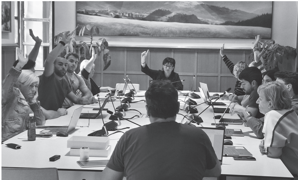
Udalak egin duen estimazioaren arabera, 2,2 milioi eurokoa litzateke hiru urteko esleipena.