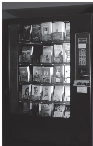
Zergatik ez izan eskura liburu-makinak edari- eta janari-makinen ondoan?

Agian gehiago sozializatu eta egoteak lagunduko luke, gure bizitzetan liburuak eta irakurketak presentzia