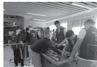
Informazio gehiago jaso daiteke lhusurbil.eus atarian.

Lanbide Eskolako hezkuntza proiektua eta azpiegiturak eza-