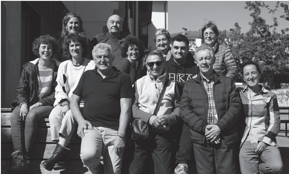
Asteartero, ordu eta erdiz paseotxoia eman ahalko da taldean, hitzordura bertarutzen diren guztiokin.