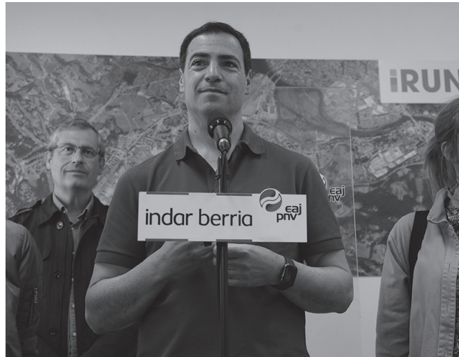
Imanol Pradales, EAJ-PNVren lehendakaria.

Konpromisoa hartzen dugu gaixotasun kronikoak dituzten pazienteen tratamenduan eta