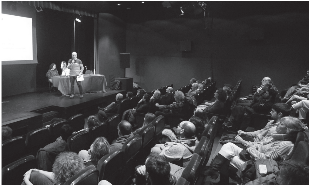
Dagoeneko 43 bazkide ditu Sortaldek. Datozen egunetan informazio-mahai bat ipiniko dute Sutegiko kanpoaldean.