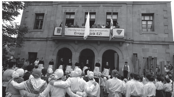
Datorren astelehenean zabalduko da proposamenak helarazteko tartea.

Usurbilgo Jai Batzordeak txupinazoa nork botako duen erabakitzeko herritarren ekar-