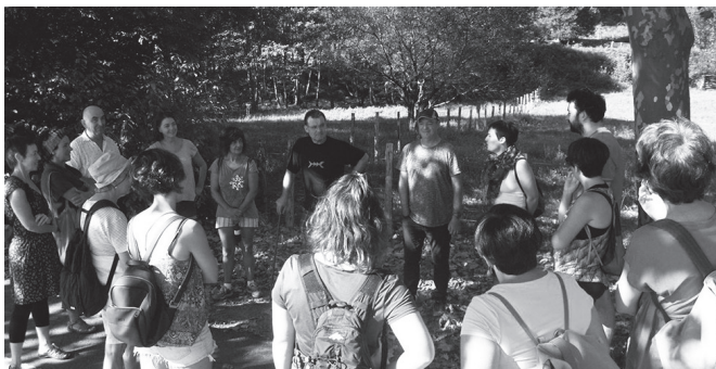
Zubietako Iruin sagardotegiko aparkalekutik abiatuko da bertso-ibilaldia.

Thierry Escaichesk eskainiko du. 17:00 Salbatore elizan.