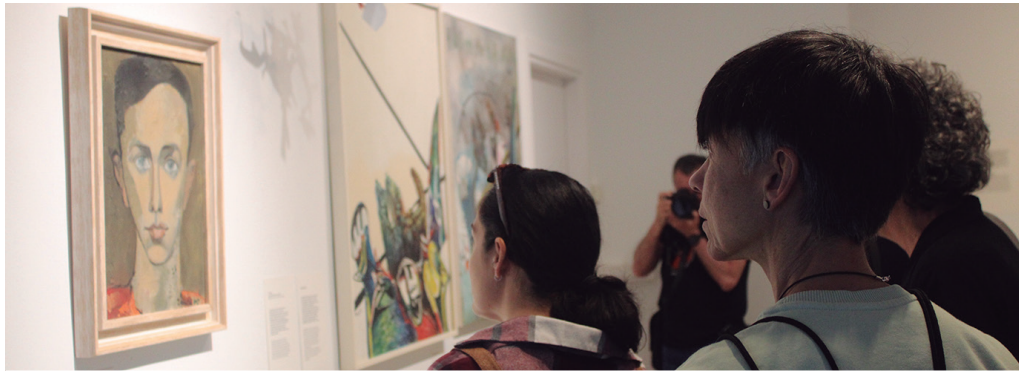
Inauguratu zenetik hona, jende ugari izan da Sutegin. Bertan topatuko duzue 'Zumetaren Usurbil' erakusketa.