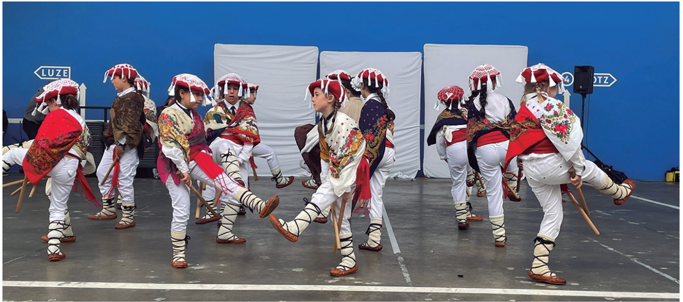
Larunbatean, Dantzari Txiki Eguna. "Gure txikien kasuan, sagar dantza, makil txiki, axuribeltza... halakoak dantzatuko dituzte", jakinarazi digute Orbeldiko lagunek.