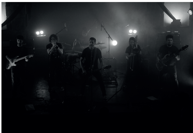
Loita Amada galiziarren kontzertua Aginagan.