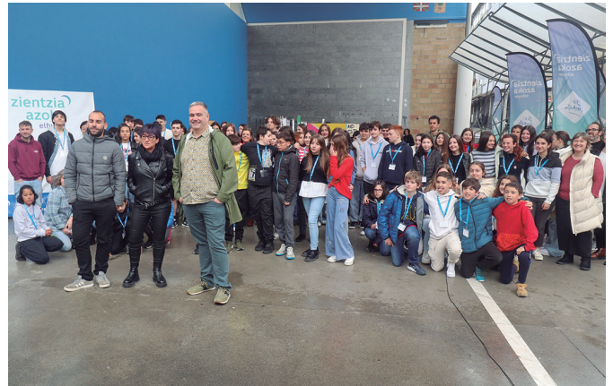
Elhuyarreko eta Udaleko ordezkariak, azokako protagonistekin batera.

etorritako gazteek. Haiekin ziren baita etxeakoak, Udarregi ikastolakoak. Dozena batetik gora proiektu aurkeztu zizkieten haien postuetara gerturaturiko bisitariak; hala nola, bluetooth bidezko autoa aurkeztu zuten, laguntza animaliak eta buru-eritasunak lotutako proiektua, sugandilak behatzekoa, intsektuen hotela, beso domotikoa... Udarregi ikastolako DBHko lau taldeek beste hainbeste proiektu aurkeztu zituzten azoka honetan: argazki kamera barruan gertatzen dena irudikaturiko "ganbera iluna", herriko hain-