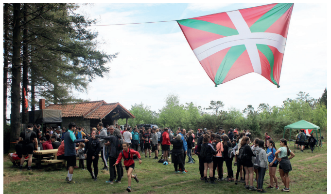
Azkenean, ateri eutsi zion. Ez zen aterpe beharrik izan Andatza Egunean.