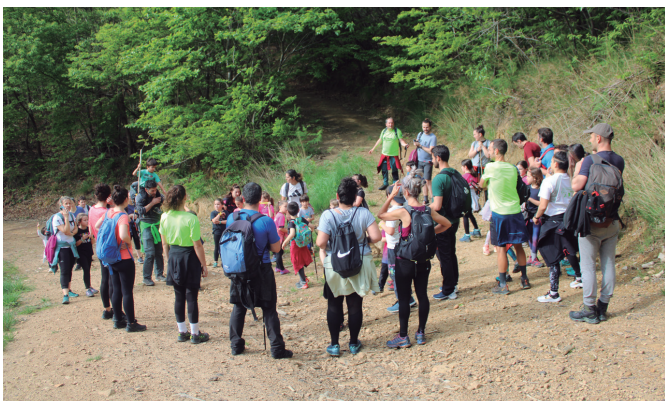
Zirimararen familia planean igo ziren irudikoak Andatza Egunera.