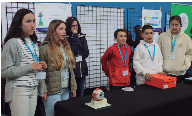
Elhuyar Azokako parte hartzaileen artean ziren Udarregi ikastolakoak.