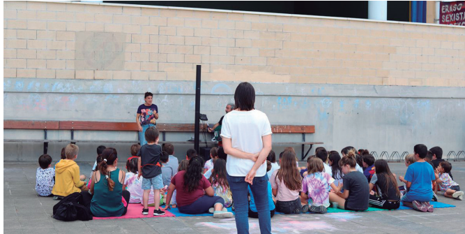
Zubietako Eskolako Guraso Elkarteak antolatzen du UdaFest zikloa.

Zubietako eskolako guraso elkartearen eskutik, ikasturte amaierara begirako azken txanpa ospakizunerako tartean bilakatuko dute UdaFest zikloan iragarritako ekitaldiokin: