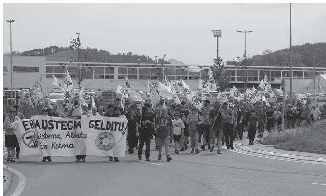
"Erraustegiak ez du konpondu hondakinaren arazoa eta, aldiz, Zubietan eta inguruetan eguneroko ogia da hondakinaren errekuntzak eragiten duen kutsadura".

Horren guztiaren aurrean, ordea, bestelako aukerarik badela gogorarazten dute. "Hondakinak kudeatzeko badaude errausketa baino sistema hobea, garbiago eta merkeagoak, eta Gipuzkoan bertan martxan dauzkagu hainbat herritan. Alferrrikako erraustegi hau gelditu beharra daukagu. Baina martxan dagoen bitartean, erraustegiaren arduradunen lehentasuna izan behar du bermatzea bertatik ez dela zabaltzen ez dioxinarik, ez PCBrik, ez PFASik, ez metal astunak eta ez bestelako kutsatzaileak".