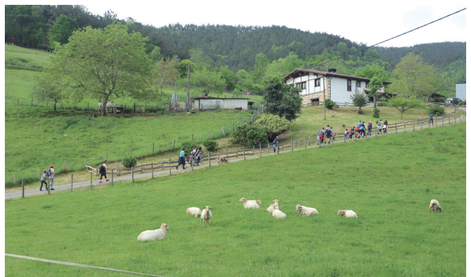
Andatzara bidean, Urdaiagako plazatik abiatutako Zirimararen ekimeneak.