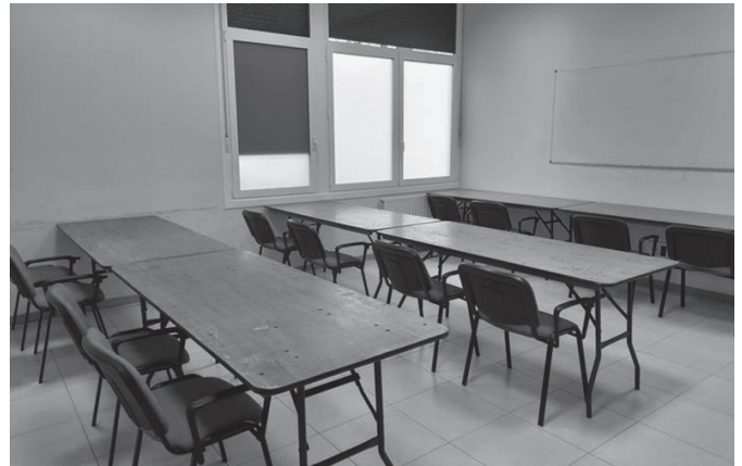
Maiatzean eta ekainean, DYAko egoitzaren gela bat ikastoki izango da.

Sutegi liburutegian bada ikasteko espazioa oraindik, baina hainbat erabiltzailek ohartarazi izan dute ez dela egokia. "Arazo hori bideratzeko proiektua idatzia du udalak, eta bitan