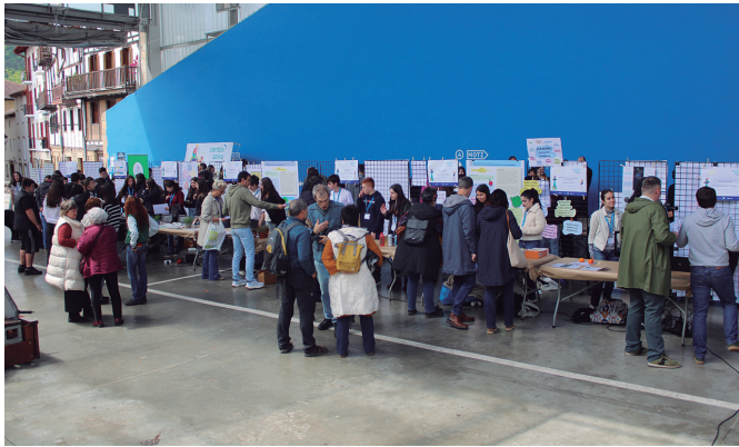
Gipuzkoako hamaika ikastetxeetan landutako proiektuak aurkeztu zituzten.