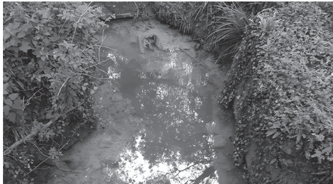
Belmonte kaleko obretako isurien ondorioz, Aranerreka txuri zetorren.

Antolatzailea: Alkartasuna Usurbilgo Baserritarren Kooperatiba. Laguntzailea: Usurbilgo Udala.