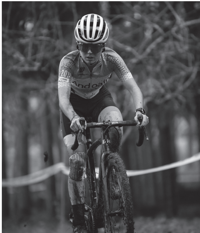
Ziklo-krosseko lasterketak prestatzeko, "lagun baten gurasoen lursailean entrenatu behar izan dut aurten".

Infantiletara iritsi arte Usurbilgo taldearekin aritzen nintzen eta astean pare bat aldiz entrenatzen genuen. Txukun ibiltzen ginen denok. Kadete mailara iristean, anaiaren entrenatzaile bera hartzea erabaki nuen, anaia ere bizikletan ibiltzen