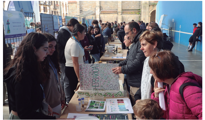
Eskualde ezberdinetako 12-18 urte arteko gaztetxoak bildu zituen azokak.