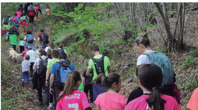
Andatza Eguneko irudi gehiago, noaua.eus atarian.