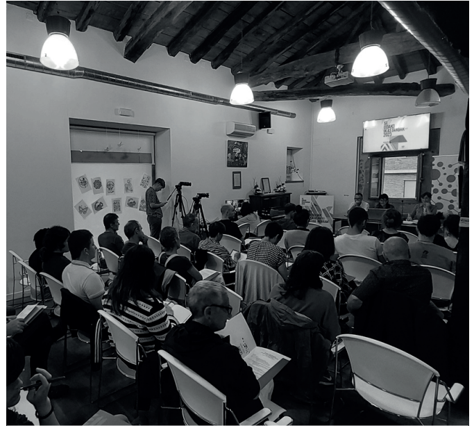
Gizarte mugimenduei buruzko iazko Jakin Jardunaldiko une bat.

12:30-13:15 "Batzuk, bestiak eta piztiak. Euskal gatazkaren irakurketa bitarra gainditzeko proposamen feminista bat".