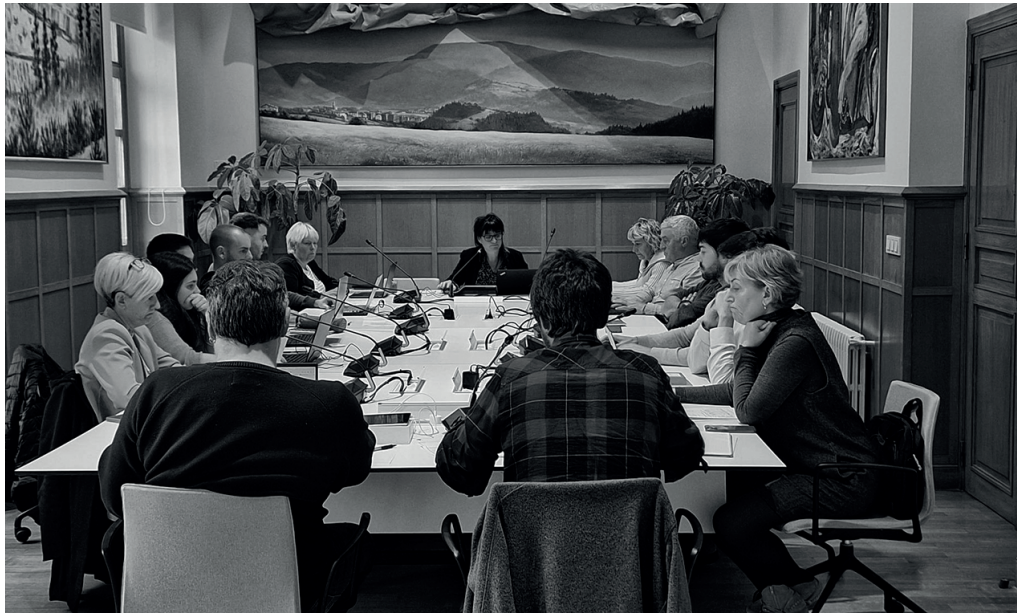
Apirilaren 25ean egin zuten osoko ohiko bilkura. Ordenantza fiskaletan zenbait aldaketa txertatzea erabaki zuten.