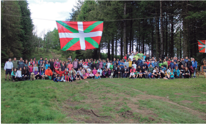
Maiatzaren 5ean Andatza Egunera igotakoen talde argazki jendetsua.