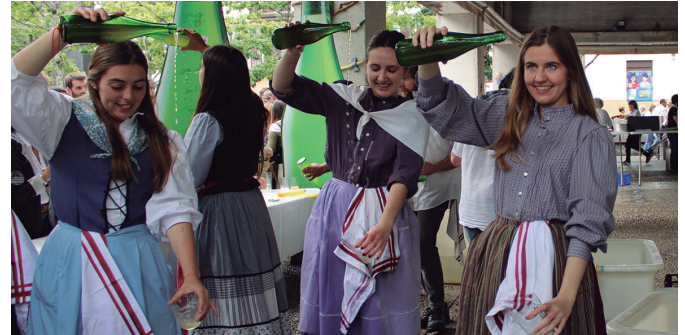
Sagardoa dastatzeko aukeraz gain, pintxo aukera zabala izan ohi da.

Usurbildarren urteko festa egun nagusia ate joka dugu. Maiatzaren 19an ospatuko dugu 41. Sagardo Eguna. Honatx antolatzaileek iragarri duten egitaraua: