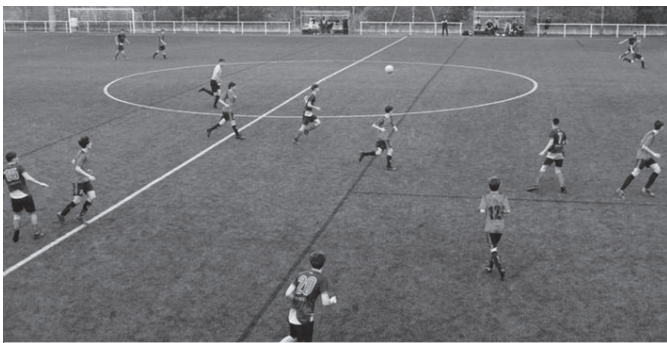
Touring-en aurkako partidaren 6-3ko emaitzarekin nagusitu ziren usurbildarrak.