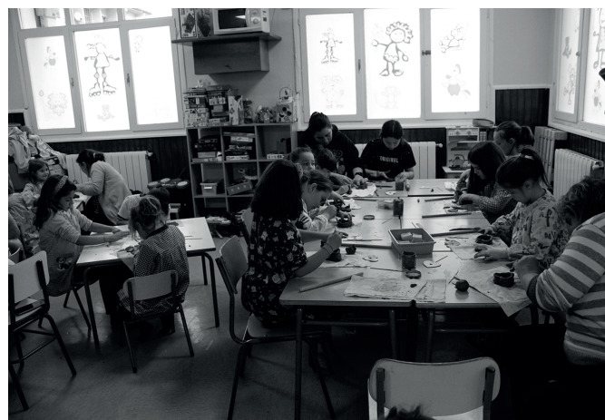
Buztinarekin jolasean eta sortzen, Santueneko ludotekan.