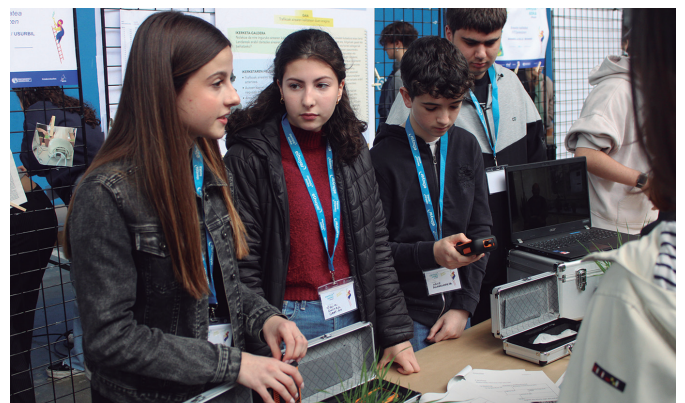
DBHko ikasleek landutako lau proiektu aurkeztu zituen Udarregik.