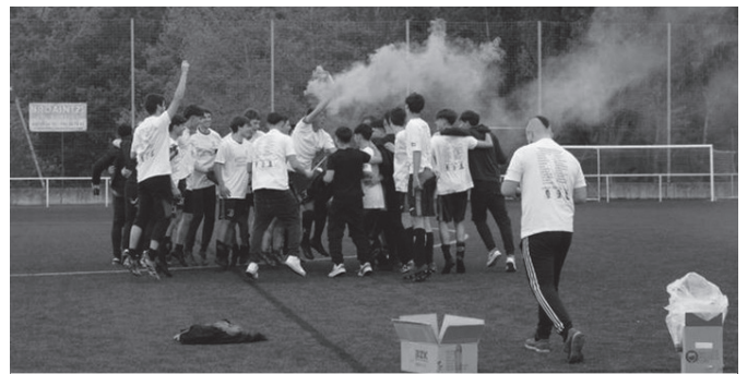
Partida amaitu eta berehala lehertu zen festa giroa Haranen.