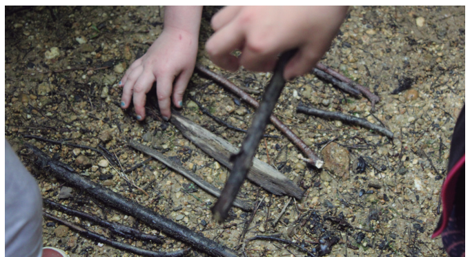
Naturarekin jolasean aritu ziren Zirimararen familia planeak.