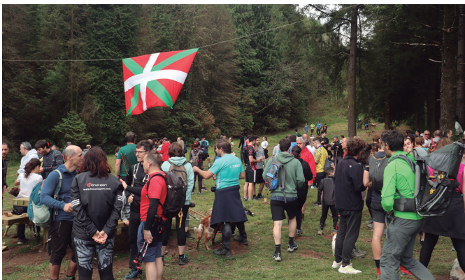
Ibai-Ondokoen hamaiketako goxoa dastatu zuten Andatzara igotako bisitariek.