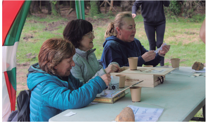
Ibai-Ondo elkarteko kideak gogotik aritu ziren antolaketa lanetan.