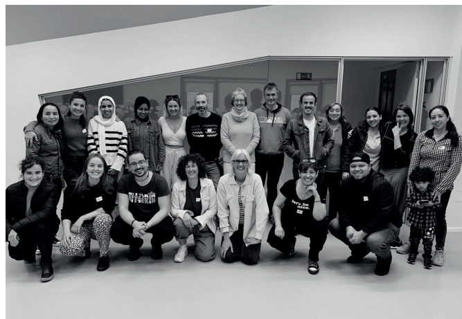
Vachoca tailerreko parte hartzaileak, pasa den asteleheneko saioan.