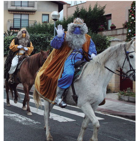
Kabalkada 17:00etan abiatuko da.