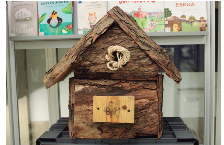
Postontziak hainbat tokitan ipini dituzte.

Azken urteotan, Hurbilagoren etxolek argiztatu izan dituzte eguberriak. Aurten, ordea, urte garai honetako giroa eremu gehiagotara