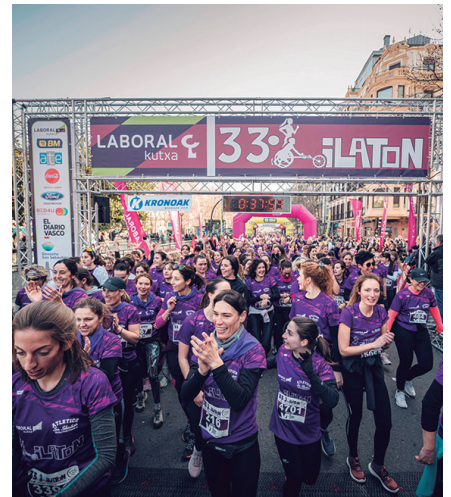
Abenduaren 23an amaituko da izen-ematea.

Izena emateko epea horren arabera jarri duten arren, epe horretatik kanpo ere eman ahal izango da izena, Lilatoian parte hartzeko izen-ematea irekita dagoen bitartean.