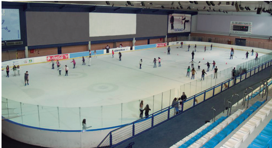
Abenduaren 23an eta 27an, Gaztelekukoek irteera bana antolatuko dute.

Ekimen honi buruzko informazio gehiago bideotatik jaso ahalko da: Gaztelekuan, gaztelekuausurbil@gmail.com helbidean edo 688 813 853 telefono zenbakian.