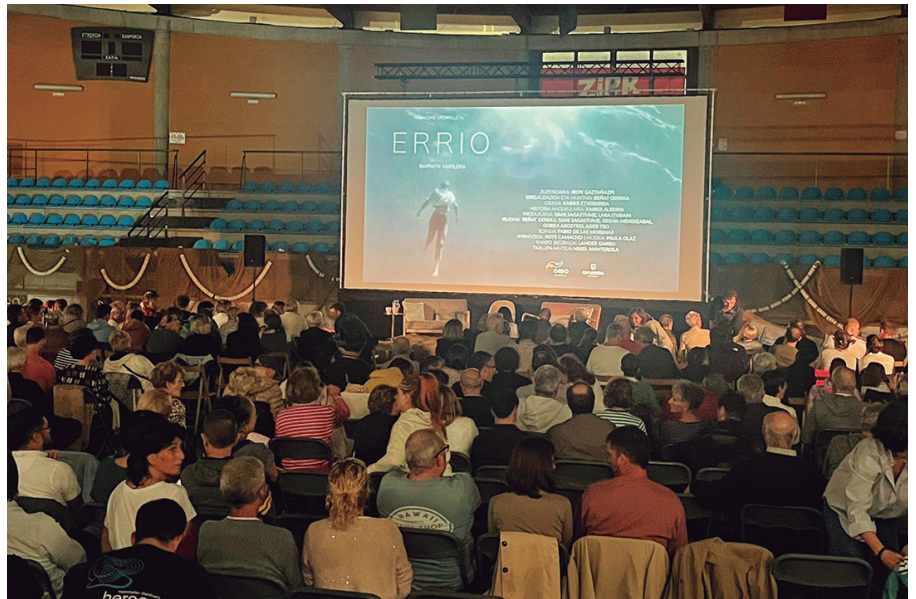
Orion egin zen Errio dokumentalaren estreinaldia. Aginagan ikus ahal izango da abenduaren 22an, 17:30etik aurrera, Aginagako Eliza Zaharrean.

"Errio" dokumentaleko protagonista zuzendarietako bat izango