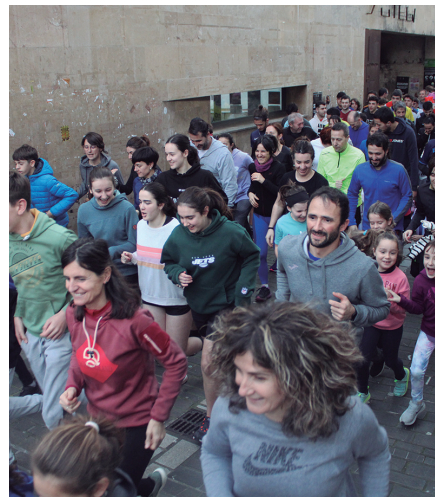
San Silvestre proba 17:00etan hasiko da.

Aurreko urteen ildotik, opariak zozketatuko dituzte parte hartzaileen artean.