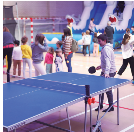
Urtarrilaren 2tik 4ra, Oiardo kiroldegian.