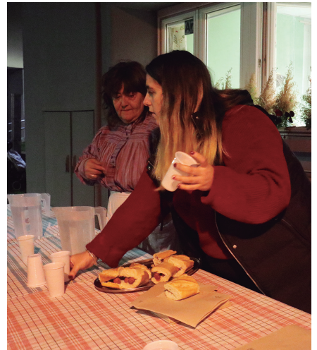
Abenduaren 21ean txistorra banatuko dute.