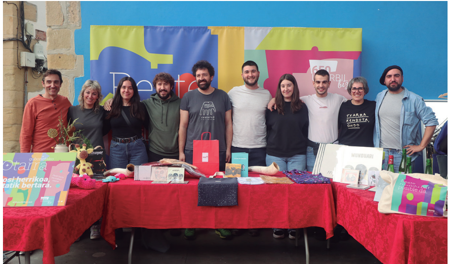
10 euroko erosketen truke, txartel bat jasoko duzu. Datuekin bete txartela eta saltokian bertan aurkituko duzun kutxan sartu. Abenduaren 28an argituko dira sarituen izen-abizenak.

Segidan duzue, otar hauen zozketan parte hartzeko txartelak non eskuratu ahalko dituzuen baita otar hauetan zer nolako produktuak izango dituzten. 18 kultur sortzai- leek eta 12 ekoizleek bat egin dute aurten ekimen honen hirugarren edizioarekin; 30 guztira, iaz baino bat gehiago.