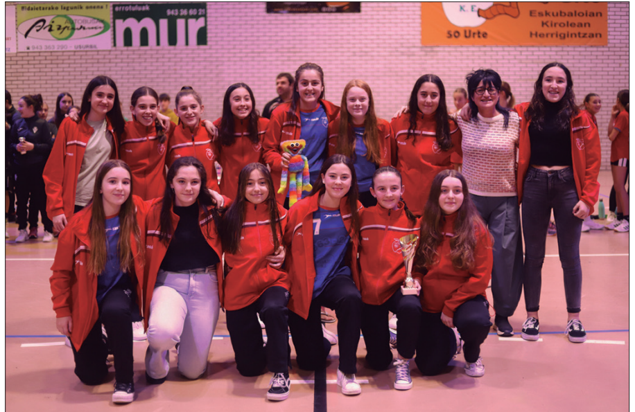
Nesken zein mutilen artean, Usurbil KE-ko bi talde ariko dira lehian.