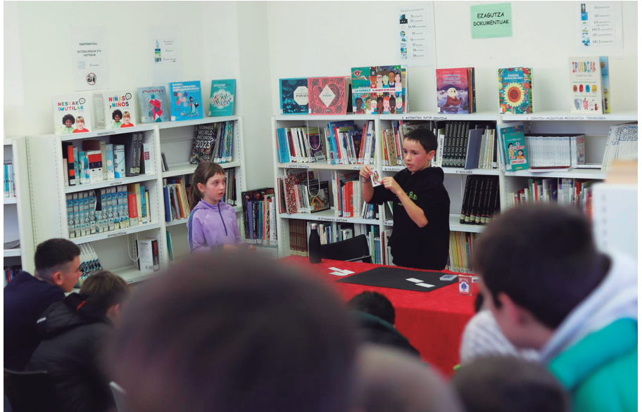
lazko abenduan, magia ikuskizun bat eskaini zuen udal liburutegian.

Ahal den lekuraino, dena nahi dut. Komunitatearen barnean ondo jarritako magoa izan nahi dut, ez bakartia dena. Lehiaketak ere izaten dira elkarteak ordezkatzeko. Mundu oso zabala da.