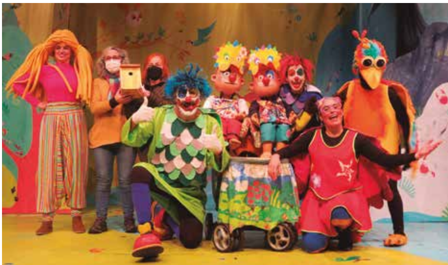
Bi saio eskainiko dituzte abenduaren 29an: 16:00etan lehen, 18:30ean bigarrena.