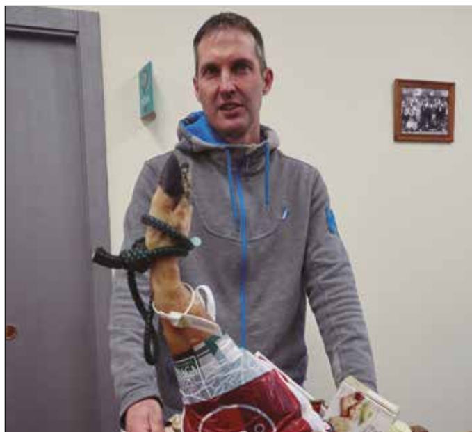
Publizitatea jarri dutenen artean: Añorga Txiki kristaldegia.