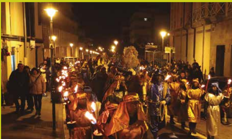
Arratsaldeko 17:00etan abiatuko dira Urdaigatik eta 19:00ak aldera kaxkoan izango dira.

Oraindik frontoian ekitaldirik egingo duten zehazteke dago, pandemiaren egoeraren bilakaeraren arabera izango baitira frontoiko ekitaldiaren nondik norakoak. Baliteke aldaketak izatea. NOAUA!ren webgunearen bidez xehetasun gehiago jasotzeko aukera izango da datozen egunetan.