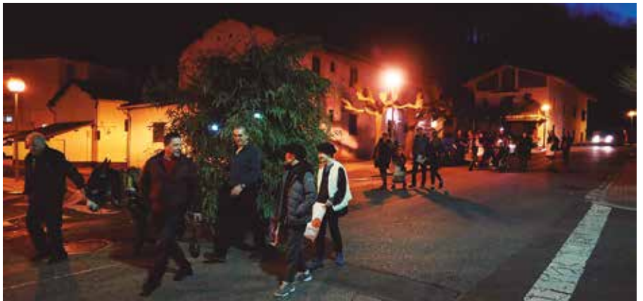
Duela urte batzuk eginiko argazkian, Olentzero Santuenea auzora iristen.

Gabonetako ekitaldiekin amaitzeko, Olentzeroren etorrera ospatuko dute auzoan, hilaren 24an.