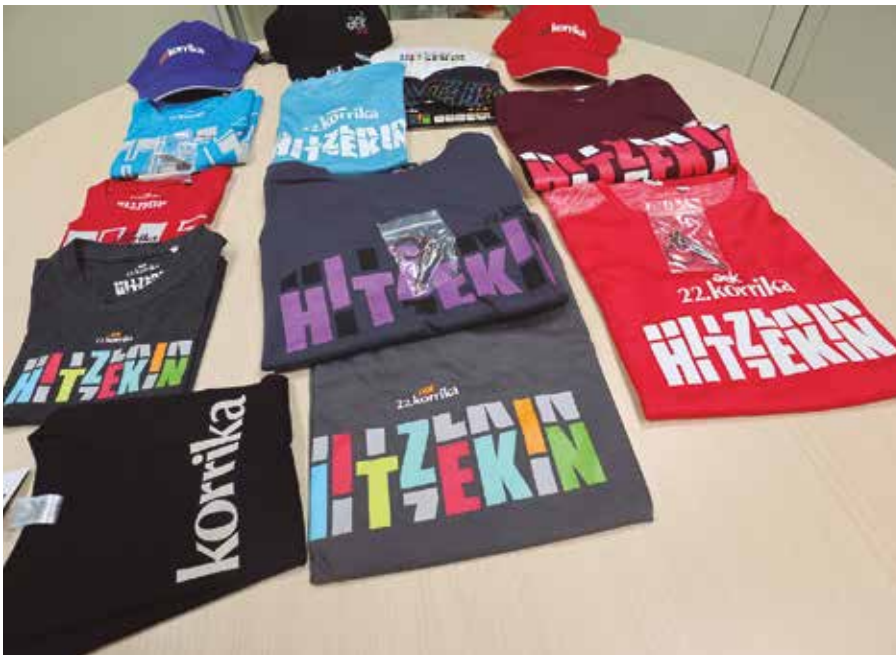
Tamaina ezberdinetako kamisetak, biserak, lepokoak, giltzarrapoak... Osagai ugari dago aukeran.

Urtarriletik aurrera ezagutuko ditugu 22. Korrikari buruzko xehetasun gehiago.