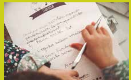
Hilaren 24ra arte egongo dira postontziak ipinita.

Hitzordu hau ospatu ahal izateko antolakuntza talde zabala osatu dute, Udalak, herri eragileek eta herritarrek. Hala, ostiral iluntze honetan Olentzeroren ongi etorria girotzen ikusiko ditugu hainbat herritar. Herri auzolanean prestatuturiko