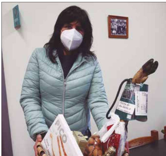
Publizitatea jarri dutenen artean: Usurbil Optika.