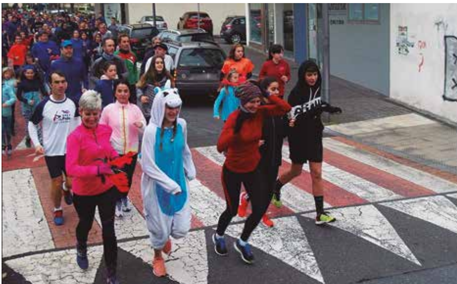
Mozorro onenari sari berezia emango zaio lasterketaren amaieran. Argazia 2018koa da.