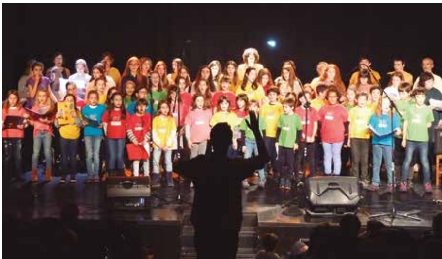
Zumarteko Abesbatza guztiak Salvatore Elizan elkartuko dira abenduaren 22an.

■ Edukiera mugatua izango da eta musikoa derrigorrezkoa izango da.