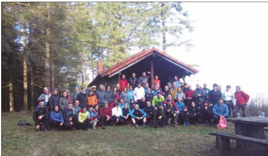
Urtarrilaren lehenean beti bildu ohi da mendizale talde bat Andatzan. Argazkia duela bi urtekoa da.

Covid-19ak eragindako osasun krisialdiagatik bertan behera utzi behar izan zuten iazko proba. Hamargarrena izan behar zuen edizio borobila oraingoan bai, urtebeteko atzerapenarekin baina 2022. urtean ospatuko da, urtarrilaren 30ean.