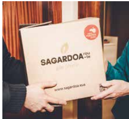
Sagardoa Route web orrialdeak eskaintzen du online zerbitzua.

12 botilako kaxa batean sagardo ezberdinak nahas daitezke, denak sagardotegi berekoak erosi beharrean.