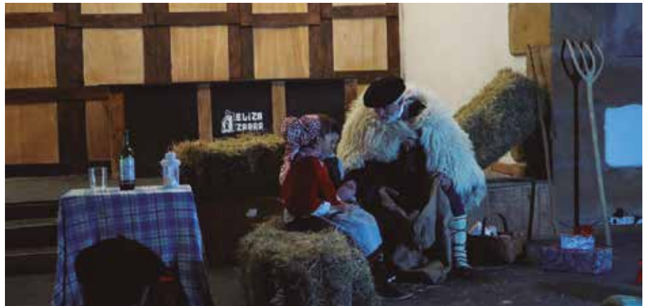
Olentzerok gaztetxoek gutunak jasoko ditu abenduaren 23an, Eliza Zaharrean.

Sekañako bidegurutzean elkartuko dira arratsaldeko 18:00etan, Olentzerori harrera egiteko, eta ondoren gaztetxoek gutunak jasoko ditu Eliza Zaharrean. Eguna borobiltzeko, gaztainak eskainiko dituzte bertan.