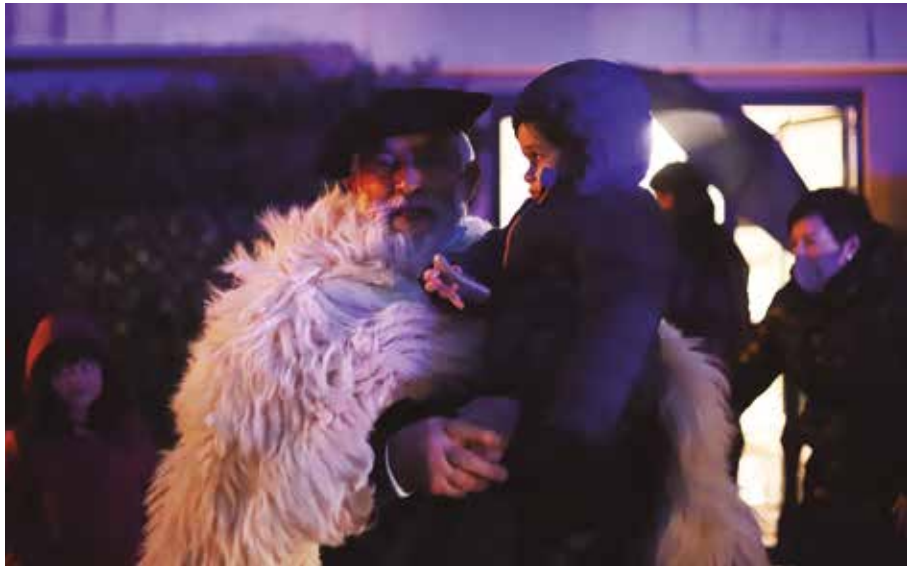
Abenduaren 24an, iluntzeko 19:00ak aldera iritsiko da Mikel Laboa plazara.

Eta handik herri erdigunerantz jaitsiko da; Aliproxekeko biribilgunera lehenbizi, gero Errekatxiki eta Puntapax kaleak zeharkatu eta handik Bordatxoko erroton-