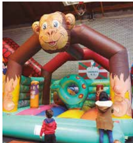
2 eta 12 urte arteko gazteentzako parkea egokituko dute Oiardo kiroldegian.