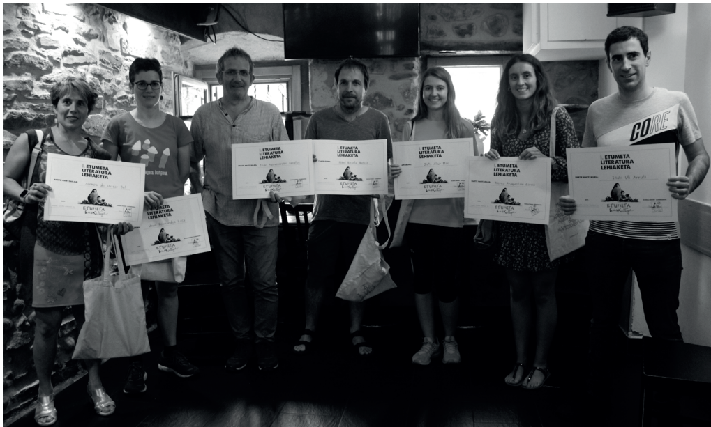
1. Etumeta Literatura Lehiaketako sarituak, ekainaren 7an Txiribogan eginiko ekitaldian.