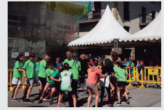
Igandean, Umeen Eguna.

Jai Batzordeak plazaratu duen egitarauan ez dator, baina ostiral arratsaldean ere irtengo dira buruhandiak. Gazteak eskean dabiltzan bitartean, buruhandiek jarriko dute gatza eta piperra Kalezarren. Arratsaldeko 17:30ean hasita.