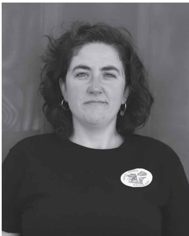
"Maiatzean eta ekainean izaten da liga eta hiru saio izaten dira". NOAUA

Sega oso lotuta dago urtaroei. Belarra izaten da apirilatik urria bitartean. Astean behin segalari aritzen saiatzen naiz etxean. Lursail txiki bat daukat etxean eta bertan saiatzen naiz, nahiz eta askorako ez didan ematen. Belarra ebakitzen baduzu, hasi arte zain egon beharra dago. Segalari herri kirola oso lotua dago urtaroiari eta belarraren gorabeherei, beste herri kirol gehienak ez bezala. Neguan belarrak ez dagoenez, mendira joaten saiatzen naiz edota igerilekuan igeri egiten. Alderdi fisikoa lantzen dut, batik bat. Ordubeteko saioak izaten dira geldialdiekin eta abar. Gerriko minak ohikoak