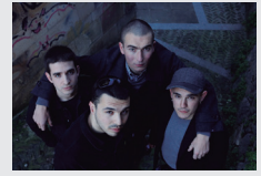
Inguma oi taldea.