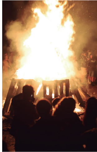
San Juan sua 22:00etan piztuko da.