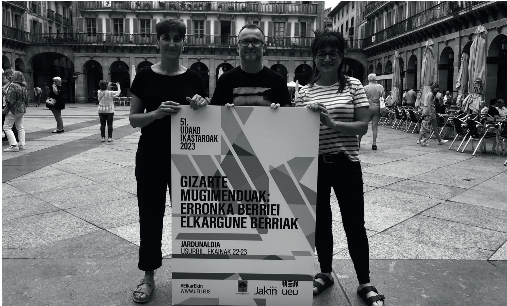
UEU, Jakin eta Usubilgo Udala, Jakin Jardunaldiaren aurkezpen agerraldian.