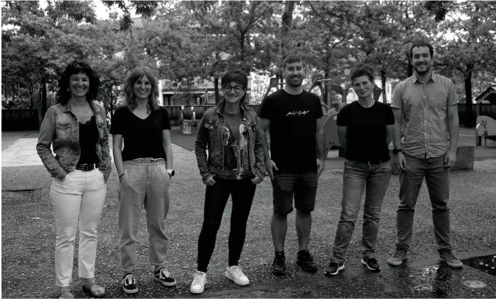
Gazttxoen euskalduntzeko errefortzu programaren sustatzaileak aste hasierako agerraldian. NOAUA