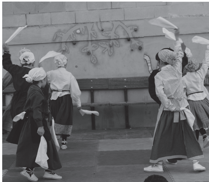
Zubietako Eskolako ikasleak hasi dira ikasturteari agur esaten.

Azken ekitaldia, ostiral honetarako, ekainaren 16rako iragarri dute. Antzerki eguna iragarri dute, arratsaldeko 17:00etan hasita.