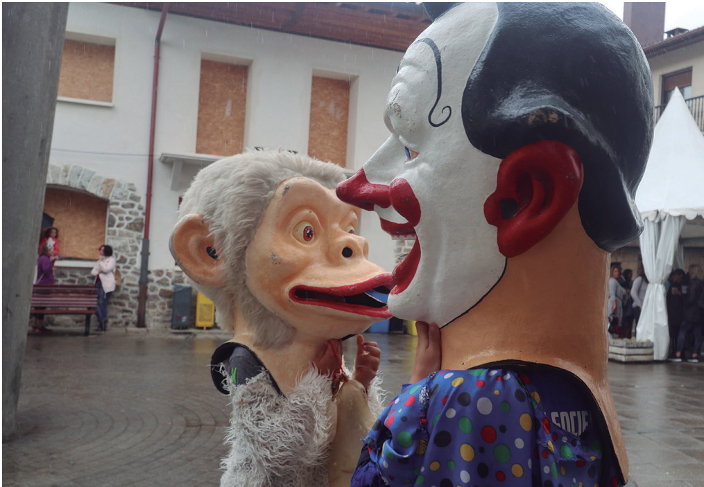
Ekainaren 23an ostirala, arratsaldeko 17:30ean aterako dira buruhandiak. NOAUA