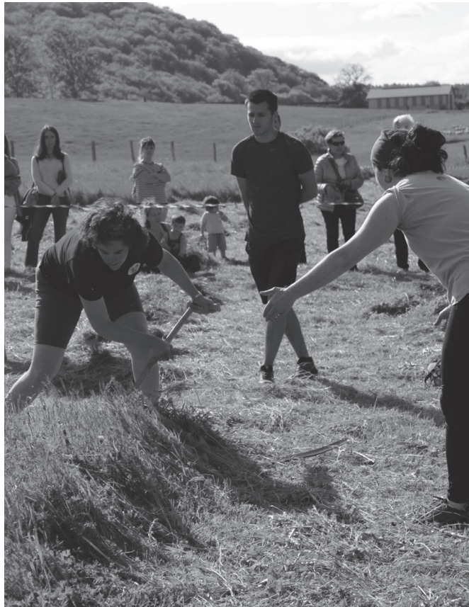
"Segan beti laguntzaile batekin ateratzen gara belarra ebakitzera". NOAUA.

Ez, 2020an Santixabeletan ekitaldi gutxi batzuk izan ziren pandemia zela medio eta data