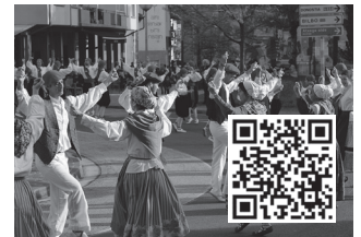
Eguerdian, Mikel Laboa plazan.

Bestalde, irekia dute 2023-2024 ikasturterako izen-ematea. Informazio guztia haien sare sozialetan dago. Izena emateko formularioa argazkiko QR kodean duzue. Aurrez aurre egitea nahiago dutenek aukera izango dute ostiral honetan, ekainak 16, 17:30-18:30 artean kiroldegian.