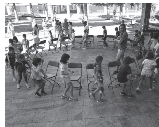
Ekainaren 16an itxiko da epea.

Ekainaren 30ean ospatuko da Santixabel jaien baitako Haurren Eguna eta guraso talde bat ekimen sorta bat prestatzen ari da. Izen-ematea ordea, ekainaren 16an itxiko da.