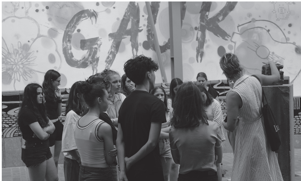
Diwan Plesidy ikastetxeokoak Usurbilen izan dira astebez. NOAUA