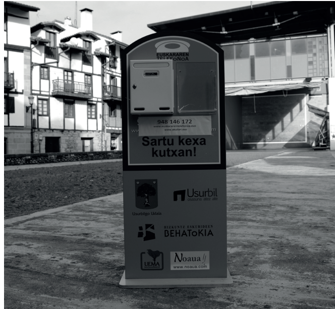
NOAUAn, Potxoenean edota behatokia.eus-en kexatu gaitzke. NOAUA

Askotan herrian zer dagoen tratatzen da bakarrik, eta euskaraz bizi gaitzke. Baina usurbildarrek ere kontsumitzen dituzte multinazionalen zerbitzuak. Hor dugu Urbil ere, internetetik jasotzen ditugun zerbitzuak, online edo telefonoz jasotakoak. Baina zer eskaintza egiten zaigu euskaraz? Katalunia edo Galiza egiten ari zen inbertsioa teknologia berriak haien hizkuntzan eskaintzeko, oso atzean geratzen ari gara gu. Hor baditugu, Elhuyar bezalako erakundeak teknologia berriak euskaraz sustatzen ari direnak, baina orokorrean oso atzean geratzen ari gara. Guk hizkuntzaren corpusari