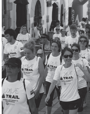
Lasterketa goiz partean hasiko da.