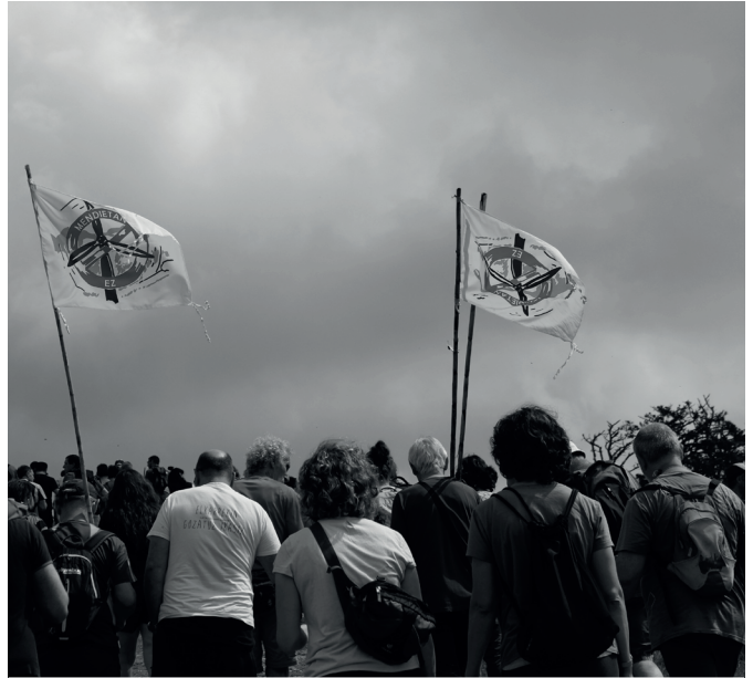
Ezkeltzura txangoa antolatuta zuten ekainaren 4an.

Bioaniztasuna arriskuan jarriko lukeela diote. "Ezkeltzuko ekosistemaren orekari eusteko funtsezkoak diren hainbat anfibio, narrasti eta mikrougaztun bizi dira bertan", eta "hauen galera oso larria litzateke", egoera zaurgarrian edo desagertze arriskuan daudelako. Errota hauen "besoak jota" 150 espezie-tako hegazti eta hainbat espezie-tako sagusarrak hiltzeko arriskuan egongo liriateke. Tokiko abeltzaintza ere kalte-tuko luke parke eoliko honek; besteak beste, "larreen murrizte nabarmena, ganaduaren osasunean zein ongizatean eragin kaltegarriak...". Ez soilik animalia eta landareentzat, gizakiontzat ere kaltegarria izan daiteke. Errota hauek "kilometrotara zabaltzen dituzten infrauhinak sortzen dituzte". Horien eraginean denbora luzez egoteak