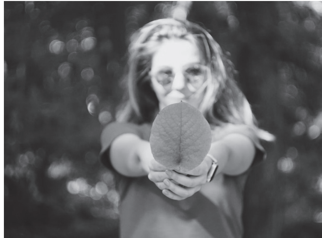
"Ingurumenari buruz komunikatzeko dekalogo bat osatu du Elhuyarrek".

4) Justizia eztabaidara ekarri: ingurumen-larrialdiari heltzeak, hau eta beste hainbat gatazka eragin dituen botere-abusuari aurre egitea dakar berarekin.