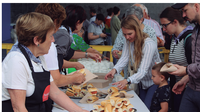
Soka-dantza bezalaxe, lore eta salda banaketa ere frontoian egin zen.