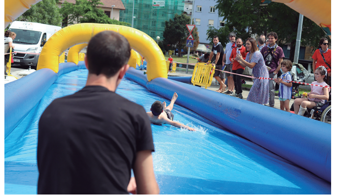
Ur puzgarrietan gozatu ederra hartu zuten gazteek.