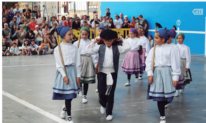
Orbeldiren dantzari txikienek frontoiko publikoa liluratu zuten.