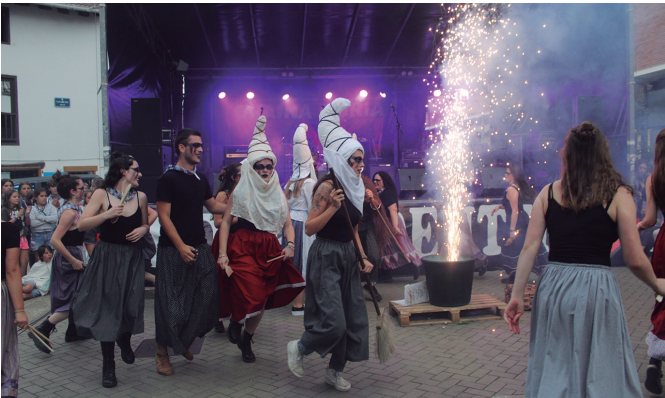
Euskal Herri askerantz, edabe berezia prestatu zuten gazteek jaien hasieran.