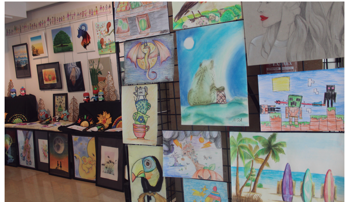
Zirriborro tailerrekoek urteko lanketa ikusgai jarri dute egunotan Sutegin.