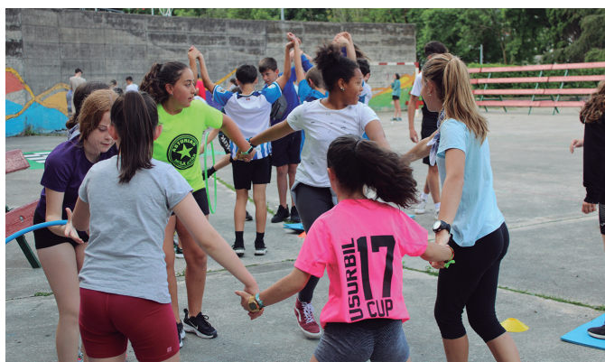
Erronkan talde jolasak nagusi, elkarrekin parte hartu zuten.