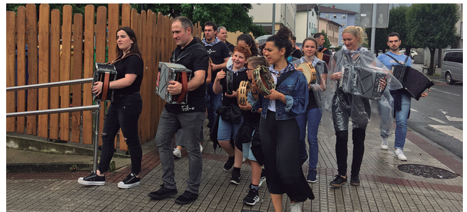
Triku taldea kalejiran ibili zen Santixabel egunean. Euriak ez zituen kikildu.