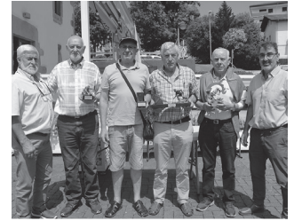
Argazkian, sarituak eta antolatzaileak.