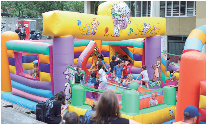
Jaietako azken egunean, Olanoeña plaza puzgarriekin bete zen.