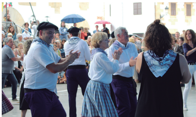
Udal zinegotzi bakoitzak gonbidatu bat atera zuen plazara.

Soka-dantza bukatu eta berehala, lore eta salda banaketa hasi zen. Txalotzekoa Hurbilagokoek egindako lana.