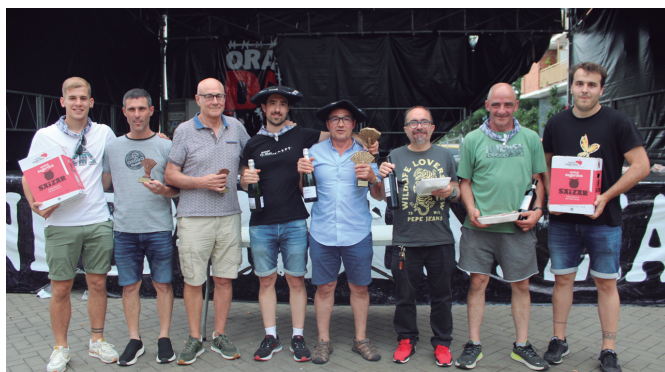
Lehia bizia izan zen mus lehiaketan. Irudi honetan dituzue txapeldunak.