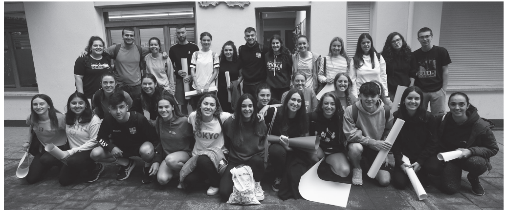
Argazkian ageri den hezitzaile talde hau arituko da lanean aurtengo Udajolasen. NOAUA

Aurten jaiak astelehen gauean amaitu direnez, asteartez ekin zaio NOAUA! Kultur Elkaratek eta Usurbilgo Udalak antolatutako Udajolasi. Inoizko parte hartzaile gehien izango ditu aurtengo edizioak; 200 partaideko muga gainditu da, 4-12 urte arteko 209 gaztetxok izena eman du aurtengoan. Izen-emate datuak zikloka xehatzen baditugu, Haur Hezkuntzatik 74 izan dira izena eman dutenak, 135 Lehen Hezkuntzatik. Haur Hezkuntzan