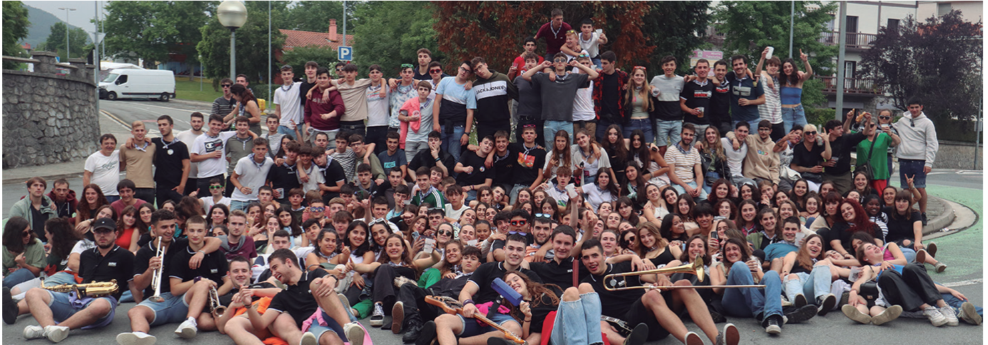
Urtez urtez hazten doa, jaietako larunbatetako gautxorien kopurua. Igande goizean ateratako "gaupaseroen" argazkia duzue honako hau.