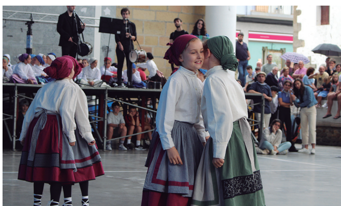
Urtean zehar landutakoaren erakusleihoa, Orbeldiren jaiotako emanaldia.