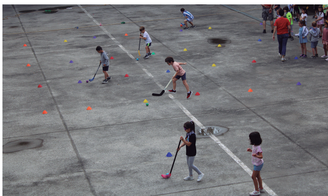
Ginkanan denetarik kirol jolasetan parte hartu zuten.