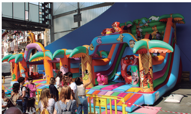
Puzgarrietan jauzika primeran pasa zuten eteko txikienek.