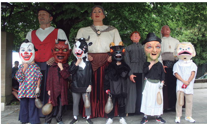
Erraldoi eta buruhandien taldea. Aurtengoan kareta itxuraz berritu dituzte.