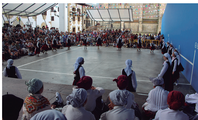
Udako emanaldien erronda betean da Orbeldi dantza taldea.