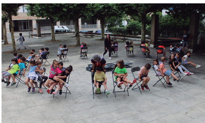
Kanporaketarik gabeko aulki-jokoan elkar laguntza nagusitu zen.