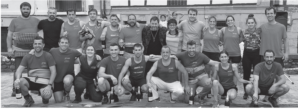
Talde gorria izan da aurtengo txapelketa. Lehia bizia izan zen ordea. NOAUA