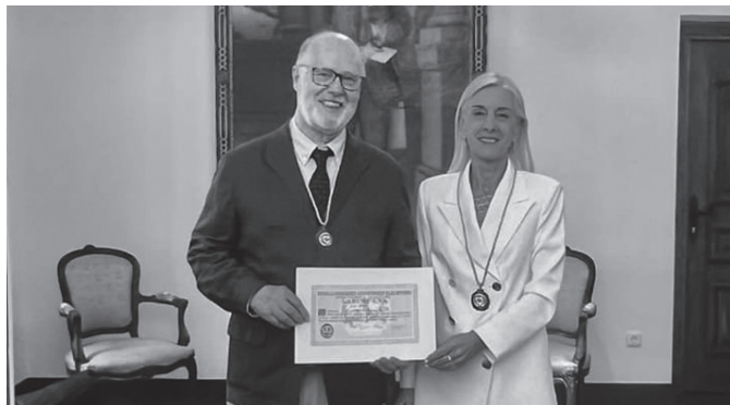
Euskalerrriaren Adiskideen Elkarteko egoitzan, diploma eta domina jaso berritan.