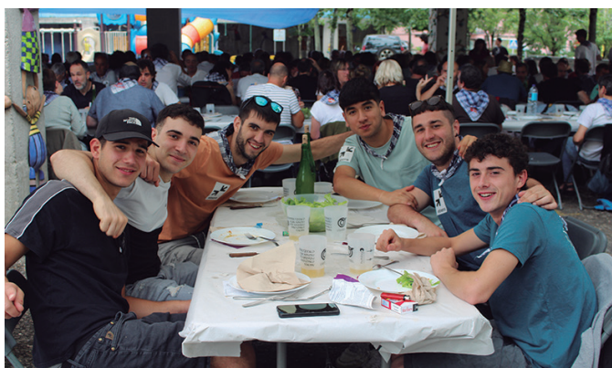
Gazte koadrila bat, ehunka lagun batu zituen zikiro janean.