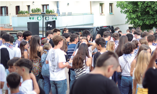
Gazte Eguna dantza batean jartzera etorri ziren Distopia taldekoak.