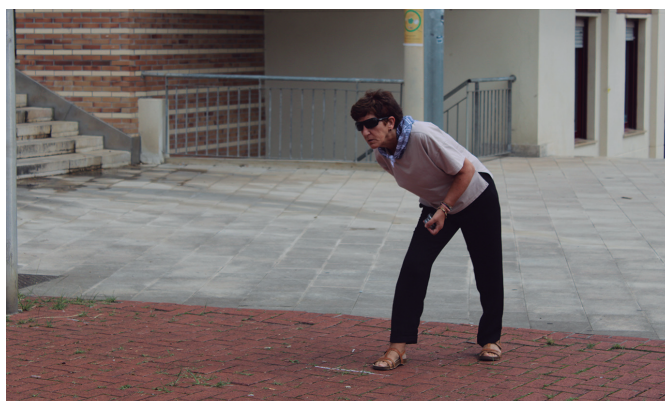
Gogotik lehiatu ziren Artzabalgo toka txapelketan.