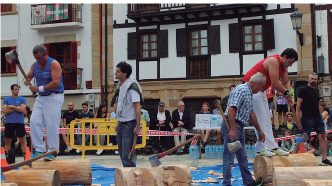
Esnal anaiak "arerio" herri kiroletako aizkolaritza proban.