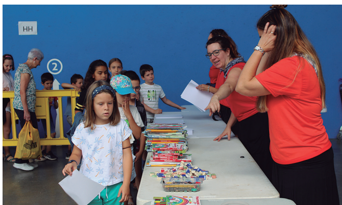
Kolore Festara gazte ugari batu ziren.