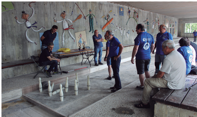
Askatasuna plazako bolatokia biziberritu dute aurtengo jaietan.