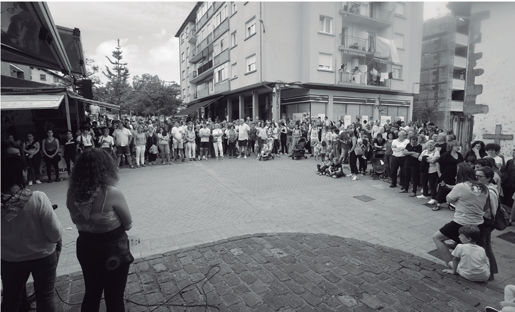
Jaietan izandako eraso matxista salatzen 2an egin zuten elkarretaratzea. NOAUA!