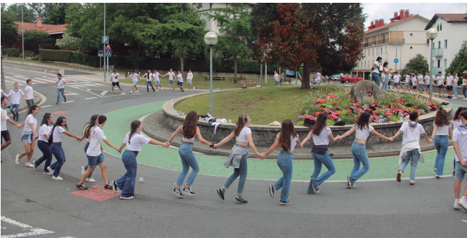
Kaxkoa inguratu zuten oilasko biltzaileek, dantza giro bizian.