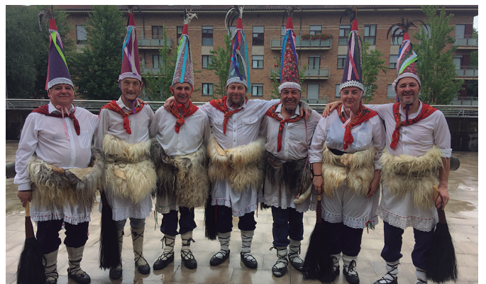
Joaldunak saioa amaitu berritan harrapatu genituen. Nekatuta baina pozik.