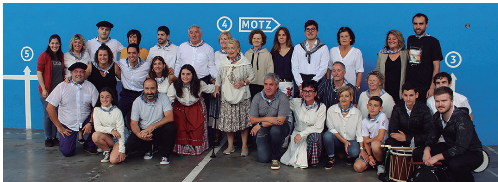
Ekitaldiaren amaieran, familia argazkirako batu ziren dantzariak, txistulariak eta omenduak. NOAUA