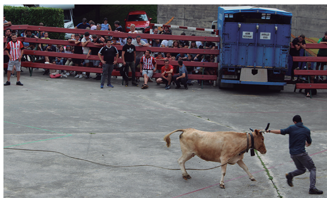
Sokamuturreko animaliengandik ihesi lasterkariak.