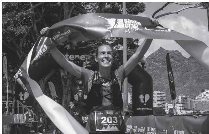
Santa Cruz Extreme 33 km-ko lasterketa irabazi zuen iaz.

Ez nuen kirolik egiten lehenago. Nire bizitza musikari lotuago zegoen kirolari baino. Hirugarren LHn saskibaloian