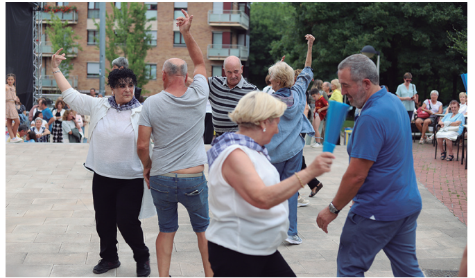
Gure Pakea Dantzan taldekoek ikuskizun aparta eskaini zuten Artzabalen.