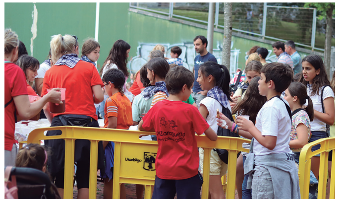
Haurren Eguneko ekintzetan indarberritzeko, txokolate gozosa askaldu zuten.