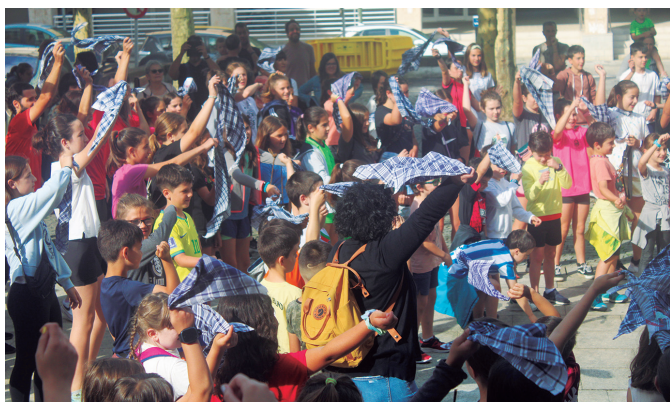
Koreografia berri batekin egin zioten harrera Umeen Egunari.