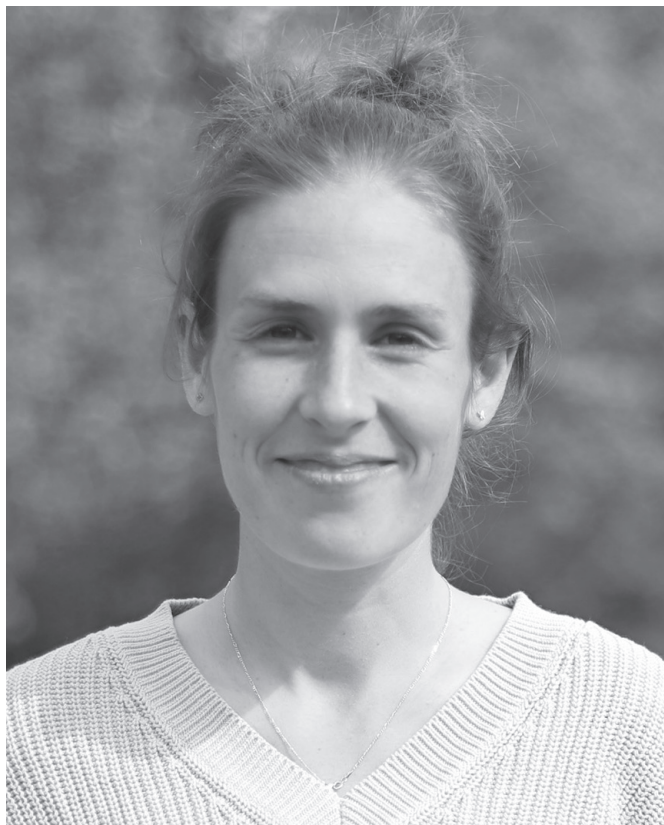
"Unibertsitate garaian hasi nintzen korrika". NOAUA

Nire gurasoak ez dira oso kirolariak eta kirol askorik egin gabea nintzen unibertsitate garaia arte. Unibertsitatean korrika hasi nintzen, ikasketetatik alde egiten lagunduko zidan zerbait lasterraren bila. Orduan, hasi