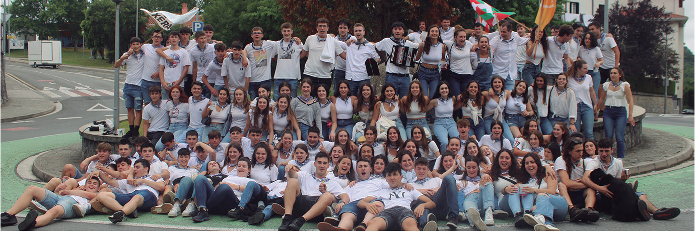
Jai giroa herriratzten eta festei harrera egiten lehenak izan ziren. Oilasko biltzaileek ekarri ziguten festa egunotarako irrika.