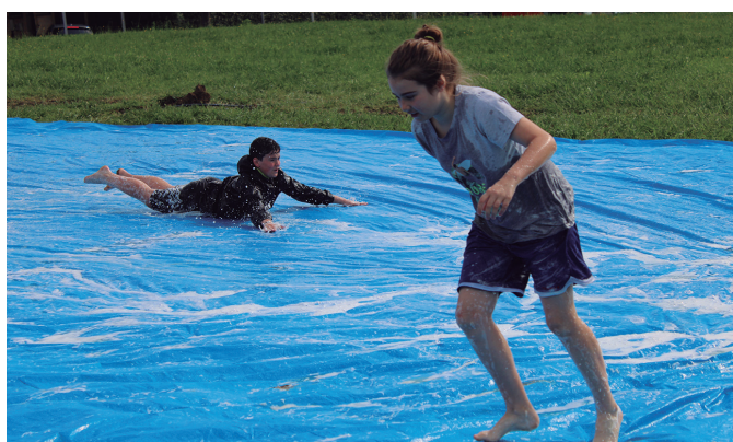
Erronkako txirristan blai baina pozik amaitu zuten gazteek.