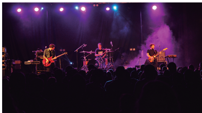
Jendetza Mihiseren larunbat gaueko kontzertuan.