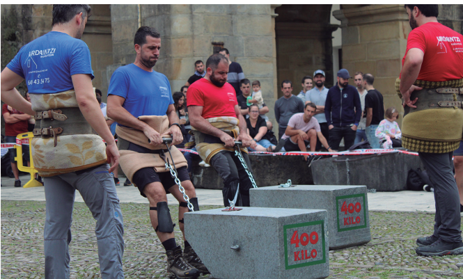
Herri kirolen desafioan egin zuten ahaleginaren irudia.