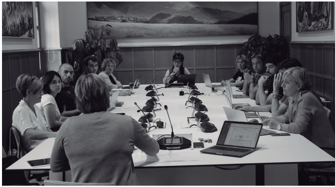
Ekainaren 27an egin zuten legealdia antolatzeke ezohiko osoko bilkura. NOAUA!