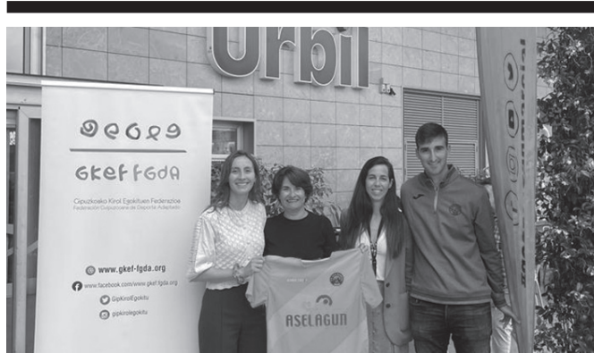
Uztailaren 6an eta 7an, hainbat jarduera iragarri dituzte merkataritza-gunean.

Izen-ematea: 3 eurotan (18 urtetik beherakoek doan), Informazioa: 650usurbilbizi.eus atarian. 12:00-13:00 Sutegin.