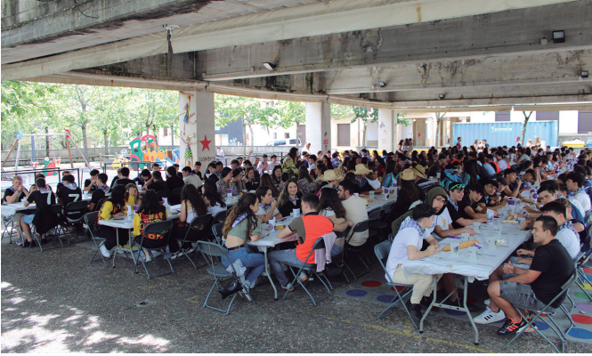
Askatasuna plazako aterpea bete zuten gazte bazkarikoek.