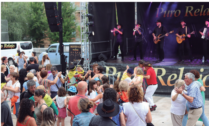
Puro Relajo taldeak dantzan jarri zuen Artzabalgo plaza.