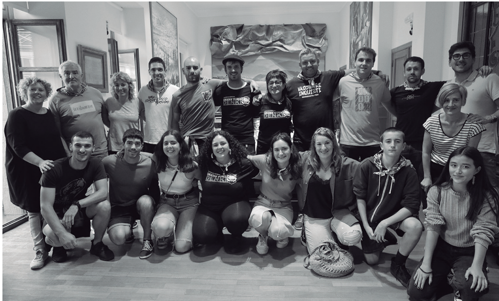
Jaiak abiarazi zituen gazte mugimenduko ordezkariak, udalbatzako kideekin batera. NOAUA