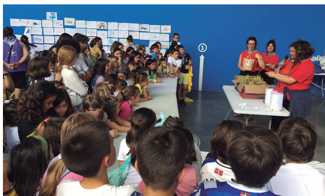
Kolore Festa ekitaldiaren amaieran opari zozketa egin zuten.