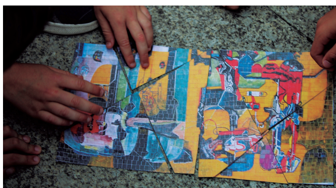
50 urte bete dituen Zumetaren murala osatu zuten ginkanakoeak.