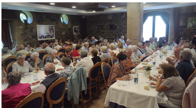
Atxega jauregian batu zen belaunaldi helduena, jubilatuen bazkarirako.