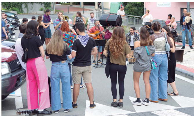
Euskal abestiak ardatz zituen runba poteo mozorrotua egin dute jaiotan.