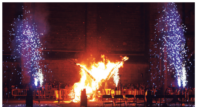
Jaietako zaindaria sutan desegin zen ueña.