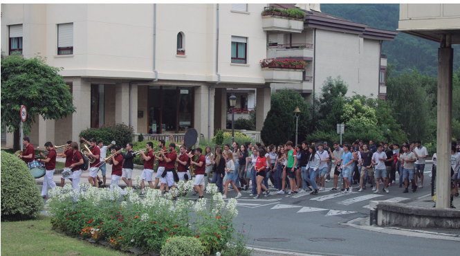
Estreinakoz egindako herri kalejirak belaualdi ezberdinak batu zituen.