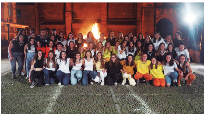
Hasi bezala agurtu zituen jaiak gazte mugimenduak, abesten eta dantzan.