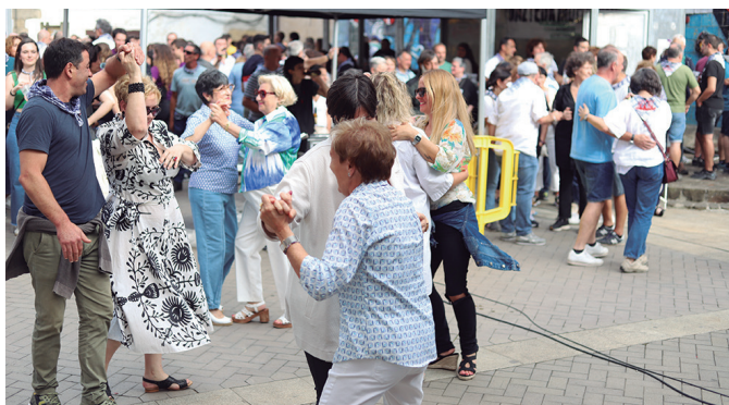
Mexikortxo talde nafarrarekin, rantxerak uztailaren lehenean txosnagunean.