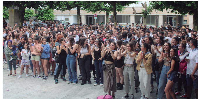
Gazteak izan dira aurtengo jaien hasierako protagonistak.