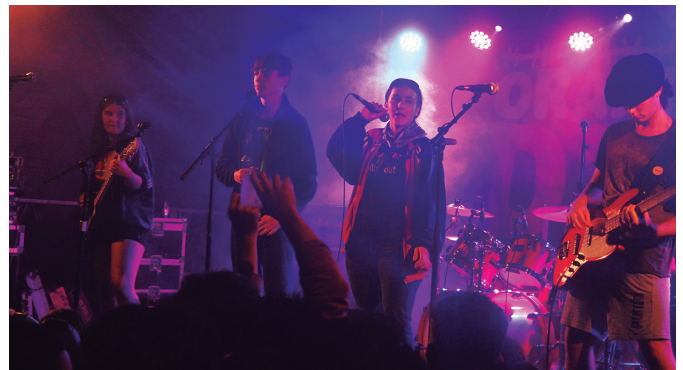
Bertsio Gauak euripean kantuan eta dantzan jarri zuen jendetza.