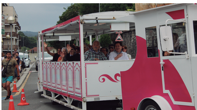
Belaunaldi gazteena eta helduena izan ziren txixtu treneko lehen bidaiariak.