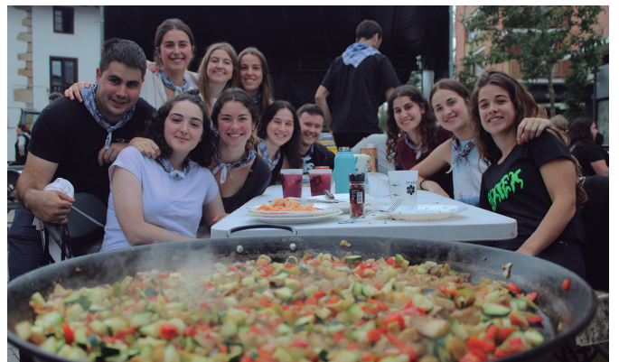
Txosnaguneari usain ezinhobea zerion festen amaierako paella janean.