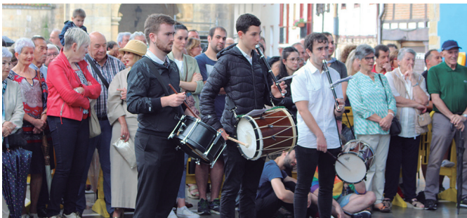
Esna-deiak, soka-dantza girotzea... Lan handia egin dute herriko txistulariek.