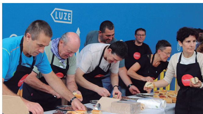
Beste behin ere, Hurbilagok lan handia hartu zuen lore eta salda banaketan.