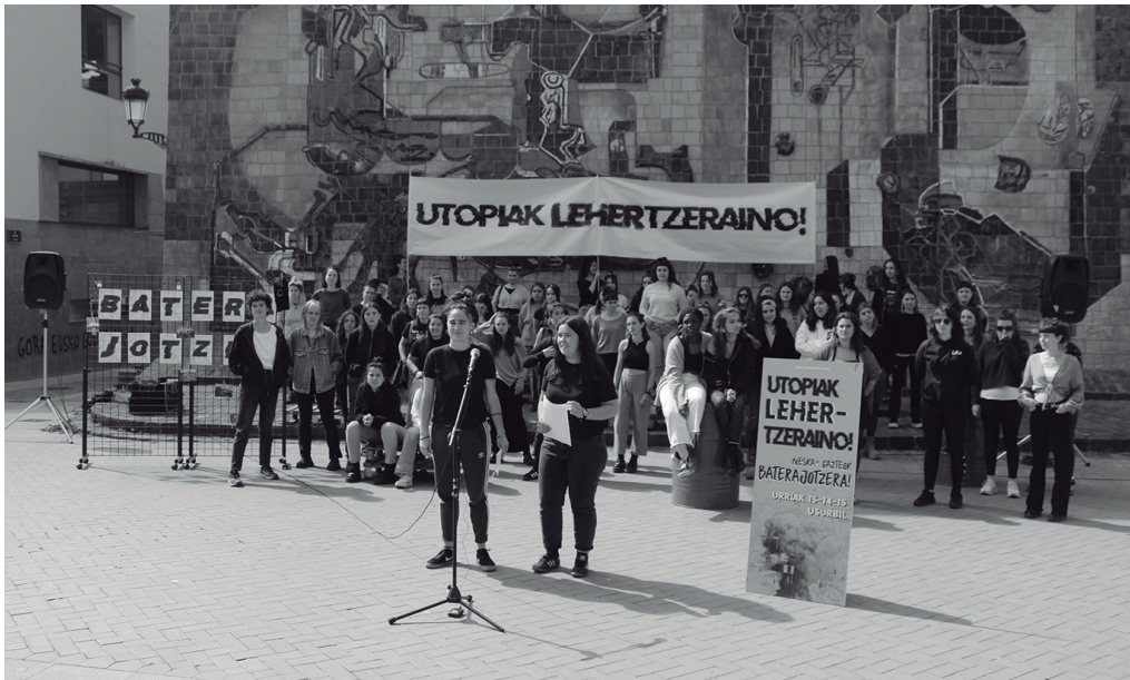
Apirilean aurkeztu zuten Baterajotzea Mikel Laboa plazan, "Utopiak lehertzeraino!" aldarrpean. NOAUA!