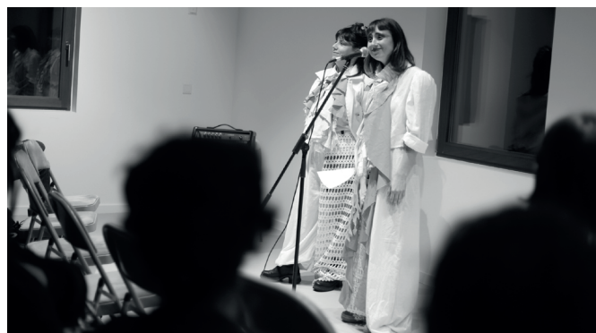
Mejillon Tigre kolektiboko kideak, Emakumeon Etxeko ganbaran.

zituzten, eta barreak ere nagusi ziren: etxebizitza, gorpuzten nolakotasuna eta aniztasuna, sexu-indarkeria... Ikuskizun atipikoa osatu zuten, baina oso ondo hartua herriarren artean. Emakumeon Etxeko ganbara goraino betetzea lortu zuten bi poetek larunbat iluntzean.