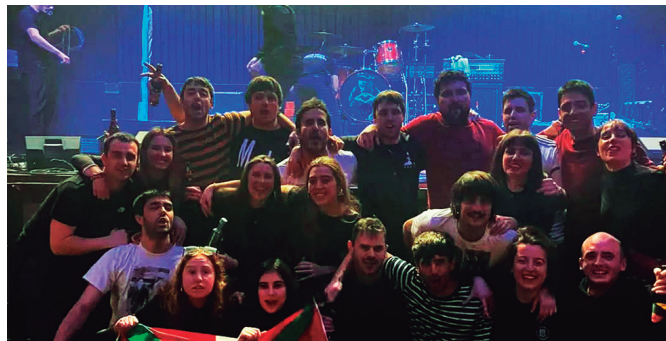
Aurreko asteburuan Galizian izan ziren. Larunbat honetan Usurbilen ariuko dira.

Eskertza mezua helarazi diete baita, bidelagun izandako talde galiziarrei. Bide batez, "Azkenak" zikloko azken kontzerturako gonbita egin dute.