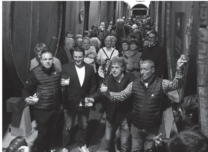
Perico Delgado txirrindulari ohia izan zen irekiera ekitaldiko protagonista.