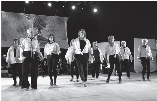
Emanaldia otsailaren 1ean izango da, iluntzeko 19:00etan Sutegin.

Dantza taldetik aurreratu dutenez, Ipar Euskal Herrira begira jarraituko gaitu emanaldi honek. Izan ere, "ohituraz euskaldunok badugu gure inguruan zer gertatzen den jakiteko berri, baina bada Euskal Herrian inguru bat ahantzia geratzen dena gehienetan, Ipar Euskal Herria. Jakina de-