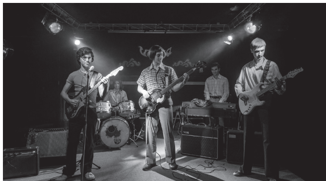
Otsailaren 8an, Itoizen inguruko dokumentala ikus ahal izango dugu Sutegin.

Sarrerak eskuragarri Antzezlanaren arratsaldeko 18:00etan hasiko da. Hitzordurako sarrerak salgai dituzue 10 eurotan, usurbilkultura.eus plataforman edo NOAUA! Kultur Elkartearen egoitzan. NOAUA! kobazkideok 8 eurotan eskuratu ahalko dituzue kultur elkartearen egoitzan.