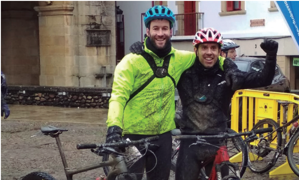
"Herriatik kanpo ere txirringularitza probetan ibiltzen naiz. 'Quebrantahuesos' egina dut eta aurten ere eman dut izena".

→ txoko dauden, nahiz eta ibilbidea beti sorpresa izan. Beti izaten da sorpresaren bat, baina Andatza nahiko ondo ezagutzen dut. Ez du sekretu handirik: entrenatu eta ibili. Gutxi entrenatuta bazabiltza, sufritzea tokatuko zaizu. Ni normalean errepedean ibiltzen naiz eta noiz-behinka mendira joaten naiz. Errepedean ibiltzeak hankak indartzen ditu, baina mendian teknika askoz ere gehiago behar da eta ordu batzuk pasatu behar dira gero gozatu ahal izateko. Bide errazetan gozatu dugu, baina bide estu eta teknikoagoetan pixka bat sufritzea tokatuko zaigu oso teknikoak ez garenoi. Mendiko bizikleta hartu ere ez dut egin azken aldian. Beraz, asmoa bueltaren bat ematea da proba aurretik, baina ezin bada zuzenean joango naiz.