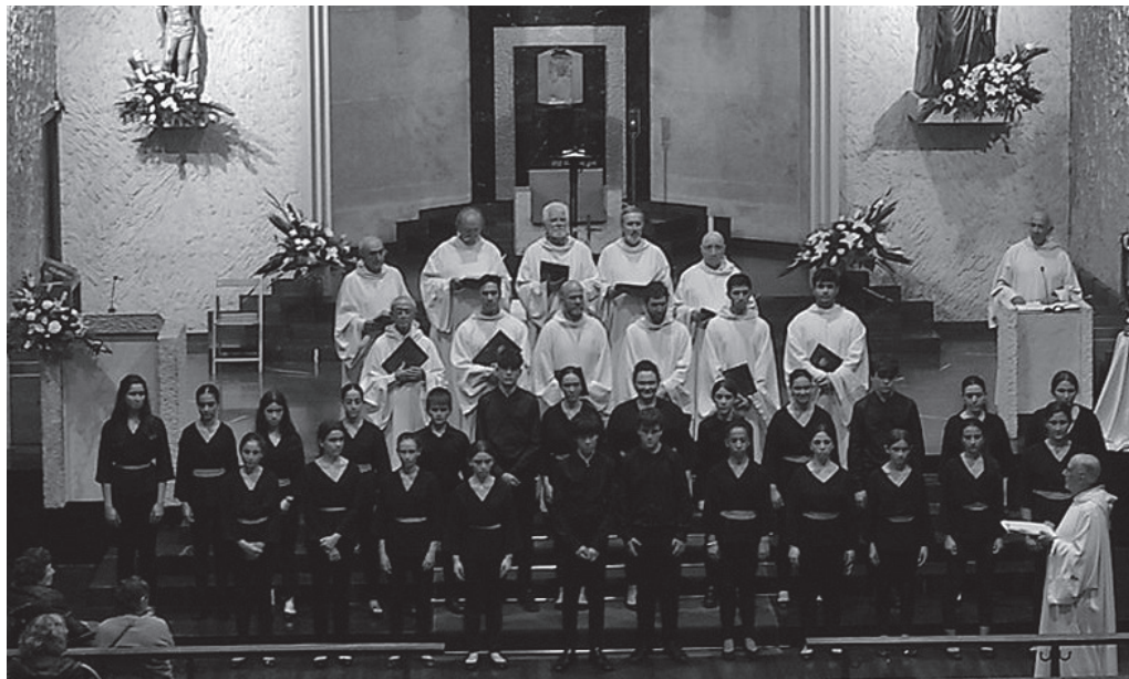
Easo Gazte Abesbatzak eta Easo Kapera Gregorianistak jarriko diote ahotza 'Katedraleko meza' kontzertuari.