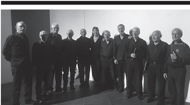
Easo Gazte Abesbatzak eta Easo Kapera Gregorianistak (irudian) abestuko dute.

Artzabal jatetxean, omenaldia eta bazkaria.