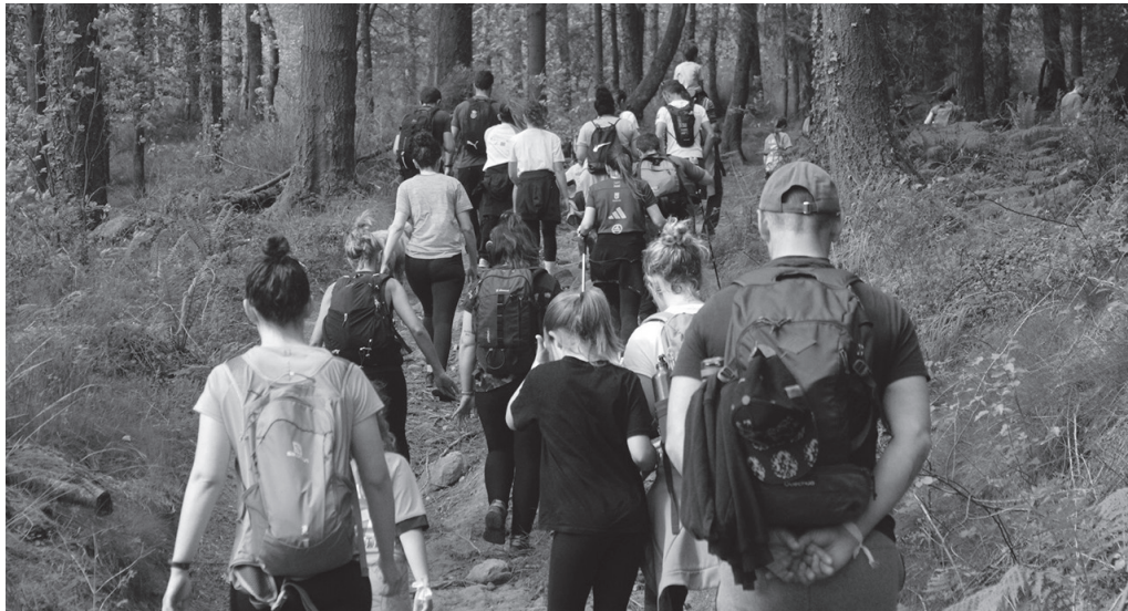
Orientazio kirol proba bat izango dugu otsailaren 9an Usurbilen.