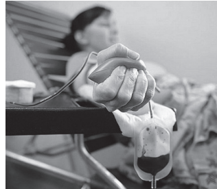
"Odola emanez bizia salbatzen dugu eta askoren osasuna hobetu".

Gipuzkoako odol-emaileen elkarte 1964an sortu zen eta biziak salbatzen jarraitzen du.