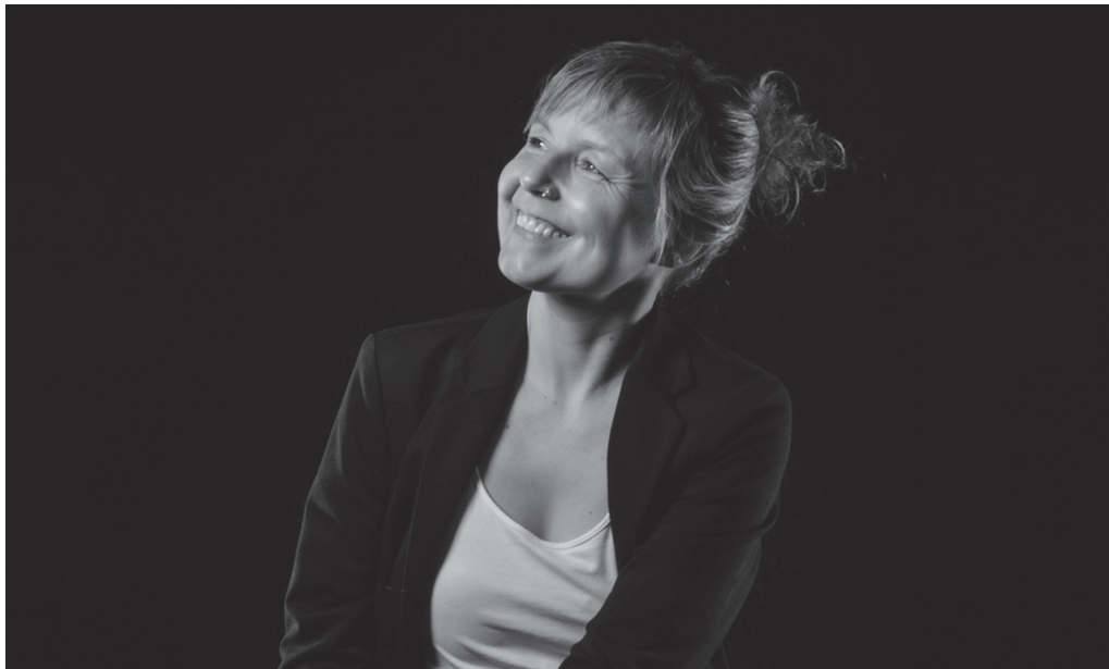
Iraitz Lizarragak zuzendu du 'Itzal(iko) bagina' bertso-antzerki ikuskizuna.