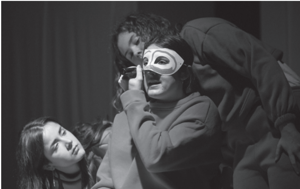
'Itzal(iko) bagina' antzezlenerako sarrerak usurbilkultura.eus web orrialdean eskura daitezke, edota NOAUA!ren egoitzan.

10 eurotan usurbilkultura.eus plataforman edota NOAUA!ren egoitzan. Bazkideek 8 eurotan eskuratu ahaliko dituzue kultur elkarte honen egoitzan.