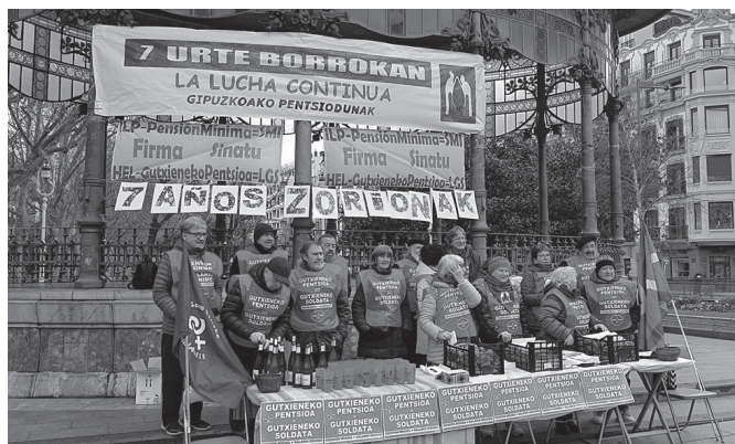
Urtarrilaren 13an elkarretaratea egin zuten Donostian.

Testuinguru horretan, batetik, lau hilabeteko epealdia izango duen sinadura bilketari