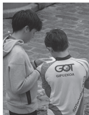
"Gure kirolaren lehentasunezko araua ingurunea errespetatzea da".