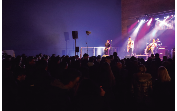
Frontoia bete zuen Odolaren Mintzoa taldearen azken kontzertuak.

Kontzertu gauaren atariko hitzordua izan zen hori, Aitzaga elkarteak sukaldatu eta