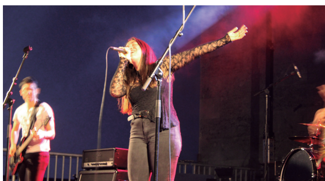
Ameba taldea izan zen kontzertua eskaini zuen taldeetako bat.