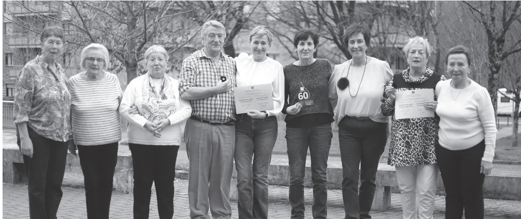
Bazkari batekin eta zortzi emaile omenduz borobildu zuen 50. urteurrena Usurbilgo Odol Emaileen Elkarteak.