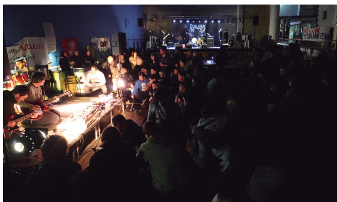
Rukulakoek dantza batean jarri zituzten frontoian bildutakoak.