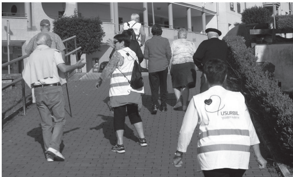
Otsailaren 4an abiatuko da herri ekimena. Asteartero, goizeko 10:30ean abiatuko dira.