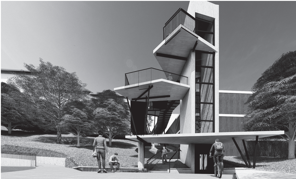
Udal iturriek aditzera eman dutenez, "2025a amaitu baino lehen gauzatu behar dira obrak".