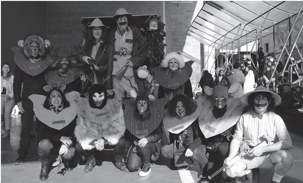
Iñauteri Jaia martxoaren 1ean ospatuko da aurten.