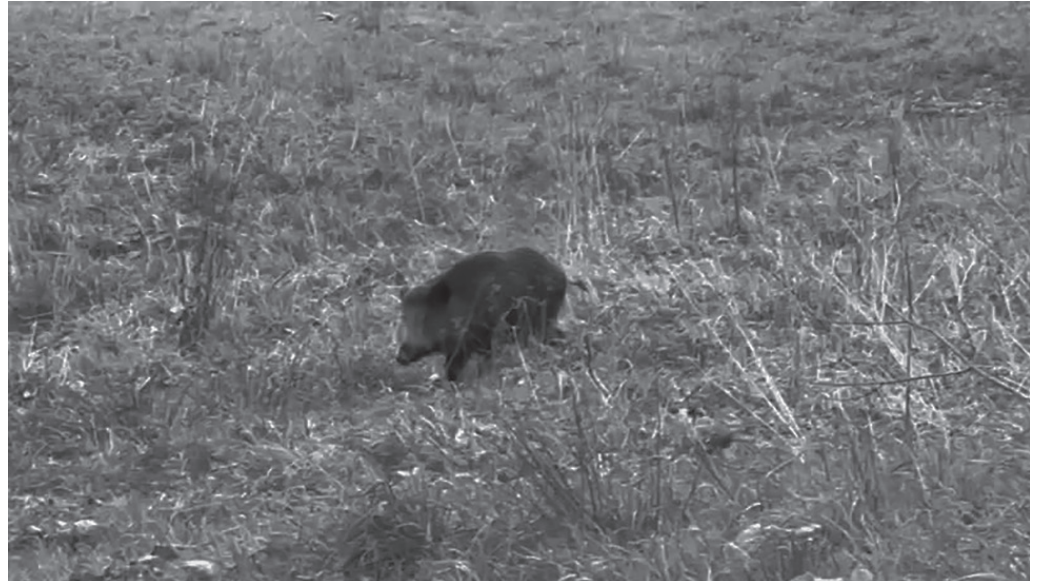
Azkenaldian, Txokoalde eta Santuenea arteko erriberan ikusi izan dute basurdea.

Whatsapp taldeetan egunotan hedaturiko bideoko irudia duzue albiste honi atxikitakoa. Bertan duzue protagonista nagusi eta bakarra; basurde bat. Beste behin, mendi aldetik behera jaitsi eta herri-gunera gerturatu dena. Txokoalde eta Santuenea arteko erribera inguruan ikusi dute. Ez da halakorik ikusi ahal izan den lehen aldia. Abendu hasieran, herrikide batek gauze egin zuen topo basurde batekin, Santuenetik Zubietara bidean. Covid19aren garaian ere, herri erdiguneraino hurbildu izan ziren.