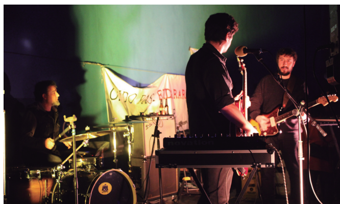
Mihise taldeak eskainitako kontzertuko uneetako bat.