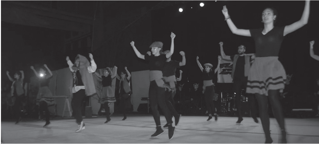
"Dantza ezberdinak plazaratuko ditugu, bolantetatik kontradantzeta, jauzietatik makil jokoetara".