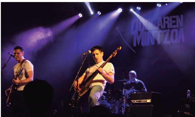
Odolaren Mintzoak senide, lagun eta zaletuen aurrean abestu zuen azken aldiz.