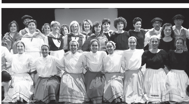
Larunbat honetan Sutegin arituko dira, iluntzeko 19:00etan.