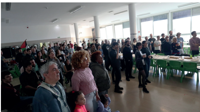
Odolaren Mintzoaren proiektzioa begira, senide, lagun eta zaletuak.