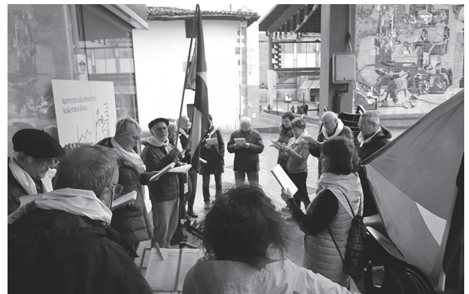
Larunbateko kantu-jiran Palestinako herria izan zuten gogoan.

• 18:00-19:00 Ikastaroko saioak Agerialdeko musika gelan.