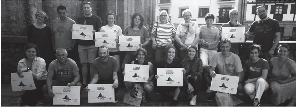
Ipuin laburrak izango dira, 650 hitzez osatuak gehienez ere. Gaia librea da. Irudian, iazko lehiaketako sarituak.