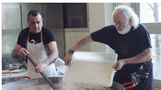
Agurreko jaialdiko bazkaria Aitzaga elkarteak prestatu eta zerbitzatu zuen.