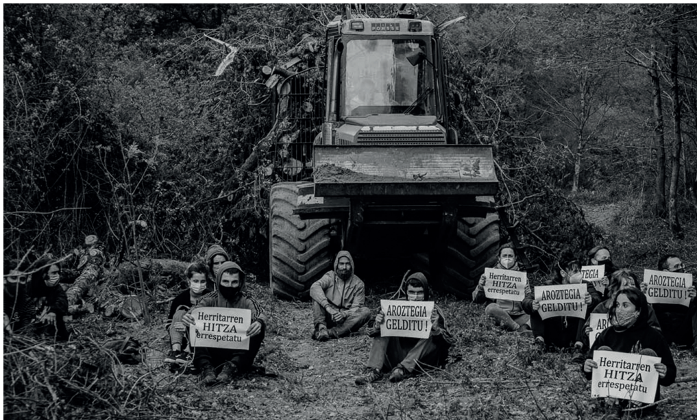
Aroztegiako proiektua gerarazteko 2021ean eginiko mobilizazioetako bat.