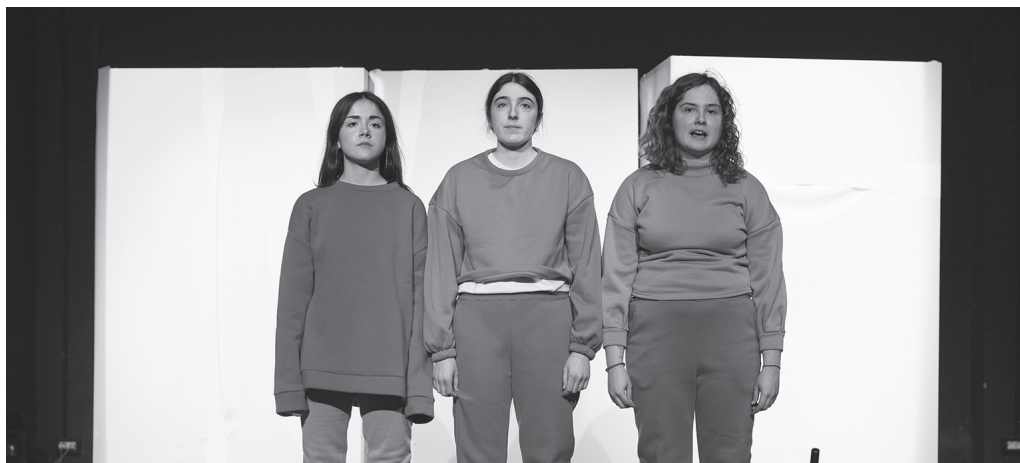
Argazkian, 'Itzal(iko) bagina' ikuskizuneko protagonistak.