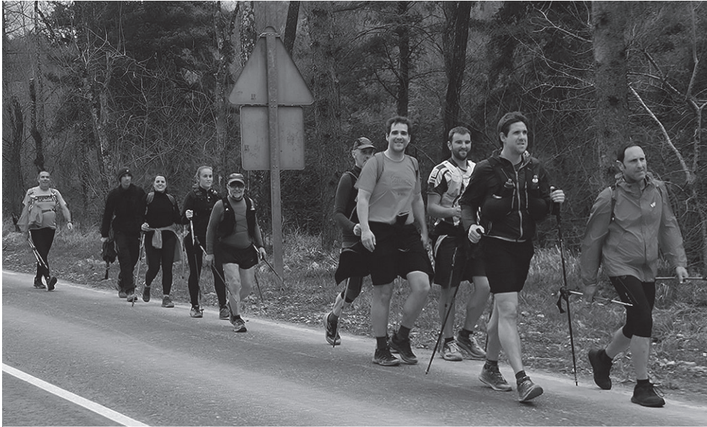
Apirilaren 17an, Ostegun Santuan, 63 kilometroko luzera duen ibilbidea osatuko dute.