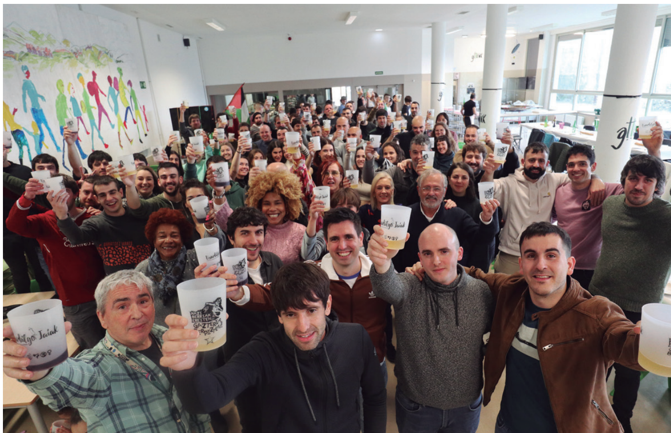
Topa eginez, Odolaren Mintzoari merezitako gorazarrea egin zion taldearen bueltan urteotan eraikitzen joandako komunitateak.