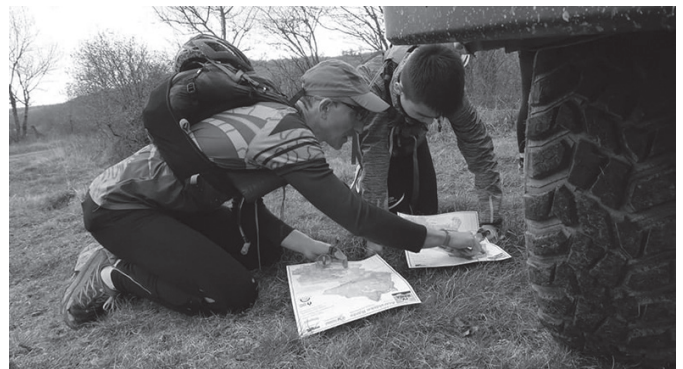
Otsailaren 9an egingo da proba baina izen-ematea otsailaren 6an itxiko da.

Banaka nahiz taldekakoak, otsailaren 6ko gaueko 22:00ak