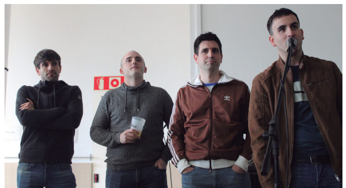
Odolaren Mintzoa taldeko kideak, bazkalurreko ekitaldian.