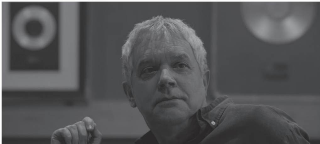
Itoizen inguruko filmak badu dokumentaletik eta badu fikziotik.