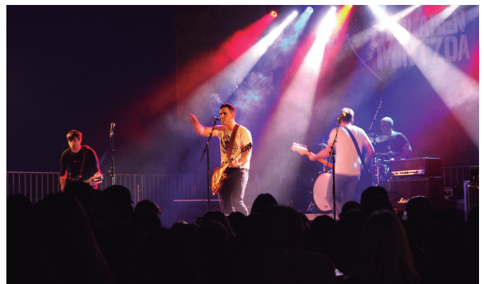
Urteotako kantak azken aldiz abestu zituen taldeak azken kontzertuan.