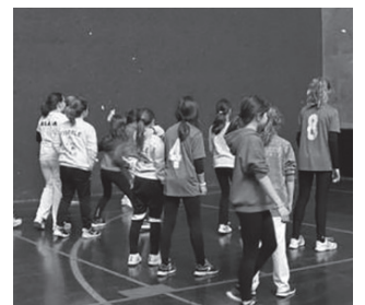
Apirilaren 14tik 17ra ospatuko da. Izen-ematea ixtear da.

Udako oporraldiaren aurretik, udaberrikoa datorkigu ate joko. Aurreko urteen antzera, Kirol Astea antolatu dute LH 3 eta 6 mailen arteko gaztetxoentzat Pagazpe Kirol Elkarteak eta Usurbil F.T.-k. Apirilaren 14tik 17ra, 10:00-13:00 artean izango da. Izena emateko epealdia apirilaren 6ra artekoa izango da. Helbide honetako formularioa osatu beharko da: labur.eus/9oygca4