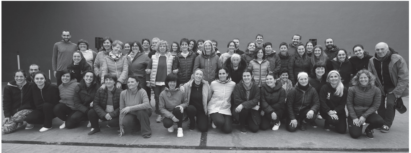
Orbeldi dantza taldeko kideak, aurreko larunbatean Agerialden eginiko "Amets" herri ikuskizunaren azken entsegu saioan. Larunbatean estreinatuko dute, 13. Dantza Egunaren baitan. Pertsona baten barne bidaia irudikatuko du ikuskizunak.