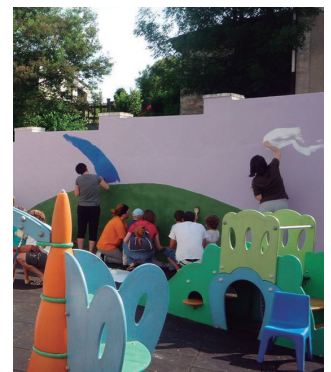
Haur Eskolako matrikulazioa apirilaren 11n amaituko da.