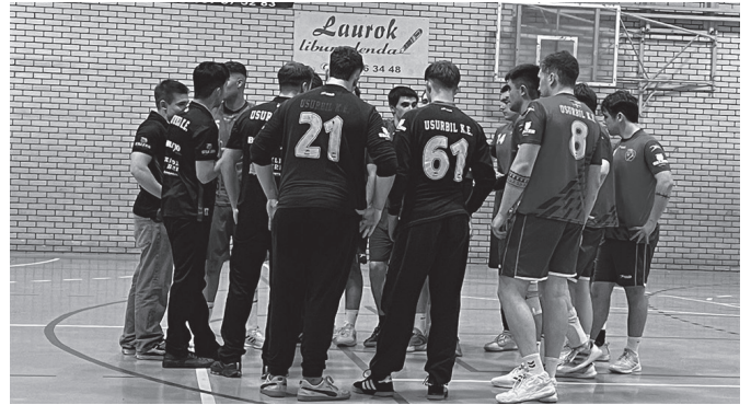
Usurbil KE taldeak partida garrantzitsua jokatuko du larunbatean Oiardon.

rrak; liga amaitzeko bi jardunaldiren faltan. Ezinbestean irabazi beharko dituzte bi partidak lehenengo amaitu nahi badute. Horregatik, herriaren bultzada beharrezkoa ikusten dugu denon artean garaipena lortzeko. Beraz, herritarrei deia luzatzen diegu, garai zaharretan bezala, Oiardo bete, eta taldea animatzeko".