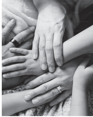
"Aurretik ere, ingurua zaintzeko behar edo ardurari ere erantzuten saiatu izan naiz".

Nire kasuan adibidez, izeba bilakatu nintzenean eman