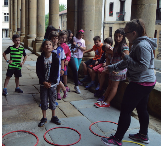
Udajolas 4 eta 12 urte arteko gaztetxoei zuzendutako aisialdi eskaintza da.

Adi, aurtien aldaketa izango da egutegi aldetik. Normalean, Usurbilgo festak amaitu eta biharamunean ematen zaio hasiera Udajolasi eta uztailaren 30ean amaitu izan ohi da. Aurtien, aurreko urteetan baino lehenago abiaraziko da Udajolas; ekainaren 30ean. Bukatu, aldiz, orain arte bezala, uztailaren 30ean amaituko da. Baina 2025eko