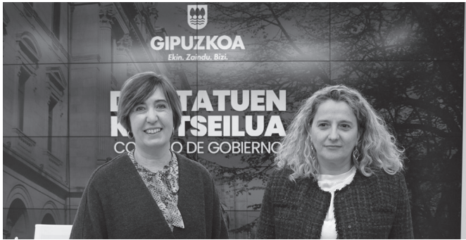
Foru Ogasunak Errenta+ aplikazioa abiarazi du, "2024ko Errenta kanpaina modu erraz eta seguruan egiteko".