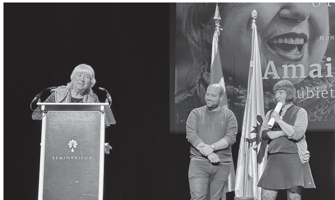
Emakumeen ahotsa lehen lerrera eraman zuelako saritu dute, besteak beste.