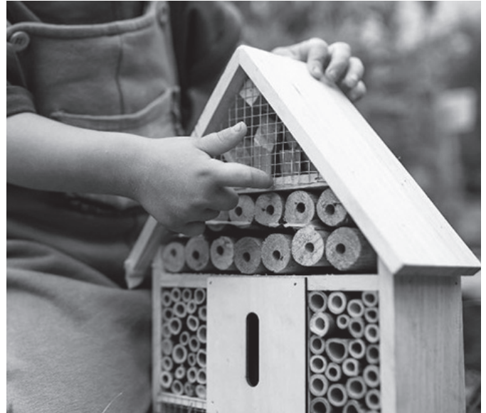
Alkartasuna kooperatibak intsektuen hotelak egiteko tailerra antolatuta du. Apirilaren 10ean, Agerreazpiko baratzetan eskainiko dute.

Martxoan goizez irekiko dute, 9:00-13:00 artean, apirilaren 1etik aurrera, 16:00-20:00 ar-