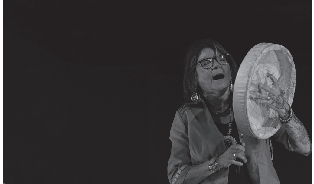
"Darlene Gihuminag Mikmak nazioko kide da. Bere burrasoak borrokatu ziren oinarriko eskubideen berreskuratzeko".

Gure emanaldia sortu genuenean, arlo komunak jorratu genituen, hala nola izadia, leku kultoen garrantzia (adibidez, Maidalena mendiko leku kristautua gurean, eta berdin beren herrian...). Zuberoko basa ahaide kantuak erabiltzen ditugu. Baina Mik-