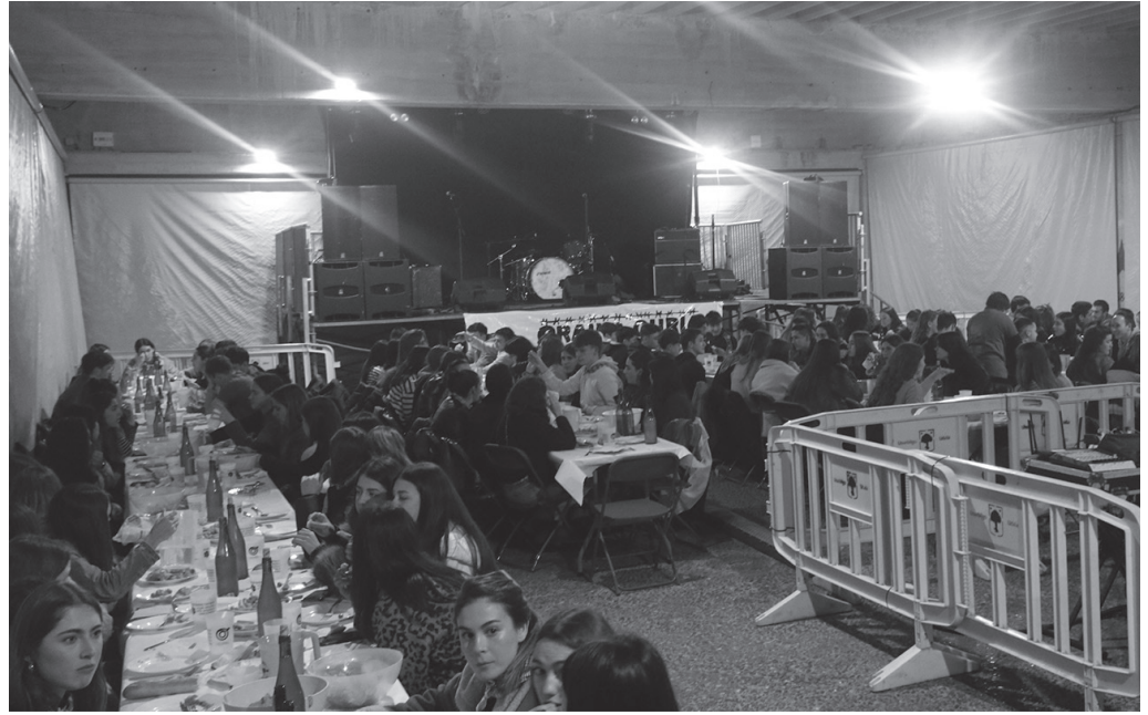
Goizean hasi eta ordu txikiak arte luzatu zen Usurbilgo Gazte Eguna.

Bestetik, Iruñetik bisitan etorritako Peña Alegriako kideen festa. Urtero inguruotako sagardotegi batean bazkaltzeko ohitura dute. Horren aitzakian herriko kaleak gogotik girotzen dituzte txaranga eta guzti. Aurtengazte Eguneko poteoarekin bat egin zuten.