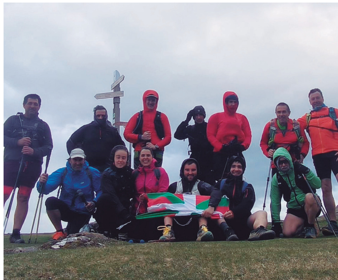
Apirilaren 17an Usurbil eta Arantzazu arteko ibilbidea osatuko dute.

Informazio gehiago jaso edota izena eman nahi duenak