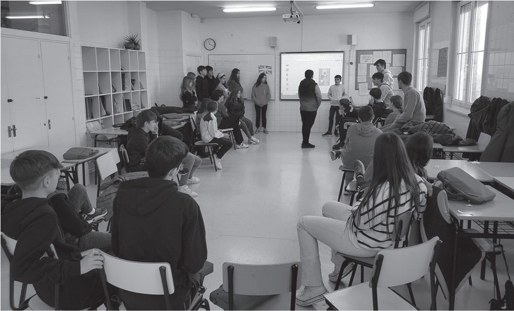
Zigilu honek "ikastetxeek zientzia, teknologia, ingeniari-tza eta matematikan egiten duten lana aitortzen du".