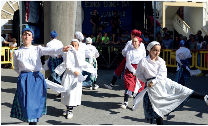
Orbeldikoez Kalezarko jaietan ekin zieten uda parteko emanaldiei. NOAUA!