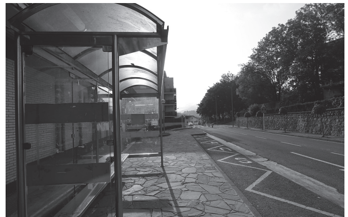
Ekainaren 29tik uztailaren 3ra, busak ez dira geltoki honetara iritsiko.

hasi eta uztailaren 3ko gauera arte. Hilaren 4tik aurrera, ohiko geltokia berreskuratuko du. "Aldi berean, ordea, uztailaren 4an, asfaltatze lanak direla eta, herri barruko ibilbidea aldatu beharko du autobus zerbitzu horrek, eta ohiko geralekuaren parean egin beharko ditu geldialdiak", ohartarazi du Usurbilgo Udalak.