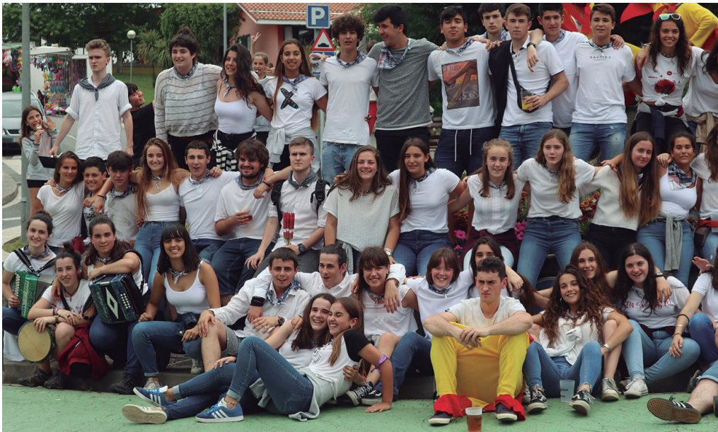
Oilasko biltzaileen eguna ekainaren 30ean izango da. Goizean goiz abiatuko dira. NOAUA