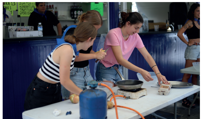
Sukaldari trebeek parte hartu zuten patata tortilla txapelketan. NOAUA!