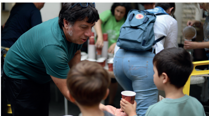
Txokolate gozo askoa banatu zuten askarirako Haurren Egunean. NOAUA!