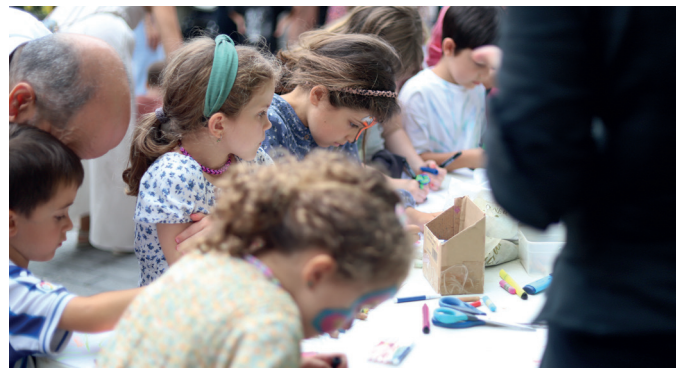
Sormena izan zuten adierazpide iturri, Haurren Eguneko tailerretan. NOAUA!