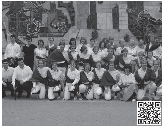
Ekainaren 17an agurtu zuten ikasturtea, kalean eskainitako ikuskizun baten bitartez. Qr kodearen bidez, matrikulazioa osatzeko formularioa eskura daiteke.

2023-24 ikasturterako presakteta lanak ere abian dituz-