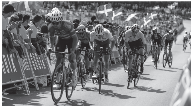
Uztailaren 2an eta 3an Usurbil ingurutik pasako da Tourra.