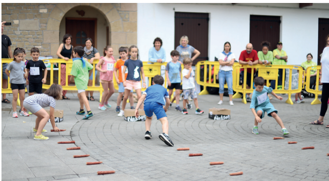
Umeen Eguneko lokots bilketan bizi asko gaztetxoek. NOAUA!