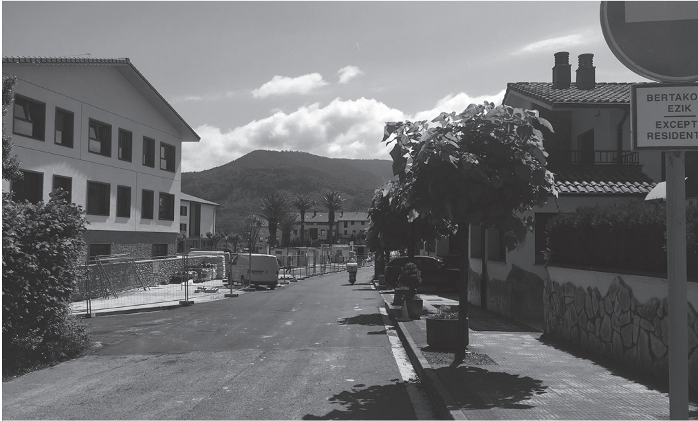
San Juan jaien bezperan, Kalezarren egin zituzten asfaltatze-lanak. Uztailaren 4tik aurrera, Usurbilgo hainbat txokotan.