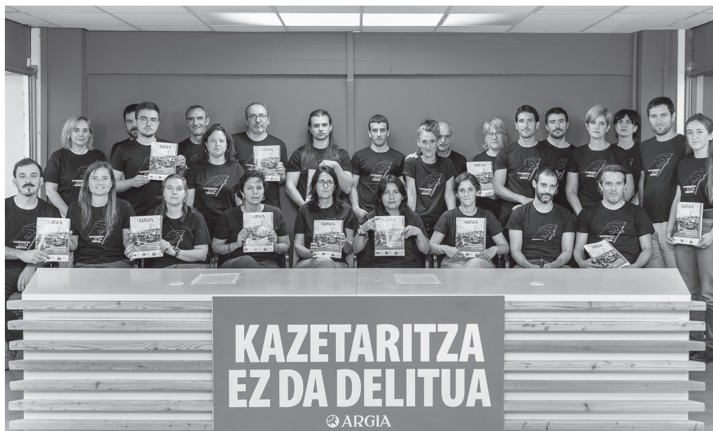
Argiak aurreko astean eman zuen gertatutakoaren berri. "Ez digute esango nor elkarriketatu ahal dugun eta nor ez".