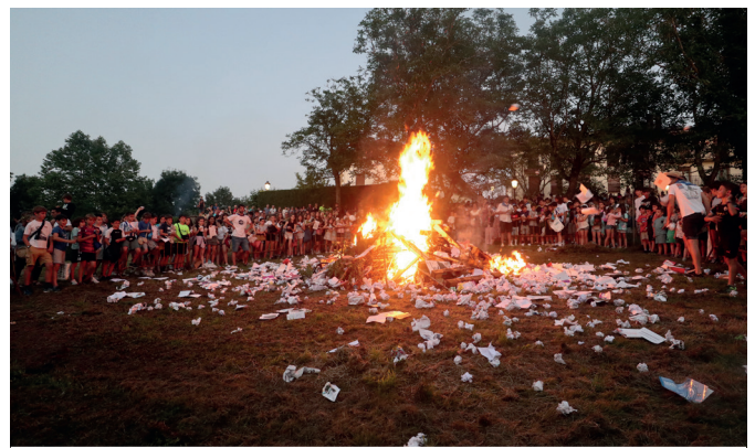
Sua piztu zuten eremu berria, erretzera botatako paperez josia. NOAUA!