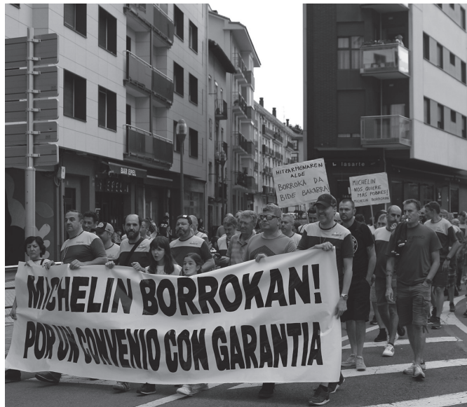
Asteotan, lan hitzarmen duin baten alde aritu dira borrokan.

eskaintza babestea onartu dute. Horrek bi ondorio nagusi izango ditu; batetik, azken asteotako protesta ekintzak bertan behera uztea erabaki dute langileek. Eta horrekin batera, lau urterako hitzarmena sinatuko dute.