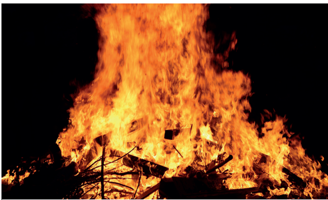
Sugarren indarra San Joan gauean. NOAUA!