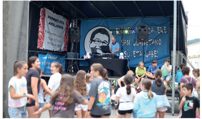
Dantza giro betean amaitu zituzten Kalezarko jaiak, Dj GorkaMendirekin. NOAUA!