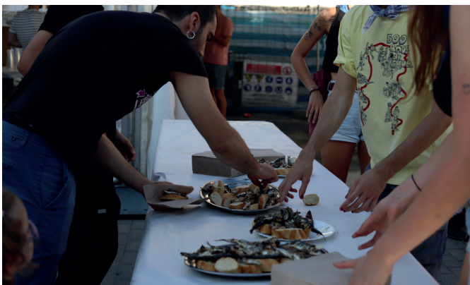
Sardina eta sagardo dastaketarekin bapo egin zuten San Joan egunean. NOAUA!