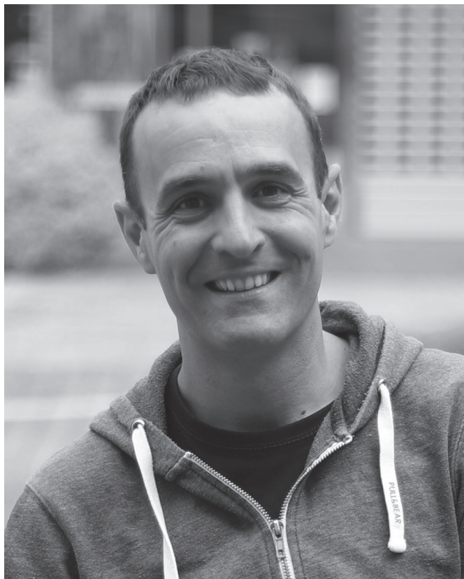
"Nigan konfiantza osoa jarri dute azken urteetan eta hori eskertzekoa da".

Lana oso ezberdina da, ez dauka zerikusirik mailak, adinak eta eska dezakegunak. Maila batean ia dena erakustea tokatzen da eta elite mailan errendimendua lantzen dugu. Musikarekin jartzen dut adibide hau hobeto ikusteko. Zuzendaria zarenan, denen lana zuzendu behar duzu eta ezin duzu entsegu edo kontzertua gelditu norbaitek ez duelako pieza ikasi edo ez dakielako jotzen. Gidatu baino ez duzu egin behar kasu horretan. Musika Eskolako irakaslea bazara, berriz, bakoitzari instrumentuak nola jo eta partiturak behar bezala irakurtzen irakatsi behar diozu. Gora iristeko instrumentuak behar bezala menperatu behar dira.