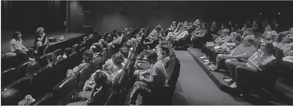
Gurasoei zuzendutako bileran jende ugari batu zen. Udajolas uztailearen 4an hasi eta 28an amaituko da. NOAUA