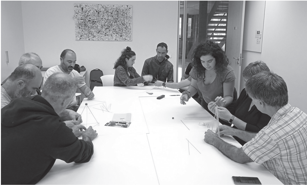
Energia berriztagarrien komunitatea kooperatiba bilakatuko da laster batean.