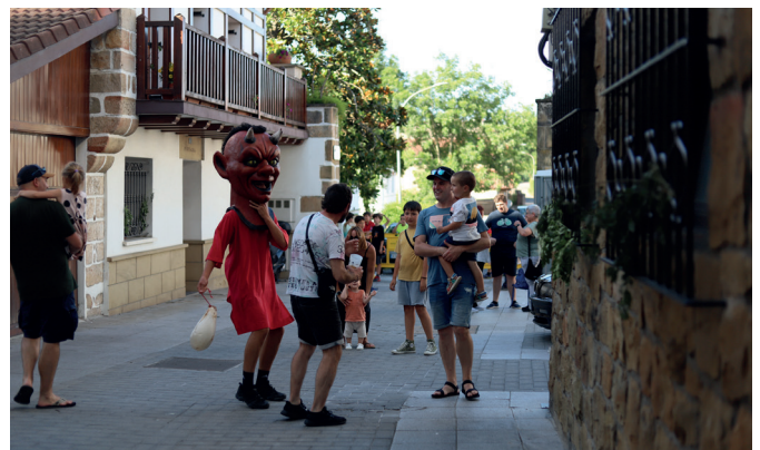
Inork gutxiak ihes egin ahal izan zuen buruhandiengandik. NOAUA!