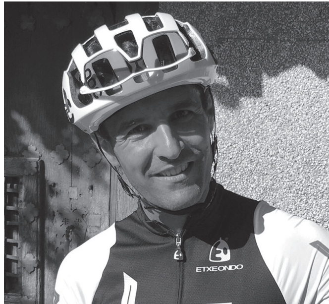
"Txirrindularitza nator ni". Gaur egun ere, maiz ikusiko duzue bizikleta gainean.

Ez dago lehiakortasunik publikoaren aldetik. Pertsona konkretuak izaten dira arazo, normalean, ez horrenbeste taldeak. Aldageletan ere izaten dira gorabeherak, baina ez normalean modu sano edo osasuntsu batean eramateko moduko egoerak izaten dira. Oso noizbehinka tokatu izan zait kudeaketa oso osasuntsuak egiten ez dituzten jokalariekin tratatu beharra, baina nire filosofia beti izan da eztabaida bat izan eta aurpegi txar bat behin ikustea, egunero norbaiten aurpegi txarrak ikusi beharra baino. Erabaki ez oso ederrak ere hartu behar