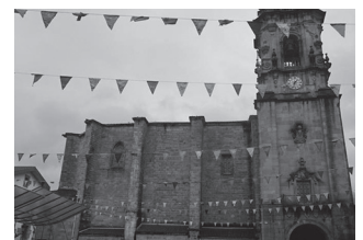
11:00etan hasiko da eukaristia.

"Hilaren 2an igandez, Santa Isabel egunean, goizeko 11:00etan Salbatore Parrokan Eukaristia ospatuko dugu Usurbilgo zaindariaren ohorez", parrokiatik ohar bidez aditzera eman dutenez.