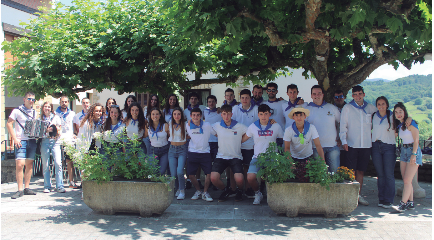
Bertsolariak eta trikitilariak bidelagun, San Joan bezperako eskean atera zirenek jai-giroa zabaldu zuten etxez etxe. NOAUA