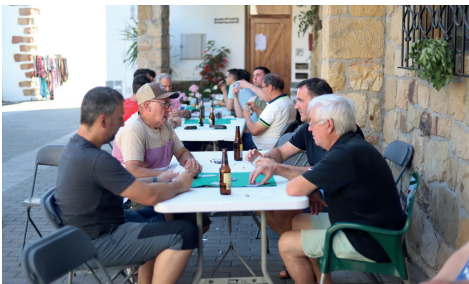
Mus zaletuek ere ekin diete udako jaien errondari Kalezarren. NOAUA!