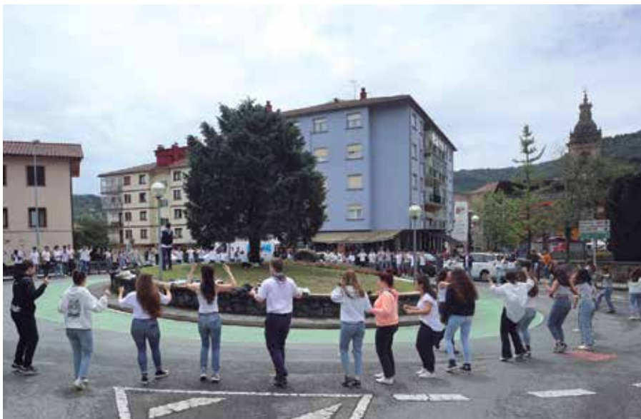
Oilasko biltzaileen eguna ekainaren 29an izango da. Goizeko 6:00etan abiatuko dira txosna gunetik.

■ 23:00 Niko Etxart&Hapa-Hapa frontoian.