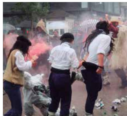
Gazteak talde ezberdinetan daude antolatuturik.

Xauxar txosna batzordeari buruz, izenari erreparatuta soilik ezer gutxi dago esateko, oraintxe ezin lanpetuago dabiltzala jaien prestaketetan. Azkenik, Ernai. Hilabeteotan osasun mentalari buruzko dinamika abian izan dute. Lehenbizi, gairi buruzko galdetegia egin zuten. “Usurbilgo gazteriarri kezkatzen dioten gaiak