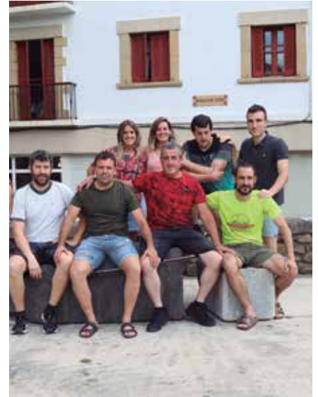
“Jaietako ostirala nahikoa lasaia izaten da eta egun horri grazia pixka bat ematen saiatuko gara”.

Denok kirolariak gara. Trontzan oraindik ez dute entrenamendu teknikorik egin, baina hiru edo lau prestaketa saioekin nahikoa izango delakoan gaude. Entrenatzailea ere badugu aurten horretarako.