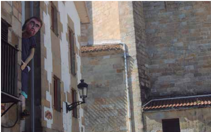
Argazkian, iazko maskota. Aurtengoa ekainaren 26an ipiniko dute.

Jakinmina asetzeko ez dugu Santixabelak hasi arte itxaron behar. Datoren astelehenean, hilaren 26an, ospakizun egunetarako itxuraldatze betean izango dugun unean agertuko zaigu. Agurtu, aldiz, festen amaieran, uztaillaren 3an, garai batean baino azken traka ez hain zaratatsu eta ikusgarriagoarekin.