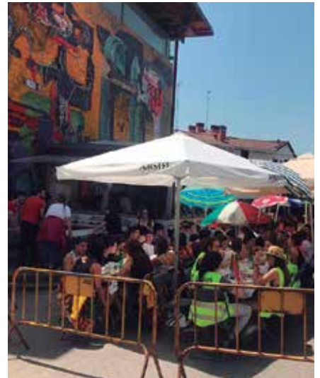
Gazte bazkarirako txartelak 12 eurotan eskuratu daitezke Txirristran eta Txiribogan.

Anbulatorio ondoko plazan kokatuko dute ohi bezala feriatuaren. Urtero moduan, prezio bereziak izango dituzte bai ekainaren 30eko Haurren Egunean, baita, festak amaitu osteko uztailaren 4an ere.