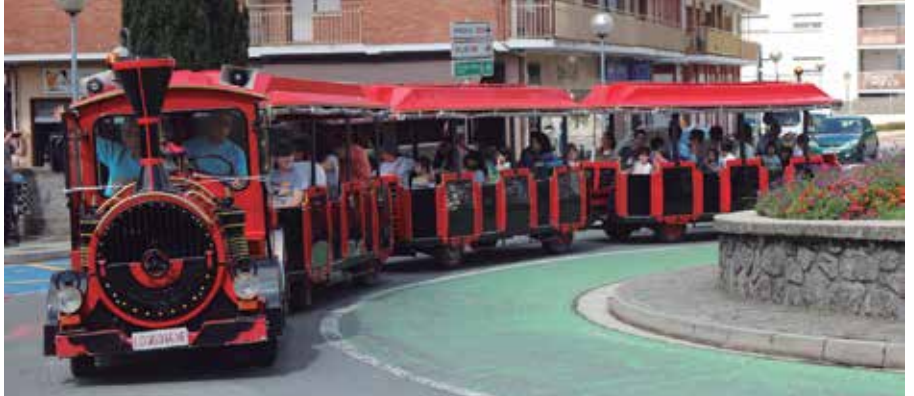
Ekainaren 30ean, goizez nahiz arratsaldean ibiliko da txutxu trenak.

Oraingoan ordea, adi, lehen ordua herriko kolektibo helduenei eta gaztetzkoen zuzendua egongo da. Haietzat soilik eskainiko da jaietako garraio zerbitzu berezi hau. Puntapax eguneko zentroko nahiz Artzabalgo helduentzat, baita Haur Eskolakoentzat ere. 10:30-11:30 artean