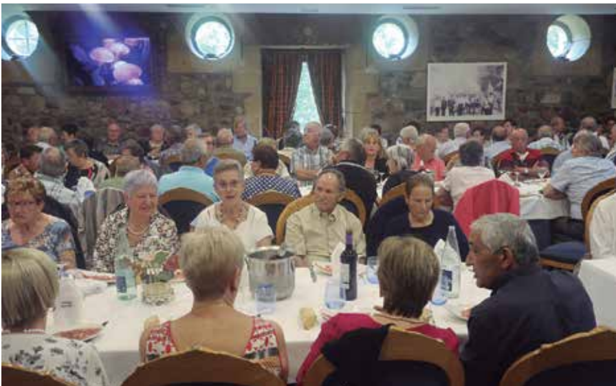
Jubilatuena bazkaria uztailaren 3an ospatuko da Atxega jauregian.

2024ko Usurbilgo jai eguna noiz izango den hautatzeke du Usurbilgo Udalak.