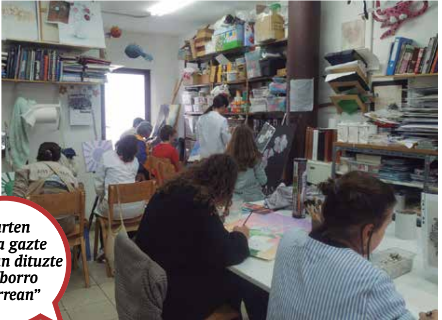
Erakusketak ordutegi hau izango du: 12:00-14:00 goizez, 18:00-20:00 arratsaldez.

“Aurten artista gazte asko izan dituzte Zirriborro tailerrean”