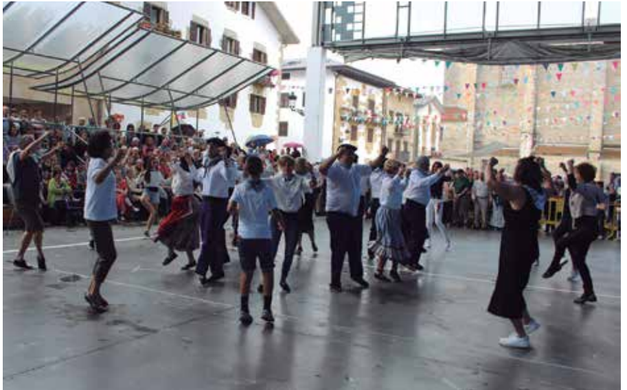
Santixabel egunez udal ordezkariak soka-dantza eskaintzen diote herriari. Aurtengoan, HarEman egitasmoan parte hartzen ari direnak izango dituzte alboan.

Izan ere, Santixabel egunez udal ordezkariak soka-dantza eskaintzen diote herriari. Urtero talde bat gonbidatzen dute; aurten, herrian bizi eta herrira bizitzera etorri direnen arteko elkar eza-gutza eta hartueman sarea eraikitzea ahalbidetzen duen HarEman egitasmoan parte hartzen ari direnak izango dituzte alboan. Sorterrien Usurbil irudikatuko dute beraz, denen artean, uztailearen 2an, eguerdiko 12:00etan hasita, udale-txe aurreko plazan.