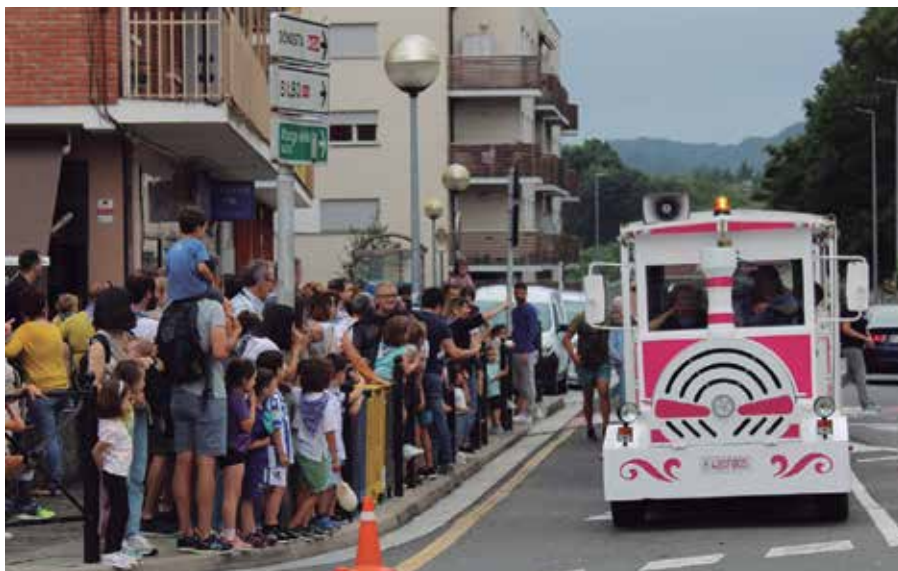
Uztailaren 1ean astelehena, Bordatxo aurretik abiatuko da txutxu tren. Goizez, 11:30etik 13:30era; Eta arratsaldez, 15:30etik 17:30era.

Festen azken txanpan aurren, haurrei eskainitako eguna. Uztailaren 1ean, astelehenez, goizean hasi eta arratsaldera arte luzatuko da gaztetxoaren egun hau. Goiz partean, adin tartearen araberrako ginkana, erronka eta puzgariak iragarri dituzte, herrian barrena ibiliko den txutxu trenarekin batera. Ekimenotarako izen ematea ekainaren 19an itxi zuten. Goizeko ekintzen ondotik, norberak eramandako bazkaria lagun artean dastatzeko aukera izango da. Jaiak arratsaldean segiko du, Artzabalgo ur puzgarietan edota askari ezin gozoagoarekin; txokolate janarekin. Uztailaren 1etik haratagokoak izango dira etxeko txikienei zuzenduriko ekimenak; buruhandi edota puzgariak egun gehiagotan izango dira eta.