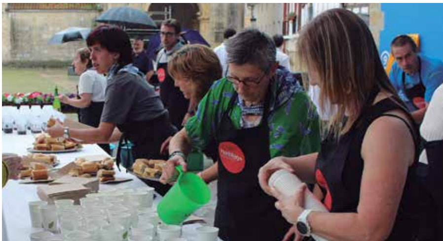
Eguraldiak laguntzen badu, lore eta salda banaketa Joxe Martin Sagardia plazan egingo da.