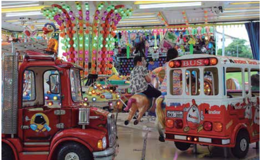
Barraketan prezio bereziak ipiniko dituzte uztaillaren 1ean eta uztaillaren 3an.

Interesdunei aski ezaguna egingo zaien arren, badaezpadako oharra. Anbulatorio pareko aparkalekuan kokatuko den ferriaguneko prezio bereziak aplikatuko dituzte, ohi bezala, festetako bi egunetan; batetik, uztaillaren 1eko Umeen Egunean eta, azkenik, Santixabelak amaitu eta biharamunean, uztaillaren 3an.