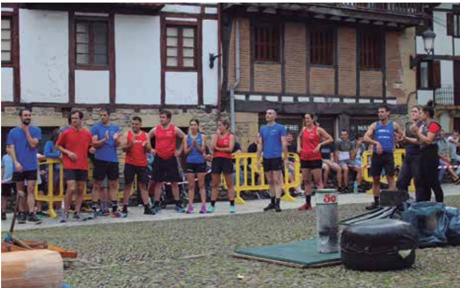
Ekainaren 29an larunbata, eguerdiko 12:30ean jokatuko da herri kiroletako desafioa plazan.

Herrikideak joko ezagunen bueltan (txinga, trontza, aizkora, korrika, giza proba, harri jasotzea) lehian jarriko dituen desafioa bueltan datorkigu. Ekainaren 29an, eguerdiko 12:30ean izango dugu herrikideak lehia bizian ikusteko aukera.