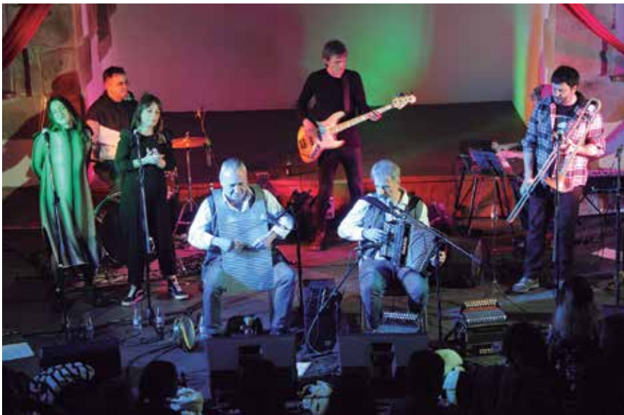
Tapia eta Leturia Band taldea uztailaren 1ean arituko da, iluntzeko 20:00etan frontoian.

Gaueko batean adibidez, herriko be-launaldi ezberdinetako musikariak igoko dira txosnetako oholtzara Bertsio Gauean parte hartzeko. Amebak ere kontzertua eta Fanfarrikant Brass Band taldea sortu berriak ere kalejira iragarri du. Gainerakoan, erromeria giroa izango dugu Laket, Tapia eta Leturia eta Itzal taldekoen eskutik; Puro Relajo ere bueltan izango dugu. Dupla, Neallta Fola, Ziztada&Rlantz taldeek edota Dj-ek osatuko dute, besteak beste, hainbat txarangekin batera, festa hauetako musika hitzorduen eskaintza.