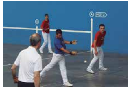
Kadete zein senior mailetako finalak uztailaren 2an jokatuko dira, arratsaldeko 17:00etan.