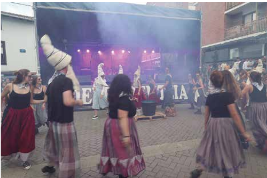
Gazte txupinazoa Mikel Laboa plazako txosnagunean izango da, ostiral honetan, arratsaldeko 20:00etan.

U surbilgo gazte mugimenduak eskaintza oparoa iragarri du hastear diren festa hauetarako. Ostiraleko gazte txupinazoarekin ireki-ko duten Mikel Laboa plazako txosnagunea izango dute topalekua. Musikaz blaitutako gauekin batera, bi ospakizun egun izango dituzte festa hauek; bate-tik, hilaren 28ko oilasko biltzaileena eta uztailaren 1eko Gazte Eguna, mojitada, aurrez txartelak eskuratzea beharrezko izango duen bazkari eta bazkaloste musikatuarekin. Jan-edanik ez da faltako paella lehiaketarekin edota poteo elegantearekin. “Dirurik gabe baina elegante!” aldarripean egingo den igan-deko hitzordu horretan, “argazkitxokoa” egongo dela iragarri dute, txanpain topa txosnetan eta sari banaketa.