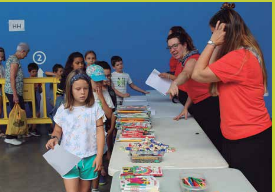
Kolore Festa arratsaldeko 16:00etan hasiko da eta opari banaketa 18:00etan egingo da.

Ohi bezala, Kolore Festa osatuko dute gaztetxo artista eta margolarien guraso talde baten eskutik jaien lehenengo egunerako. Ekainaren 28an ostirala, arratsaldeko 16:00etan Artzabalen. Ondoren, 18:00etan Kolore Festako opari banaketa egingo dute. Susana Martinek antolatzen zuen pandemia bitarte, baina, egun, antolaketaren pisua guraso talde batek hartu du. Pinturez gozatzeko aukera ederra izango da arratsalde osoan zehar.