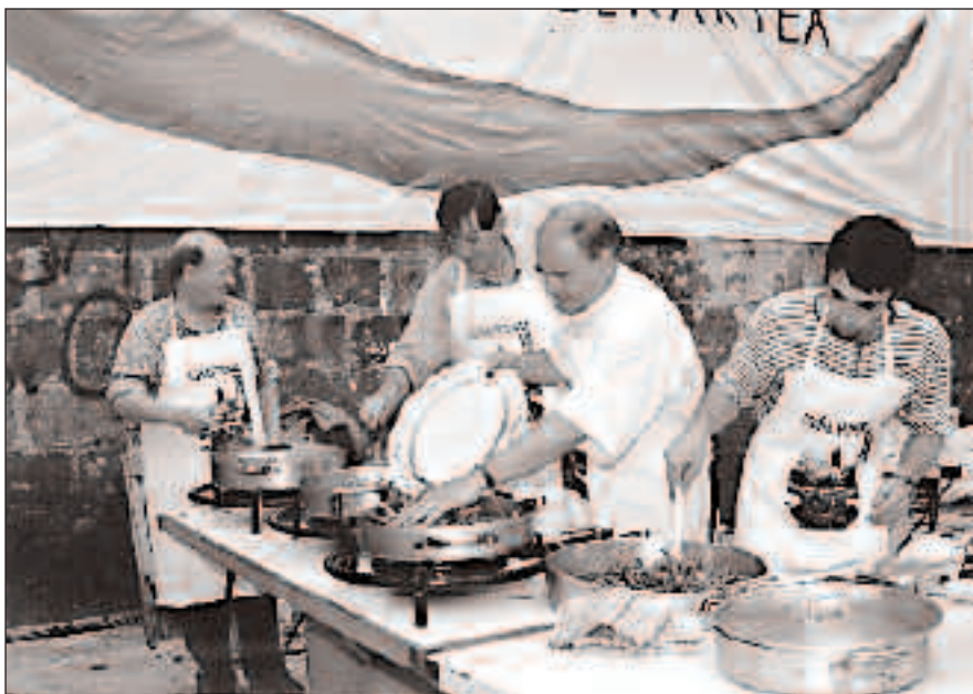
Usurbilen 80.000 kilo piper ekoizten dira batzbestek. Usurbilgo baserrietan piperrak duen garrantzia haundia da.

Usurbilen piper-gile ugari dagoenez zenbat piper ekoizten den jakitea ia ezinezkoa da ia. Batzuk sail haundiak dituztenez 20.000-40.000 landare jartzeko ahalmena dute, besteek berriz, 2.000-3.000 landareko pipersailak besterik ez dituzte. Baina zer egiten dute piper guzti horrekin? Zertarako ekoiztu hainbeste piper? Askotan, etxerako behar dena gorde eta Ibarra, Bilbo, Gasteiz edo Nafarroara saltzen