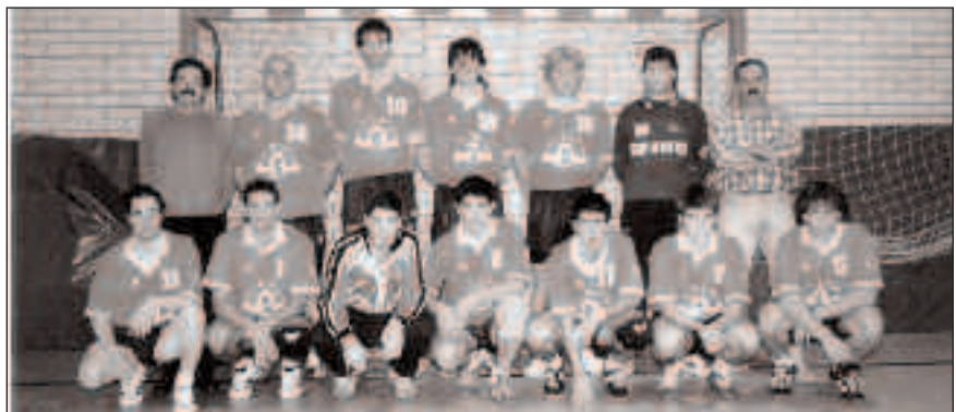
Bigarren nazionalerako taldea da mailarik altuenean jokatzeko duen taldea. Gainera, maila honetan jokatzeko dabilen talde beterranoena da.