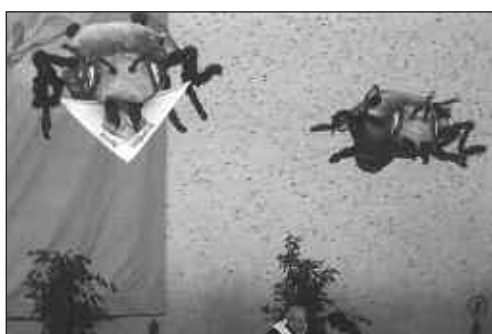
Zenbait erle ere agertu zen beraien egindako omenaldi honetara. Han egon ziren frontoian mugitu ere egin gabe.