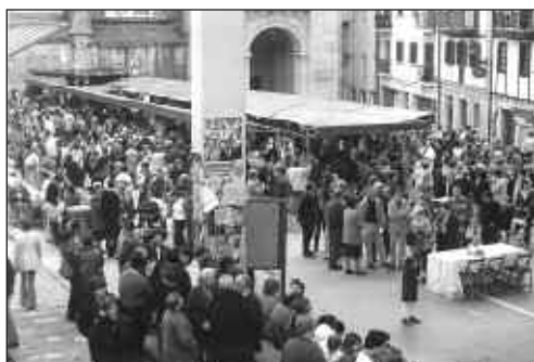
Iaz baino jende gehiago ibili zen III. Erle Egunean. Dema plazan zeuden produktuek ikusmira ugari sortu zuten.

Urkiola bihurtu ziren protagonista nagusiak. Lehenengoak Gipuzkoako ezti onenaren eta Euskal Herriko lorebarkarreko ezti onenaren sariak etxeratu zituen. Euskal Herriko lore anitzeko eztiirik onena izan zen, berriz, bigarrenarena. Bi eztingile hauen saritutako bi potoak Karlos Argiñano sukaldari famatuak eskuratu zituen 210.000 pezetaren truke