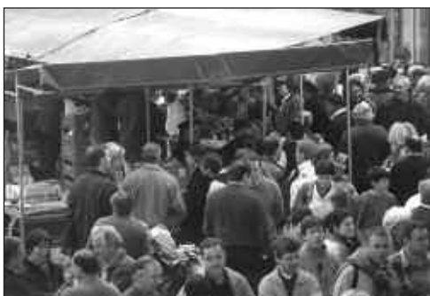
Ezti, gozokintzako produktuak, argizaria, sendabelarrak... nahi zen guztia ikusi eta erosi zitekeen 30 postu ingurutan.