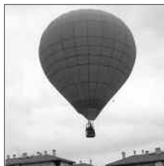
Herriko txikienek globoan ibiltzeko aukera ere izan zuten kiroldegi aurrean.