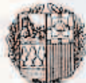
Kultura sailak diruz lagundutako aldizkaria