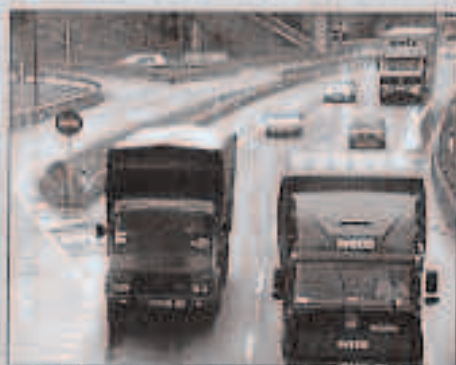
Isun hiru erabilienak bitarteko izan.

15 kilometroko tartean horretan ugariak dira auto istripuak. Horietako asko kamioiek aurre-