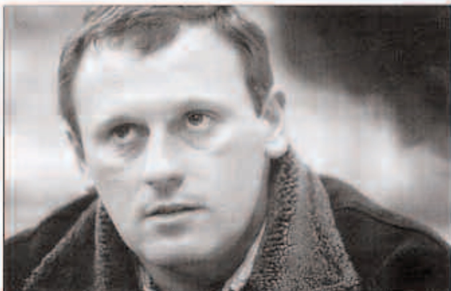
Diazokoa kontratugatik Argentinara itzuli da baina atari eta atariarekin itzuli nahi du.

Urietako Aika Haizea enpresan, mekanika makinan man-