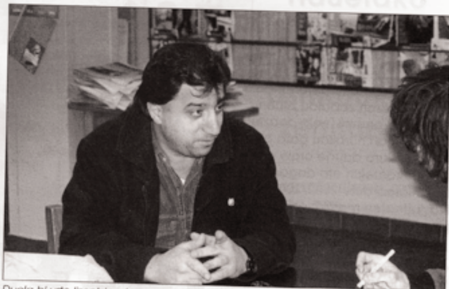
Duela bi urte lizentzia atera zuenetik norgehiagoka askotan aritu da epaile lanetan.

Dirua ez duzu irabazten. Zerbait pagatzen digute baina ezin zara horretara dedikatu. Astero bi edo hiru festibal egin