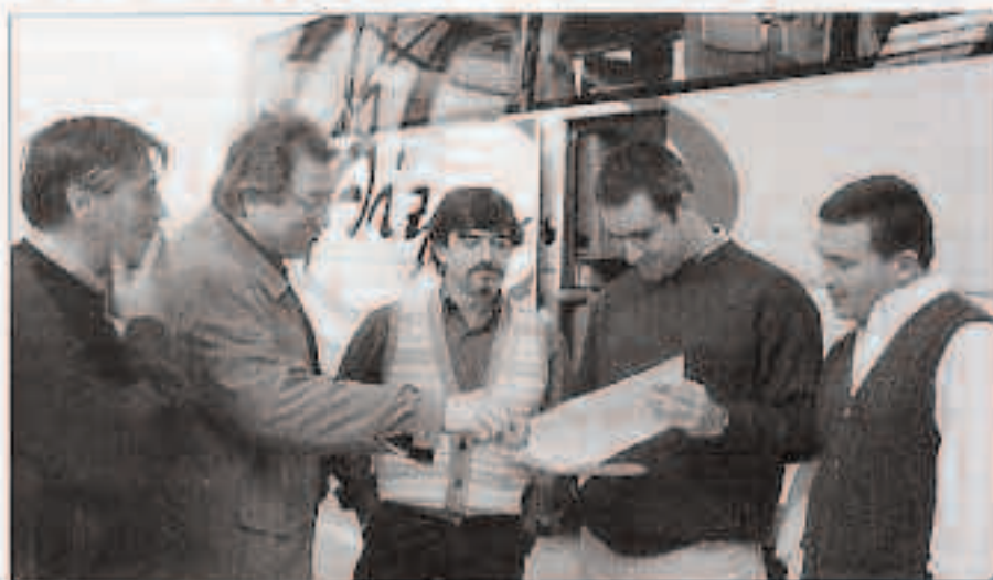
Alpaua kartzelatik gidarek auzat hartu dute legi berria.

Gida baimena behin berriz gaitzeko arauak ez dira sortu du gidariak artean. Labur esanda, aizen bi urtean hiru legegaitze "oso izen" egiten dituzten gida baimena kendu-ko zait. Hauiek dira oso larriak hartzen direnak: gehiegizko alkohol tasak gidatzea edota drogak hartuta gidatzea, auto-an jende gehiegi eramatea,