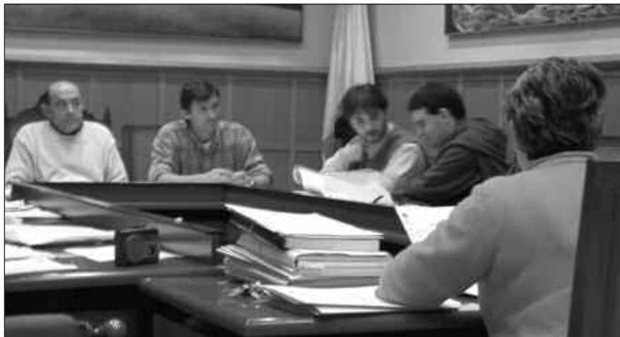
2002ko aurrekontuak urtailaren 29an onartu zituen udal-gobernuak.

- Gizarte zerbitzuko bulegoak Txaramuto azpira doaz. Erregistro