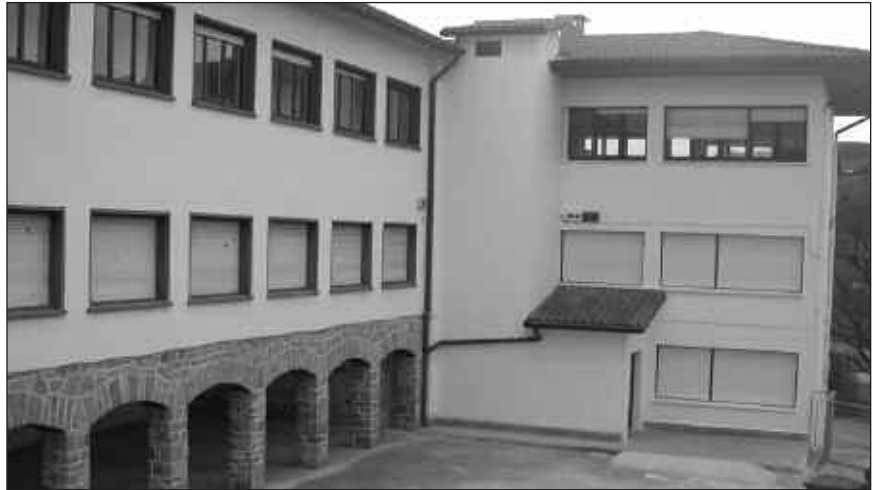
Eguneko zentroaren hainbat lan dagoeneko aurreratuta daude.

Dena den, 12 izango dira eguneko zentroak eskainiko