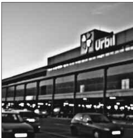
Urbilen asko dago egiteko.

erdal hitzunen kopurua handia dela ondorioztatu da. Langileen ia heren bat erdal hitzuna da eta azterketak dioenez "euskararentzat, zerbitzu hizkuntza bezala aztertzean, muga handia suposatzen du honek".