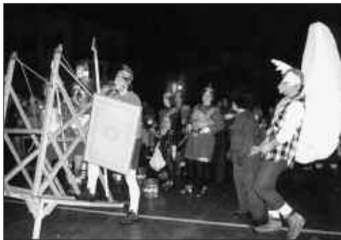
Asterix eta Obelix gaiak joko asko eman zuen.

umeak izango dira. Extralurtarren desfilea, ordea, 18:00etan hasiko da koadrilen arteko ovni txapelketarekin. Segidan egingo den kalejira eta poteoa trikitilariak alaituko dute. Eta gaueko parranda ondo hasteko afaria ere antolatu da. Antolaketa batzordeak mahaiak eta edaria ipiniko ditu.