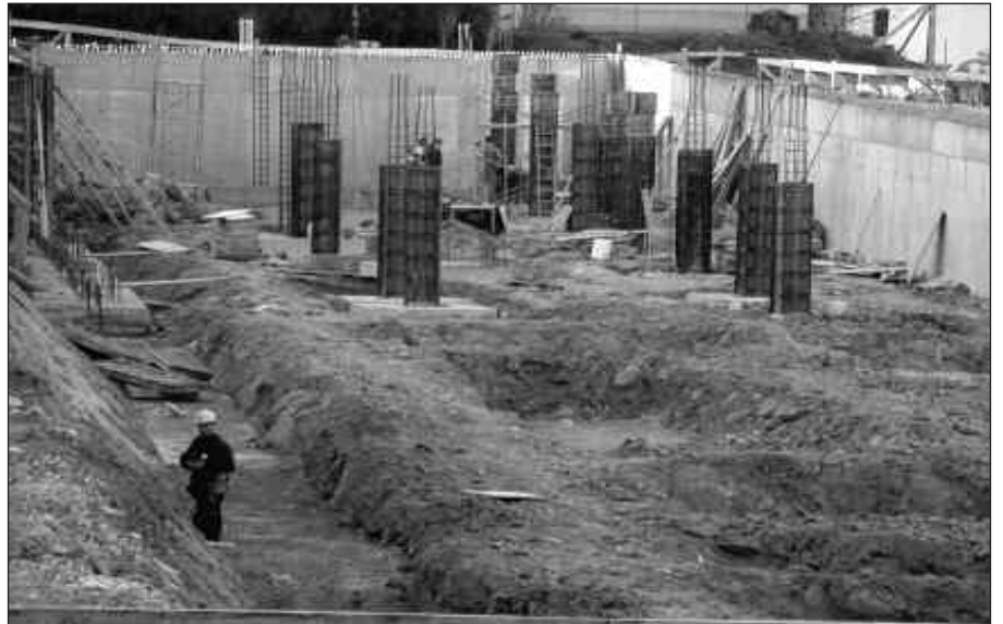
Eraikuntza eta industria dira lan istripu gehien jasaten dituzten sektoreak.

Hain zuzen ere, lan baldintza hauetan ari direnen kasuak nabarmendu ditu Bittor Iribar-