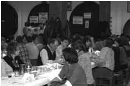
LAGUN ASKO HURBILDU ZIREN AGINAGA SAGARDOTEGIRA.