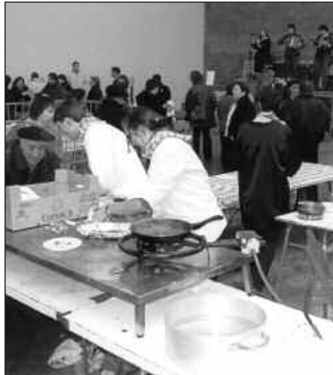
ZIORTZAKO GAZTEEK TXISTORRA ETA SALDA PRESTATUKO DUTE.

- 13:00: Ixabel III.aren zozketa. Ondoren, babarrun eta sagardo lehiaketan emaitzak.