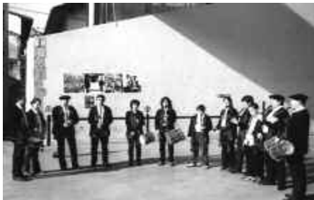
TXISTULARIEK KALEJIRAN OSPATU ZUTEN SANTA ZEZILI EGUNA.