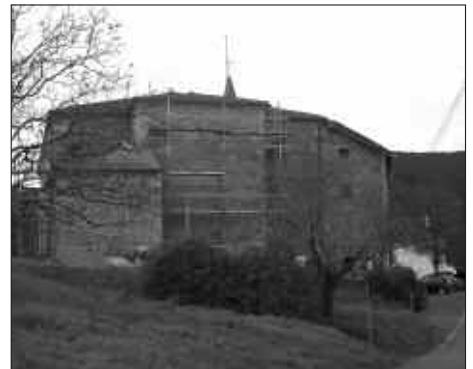
UDALAK GUZTIRA 36.134,49 €-KO INBERTSIDA EGINGO DU LUR HAUETAN.

saila (San Estebango elizaren ondoko lur laua) elizarena da. Gauzak ez daude batere argi. Izan ere, lursail hori bi aldiz erregistratuta baitago. 1920an, Aginagako Komunitatearen izenean; eta 1992an, parrokiaren izenean. Hau konpontzeko bi bide aurrikusi dira: bata, lursaila bere izenean dutenen arteko akordioa; bestea, epaile batek jabetza norena den argitzea. Aipatu behar da lursail hau dela garrantzitsuen, hiri-lur izaera baitu. Hor argitu bitartean, Udalak gainontzeko lurak erosteko konpromisoa hartu du.