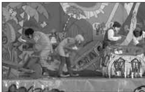
BI SAIO ESKAINIKO DITUZTE HILAREN 22AN.

prezioan, eta egun berean 5 eurotan. 12 hilabete arteko haurrak doan sartuko dira, norbaiten ardurapean beti ere. Antolatzaile: Argiaren Adiskideak, Usurbilgo Taldea.