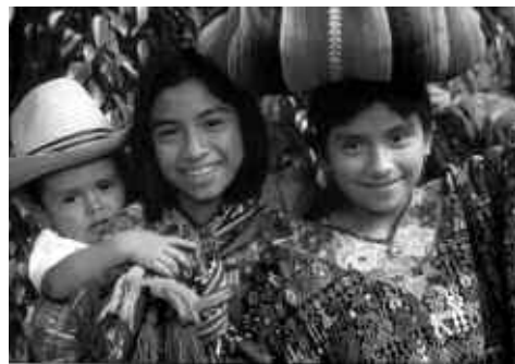
PAUSOZ PAUSO TALDEKOAK JARRI DUTE MARTXAN ELKARTASUN KANPAINA HAU.

Seguraski herrialde behartsu horien arazoa estrukturala izango da; baina gurea "mentala" ez ote da? Mundua era bakarrera soluzionatu dezakegula pen-