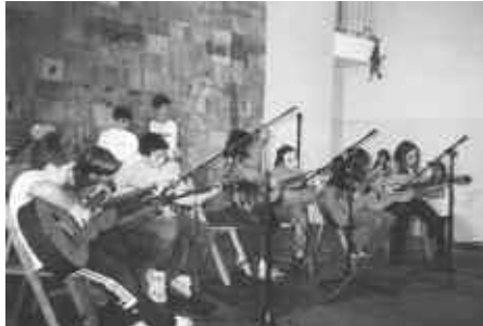
AZAROAREN 22KO EKITALDIAN LAGUN ASKO PASA ZIREN OHOLTZATIK.

Txistulari taldeak, ordea, iganderako utzi zituen ospakizunak. Kalejiran herria alaitu ondoren, kontzertua eskaini zuten frontoian.