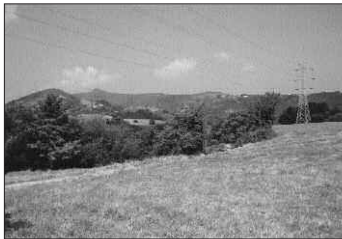
ARGAZKIAREN EZKERRETARA DAGO INTXUITSXABAL BASERRIA. ZUHAITZ ARTEAN, BEHERUNTZ, ARPITA.