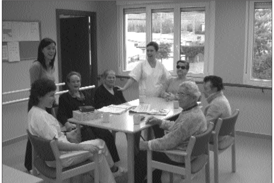
BOST LAGUNEKIN ABIATU ZEN EGUNEKO ZENTROA ETA GAUR EGUN IA PLAZA GUZTIAK BETETA DAUDE.

Etxean bizitzen jarraitzen duen jende helduaren artean, bada egunean zehar laguntza premia handia duenik. Horientzat leku aproposa da Eguneko Zentroa. Laguntza pertsonala ez ezik, psikologikoa eta emozionala ere bermatzen delako. Bost lagunekin abiatu zen Eguneko Zentroa eta gaur egun ia plaza guztiak beteta daude (guztira 12 lagunentzat prestatuta dago egungo zentroa). Zerbitzuak arrakasta izan duen seinale.