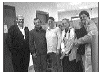
URRIAN KZGUNEAN IKASTEN

1. IT Txartela. Azaroak 19 ostirala arratsaldeko 18:00-20:00.