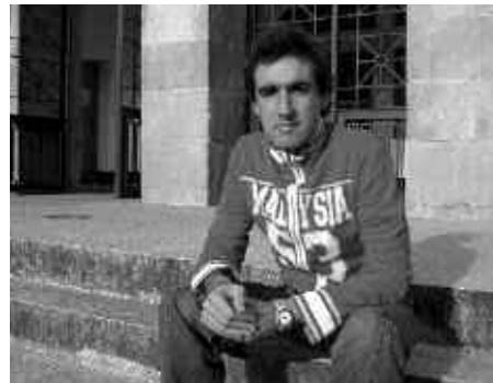
EA ALDERDIAREKIN AURKEZTU ETA GAUR EGUN SOZIOKULTURA BATZORDEKO ZINEGOTZIA DA GURE SOLASKIDEA.

I. B. Nik Udal Liburutegia jarriko nioke. Liburutegia da nagusiki, baina azpian 150 eserleku inguruko areto bat izango du. Eta erdian, erakusketa gela