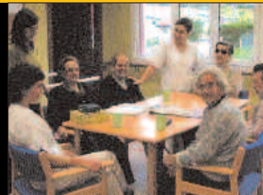
Eguneko Zentroaren lehen urteurrena