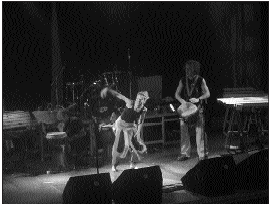
TTAKUNPA TALDEAK PERKUSIO AFRIKARRA ETA TXALAPARTA UZTARTZEN DITU ZUZENEKO EMANALDIETAN. TTKUNPA TALDEA AZAROAREN 6AN IZANGO DA, PILOTALEKUAN, GAUEKO 22:30EAN HASITA.

"Euskera senzilloaren manifestoa" antzerkia emanaldia, azaroaren 5ekoa, Udarregin izango da. Baina Ttakunpak azaroaren 6an eskainiko duen kontzertua, berriz, pilotalekuan egingo da.