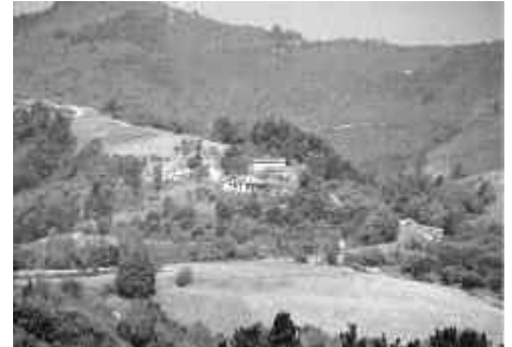
ERRAUSTE-PLANTAREN KOKAGUNETIK AUTOPISTAREN IRUDI HAU IKUSTEN DA.

Azken hilabeteotan, solasgai nagusian bilakatu da errausketa. Argudioak argudio, gure inguruan asko dira Foru Aldundiaren egitasmoarekin asaldatuta daudenak. Aritzetako proiektua gauzatu balitz, ordea, gure protagonistek etxe parean jasan beharko lukete errauste-planta. Andrenagusi, Arpita eta Intxuitxabal baserrikoen kasua da. Euren hitzak bildu ditugu honako erreportajeon.