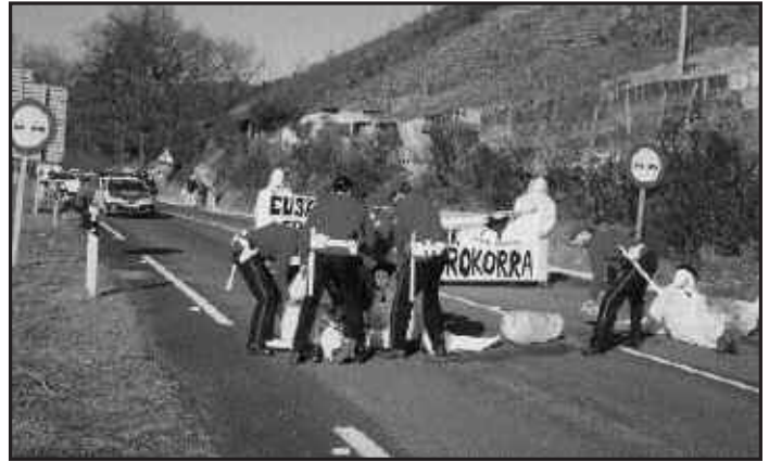
2000-01-23, N-624 ERREPIDEA