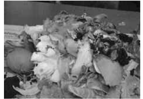
KONPOSTA BIDEZ, ZABOR ASKO BIRZIKLATU DAITEKE

Orain, XXI mende hasieran, zabortegiak anti-ekologikotzat hartzen dira. Birziklatu, berrerabili, konpost-egin edota errausketa-plantan balorizatu ezin dena bakarrik jasoko luke etorkizuneko