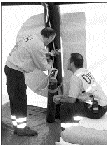
IKASLE KOPURUA MUGATUA IZANGO DA.

Arestian esan dugun moduan, ikastaroan edonork har dezake parte. Ez da aurrez ezagupenik behar. Egutero-kotasunean aurki ditzakegun arrisku egoerei aurre egiten irakatsiko digute DYako adituek: bihotz eta birika susperketa, zauriak, hausdurak, erredu-rak... Ikastaroan izena ematen duenak oinarrizko ezagupenak jasoko ditu. Lezioak oso arruntak izango dira; ikasiko duguna, aldiz, guztiz lagungarria. Teorian eta praktikan baliogarri diren aholkuak jasoko ditugu, oso modu erosoan eta atseginean gainera.