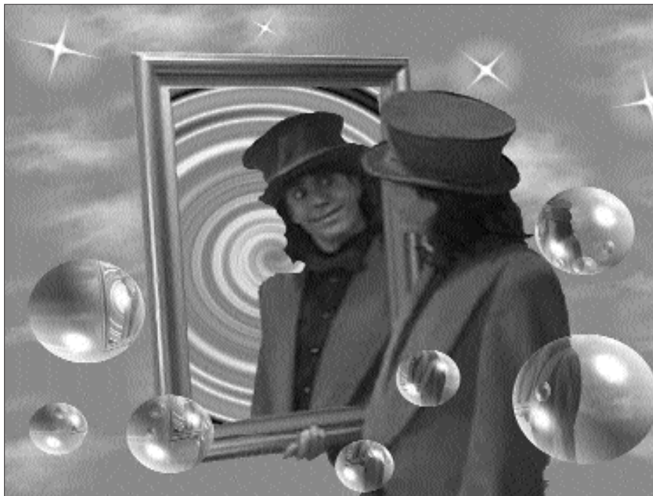
EKAINAREN 4AN IRITSIKO DA GURE ARTERA ERIZ MAGOA, KALEZARRERA HAIN ZUZEN.

U daberriarekin batera iritsi ohi da Plis, Plas, Txalo ta Jolas egitaraua. Hasteko, kirol pixka bat egiteko aukera izango da. Bide batez, herri kirolak ezagutzeko parada izango dugu. Arratsaldeko 17:30ean hasiko da herri kirol saio hori, non eta Santueneko eskubaloi zelaian. Ondorenean, Plis Plas egitarauari esker, Eriz Magoa, Korri, Xalto eta Brinko pailazoak eta Pirritx eta Porrotxen bisita jasoko dugu. Animo eta ondo pasa!