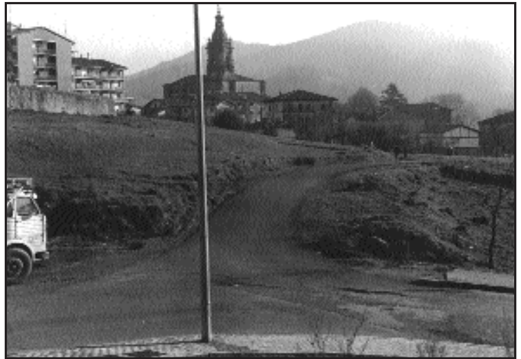
Egilea: Luis Arnaiz, 1978-79, Atxegalde