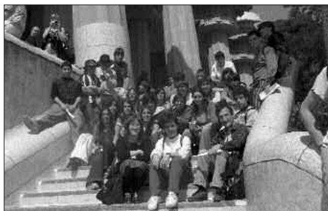
KOADRILA OSOAREN ERRETRATUA.