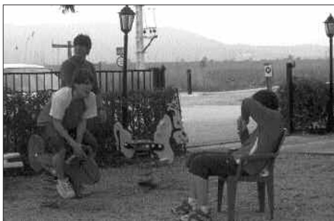
TXIKI-PARKEAN ERE IBILI GINEN.