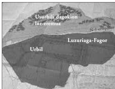
ERRAUSTE-PLANTAREN ALTERNATIBA LITZATEKE ODON ELORZAREN EGITASMOA.

Elor mendi-maldaren aldamenean dagoen lur sail hori biometanizazio gunea eraikitzeke egokia dela uste du Donostiako udal gobernuak. Landa lurak dira eta lur sail osoak 40 hektarea hartzen ditu. Donostiako alkatearen esanetan, "hirigunetik aldentuta dago, ez dira nekazaritza lurak eta, gainera, ezin urbanizatuzkoak dira".