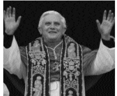
FUMATA ZURIAREKIN BAT EGIN ZUTEN USURBILGO ELIZAREN KANPAI HOTSAK.

DEMOKRAZIA: Zer dela eta dira batzuk egiaren jabe? Ez al goaz, bada, denok egiaren bila? Egiaren monopolioa dutela uste dute Vatikanon eta horrek dakar teologo disidentek zigortzea (Hans Küng, Leonardo Boff, Juan José Tamayo...) Baina, ezin al da iritzi ezberdinik eman? Ezin al da teologia gaurkotzen saiatu? Ezin al da bide berririk urratu? Elizan denok izan behar genuke berdinak duintasunean, nahiz eta zerbitzu ezberdinetan jardun. Elizak ez du izan behar piramidala, kolejiala eta demokratikoa, baizik. Denok berdi-