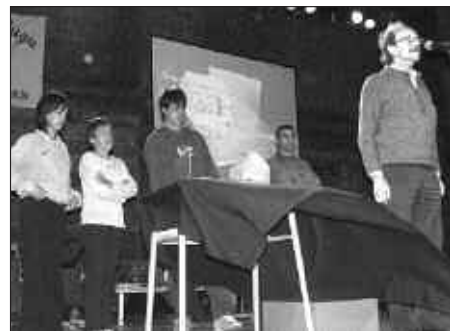
DUELA BI URTE EGIN ZEN JEXUX ARTZEREN OMENEZKO LEHEN KULTURALDIA.

J. R. F. Ez dok amairu erakusketako material guztia Udalaren esku utzi genuen hitzarmen bat sinatu ondoren. Udala,