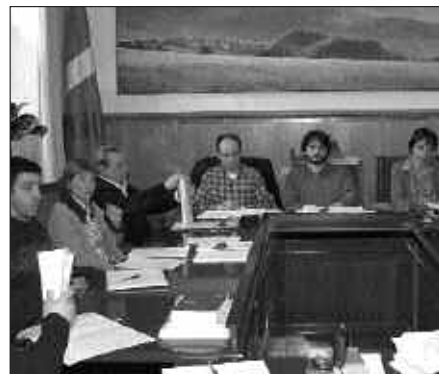
IAZ, AURREKONTUAK ONARTU ZIRENEKO ERRETRATUA.

Hirugarrengoan onartuko zelakoan, apirilaren 22rako Ogasun Batzordea bil-