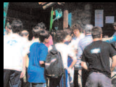
Andatza Eguna, maiatzaren lehenean