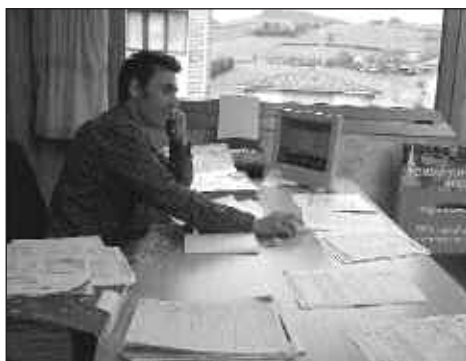
HERRITARREN %5AK BAKARRIK EGITEN DU ERRENTA AITORPENA EUSKARAZ.

Gipuzkoako Foru Aldundiak erabakitzen du nork ordaindu behar dituen zergak osorik, eta nork sar ditzakeen kenkariak. Jaiotze-tasa beheruntz egiten ari dela ikusita, seme-alabak edukitzeagatik egiten diren kenkariak handitu egin dira. Aurtengo nobedadeen artean, dohaintza edo donazioak egiteagatik aplikatzen den kenkaria da. Aurreko urtean %20koa izan zen eta aurten %30ekoa izango da, hala-koak areagotu eta bultzatu behar direla ulertu baitu Foru Aldundiak.