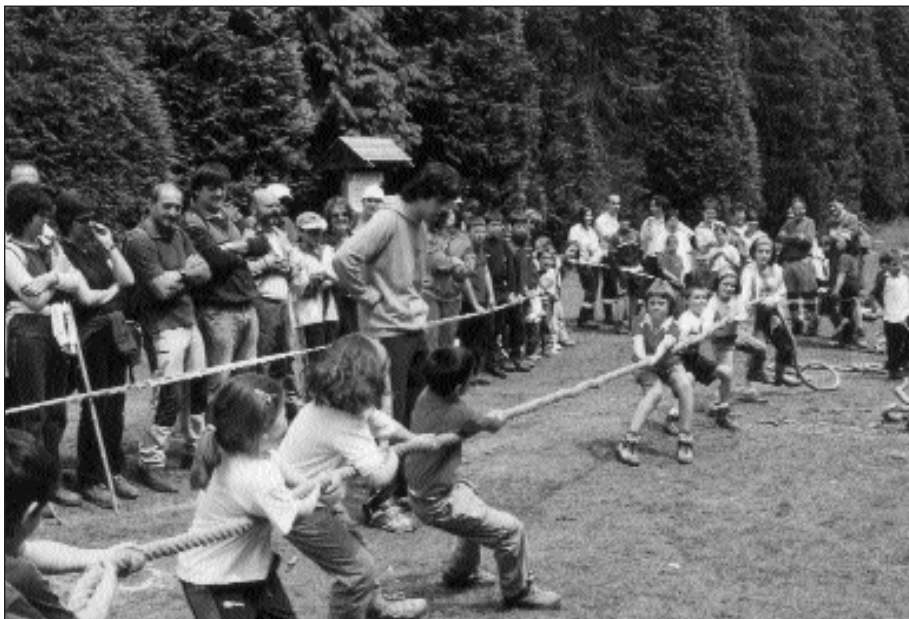
IAZKOAN, HERRI KIROLETAN ARITZEKO AUKERA IZAN ZEN.

Ea, bada, jai giroan egun egokia pasatzeko aukera dugun!