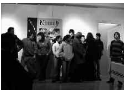
ASTEKARIAREN INGURUKO ESANAK ADI-ADI JARRAITU ZITUZTEN BERTARTU ZIREN GUZTIEK.