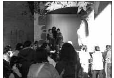
EGUERDIKO 11:30EAN JASOKO DIRA GUTUNAK PILOTALEKUAN.

Arratsaldean, erregeak kabalgatan irtengo dira gu agurtzera, eta herri guztian ikusi ahal izango ditugu. Erregeekin batera, frontoira iritsi aurretik, txistulari eta dantzariak arituko dira kalejira girtzen. Beti bezala, San Estebandik sartuko dira herrira zaldiz, Santuenetik pasa ondoren Kalezarrera joateko, eta handik Atxegaldera. Atxegalde eta gero Zumarte