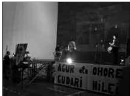
AURESKU HUNKIGARRI BATEK TXALUZ JOSI ZUEN PILOTALEKUA.