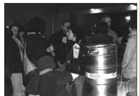
ASTEKARIA EZAGUTZEAZ GAIN, TERTULIAN ARITZEKO AUKERA ERE IZAN ZEN SUTEGIN.