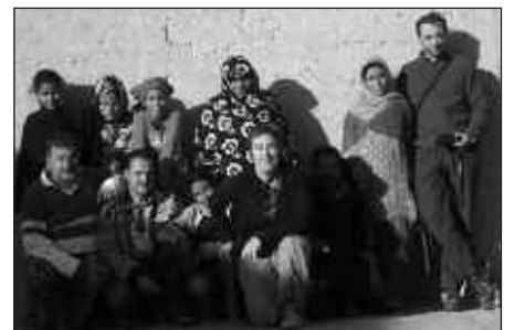
ABENDUAN, MENDEBALDEKO SAHARAN IZANDAKO HAINBAT USURBILDAR.

Orain, ordea, aukera ederra daukagu gure elkartasuna adierazteko. Gure aha-lerin txiki bat, eurentzat laguntza handikoa baita. Egun hauetako erosketa zerrenda luzeetan, langostino edota txanpainarekin batera, konpresak, atuna