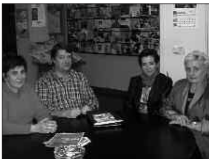
USURBILGO ODOL EMAILEEN ELKARTEKO HAINBAT KIDE.

Elkarteko kideek odola ematearen garrantzia azpimarratu nahi dute berriz ere: «denei, bai laguntzaile, bai odol emailei, gure eskerrik beroena