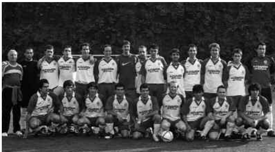
ERREJONIAL TALDEAK MARIÑO TALDE IRUNDARRA IZANGO DU AURKARI.