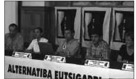
UDA AURRETIK, PLANAREN AURRERAPENA AURKEZTU ZUTEN.

- Gainerako zaborra: papera, beira, plastikoak, metalak, pilak, sendagaiak, tonerrak... Gai horiek berrerabiltzeko edo birziklatzeko, atez ateko gaikako bil-