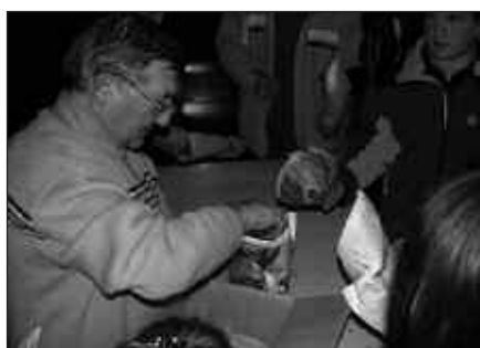
GAZTAINAK EGITEN ETA GAZTAINAK BANATZEN JARRI GENITUEN LAGUNEI, MILA ESKER.