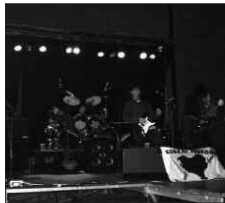
INDARTSU ARITU ZIREN MENDEKU ITXUA TALDEKOAK.

zuten saioa. Taldearen miresle sutsuak aurrean, entzule berriak adi-adi inguruan, eta festa gosea zuten beste guztiek bete zuten pilotalekua. Hotz bazegoen ere, azkar berotu zen giroa doinu heavyek bultzatuta eta edariak lagunduta. Kontzertuaren ondoren diskoteka prestatu zuten frontoian. Estilo guztietako abestiak entzun ziren eta goizeko ordu txikiak arte jarraitu zuten musikak. Tabernetan egon nahi ez zuenak izan zuen zereginik urteko azken gauean.