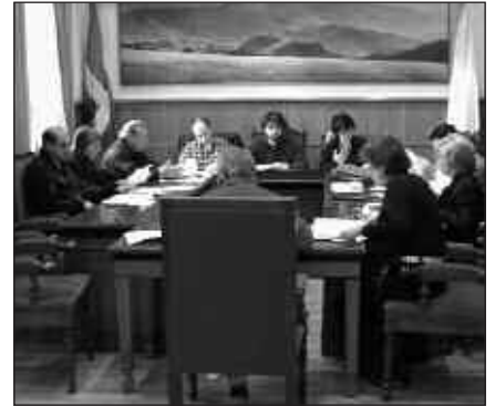
ABENDUAREN 27KO UDALBATZA PLENOKO IRUDIA.