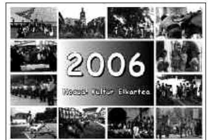
EGUTEGI GEHIAGO, GURE BULEGOAN