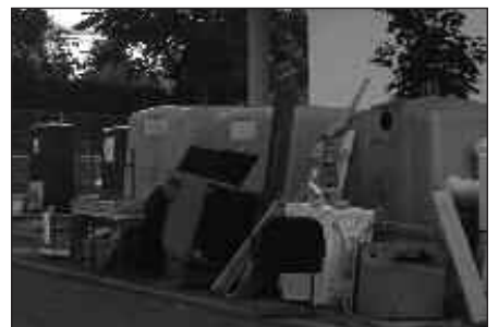
ZAKARRA UGARI SORTZEN DA GABONETAN.

Papera, kartoiak, beira eta antzekoak ugaritu egiten dira eguberrien ondoren. Dena den, zakarrontziak beteta