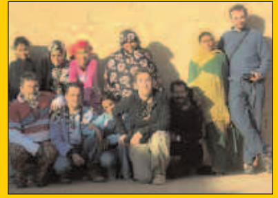
Sahararen aldeko kanpaina