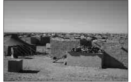
BASAMORTUAN BIZI DIRA, SAHARARRAK, ERREFUXIATURIK.

Usurbilen, urtarrilaren 14an amaituko da bilketa-kanpaina. Nola hartu parte? Oso erraza da. Dia eta Aliprox-Eroski saltokietan atuna oliotan, azukrea eta konpresak erosi (produktu horiek dira estatu