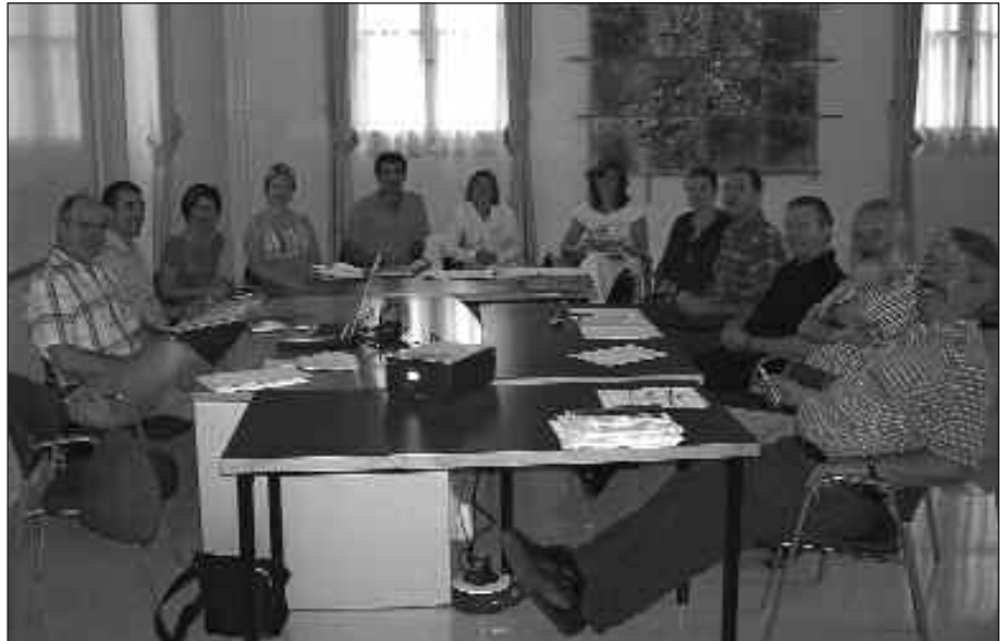
JARRAIPEN BATZORDEA SINDIKATUETAKO ORDEZKARIEK, EUSKARA TEKNIKARIEK ETA EUSKARA BATZORDEETAKO LEHENDAKARIEK OSATZEN DUTE.

Aurreko urtea amaitu bitartean Emunek hogeita hamar enpresa bisitatu zituen, eta litekeena da horietako batzuk euskara sustatzeko plana abian jartzea. “Aurreko urtean arrazoi ezberdinak tarteko azken unean atzera bota