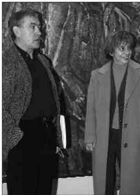
LAN MUNDUA EUSKALDUNTZEKO SINDIKATUEK LAGUNTZA ESKATU DIOTE EUSKO JAURLARITZARI.

ERREPORTAJEAREN EGILEA: TXINTXARRI _____ SUSTATZAILEA: BURUNTZALDEKO UDALAK _____