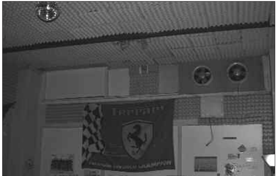
LOKAL BATEAN, SABAIA METRO BAT BEHERAGO JEITSI ETA GERO

H amasei pertsona gara lokalekoak, baina kanpoko jendea ere etortzen da. Ez gara itxiak zentzu horretan. Antolatutako jarduerekin ere besteeenganako harremana lantzen dugu”, kontatu digute lokal hauetako batean, baina besteetan ere antzekoa gertatzen da. Hainbeste jende areto batean bilduta egoteak zarata eragin dezake, eta horrek bizilagunekin iskanbilak sortuko dituela pentsatzea ohikoa da, baina errealitatea, sarritan, ezberdina da: “Hasieran arazoak izan genituen, batez ere soinuagatik, baina orain ez”, aitortu digute lokal hauetako kide batzuk.