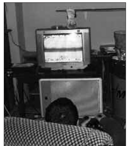
LOKAL ARTEKO LIGAKKAK JOKATZEN DIRA.

dea biltzen gara txandaka torneoa burutzeko. Irabazleek saria jasotzen dute. Porra bat ere egiten dugu, liga-koa. Hemen ere jende dezente hartzen du parte, ez bakarrik lokalekoak garenak” argitu dute lokal batean. Dioten bezala, hiru lokal hauen artean, eta lokaletakoak ez diren jendea ere bilduta, futbol txapelketa konplexua antolatzen dute bideojokoan bidez.