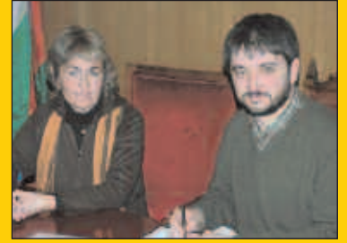
EA eta EAJ-PNV adostasunera iritsi dira