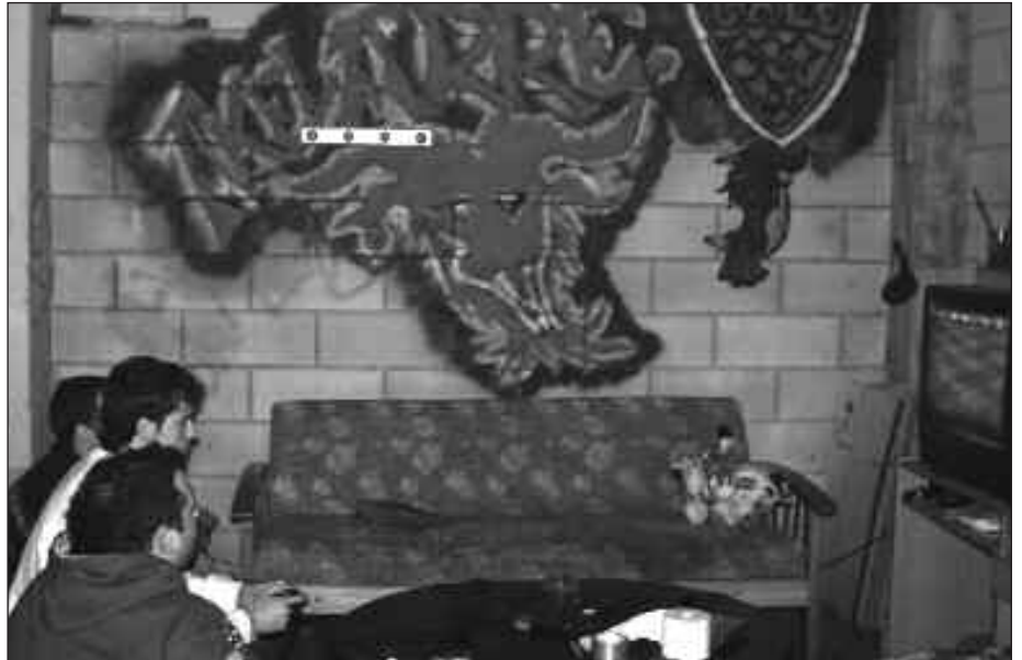
GAZTE KOADRILA BAKOITZAK BERE TXOKOA SORTU DU.

E lkarreentzako sistema antzekoa erabiliz, baina egongela itxurarekin, tabernen alternatiba bilakatu diren txokok ugalduta egin dira Usurbilen. Neguan bero eta udan fresko, hori diote beraiek. “Etxean bezala gaude: pelikulak ikusi, bideojokoetan aritu edo lasai hitz egiteko txokoa daukagu; baina etxe batean lagun guztiak biltzea ezinezkoa litzateke, eta neguan aterpe bat asko eskertzen da”. Jende askoren jakin-mina piztu du gai honek. Hori dela eta, herriko hiru lokaletara jo dugu eta bertako gazteek euren atea zabaltzeko ditzaguten euren lokalak pixka bat gehiago ezagutu ditzagun.