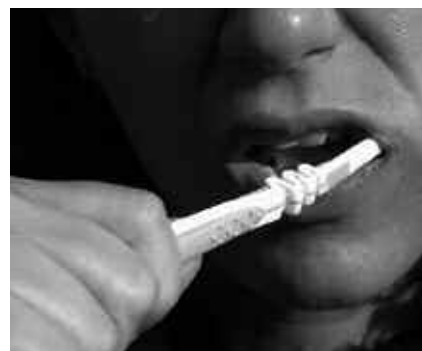
HORTZAK ONDO GARBITZEA FUNTSEZKO DA.

- Elikadura garrantzia handikoa da ahoarentzat; azukre kariogenikoek (karamelu eta gozokietan daudenak) ahoa kaltetzen dute; barazkiek, aldiz, garbitu eta aho-hortzetako osasuna indartzen dute. Esneak eta esnekiek