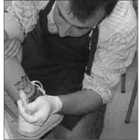
HENNA IKASTAROA HIRU ORDUKOA IZANGO DA.

Ikastaro hauetako batean izena emateko NOAUA!ren egoitzara etorri behar duzu (prezioa ikastaro bakoitzeko, 15 euro). Baina gogoan izan izena emateko epea apirilaren 5ean amaituko dela. Ikasle kopurua mugatua izango da, gehienez 15 lagun.