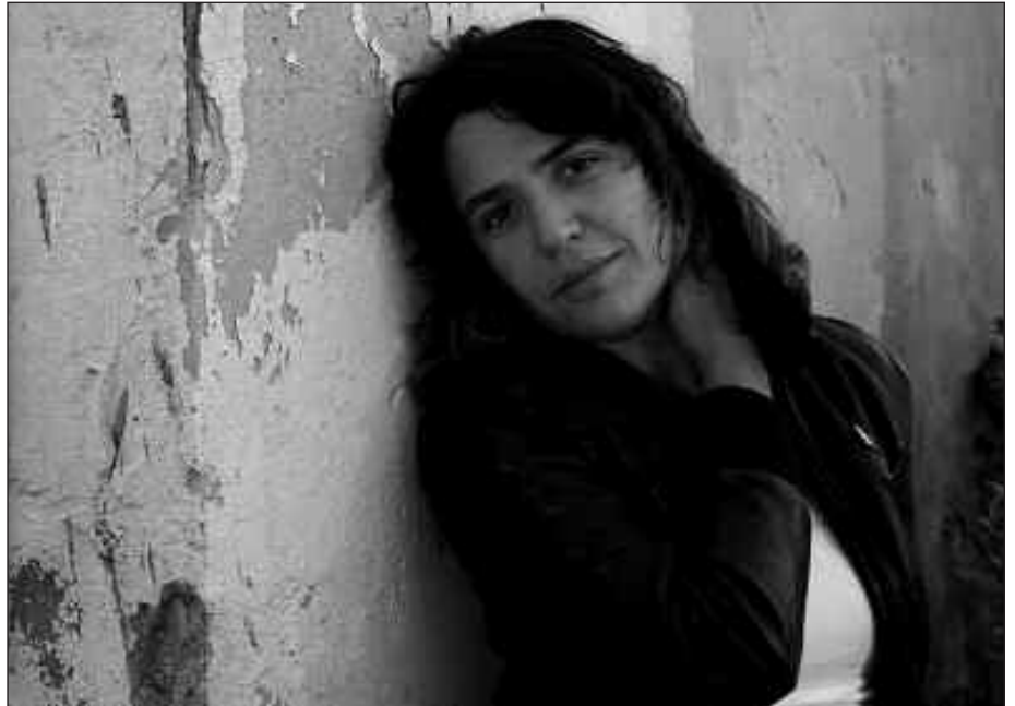
BENTAN, TXIRRISTRAN ETA NOAUA!KO BULEGOAN DAUDE SARRERAK SALGAI.