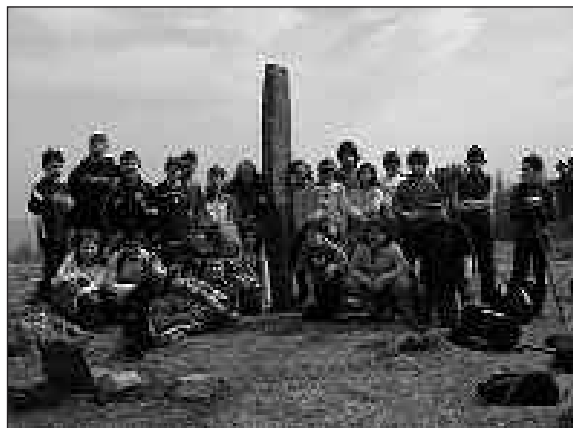
TXANGOAREN HELBURUETAKO BAT NATURAZ GOZATZEA ETA ELKARREKIKO HARREMANAK SENDOTZEA ZEN.