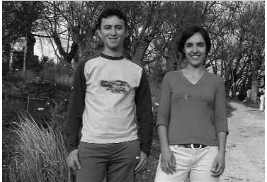
MILORRI ENPRESAREN ESKAINTZA AITZINDARIA DA EUSKAL HERRIAN.

A. L. Enpresa moduan apirilean hasiko gara lorezaintza ekologikoa eskaintzen. Arlo desberdinetan baina urteak daramatzagu lorezaintza eta nekazaritzarekin zerikusia duten lanak egiten. Ekologikoa izatearena, berriz, ingurugiroari diogun errespetuagatik eta baita Europar Batasunetik garapen iraunkorraren inguruan hartzen ari