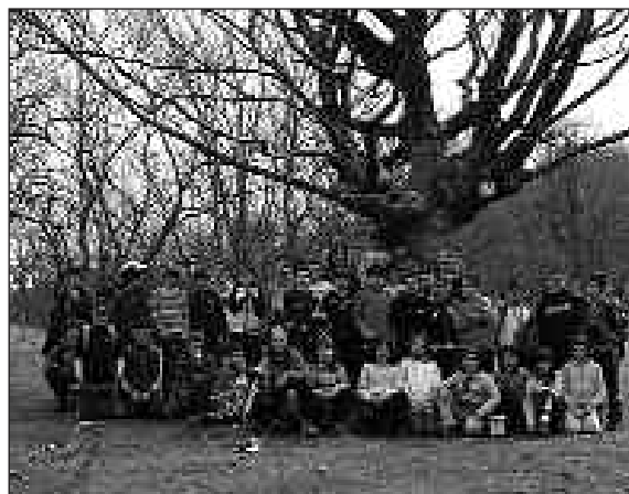
IBILBIDEAN ZEHAR GAUZA INTERESGARRIAK IKUSI GENITUEN.