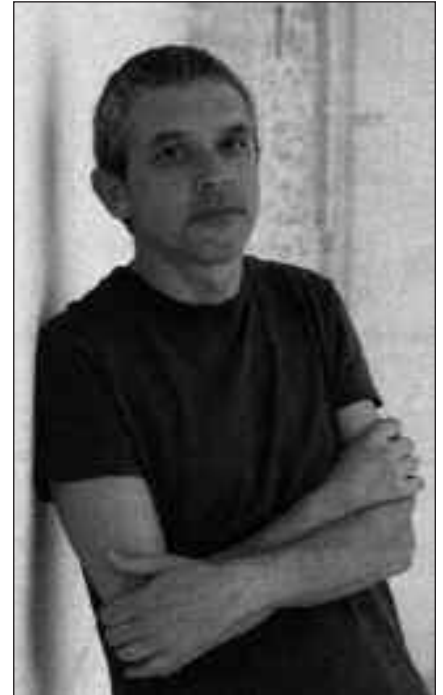
BAKARKA ARGITARATU DUEN SEIGARREN DISKOA AURKEZTUKO DU SUTEGIN.

Diskoan mantendu duen kantu-ordena da Sutegiko emanaldian eskainiko duena.