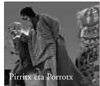
Pirritx eta Porrotx

Ekainak 15 osteguna Pirritx eta Porrotx 17:00etan herriko frontoian