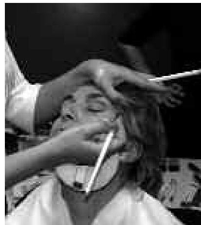
MAIATZAREN 6AN HASIKO DA MAKILAJE IKASTAROA.

Ikastaro hauen inguruko informazio gehiago honako telefono zenbakietan: 943 37 15 35 / 943 36 50 31. Ikastaroenak Santuenea Kultur Elkarte.