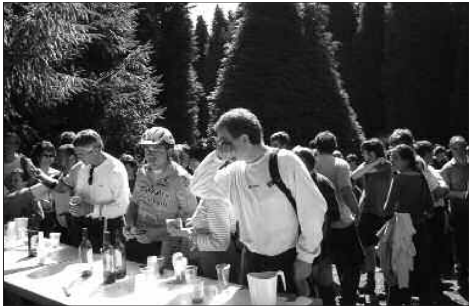
HERRI KIROLAK, JOKOAK, HAMAIKETAKO... EGITARAJUA ERAKARBARRIA DA OSO.

Dagoeneko, XV. mendean Irisasi mendiko harrobiak aipatzen dira Atxega Jaurerriaren jabetzako parte bezala. Halaber, 1406 urtean