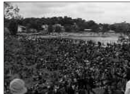
MAIATZAREN 14AN OSPATUKO DA AURTENGO HERRI URRATS.

Zirkuituaren inguruan, ostatuak jateko eta edateko, animazioak eta lasai egoteko tokiak izango dira.