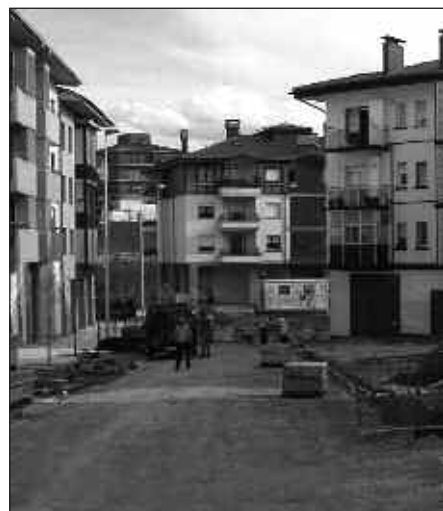
EGUZKITZA AUZOKO BERRITZE-LANAK AZKEN TXANPAN SARTU DIRA.

2.- Onerako izango da ziur aski hodian kontuan, baina bestela ez dakit. Ez dakit nola geratuko den azkenean, plana erakusten dizute baina ez dago jakiterik gero zer egingo duten. Hori bai, udaltzainak etor daitzela, hemen autoek nahi duten lekuan aparkatzen baitute, obra barruan sartuta. Hesiren bat edo jarri beharko lukete.