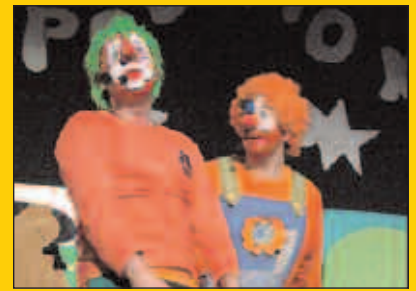
Maiatzaren 13an Zubietan, Poxpolo eta Mokolo pailazoak