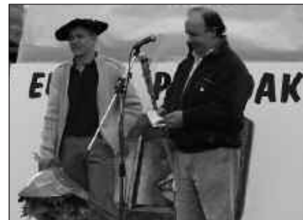
USURBILDAR ASKO BILDU ZIREN OMENALDIAN.

Frantziako Nanterreko espetxean zen baina gaixotasun larri bat medio, aske utzi zuten duela aste batzuk. Jada tratamendua jasotzen hasia da.