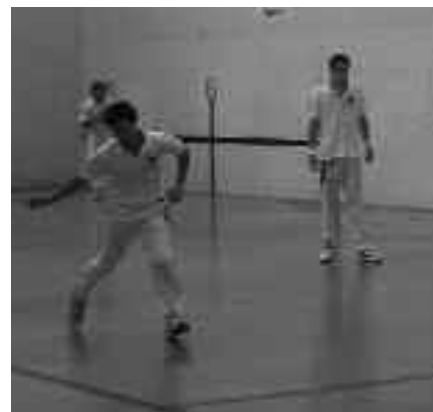
ITZULIKO PARTIDAK MAIATZAREN 6AN, 18.00ETAN, ZUMARRAGAKO BELOKI UDAL PILOTALEKUAN.

Asteburu honetan, Zumarragako Beloki pilotalekuan jokatu beharko dituzte kanporaketako itzuliko neurketak. Aurrera egiten duen taldeak Zegamaren aurka jokatuko du final zortzirenetako norgehiagoka.