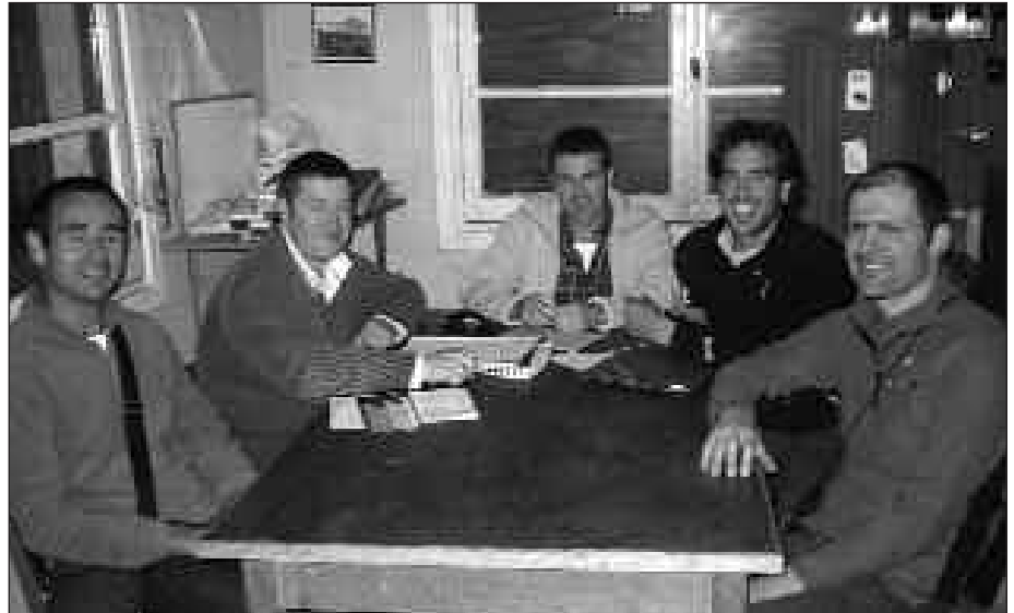
IDEIAK ETA PROPOSAMENAK JASOTZEKO PREST DIRA ANDATZAKOAK.

A. K. K. E. Andatza Eguna babarrun-jana eta guzti hasi ginen antolatzen. Jende asko apuntatzen zen, baina buruhausteak ere izaten genituen, gehienek berandu ematen zutelako izena, eta kalkuluak egi-