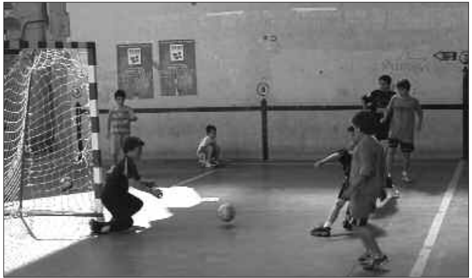
MAILA EZBERDINETAKO FINALAK SANTIXABELETAN JOKATUKO DIRA.

leek txapelketa honetan: benjaminak (1996-1997), alebinak (1994-1995), infantilak (1992-1993) eta kadeteak (1990-1991). Neskek, ordea, bi maila izango dituzte: benjaminak eta alebinak (1994-1995-1996-1997) eta infantilak eta kadeteak (1990-91-92-93). Hala ere, talde mixtoak egin daitezkeela azpimarratu nahi dute antolatzaileek.