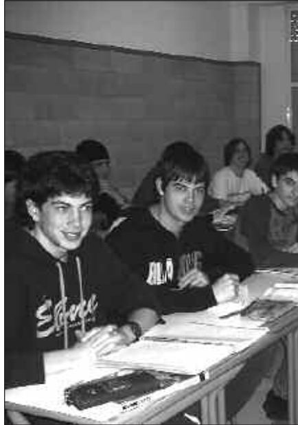
USURBILDAR ASKO PASA DIRA LASARTE-USURBILGO INSTITUTUTIK.

Horrez gain, ostiral honetan, maiatzaren 5ean, hainbat kultur eta kirol ekintzen bidez osatutako festa egingo da institutuko ikasleentzat. Eta azkenik, larunbatean, maiatzaren 6an, irakasleen eguna izango da. Lehenik, gonbidatuei ongietorria