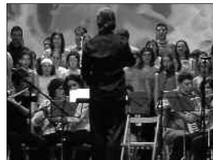
IAZ 20 URTE BETE ZITUEN ZUMARTE MUSIKA ESKOLAK.

Telefonoz ere deitzeko aukera dago: 943 37 15 94. E-mailez, honako helbidean: zumarte@euskalnet.net (haurraren izen-abizena eta jaioteguna, gurasoen izen-abizenak eta telefonoa zehaztu).