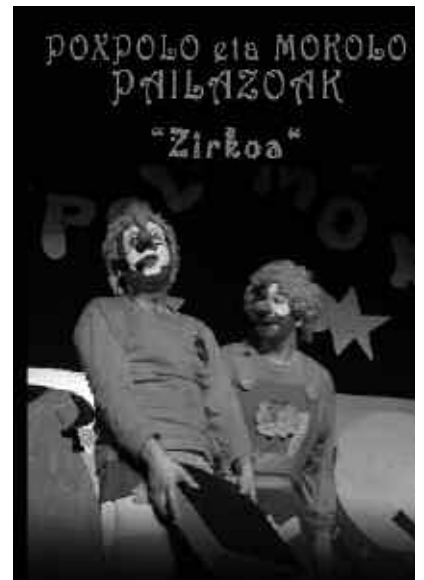
ZUBIETAN HASIKO DA PLIS, PLAS, TXALO TA JOLAS EGITARAUA.

“Zirkoa” ikuskizuna aurkeztuko dute Poxpolo eta Mokolo pailazoez Zubietan. Hori maiatzaren 13an izango da. Maiatzaren 27an, karaokearen txanda izango da. Santuenean egingo den ekitaldian, gaur egungo eta aspaldiko euskal kantuak abesteko aukera izango da. Baina hori maiatzaren 27an gertatuko da. Lehen hitzordua Zubietan dugu, maiatzaren 13an larunbata: Poxpolo eta Mokolo.