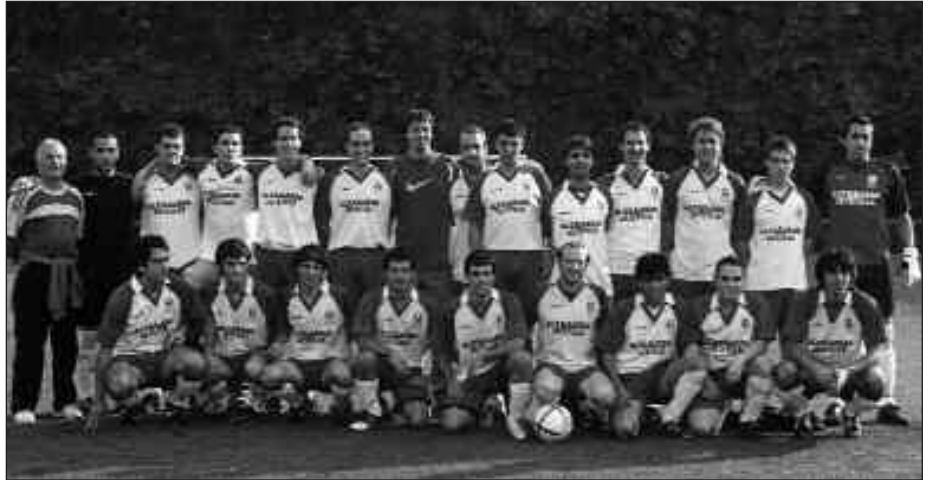
LARUNBATEAN AMAITUKO DU DENBORALDIA ERREJIONALEKO TALDEAK.