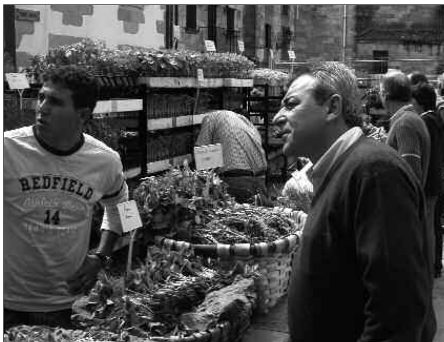
UDABERRIKO LOREAK ETA BARATZEKO LANDAREA EROSTEKO AUKERA IZANGO DA MAIATZAREN 14KO AZOKAN.