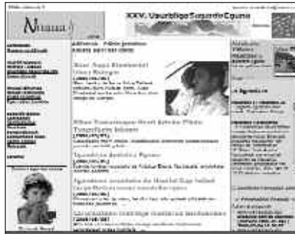
NOAUA.COM WEBGUNEAK 400 BISITA JASOTZEN DITU EGUNERO.

ra ere eskaintzen du noaua.com webguneak. Zorion-agurrak ere biltzen dira NOAUA!ren atarian.