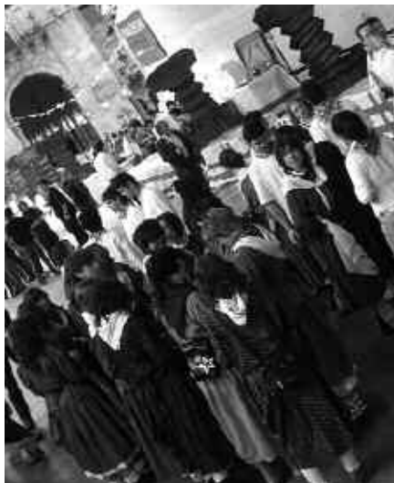
SAGARDO EGUNEAN ERE ZABALIK IZANGO DA ERAKUSKETA.

Maiatzaren 1etik 21era egongo da zabalik, eta honako ordutegia izango