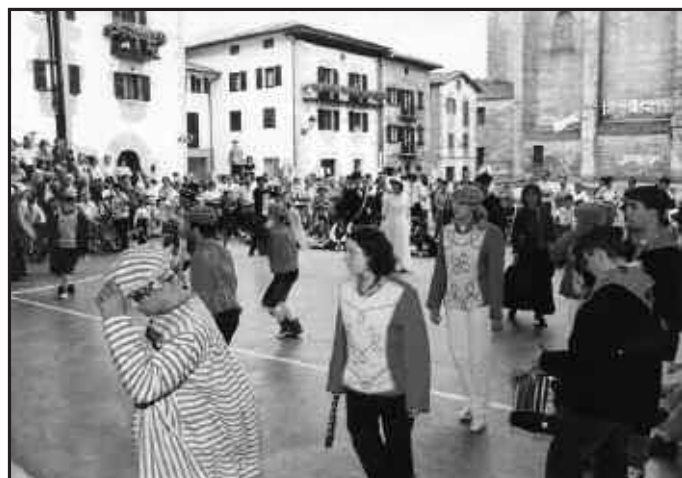
1996ko urria, Muskildiko Maskarada, Kaleberri Noaua!K.E.

1 992ko irailean Usurbilgo Udalak Euskal Herriaren Independentziaren aldeko mozioa onartu eta urte bereko azaroan Independentziaren Eguna ospatu zen. 1996an herriko hainbat taldek eta Udalak egun hori berreskuratzeko lanean hasi eta urriaren 14tik 20rako astean Independentziaren eguna ospatu zuten. Ospakizunen helburua lurraldetasun kontzeptua indartzea zen, izan ere oso gertu egon arren, Iparraldeaz ezer gutxi baitakigu: Lapurdi, Nafarroa Behera eta Zuberoa. Iparraldea hobeto ezagutzeko ahalegin bat egitea pentsatu zen eta hainbat ekitaldi antolatu ziren. Herriko taldeek, bakoitzak beren esparruan, Iparraldeari zegokion ekitaldi bana antolatu zuten. Horren adibide ondoko argazki hau duzue. Muskildiko Maskaradak bere ikuskizuna eskaini zuen herriko kaleetan zehar eta herritar asko gerturatu zen dantzak ikustera.