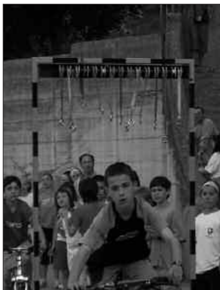
LH ETA DBHKO IKASLEAK GUSTURA IBILI ZIREN JOKOETAN.