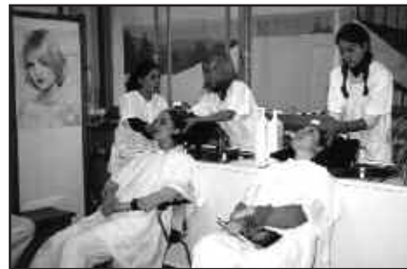
ILE-APAINKETA, EDERGINTZA, GOZOGINTZA ETA SUKALDARITZA IKASI DAITEKE USURBILEN.

Bigarren ikasturtea (2007/2008) urritik apirila bitartekoa, 550 orduko sakontze-ikastaroa da. Ondorengo arloak sakontzen dira bertan: tailerra, lanbide teknologia, oinarrizko heziketa, enprekin harremanak eta lan munduari begira burutzen diren ikastaroak (lana bilatzeko teknikak, eta abar). Osagarri modura, apiriletik uztaileara bitartean eskualde mailako lantegietan 450 orduko lan-praktikak burutzen