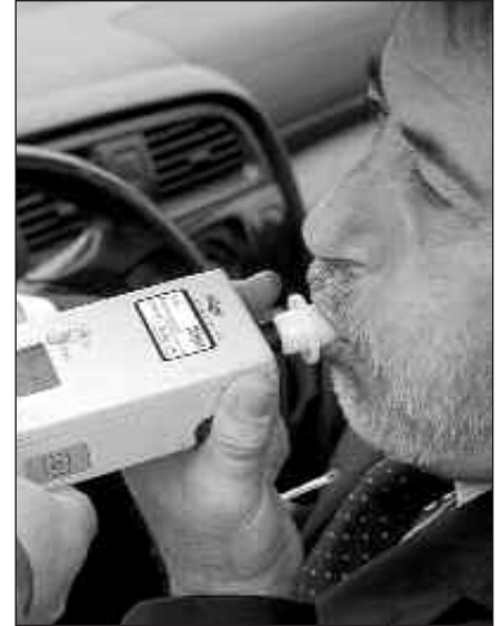
ALKOHOL TASA ALTUEKIN GIDATZE- AGATIK SEI PUNTU GALDU DAITEZKE.

-Ezarritako alkohol tasa baino handiagoarekin gidatzea. Putz egindako aire litroko 0,5etik gorako baloreak (profesionalak eta 2 urtetik beherako