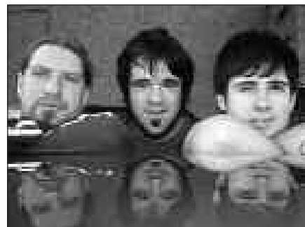
BERRI TXARRAK TALDEAREKIN BATERA, DESPERVICIO ETA THE SOLANOS TALDEAK ARITUKO DIRA.

Uztailaren 2an, Santixel Egunean, meza, lore eta salda banaketaren ondoren, erraldoi eta buruhandien konpartsa kalejiran irtengo da herrian zehar lehen aldiz. Txoznetan egingo den X. Mus Txapelketaren ondoren, BMX erakustaldia egongo da Artzabalen, hau ere estreinakoz. Bizikleta eta patinete gainean eginiko balentriak ikusi ahal izango dira bertan. Gauean, gazteentzako kontzertuak izango dira