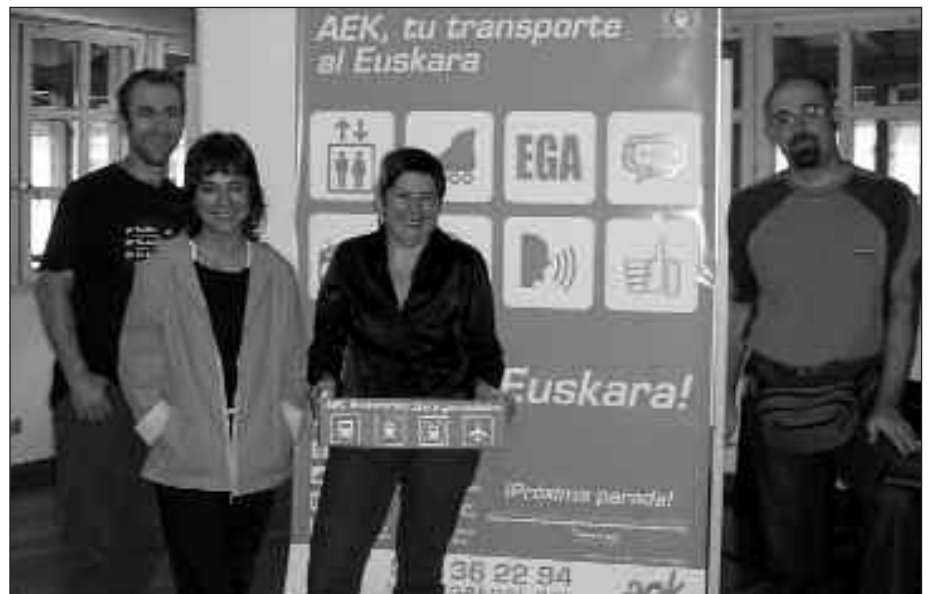
BARNETEGI-ESKAINZA ERE ZABALA DA.

Larunbat honetan AEK Eguna ospatuko da Larrabetzun. Usurbildik autobusa aterako da. Irteera goizeko