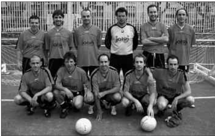
JALGIK MAILA GORENEAN JOKATUKO DU DATORREN DENBORALDIAN.

3. mailan dauden taldeei dagokionez, Balerdi Harategiak izan da 2. mailara igotzea lortu duen 12 taldeetako bat. "Irekiera torneoan" 2. mailan jokatu zuten, baina azken unean ezin izan zio-