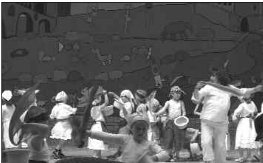
UMEEN JAIALDIAN ERDI AROA IZAN ZEN GAI NAGUSIA.