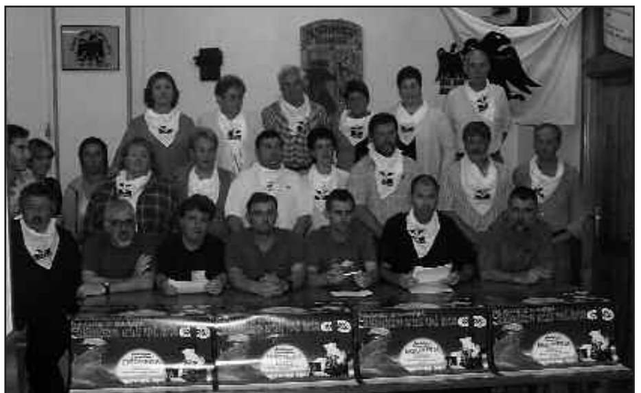
LASARTE-ORIAKO XIRIMIRI ELKARTEAN EGIN ZEN MENDI ERROMERIAREN AURKEZPENEA.

Eta hirugarren zutabea Usurbilgo frontoi atzetik aterako da, goizeko 10:00etan. Hiru zutabe horiek bat