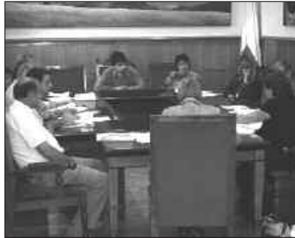
UDALBATZA PLENOA, ARTXIBOKO IRUDIA.

UHLren esanetan, "hitzez gure ordezkariak legez kanpo uztearekin ados ez daudela diote baina, ekin-tzez ondotoxoa baliatzen dute ezarri zaigun eskubide zibil eta politikoen