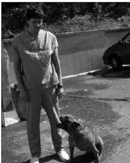
TXAKURRAK ADOPTATZEAN EZ DA EZER ORDAINDU BEHAR.

M. A. Adoptatu eta zaindu egin behar dira. Hemen ez daude gaizki zainduta, baina beti ere kaiola batean daude. Egin behar dena da hartu eta eraman.