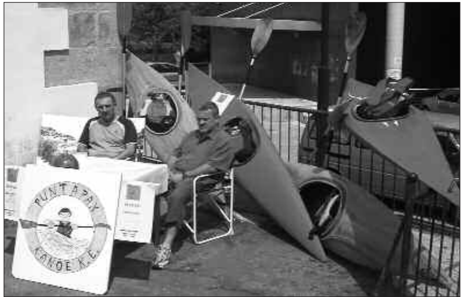
IRUDIAN, PUNTAPAX KANOE KIROL ELKARTEKO SORTZAILEAK.

Momentu honetan Aginagako eliza zaharrea gordetzen dute beraien materiala. Lauzpabost piragua dituzte, baina pixkanaka pixkanaka dirulaguntzekin eta abar elkartearen materiala handitzen joatea da helburua, gero herritarrei aukera desberdinak eskaini ahal izateko. "Piragua talde batzuekin harremanak ditugu, Atletico San Sebastianekin esaterako, eta beraiek behar ez duten materiala