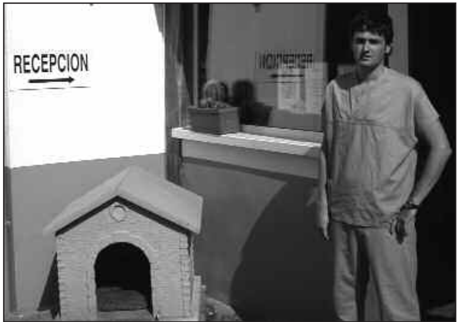
ATERPE IZATEAZ GAIN, KLINIKA ERE BADA ANIMALIEN BABESERAKO ELKARTEA.

M. A. Hirurehun bat katu, ehun eta berrogei zakur inguru, lllama bat, asto pare bat, ardiak, ahuntzak... denetik daukagu.