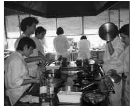
LANBIDE BAT IKASI ETA GERO, PRAKTIKAK EGITEKO AUKERA DAGO.

Lanbide bat ikasteaz gainera, lantegietan praktikak egiteko aukera zabala dute ikasleek. Horren ondorioz, lan-kontratu bat lortzeko erraztasun handiagoa ere bai.