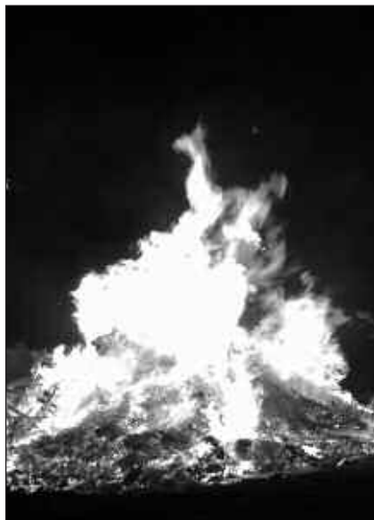
GAUEKO 22:00ETAN PIZTU OHI DA SAN JOAN SUA.

Lehengo astean esan genuen bezalaxe, San Joan eguneko soka-dantza eguerdiko 13:00ean egingo da aurtentzen. Bi oroigarri banatuko dituzte ekainaren 24an egingo den soka-dantzan. Kalezarren erroldatuta bizi