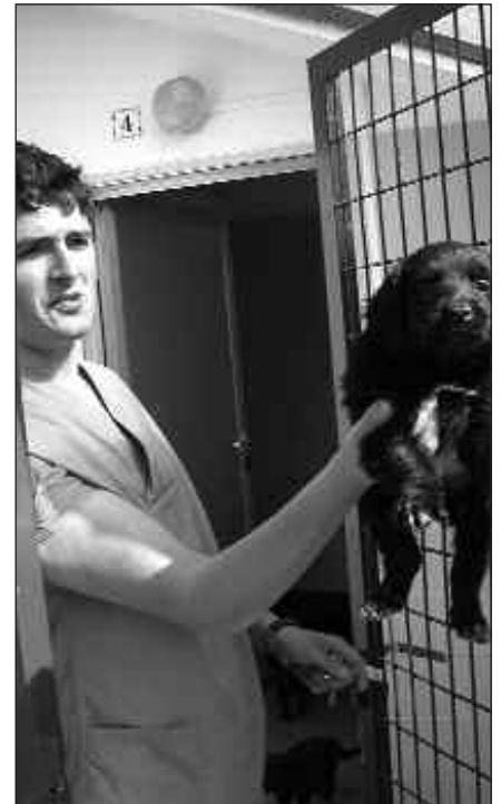
ANIMALIAK DOAN HAR DAITEZKE, BAINA BAKUNA ETA MIKROTXIPA ORDAINDU BEHAR DIRA.

Elkartearen klinika-babeslekura deitu edota bertara joan behar da, goizeko 10:00etatik 14:30era. Beren webgunean txakur eta katuen argaz-