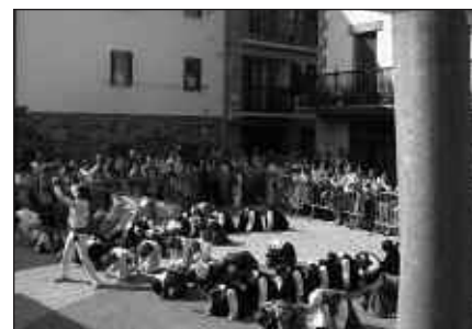
DANTZARIEK SAID BIKAINA ESKAINI ZUTEN KALEZARGO PLAZAN.