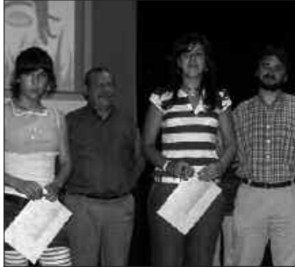
SUTEGIKO AUDITORIOAN EGIN ZEN SARI BANAKETA.