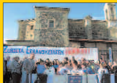
Larunbatean, errausketaren aurkako manifestazioa