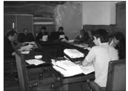
AZAROAREN 17KO PLENOA EZ-OHIKOA IZAN ZEN.

Z untz optikoa herriko txoko guztietara ailegatzeko Eusko Jaurlaritzari antenna bidezko zerbitzua eskaintzea eskatuko zaio. Aho batez onartu da azaroaren 17ko ez-ohiko udalbatzan. Urte berrirako ordenantza fiskalak ere onartu dira. Baita, Haraneko aldage-lak eta Artzabal berritzeko lanen esleipenak ere.