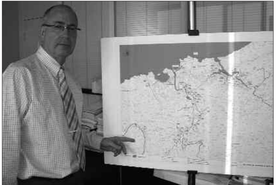
ORAINGOZ, AGINAGA SARE HORRETATIK KANPO GELDITUKO DA. ETORKIZUNEAN, GUNE HORRETAKO UR ZIKINAK BILDUKO DITUEN PROIEKTUA GAUZATZEKO ASMOA DAGO.

Datorren udaberriarako lanak lizitatze-ko lehiaketa aurkeztea espero du Añarbe