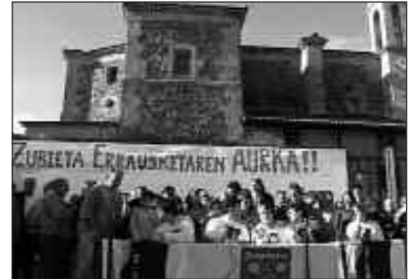
LEHENGO LARUNBATEAN AURKEZTU ZEN ZUBIETA LANTZEN HERRI-PLATAFORMA.

Donostia eta Usurbilgo udalek duten erantzunkizuna ere gogora ekarri zuten. Donostiari Zubieta bere hirigintza interesen mesedetan ez erabiltzeko eskatu zioten. Eta Usurbili “itsuarena ez egiteko eta herritarren interesak defendatzerako orduan arduraz jokatzeko. Zubieta bizirik nahi dugu, eta bizirik behar dugu», azaldu zuten Zubieta Lantzen-ekoek.