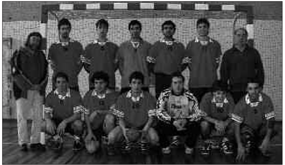
ESKUBALOI TALDEAK ONDO HASI DU DENBORALDIA.

Asteburuan, ordea, lehen garaipena eskuratzeko aukera izango dute. Oñatiko Verkol-Aloña taldearen aurka neurtuko