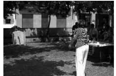
EKITALDI UGARI IZANGO DA ABENDUAREN 2AN, BESTEAK BESTE, TOKA TXAPELKETA.