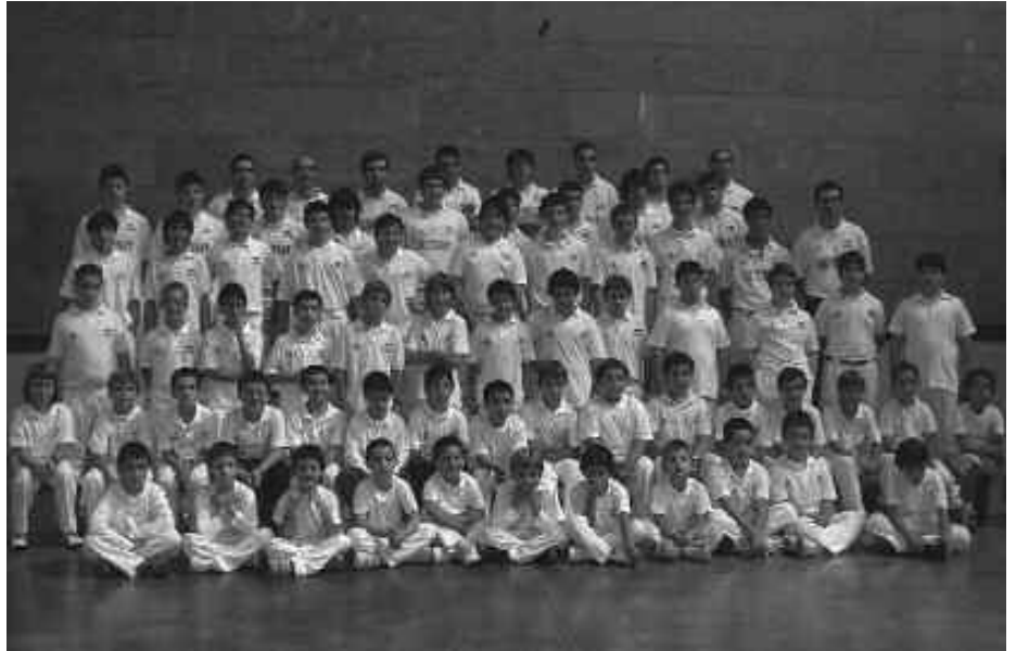
ANDATZPE-PEÑA PAGOLA TALDEA OSATZEN DUTEN GUZTIEK POZIK ETA INDARTSU EKIN DIOTE DENBORALDIARI. DUELA GUTXI ATERATAKO ARGAZKIAN DITUZUE HERRIKO PILOTARIAK.

Udaberri Txapelketa oparoa izan zen emaitza aldetik, pala motzean Udaberri