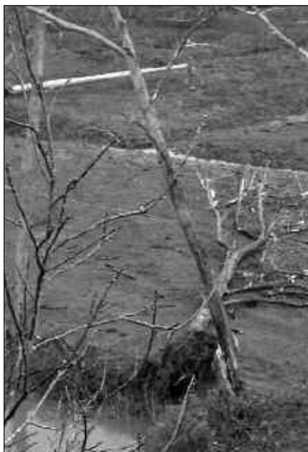
INTXORRETATIK ATERATAKO IRUDIA. GOIKALDEAN, IBERDROLAREN POSTEA LURREAN BOTATA IKUS DAITEKE.

Argirik gabe geratu ziren Zubietako hainbat etxeetan ere. San Estebanen ere argia joan zen. San Estebanen larriagoa izan zen, argirik gabe urik ez delako iristen (ura San Estebanera eramaten duen sistema elektrikoa baita). Usurbilgo frontoian, aldiz, ezker pareteko hainbat plaka erori ziren (kristalezkoak). Baina haizeak bestelako arazoak ere sortu zituen. Zuhaitz asko bota zituen eta herri bideetan hainbat arazo eragin zituen.