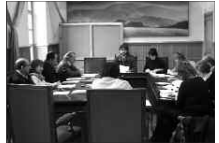
OTSAILAREN 2AN BEHIN BEHINGOZ ONARTU ZEN 2007KO UDAL AURREKONTUA.

Hiru erreklamazio horiek egiteaz aparte, udal kontu-hartzailea eta udal gobernu taldearen artean sortu den ikamiaz ere badu zeresanik UHLk. UHLren ustez, “ulergaitza egiten zaigu usurbildar guztiok (tartean udal horre-