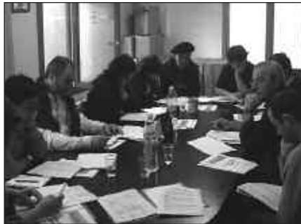
BAZKIDEEN BATZARRA GOIZEKO 10:30EAN HASIKO DA.

Zuzendaritza batzordea osatuko duen lan taldea ere zehaztuko da martxoaren 17ko batzarrean. Gogoan