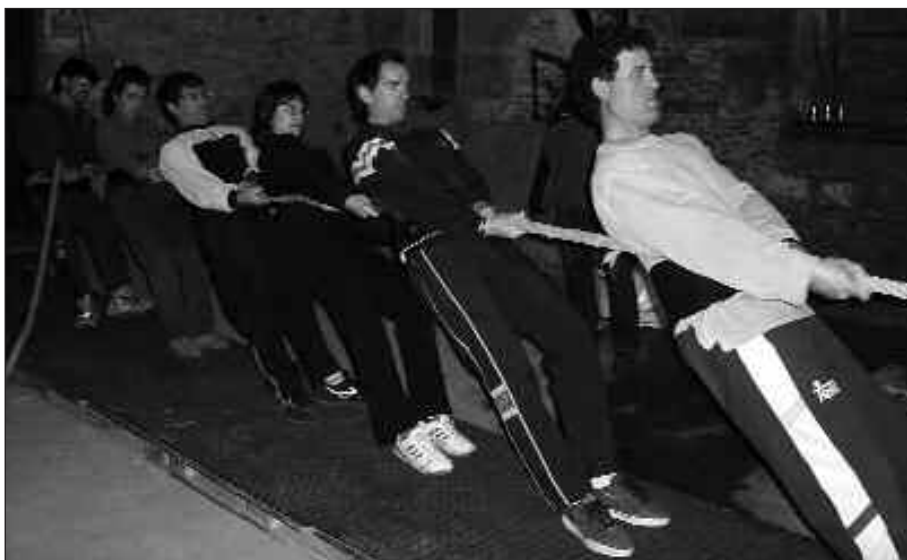
USURBILGO TALDEA DUELA ASTE BATZUK HASI ZEN SAGARRONDOTIK JAIALDIKO "DESAFIOA" PRESTATZEN.

Lau herrietako kirol taldeek zein baino zein erakustaldi hobek eskaintzen saiatuko dira. Baina azkenean, lehia sano horretan ere, gatza eta piperra jartzen duten emaitzak izango dira. Aipatu bezala, azken