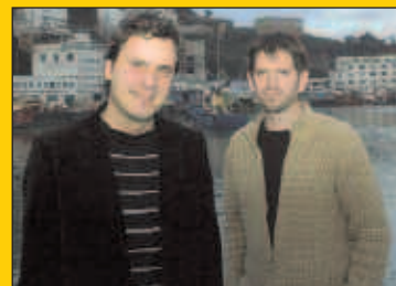
Larunbat honetan, "Portukoplak" Sutegin