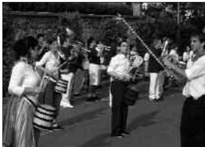
SANTIXABEL BEZPERAKO TXUPINAZOA EGUERDIAN PIZTU NAHI DA.

Egutegiari dagokionez, bi aukera zeuden: ekainaren 28tik uztailaren 3ra ala uztailaren 1etik 8ra. Hori zen erabaki beharrekoa. Bozketa bidez, aurtengo Santixabelak uztailaren 1ean hasi eta 8an amaituko direla erabaki zen.