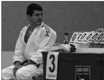
IGANDE HONETAN JOKATUKO DA IGOERA FASEA MADRILEN.

Lehen hiru postuetan gelditzen diren taldeak pasako dira 12 talde onenen multzora eta usurbildarrek 4 puntuko aldea dute 4. postuan kokatuta dagoen taldearekiko. Beraz, igandean jokoan egongo diren 6 puntuak lortuz gero, Ohorezko Mailatik oso hurbil geldituko dira. Hirugarren jardunaldi eta gero dagoeneko igoera lortzea ere posible da,