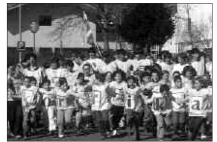
MARTXOAREN 24AN IRITSIKO DA KORRIKA GURE ARTERA.

Korrika 15 ailegatu bezperan, hilaren 23an, Udarregi ikastolakoak lasterka aterako dira. Korrika Txikia