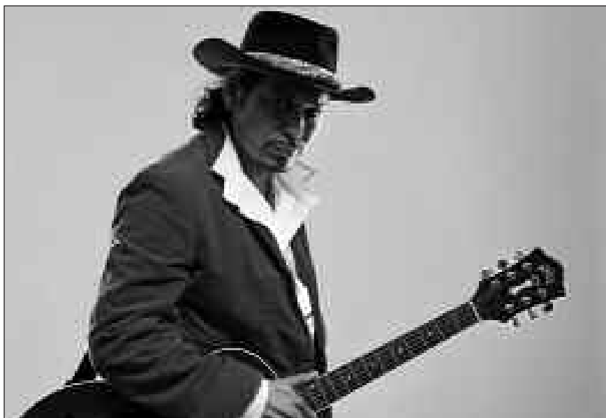
RAIMUNDO AMADOR LARUNBATEAN ARITUKO DA SAGARRONDOTIK JAIALDIAN.

Sagardoaren Kultura Sustatzeko Elkartearen helburua, sagardoaren eremua ezagutaraztea da, bertako kultur adierazpide ezberdinak baliatuta. Aurtengoan ere ez zaizkio osagai horiek faltako.