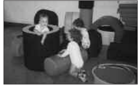
KONTUAK KONTU, MARTXAN DAGO HAUR ESKOLAKO MATRIKULAZIO KANPAINA.