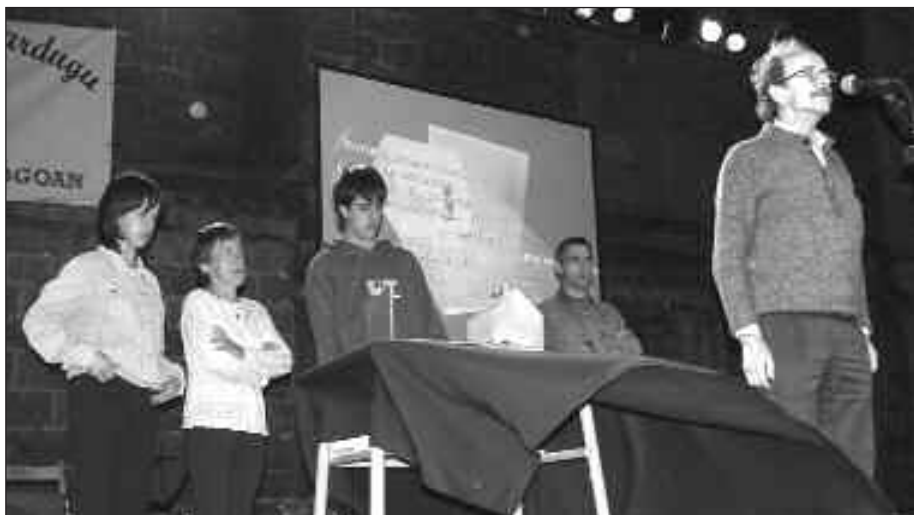
MAIATZEKO LEHEN HAMABOSTALDIAN OSPATUKO DIRA ELKARTEKO KIDEEK ANTOLATU DITUZTEN EMANALDIAK.

Durangoko azoka izaten da haien erreferentzia. “Hura pasa arte zain egoten gara diska erakargarrienak ikusteko”, adierazi du Furundarenak.