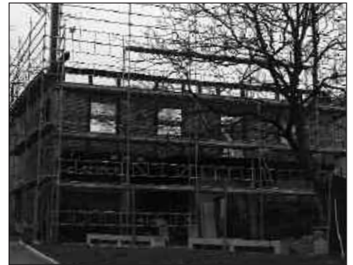
Artzabal, aste honetan.