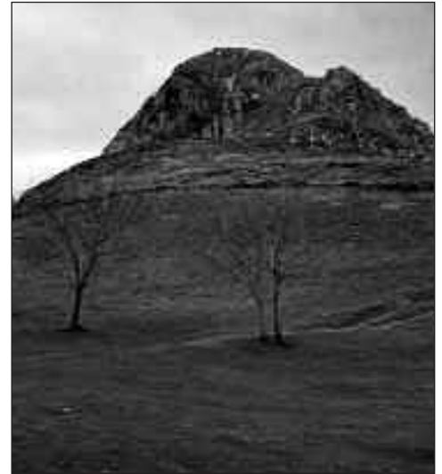
ERNIOKOA IZANGO DA IGOKO DUTEN LEHEN MENDIA.

Badira 60 urte Ernioko gurutzeta eraiki zutela, eta geografikoki zortzi herri elkartzeko dituzte Asteasu, Alkiza, Larraul, Hernalde, Albiztur, Bidegoian, Aia eta Errezil.