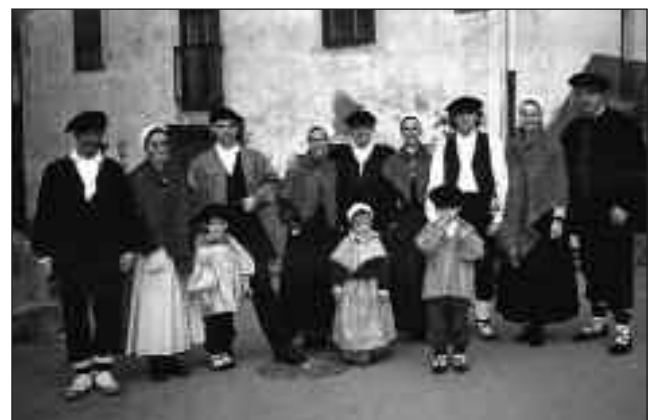
EUSKAL JANTZIEI BURUZ JAKINMINA DUENAK, SUTEGIKO SOLASALDIAN AUKERA APARTA IZANGO DU.