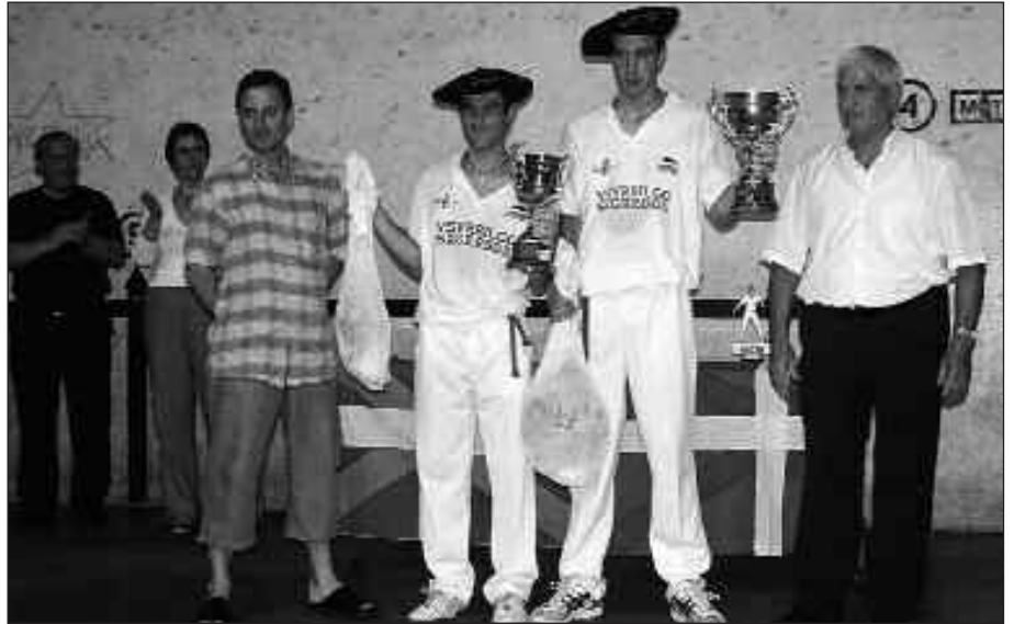
IRUDIAN, IAZKO TXAPELKETAKO IRABAZLEAK.

Aipatutako bi mailetan Euskal herri osoko pilotariak ikusteko aukera izango