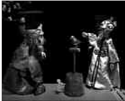
TXINAKO ENPERADORE BATEN GORABEHERAK KONTATUKO DIZKIGUTE.

Sarrerak, aldeztu aurretik, 2 eurotan izango dira salgai Oiardo kiroldegian. Egunean bertan eta takilan, 3 euro.