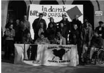
APIRILAREN 20AN AMAITUKO DA SINADURA EMATEKO EPEA.

elkarrekin. Usurbilen, astelehenean hasi zen sinadura emateko epea eta hilaren 20an bukatuko da.