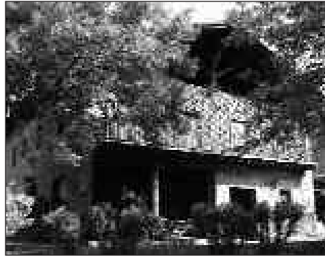
Artzabal baserria, 2003 urtean.

Okerrik ez bada, 2008ko apirilean amaituko dira zahar etxean bilakatzeko egiten ari diren lanak.