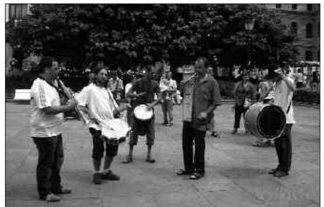
KALEAK ALAITU ETA GAUEKO KONTZERTU AURREKO ORDUAK ERE GIROTUKO DITUZTE.

Maiatzak 5, larunbata. Kalejiran, 18:00-20:30.