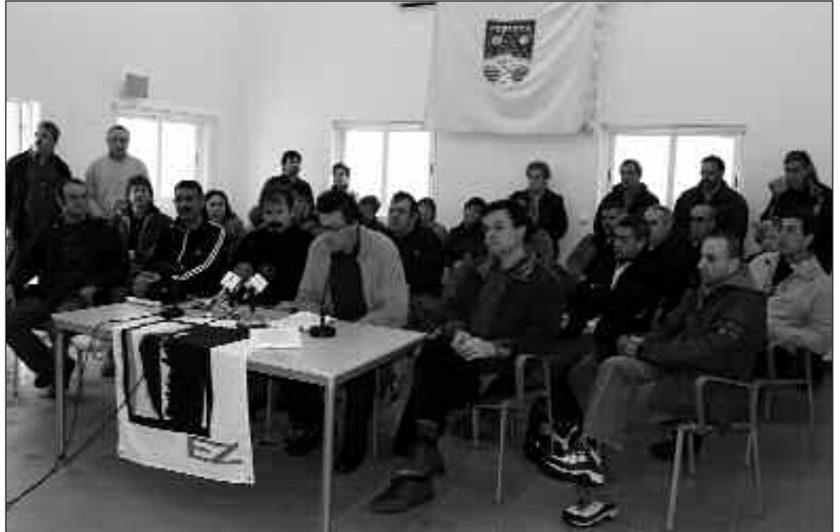
USURBIL, ZUBIETA ETA LASARTE-ORIAKO HERRITAR TALDE BATEK MARTXOAREN 29AN ESKAINI ZUEN PRENTSAURREKOKO IRUDIA.

Haien esanetan, aipatutako erakundeek ez dute aginpiderik hondakinak tratatzeko sistema gisa, errausketa bultzatu ezta horren kokapena erabakitzeko ere. Kasu horretan, Jaurlaritzari dagokiola sistemak homogeneizatu eta azpiegituren kokapen-irizpideak definitzeko