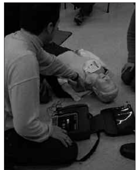
TEORIA ETA PRAKTIKA LANDUKO DIRA DYAK ESKAINIKO DUEN IKASTAROAN.

Matrikularen prezioa, ikastarorako txostena barne dela, 75 eurokoa da. Ikastaroaren kalitatea bermatu arren, ikasle kopurua mugatua izango da. Izena emateko edo informazio gehiago jasotzeko, 943 46 46 22 telefono zenbakia duzue eskura.