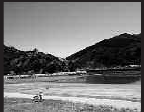
ORION HASI ETA USURBIL EN AMAITUKO DA IGANDE HONETAKO IBILALDIA.

honakoan, itsas-bazterretik zehar. Araba eta Agoitz aldeko jendeak hartuko du parte baina edonork har dezake parte, deialdia irekia dela alegia. Mendi martxa eta gero, sagardotegian egingo da bazkaria. Mendi martxa hau 9:30ean aterako da frontoi atzetik. Izen emateko, 665 746 158 telefono zenbakira deitu.