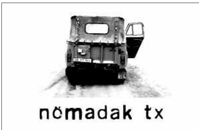
FILMAREN PASE BIKOITZA IZANGO DA. GAUEKOAN, TXALAPARTARIEN EMANALDI ETA SOLASALDIAREKIN.