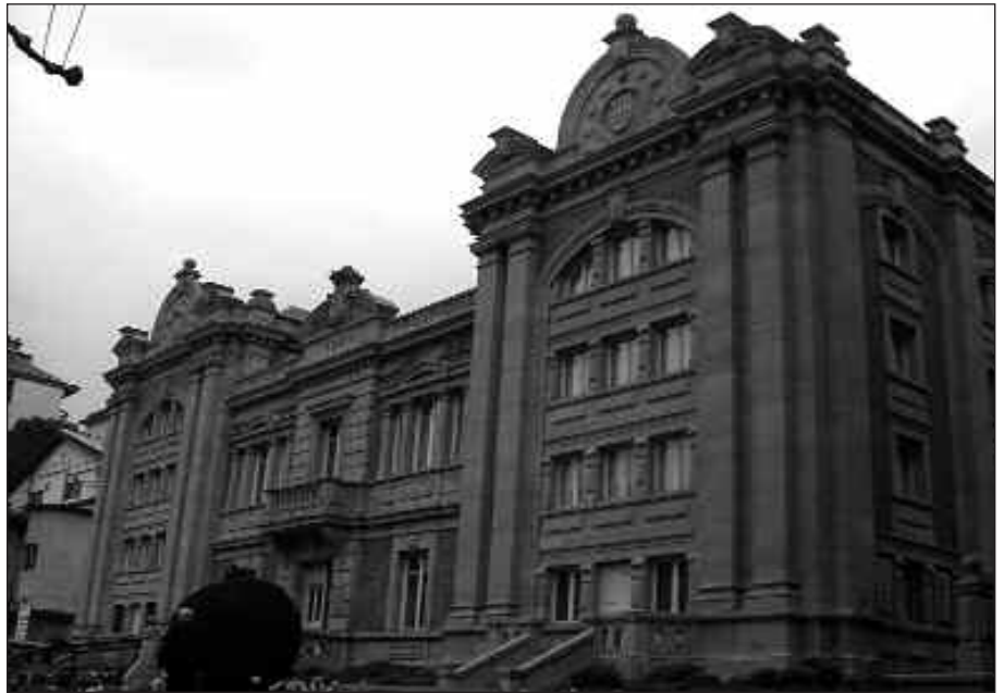
USURBILGO ARGAZKI ZAHARRAK IKUSTEKO AUKERA IZAN GENUEN TOLOSAKO ARTXIBORA EGIN GENUEN BISITAN.

Bertan eskuratutako informazioa bezain interesgarria iruditu zitzaizkigun paretean zintzilik zeuden erliebedun irudiak. Irudi hauek Gipuzkoako armarrak irudikatzen zuten, errege eta soldaduen irudiekin apaindurik. Gela honetatik atera eta eskaileretan gora, dokumentuak gordeta dauden tokira igo ginen (depositora). Esan beharra dago agiriak ondo mantentzen direla, temperatura egoki batean, txukun-