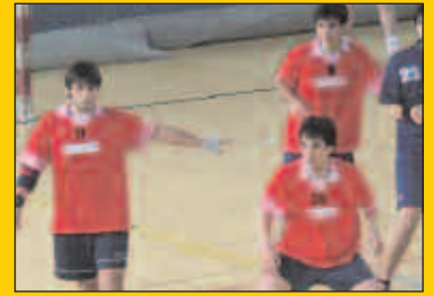
Eskubaloi taldea, igoera fasean