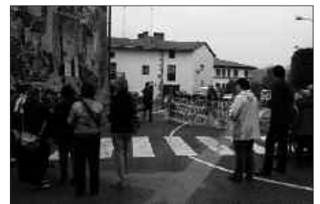
LARUNBATEAN ELKARRETARATZEA EGIN ZEN FRONTOI ATZEAN.

Usurbilgo Ezker Abertzaleak ostegun honetan egingo den herri batzarrean parte hartzeko deia luzatu du. Gaia: hauteskundeak. Arratsaldeko