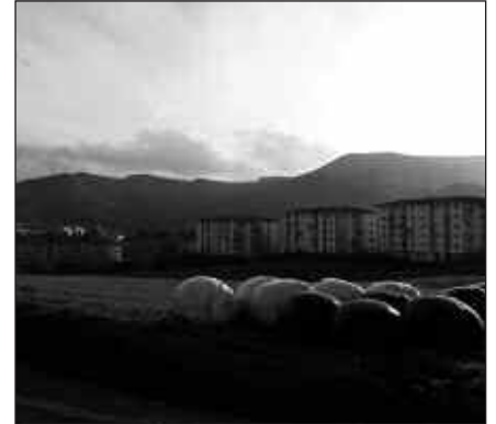
OLARRIONDOKO BELAZE HONETAN BABES OFIZIALEKO 120 ETXEBIZITZA ERAIKIKO DIRA.