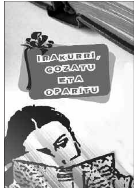
KANPAINA HONI ESKER, LIBURUAK MERKEAGO EROSTEO AUKERA IZANGO DUGU.

go lortuko du liburua, baina ez du berak eramango liburua. Oparia jasoko duen lagunaren helbidea utziko du liburu dendan eta, nahi izanez gero, postala edo oharra idatziko dio.