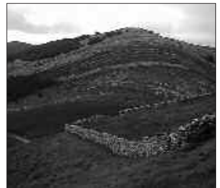
ERNIO ETA ZELATUNEKO PARAJEAK BISITATUKO DITUZTE IGBANDEKO MENDI IBILALDIAN.

Andatza K.K.E.-tik ohartarazi dutenez, parte hartzaileek izan ditzaketan istripu edo kalteez ez da kargu egiten. Eguraldi txarra eginez gero, edota beste arrazoiren bat tarteko antolatzaileek irteera bertan behera uztea erabaki dezakete.