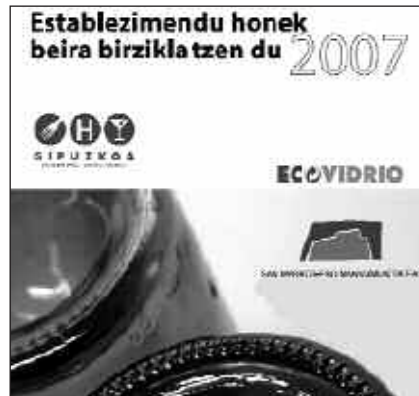
SAN MARKOS MANKOMUNITATEAK ERANSKAILU HAUEK BANATU DITU.

blezimenduei eta jada parte hartzen ari direnei eranskailu bereizgarri bana emango zaie establezimendu "beira-birziklatzaile" modura.