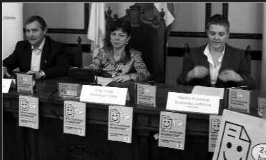
BURUNTZALDEAKO ORDEZKARIEK ERRENTA AITORTPENAREN ETA GESTORIEN KANPAINAK AURKEZTU ZITUZTEN LEHENGO ASTEARTEAN.

Gainera, herritarrek etxeetan esku-orri bana jasoko dute. Kanpainaren berri emateaz gain, diru-kontuetan askotan erabiltzen diren kontzeptuak euskaratuta ageri dira. Horrekin batera, Buruntzaldeko gestori eta euskara zerbitzuen helbideak ageri dira.