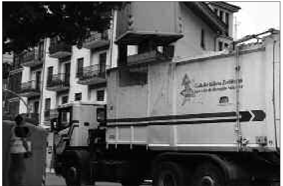
ESKOZIA BERRIKO HERRITARREK BULTZATUTAKO PLAN ALTERNATIBOARI ESKER, ATEZ ATEKO BILKETA EGITEN HASI ETA 90 BIRZIKLAPEN ZENTRO ERATU ZIREN.

Esperientziaren emaitzak oso onuragarriak dira: 40.000 inguru lagunek