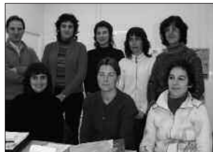
APIRILAREN 20AN AMAITUKO DA IZENA EMATEKO EPEA.

Oraindik izena eman ez dutenek aukera daukate oraindik, aldeztu aurretik haurraren irakasleari jakinaraziz.