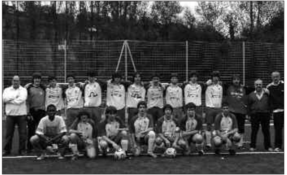
JUBENILEK IGANDEAN JOKATUKO DUTE HARANEN, EGUERDIKO 12:00ETAN.

Denboraldi honetan jardunaldi askotan jaitziera postuetan egon badira ere, 2. itzuli bikaina egiten ari da herriko taldea. Lehenengo itzulian 10 puntu besterik ez zituzten lortu, baina bigarrenean 22 batu dituzte eta oraindik puntu gehiago lortzeko aukera dute. Txapelketa amaitzeko 4 partida besterik ez dira falta eta larunbatean garaipena lortzen badute maila mantentzeko aurrerapauso handi bat emango dute.