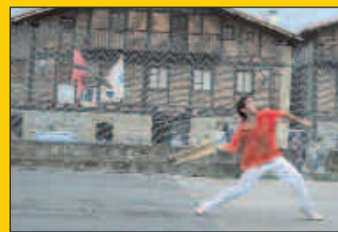
Datorren astean hasiko dira Santio jaiak Zubietan