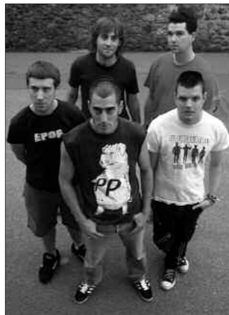
HERRIKO MUSIKA TALDEAK ARITUKO DIRA ATXEGALDEN. IRUDIAN, EPOK TALDEKOAK.