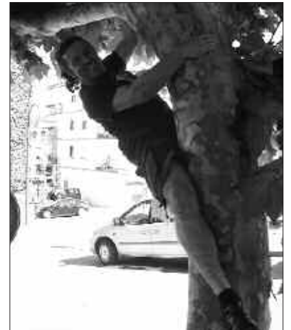
TELLOK ESKU-ESKURA IZAN ZUEN DUELA GUTXI ESTREINATUTAKO FILM BATEAN PARTE HARTZEKO AUKERA.

Aktoreak edozertarako prest egon behar du. Gero, perfila hartzen dute kontuan. Pertsonaia gaiztoaren papera gustura egingo nuke. Gero, aurpegia, antzezteko modua... kontuan hartu behar. Gorputz espresioa eskatzen duten lanetan ez dut erraztasun handiagoa. Iaz, Peter Roberts mimoarekin probak egiten aritu nintzen eta utzi egin nuen. Sufritu egiten da.