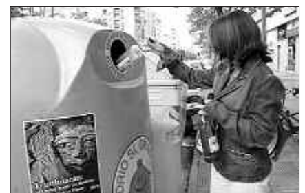
ATEZ ATE SOILIK ZABOR ORGANIKOA JASOKO LITZATEKE. GAINONTZETAKO, ORAIN ARTE BEZALA BIRZIKLATZEN JARRAITUKO GENUKE.

Aurrekontuetan diru-partida bat aurrekusi da horretarako. Lau finantziario iturri lotu nahi dira. Eusko Jaurilaritza, Gipuzkoako Foru Aldundia, San Markosko mankomunitatea eta Usurbilgo udala. Gipuzkoako Foru Aldundia Usurbilen konpostatze planta bat jartzeko prest dago.