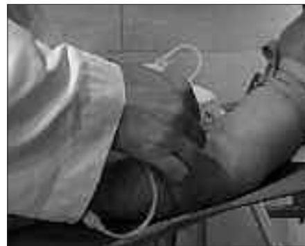
LARUNBATEAN, HILAK 8, OSPATUKO DA USURBILGO ODOL EMAILEEN EGUNA.

Emaile edota babesle eta laguntzaile direnak eskertu nahi dituzte, eta hala egin ohi dute urtero. Urrian, bailarako emaileak bildu eta odola hainbat alditan eman izan dutenak omentzen dituzte. Aurten, 25 eta 40 alditan odola eman duten zazpi herritarren borondatea eskertu eta oroigarri bana eman zieten pasa den urriaren 21ean