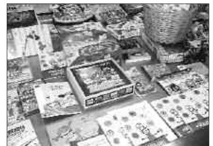
FRONTOIAN EGINGO DA JOSTAILU AZOKA.

Jostailuek osorik egon behar dute. Bilketa egunetan emandakoa musu-truk jasoko da, nahiz eta trukean txartel bat har daitekeen. Horrekin, azoka egunean emandako jostailua