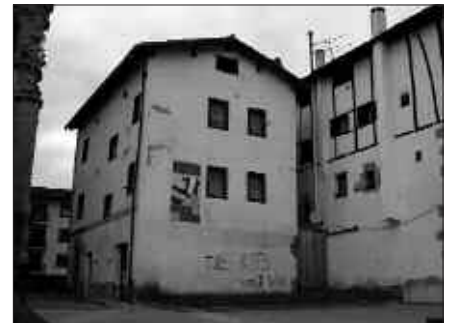
KULTUR TALDEEKIN ADOSTUKO LITZATEKE POTXOENENKO PROIEKTUA.

Horri ere irtenbide bat eman nahi zaio 2008ko udal aurrekontuen bidez.