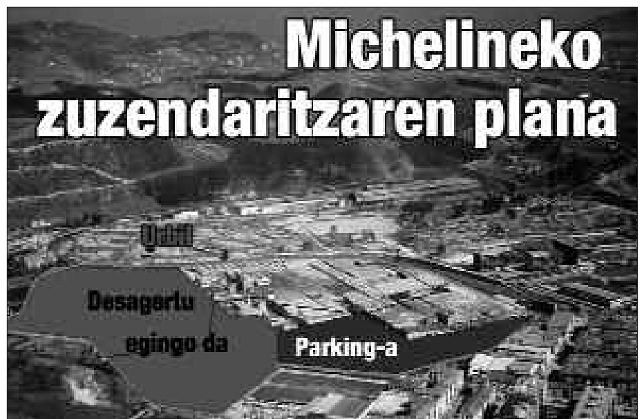
MICHELINEK EGUN DUEN ETA ETORKIZUNEAN IZAN DEZAKEEN ITXURAREN ARTEKO ALDEA.