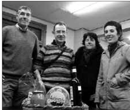
HERRITAR HAUEK BIDERATU DUTE ZUBEROAKO IKASTOLEN ALDEKO KANPAINA.

tabernetara jo besterik ez dago. Txiribogan edo Txiristran norbere izen abizenak eta telefono zenbaki bat utzita, kanpaina parte hartu eta otarra eskura daiteke. Izena emateko epea igande honetan amaituko da.