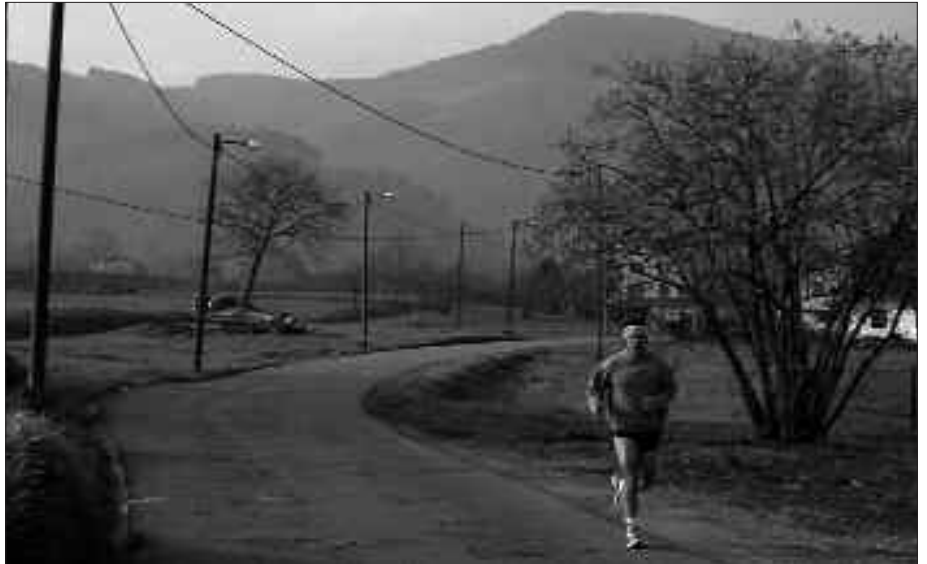
ZUBIETAKO HERRI BATZARREKO AURREKONTUETATIK BIDERATUKO LITZATEKE ZUBIETAKO OINEZ-BIDEAK GARATZEKO DIRU-PARTIDA.

Eguneko Zentroa egokitu nahi da. Zerbitzu ona eskaintzen du orain baina, aurrera begira, zentroaren zabaltzea ere aurreikusitako da. Are gehiago, 2008ko udal aurrekontuetan diru partida bat ere izendatua izan da horretarako.