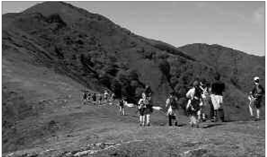
ABENDUAREN 16AN, HAURRENTZAKO MENDI IRTEERA ANTOLATU DU ANDATZA MENDI ELKARTEAK.

Mendiko aseguru egiteko bi aukera eskaintzen ditu Andatza Mendi Elkarteak: asteartero 20:30etan, udal-tertxe ondoan, DYAreko egoitza azpira hurbilduta. Bestela, Mendi Astean atera daiteke, iluntzeko 19:00etik aurrera, Sutegin. Informazio gehiago, elkartearen e-postara idatzita eskura daiteke: andatzake@usurbil.com