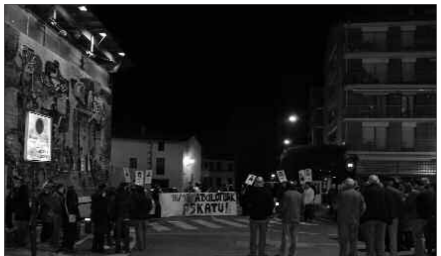
ETXERAT- EK EGINDAKO ELKARRETARATZEA ETA GERO HASI ZEN 18/98 AUZIKO ATXILOTUEN ALDEKO MANIFESTAZIOA, PASA DEN OSTIRALEAN.

Mobilizazio gehiago iragarri dira. Abenduaren 13an ordubeteko lanuztera deitu dituzte 18/98ko auzipetuek euskal herritar guztiak. "Herri gisa erantzuteko" antolatu dute lanuztea, eguerdiko 12:00etatik 13:00etara.