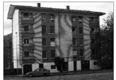
MAISU ETXEA LARRIALDIETARAKO ERABILTZEN DA GAUR EGUN.

Sekañan bada Udalari dagozkion 20 etxebizitzarako lur-zatia. Olarriondon ere 23 etxebizitza sozial sortuko dira. Bi