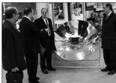
PANAMAKOAK, ALDIZ, AZARDAREN 27AN PASA ZIREN LANBIDE ESKOLATIK.