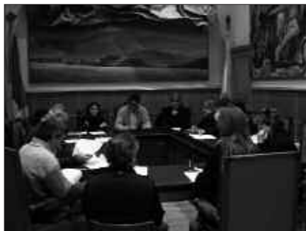
IAZKO KONTU OROKORRA ONARTU ZEN. BAITA URTE BERRIRAKO ORDENANTZA FISKALAK ERE.