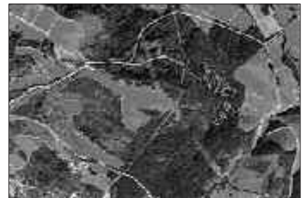
NEKAZAL BIDEAK HOBETZEKO DIRU PARTIDA JASO NAHI DA.

Nekazaritzan, nekazal bideak hobetzeko diru-partida aurreikusitako da. Aginaga inguruan batez ere. Izpitzakoa, esate baterako. Porlanezkoa da baina bereziki bada egoera kaxkarrean dagoen bihurturik. Urkamendi inguruan bada egoera kaxkarrean dagoen biderik ere.