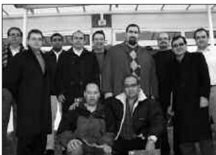
MEXIKOKO ORDEZKARIAK AZARDAREN 26AN IZAN ZIREN BISITAN.

Energi Berriztagarrien Eraikina ezagutzea izan zen. Esparru honetan Lanbide Eskolaren oihartzuna urrun iristen ari da eta hori dela eta ekipamendu eta heziketa arloko akordioak adostu ahal izan dira. Mexiko zein Panaman, Usurbilgo Lanbide Eskola eredu den seinale.