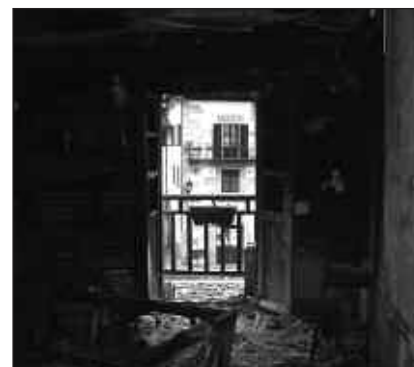
EGOERA HONETAN GERATU ZEN SUA PIZTU ZEN ETXEBIZITZAREN EGONGELA.

Herrizaingo Sailak aditzera eman zuenez, etxe barruan ke handia zegoela eta, bikotea, euren semea eta zakurra balkoira aterazi ziren. Goizeko